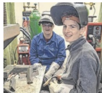
Intensive Praxisarbeit