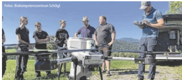
Feldversuch mit einer Agrardrohne für den Zwischenfruchtanbau beim Mais

keiten digitaler Anwendungen. Mithilfe einer Agrardrohne wurde beispielsweise eine Zwischenfruchtmischung direkt über den Schlägler Roggen auf den Ver-