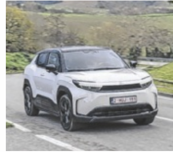
Der Toyota Urban Cruiser