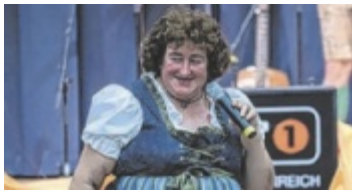
Gstanzl Singa in Rohrbach