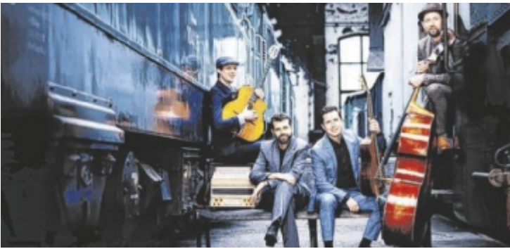
Im Musik-Kulturclub Lembach gibt's was auf die Ohren.