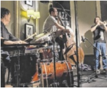
Drei außergewöhnliche Musiker kommen nach Ulrichsberg.