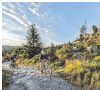
Radeln am Dreisessel im Bayerischen Wald

„Bierkultur auf zwei Rädern“ nennt sich das Interreg-Projekt, für das die Landkreise Freyung-Grafenau und Passau gemeinsam mit dem Tourismusverband Mühlviertel elf Radtouren mit einer Gesamtlänge von 915 Kilometern und 15.760 Höhenmetern entwickelt haben. Drei Mehrtagestouren sowie acht eintägige Rundtouren führen durch den Bayerischen Wald, das Rottal, das Donautal und auch durch den angrenzenden