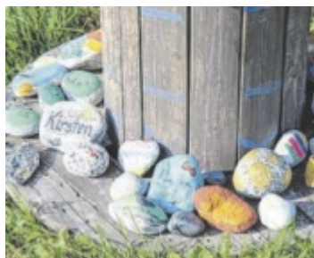
An manchen Orten häufen sich die Stoaroas-Steine.

Der Trend „Stoaroas“ startete vor einigen Jahren: Liebevoll bemalte Steine werden an unterschiedlichen Orten ausgelegt, um von anderen Menschen gefunden und anschließend wieder an einem neuen Platz deponiert zu werden. Auf der Vorderseite der Steine befinden sich oft kleine Kunstwerke. Auf der Rückseite steht meist „Stoaroas“ sowie die Initialen der jeweiligen Künstler, zum Beispiel die Postleitzahl in Kombination mit den Anfangsbuchstaben von Vor- und Nachname. Die Künstler freuen sich besonders, wenn gefundene