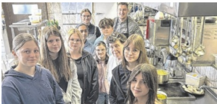
Die Tourismusgruppe der PTS Neufelden besuchte den Keplingerwirt.