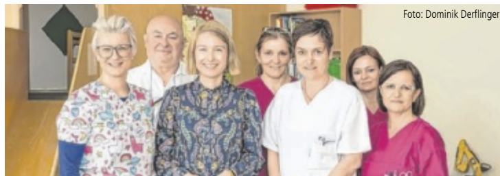
LH-Stv. und Gesundheitslandesrätin Christine Haberlander auf der Kinderstation