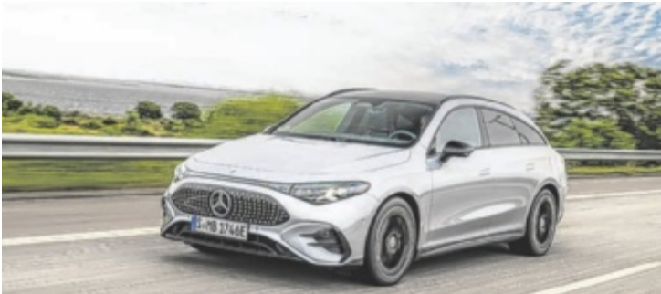
Elegant und alltagstauglich: Mercedes-Benz CLA Shooting Brake

spirierten Kühlergrill sein preisgekröntes Design. Neue Metallic-Lackierungen wie Rosso Brera sowie 20-Zoll-Felgen erweitern die Optik. Im modernisierten Innenraum finden sich hochwertige Materialien wie Alcantara, belüftete Ledersitze und eine neu gestaltete Mittelkonsole mit Drehschalter. Technisch überzeugen unter anderem das 10,25-Zoll-Touchsystem und teilautonomes Fahren. Der Mild-Hybrid leistet nun 129 kW (175 PS), während der Plug-in-Hybrid Q4 mit 199 kW (270 PS) und Allradantrieb die Spitze bildet. ■ Anzeige