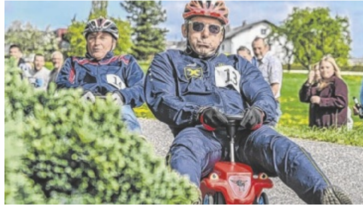
Ein actionreiches Rennen auf Bobby-Cars ist garantiert.

Am Freitag, 24. April startet das Burning Revolution mit der zweiten Runde der 1.000 Euro-Musi-Challenge. Fünf Acts – ob einzeln oder als Gruppe von maximal 15 Personen – haben die Chance, ihren Auftritt zu einem unvergesslichen Erlebnis zu machen und 1.000 Euro in bar zu gewinnen. Die Musiker treten in zufälliger Reihenfolge auf, der Applaus entscheidet über den Sieg. Je größer also der Fanclub, umso größer die Chancen auf den Sieg. Anmeldungen sind bis 5. April möglich. Tags darauf, am 25. April, geht es beim Bobby-Car-Rennen rasant