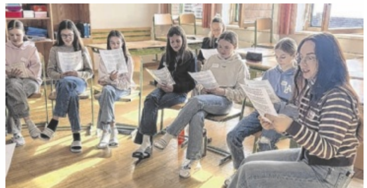
Textarbeit mit den tschechischen Studentinnen