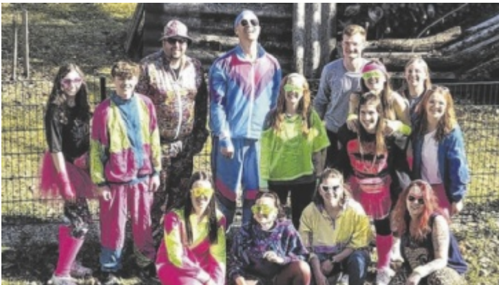
Wer mag, kann gern im 80er-Outfit kommen.

Niederkappel Anmeldung für die Wettbewerbe unter: www.burningrevolution.at