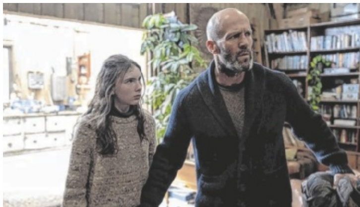
Jason Statham muss sich den Dämonen seiner Vergangenheit stellen.