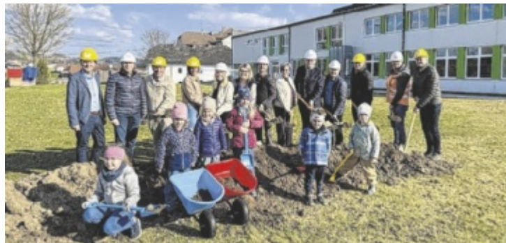
Große Freude herrschte bei den Kindern von St. Peter und der lokalen Prominenz über den Spatenstich für die Kinderbetreuung.

„Dieses Projekt ist ein gutes Beispiel, welch hohen Stellenwert Kinder- und Familienfreundlichkeit in der Gemeinde hat“, betonte der Bürgermeister. „Bildung ist der Schlüssel für die Zukunft und diese Erweiterung