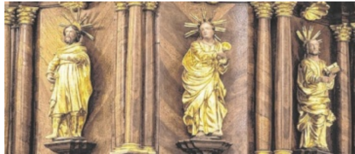
Bei einer Führung am 1. April kann man die Stadtpfarrkirche Rohrbach jenseits des Alltäglichen entdecken.