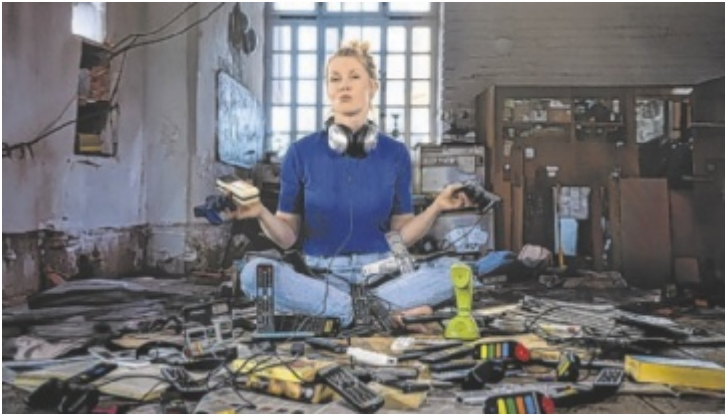
Die bayrische Kabarettistin Christine Eixenberger stellt sich den Herausforderungen der fortgeschrittenen Paarwerdung.