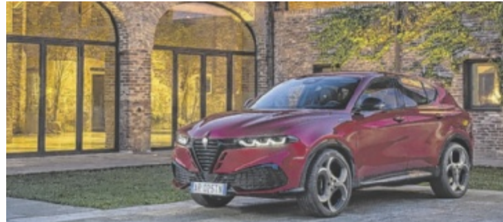
Alfa Romeo Tonale: geschärftes Premium-SUV aus Italien