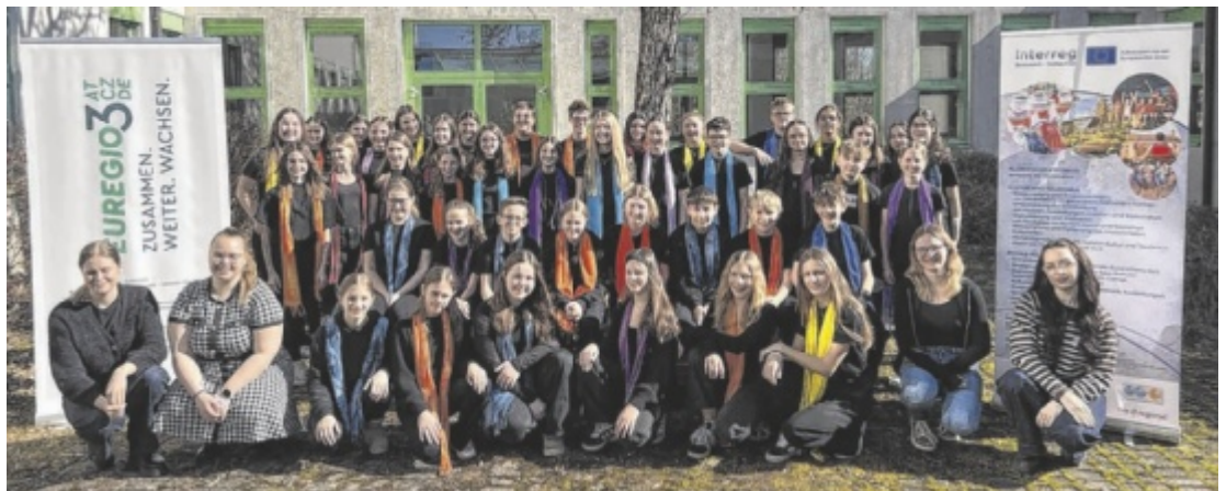
Ein Chorprojekt verbindet die MMS Neufelden und die Universität Budweis.