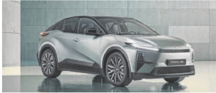
Der Toyota C-HR+ mit einer Reichweite von bis zu 609 Kilometern

ROHRBACH-BERG. Am Sonntag, 26. April, findet am Rohrbacher Stadtplatz von 9 bis 17 Uhr der traditionelle Autofrühling statt. Die Händler der Region präsentieren dabei die gesamte Bandbreite: vom neuesten Top-Modell bis zum Preis-Leistungs-Sieger, vom Verbrenner bis zum E-Auto. Tips stellt im Vorfeld die neuesten Modelle der vertretenen Marken vor.