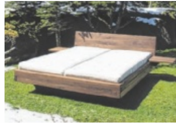
Lagerbetten sind in der Naturfabrik jetzt 15 Prozent günstiger.

Lagerbetten werden minus 15 Prozent reduziert verkauft und man bekommt zwei Nachtblagen im Wert von 460 Euro kostenlos dazu. Über 50 Vollholztische mit Stühlen sowie Bänken, Vitrinen und Kommoden sind außerdem zwischen 20 und 40 Prozent im Preis reduziert. Auch die zum Probeliegen vorhandenen Naturmatratzen der Ausstellung sind zwanzig Prozent vergünstigt erhältlich. Die Liste der Abverkaufs-Waren lässt sich noch lange weiterführen: Decken, Teppiche, Vorhänge, Frottierwaren, Yoga-hocker, Saunatücher, Sitzauf-