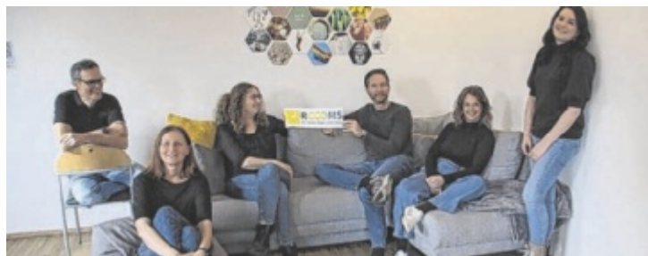
Das Mikado-Beratungsteam gibt den Sorgen von jungen Leuten Raum.

Viele Jugendliche und junge Erwachsene empfinden den Übergang ins Erwachsenenalter als besonders herausfordernd. Mobbing, Einsamkeit und Leistungsdruck belasten den Alltag in Schule oder Ausbildung. Studien zeigen, dass etwa jeder vierte Jugendliche im Laufe des Aufwachsens mit einer psychischen Erkrankung konfrontiert ist. Das Team der Arcus-Beratungsstelle Mikado bietet mit