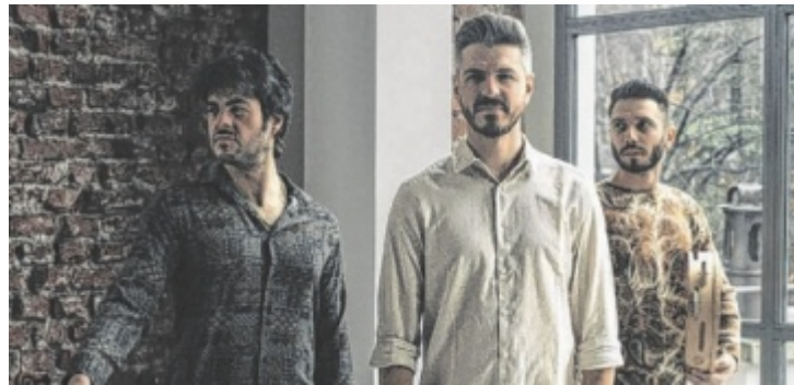
Domo Emigrantes beehren den Kulturverein Kiste erneut.