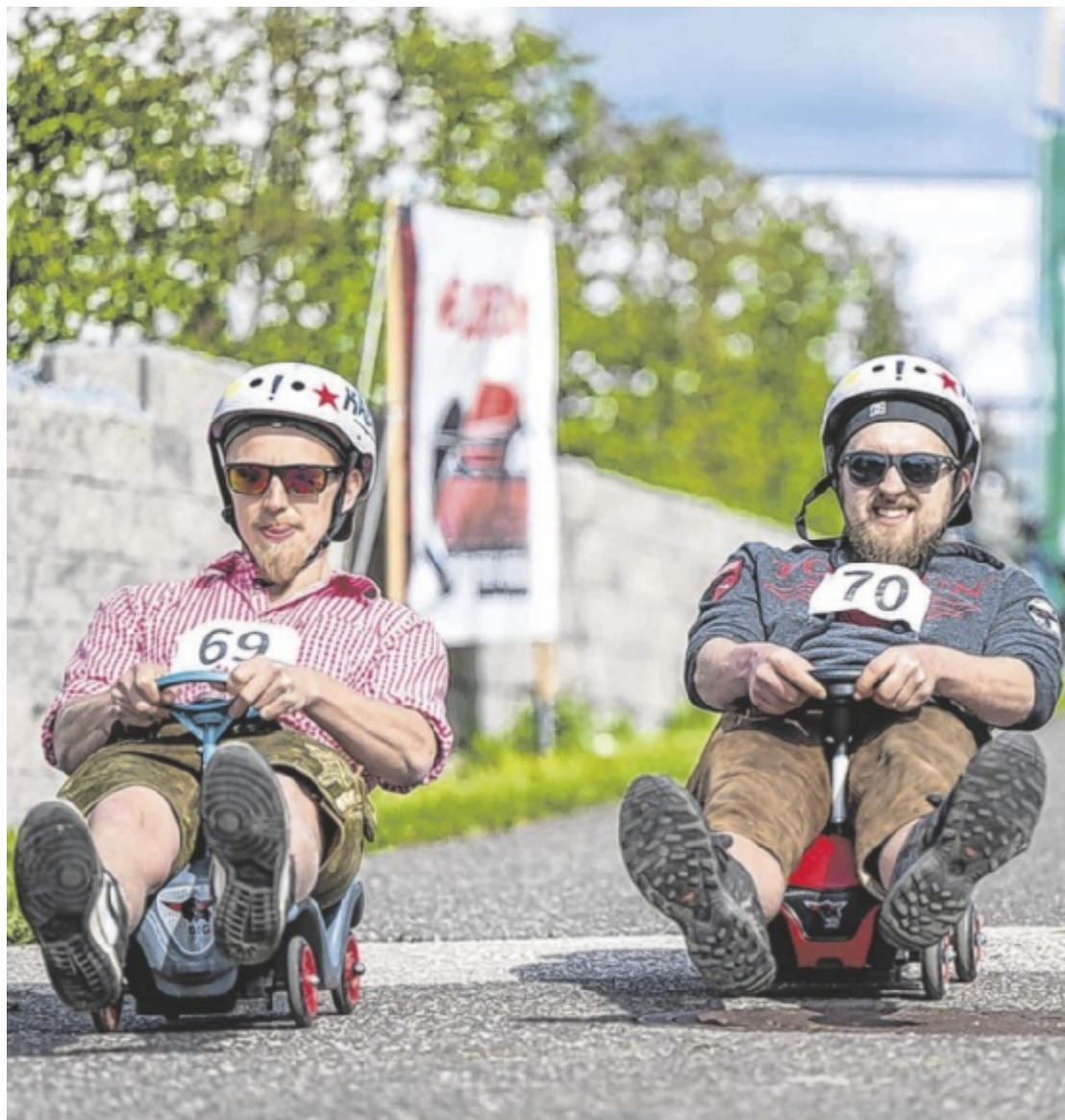
Rasant unterwegs Beim Burning Revolution am letzten Aprilwochenende in Niederkappel steht auch wieder das große Bobby-Car-Rennen an. Anmeldungen für die actionreiche Fahrt sind bereits möglich. Seite 29