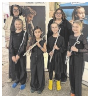
1. Preis für „Die Coolen Socken“ aus der LMS Neustift