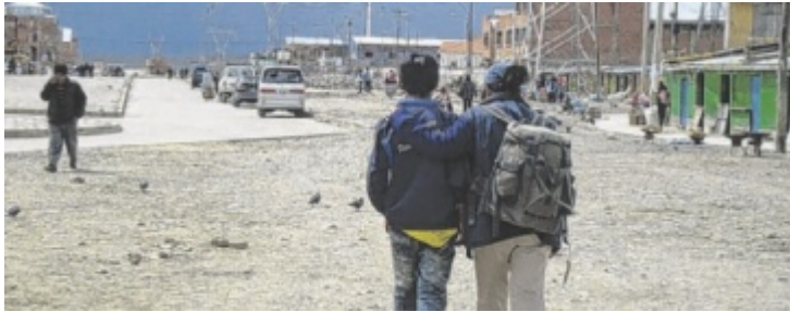
Das Projekt Maya Paya Kimsa schenkt Straßenkindern eine Zukunft.