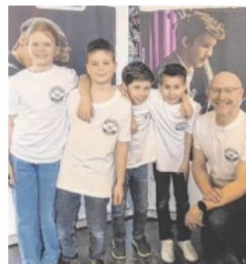
1. Preis für „All4Friends“ aus der LMS Neustift