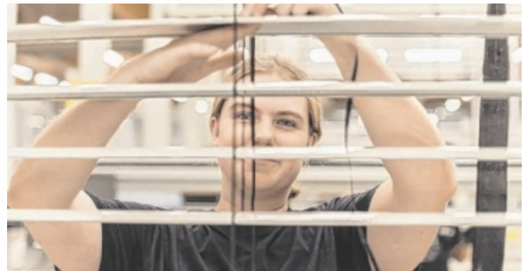
Der Lehrberuf Sonnenschutztechnik ist vielschichtiger als viele vermuten.

Der Beruf selbst ist vielschichtiger als viele vermuten. Sonnenschutztechniker messen, planen und montieren nicht nur Rollläden, Markisen oder Jalousien.