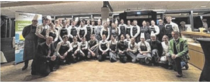
Schüler der Tourismusschule sorgten für besondere Akzente