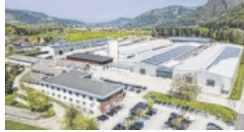
WOLF Systembau

WOLF Systembau trotz der Baukrise und setzt im 60. Jubiläumsjahr ein starkes Zeichen. Während viele Betriebe kämpfen, startet das Familienunternehmen aus Scharnstein mit voller Auslastung ins Jahr 2026. Besonders im Fertighaus- und Kellerbau stieg der Auftragszugang zuletzt um mehr als 50 Prozent. Damit knüpft das Unternehmen an das Niveau der Vorkrisenjahre an. Am Standort im Almtal verlässt täglich ein Haus die Produktion. Gefertigt wird in einer modernen Anlagen, was Tempo und Planungssicherheit bringt. Für