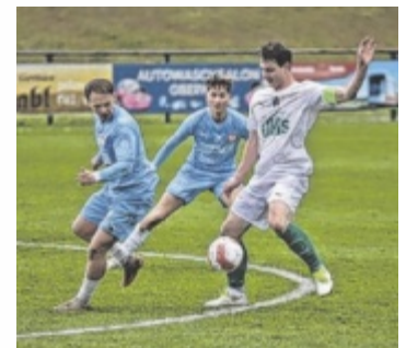
Spielezene zwischen Gschwandt und Mondsee.

In der Oberösterreich Liga erreichte der SV Zebau Bad Ischl gegen Union Perg ein 1:1. Bad Ischl zeigte vor allem in der zweiten Hälfte eine starke Leistung und holte einen verdienten Punkt. Union Gschwandt erreichte gegen Union Mondsee ebenfalls ein 1:1 und damit den ersten Punktegewinn nach zwei knappen Niederlagen. Beide Tore fielen durch Strafstoße. In der Landesliga West gewann der SV Gmunden gegen UFC Eferding mit 4:1. Eferding glich zunächst zum 1:1 aus, doch danach setzte sich Gmunden durch weitere Treffer durch. Damit erzielte die Mannschaft in allen drei Früh-