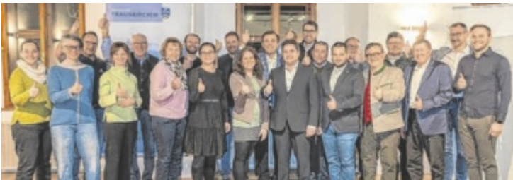
Beschluss des neuen Kindergartens.

Klimaschutzpreis zeigen eindrucksvoll, wie aktiv die Gmündner Zivilgesellschaft im Klimaschutz ist. Die große Bandbreite der Einreichungen bestärkt mich, dass die Beteiligung in den unterschiedlichsten Bevölkerungsgruppen angekommen ist. Das wollen wir würdigen und anerkennen, denn dieses Engagement gibt Mut und Zuversicht für die Zukunft.“ ■