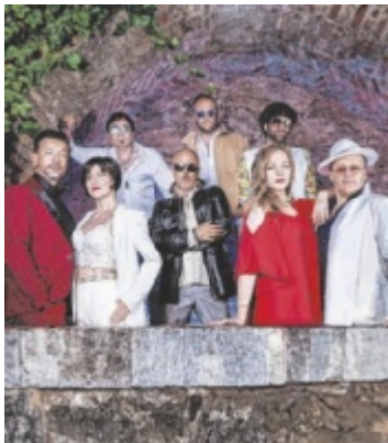
Italienische Nacht Ein Abend voll Italo-Hits erwartet Besucher am 15. April im Kongress- & Theaterhaus Bad Ischl. Seite 21/ Foto: Pura Vida