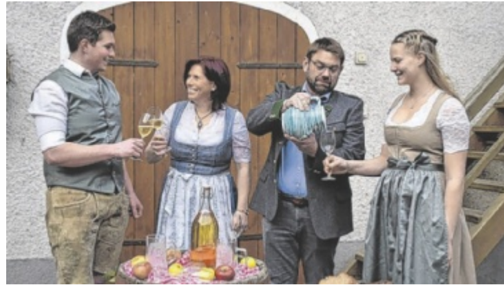
Landjugend Vorchdorf lädt zur Mostkost ein

Für Stimmung sorgt Livemusik, die der Veranstaltung ihren geselligen Rahmen verleiht. Nach der Siegerehrung öffnet die Bar,