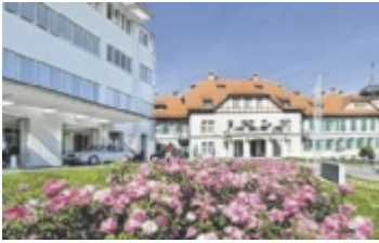
Spital Bad Ischl