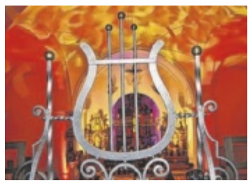
Musik zu Ostern.

schließlich die Seepromenade in Strobl in einen großen Genussmarkt, bei dem Gastronomen und Produzenten ihre Spezialitäten präsentieren. Karten sind online über die Plattform von Salzkammergut Tourismus sowie in den Wolfgangsee-Tourismusbüros erhältlich. ■