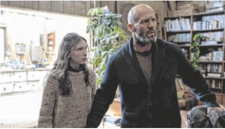
Jason Statham muss sich den Dämonen seiner Vergangenheit stellen.