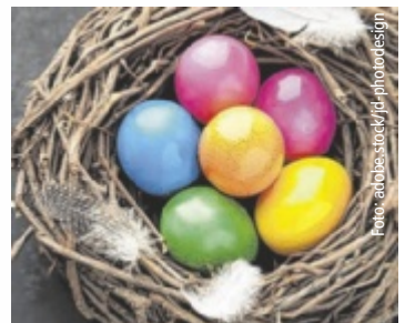
Ab sofort Ostereier auf tips.at sammeln und tolle Preise einheimsen.

ÖÖ. Tips und IKUNA Naturresort laden zur beliebten Ostereiersuche ein. Bis 5. April haben Leser auf tips.at täglich die Möglichkeit, 40 versteckte Eier aufzuspüren und dabei attraktive Preise zu gewinnen. Als Hauptpreis winken zwei Übernachtungen in der Lake Side Tipi Suite im IKUNA Naturresort für zwei Erwachsene und drei Kinder.