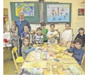
Malwerkstatt Ebensee

Bereits im September sicherte der Gemeinderat mit einer Förderung von 12.000 Euro das laufende Semester. Weitere öffentliche Mittel konnten bislang nur begrenzt erreicht werden. Mehrere lokale Gruppen haben Unterstützung zugesagt. Politische Fraktionen brachten bereits Spenden ein. Auch Vereine engagieren sich für den Fortbestand der Malwerkstatt. Der Mu-