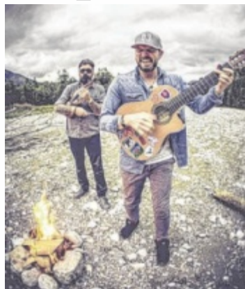
Django3000 begeistern nicht nur am Lagerfeuer.

Neue Songs entstehen gerade in der Chiemgauer Künstlerschmiede, bis dahin spielen die Djangos ihre Best Offs in unverkennbar ansteckend euphorisierender Ma-