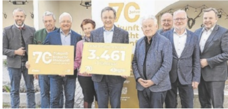
OÖ Seniorenbund, Bezirksgruppe Gmunden.

Im Bezirk Gmunden wird die Generation 60 plus in den kommenden Jahren stark wachsen. Bis 2050 steigt der Anteil der über 60-Jährigen im Bezirk von 31 auf 37 Prozent. In absoluten Zahlen bedeutet das einen Zuwachs von rund 7.700 Personen. Gleichzeitig wächst die Gesamtbevölkerung nur moderat um etwa 3.400 Personen. Damit gewinnt diese