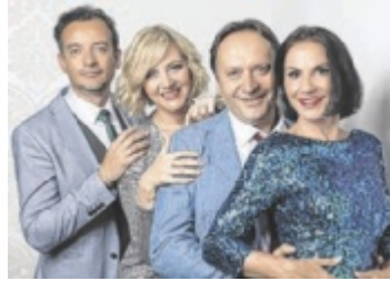
Italo-Hits in Bad Ischl

La Banda Italiana, italienische Profimusiker und Stars der Pop-, Musical- und Opernwelt präsentieren ein musikalisches Feuerwerk der Superlative. Hits von Zucchero, Laura Pausini, Al Bano & Romina Power, Andrea Bocelli, Eros Ramazzotti u. v. m. versetzen die Zuschauer in Urlaubsstimmung. Sommer, Sonne und Meer sind zum Greifen nah. Einzigartige Stimmen und eine umwerfende Band werden die Zuschauer mit ausgewählten Solo-, Duett- und Ensemblesnummern ins Italienfieber singen. Bekannte Songs wie Gente Di Mare, Sempre Sempre, Felicità oder