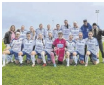
Die Gmundnerinnen stehen vor einer großen Hürde.

Bereits im Herbst lieferten sich beide Teams ein enges Duell, das die Mannschaft aus Gmunden auswärts mit 3:2 für sich entscheiden konnte. Nun kommt es zum nächsten direkten Aufeinandertreffen, das Auswirkungen auf die Tabellenführung haben kann. Bei einer Heimgeniederlage würden die Gäste aufgrund des direkten Duells die Tabellenführung übernehmen. Entsprechend wichtig ist die Partie für beide Mannschaften im weiteren Ver-