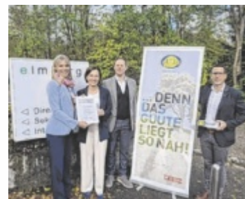
Überreichung des Guute-Zertifikats an die HBLA Elmborg.

dem Unternehmen Waldbildung Projekt GmbH 3.000 Bäume auf einer bisher landwirtschaftlich genutzten Fläche gepflanzt. Diese Aufforstung geschah mit Schülern der dritten Klassen, die sich im Zuge des Gegenstands Projektmanagement damit befassten. Unterstützt wurden sie dabei von den vierten Klassen der nahe gelegenen Mira-Lob-Schule (VS 27) in Linz. Weitere Infos: elmborg.at und guute.at ■