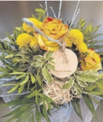
Blumensträuße mit Persönlichkeit

mentvoller Widder, harmoniebedürftige Waage oder naturverbundener Stier: Im Friedenshort wird jedes Sternzeichen floristisch interpretiert. Die Sträuße können auf Wunsch individuell angepasst werden. Jeder Strauß wird zudem mit einem eigens angefertigten Holzanhänger des jeweiligen Sternzeichens ergänzt. Alle Infos: www.friedenshort.at