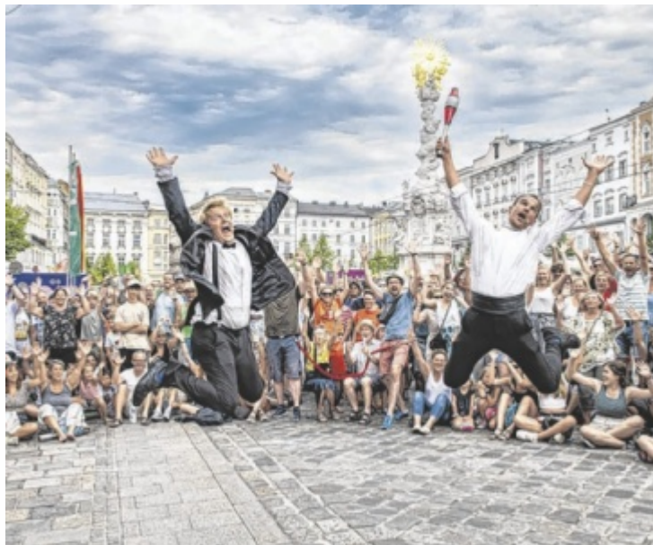
Veranstaltungen wie das Linzer Pflasterspektakel lassen die Herzen von Kulturgebeisterten schneller schlagen.

Am 20. März startet das österreichweit einzigartige Comic-Kunst-Festival Nextcomic unter dem Titel „Meine Entscheidung – deine Entscheidung! Mitreden, Mitbestimmen, Demokratie erleben“ im Ursulinenhof. Auch das Ars Electronica Center und die MKD – Meister*innenschule für Kommunikationsdesign wirken mit. Begleitend dazu zeigt das Atelierhaus Salzamt von 21. bis 29. März die Ausstellung „Dialogue of Error – IllustrationLadies Linz“, ergänzt von Workshops. Mehr: nextcomic.org