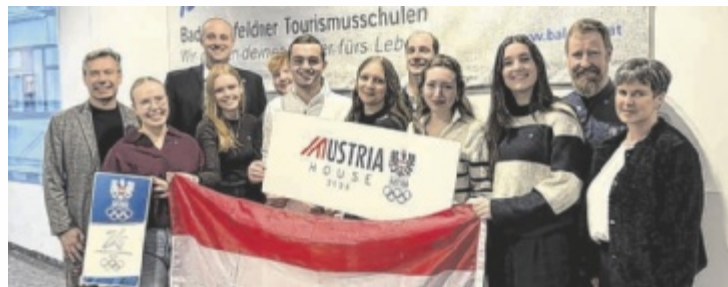
Das Olympia-Team aus den Tourismusschulen

Zu den Olympischen Spielen – diesmal von 6. bis 22. Februar in Mailand und Cortina d'Ampezzo (Italien) – geht es bereits zum dritten Mal. Der Arbeitseinsatz am Opernball am 12. Februar ist auch seit einigen Jahren ein fixer Bestandteil des Jahresablaufs. „Diese Erfahrungen sind sowohl für die