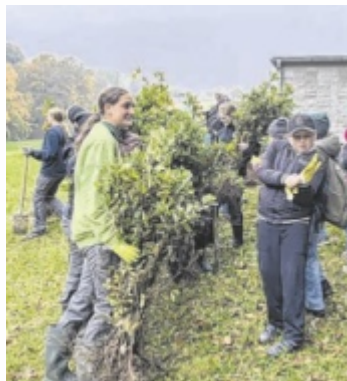
Setzen der Bäume

Die Schule arbeitet auch intensiv mit der regionalen Wirtschaft zusammen. Neben zahlreichen