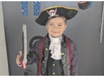
Vorfreude auf die Party