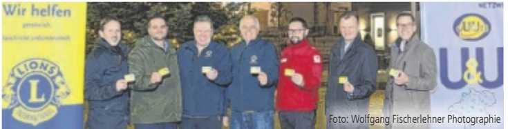
Das Kooperations-team der Lions Gallneukirchen und GUUTE

Bei der GUUTE-Lions-Card handelt es sich um eine Guthabenkarte, die in den Betrieben des Gusentals eingelöst werden kann. Davon profitieren zum einen die lokalen GUUTE-Partner, zum anderen natürlich die Familien in Not, die damit etwa Lebensmittel und Waren für den täglichen Bedarf oder Schulartikel kaufen können. Ausgegeben wird die