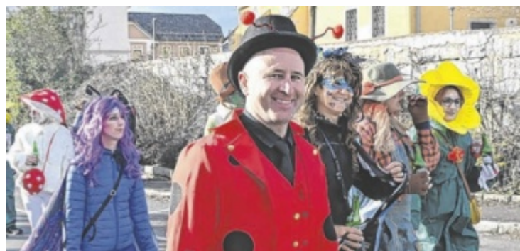
Bunte Kostüme und fröhliche Gesichter beim Faschingsumzug.