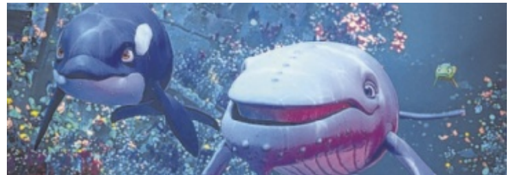
Buckelwal Vincent und seine Freunde beschützen die Ozeane.