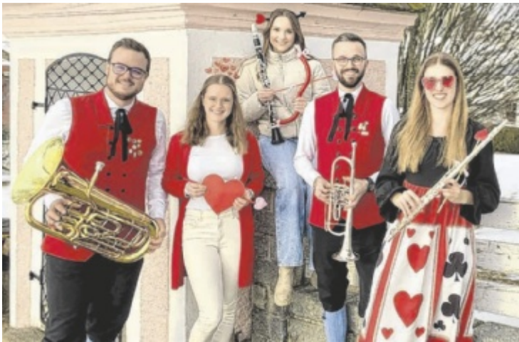
Der Musikverein Bad Leonfelden lädt zum Maskenball.