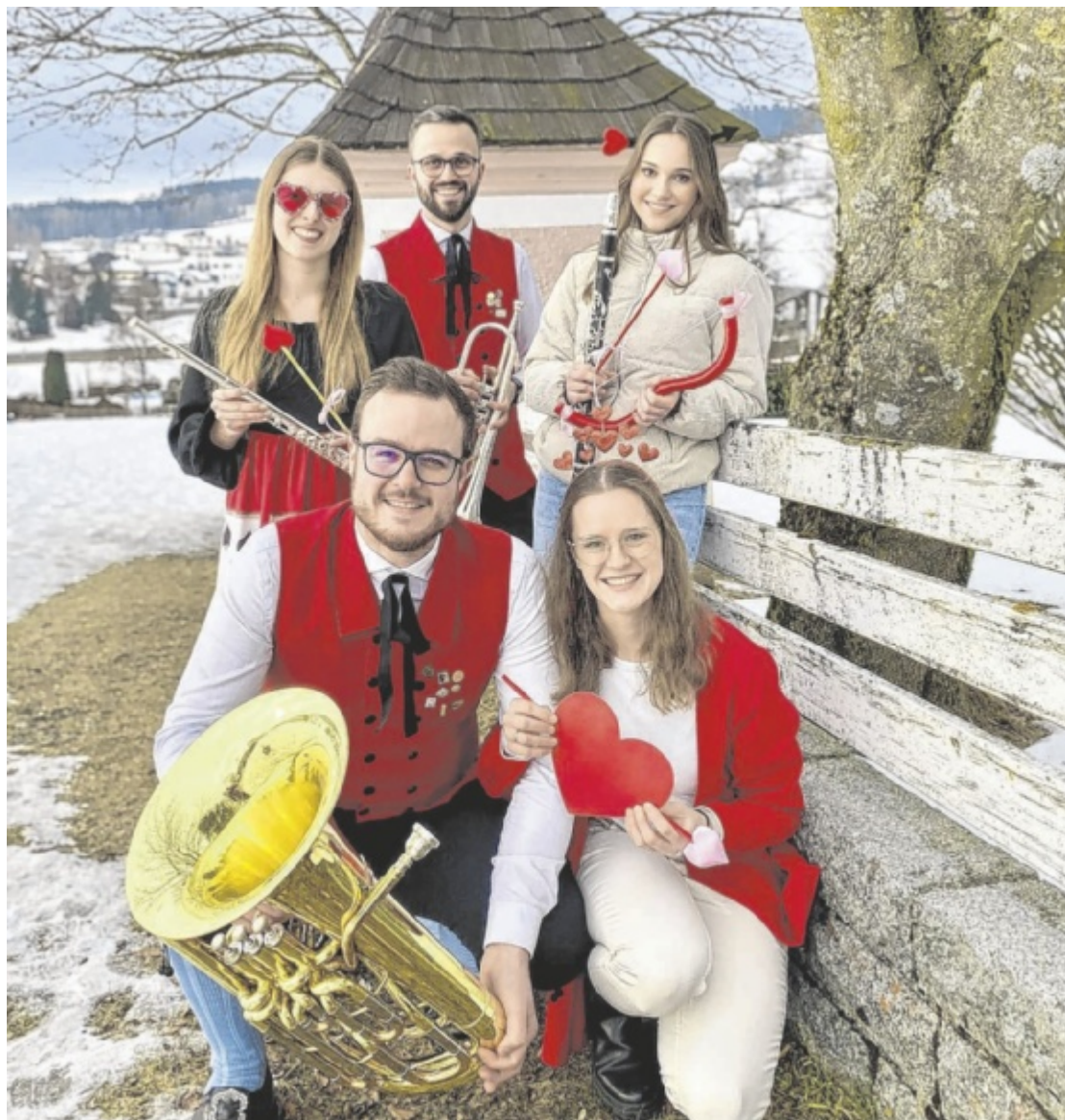
Klang der Liebe Der Musikverein Bad Leonfelden lädt am Faschingssamstag, 14. Februar, 19.30 Uhr, zum Maskenball unter dem Motto „Klang der Liebe“ in das Haus am Ring ein. Tips verlost 2 x 2 Freikarten. Seite 34