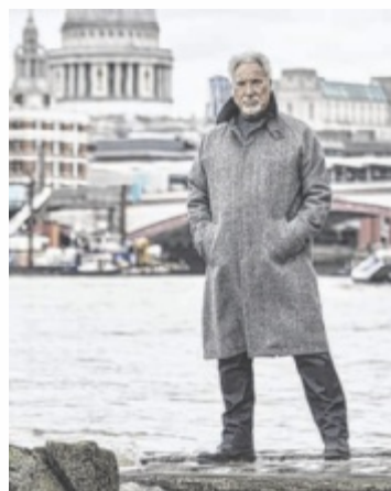
Tom Jones beehrt Linz.

Jones, von Queen Elizabeth II zum Ritter geschlagen, mischt seit über 60 Jahren musikalisch das Showbiz auf, der „Tiger“ – im Juni 85 Jahre alt geworden – brüllt