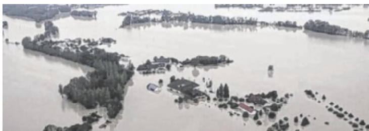
Goldwörth wurde 2015 vom Hochwasser hart getroffen.