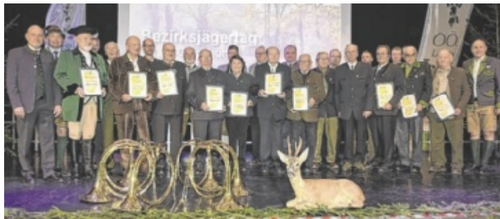
Bei der Ehrung für ihre Verdienste um die Jagd und Naturschutz.