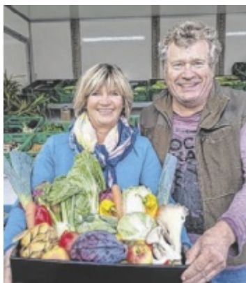
Bauernmarkt zurück Der Bauernmarkt Gramastetten startet am 6. Februar in die neue Genuss-Saison. Seite 4