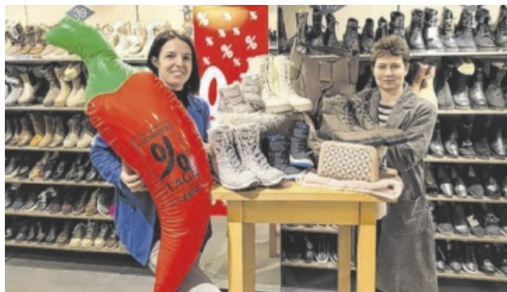
Bei den „Scharfen Tagen“ gibt es nochmal extra -20% Rabatt.

Zum Abschluss des Winterschlussverkaufs lädt das Schuhhaus Neundlinger in St. Veit zu den „Scharfen Tagen“. Von 4. bis 7. Februar gibt es auf alle bereits reduzierten Schuhe aus dem Winterschlussverkauf nochmals minus 20 Prozent Rabatt. Auch alle Taschen sind in diesem Zeitraum um 20 Prozent günstiger erhältlich. Günstiger geht es kaum: