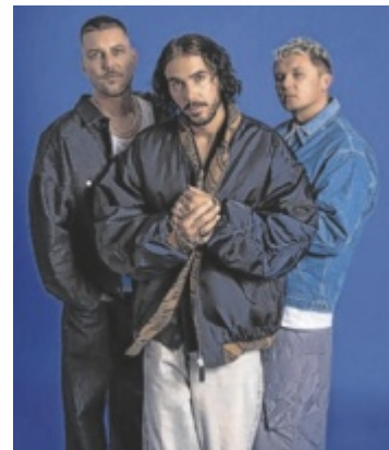
Das gefeierte Indie-Trio ClockClock kommt in den Posthof.

Auf ihrer „Dream Forever“-Tour wird dabei das komplette „Dreamers“-Album live gespielt, ergänzt um neue, bisher unveröffentlichte Songs. „Wir arbeiten gerade an neuer Musik, die noch näher an uns dran ist – direkter und mutiger. Ich kann es kaum erwarten, in diesen neuen Abschnitt gemeinsam mit unseren Fans zu starten“, so Boki. Live, persönlich und nahbar wird es,