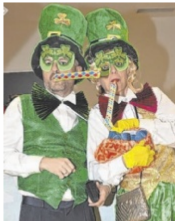
In Katsdorf wird der Fasching heuer wieder ausgiebig gefeiert.

Bereits am Nachmittag startet um 15 Uhr der Kinderfasching. Die Kinderfaschingsband aus dem Musikverein spielt Live-Musik. Dazu sorgen Tänze und Spiele für strahlende Gesichter und fröhliche Stimmung. Weiters dürfen sich die kleinen Gäste auf ein besonderes Highlight freuen: Der Kasperl kommt zu Besuch. Eintritt freiwillige Spenden