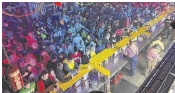
Auch heuer hofft die FF St. Georgen an der Gusen auf viele Gäste.

wandelt sich dabei zur Partyzone. DJ Peter sorgt beim Blaulichtfasching für beste Stimmung und bringt die Besucher zum Tanzen. An der XXL-Bar findet man alles, was man für eine Partynacht braucht – kühle Drinks, leckere Snacks und vieles mehr. ■