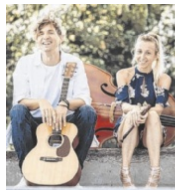
Die Quetschworkfamily präsentiert ein „Best of“.

begeistern mit musikalischer Raffinesse, pointierten Texten, Humor und Tiefgang. Zum Geburtstag präsentieren sie das Beste aus zehn Jahren in neuem Gewand – komprimiert in einem Abend voller Lieblingsstücke, witziger Moderationen und nachdenklicher Momente. Kartenreservierung: www.bruckmuehle.at ■