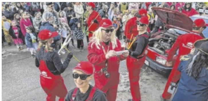
Bunt, laut und lustig: Die Funparade in Schwertberg.

Unterhaltung der Faschingsnarren. Einzelpersonen, Gruppen und Kinder sind eingeladen sich mit ihren kreativen Kostümen der Wertung zu stellen. Teilnehmen darf jeder, auch Gäste aus den Nachbargemeinden sind willkommen. Anmeldung telefonisch unter 0676 7242533. ■