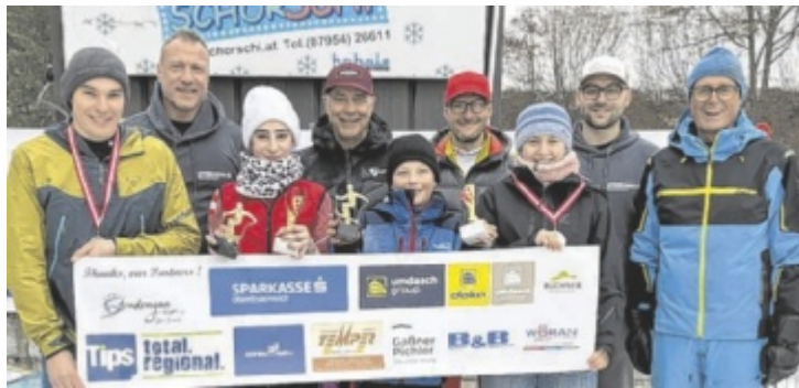
Die Tagesschnellsten mit den Organisatoren und den anwesenden Sponsoren des Sparkassen Strudengau-Cups powered by Tips.

Nach sechs von sieben Rennen befindet sich der Sparkassen Strudengau-Cup powered by Tips weiterhin in vollem Schwung. Die Cupwertung – basierend auf den bisher gesammelten Punkten aus allen Rennen – zeigt derzeit ein enges und spannendes Feld in den verschiedenen Klassen, wobei vor allem einige konstante Spitzenleistungen die Favoritenrollen festigen.