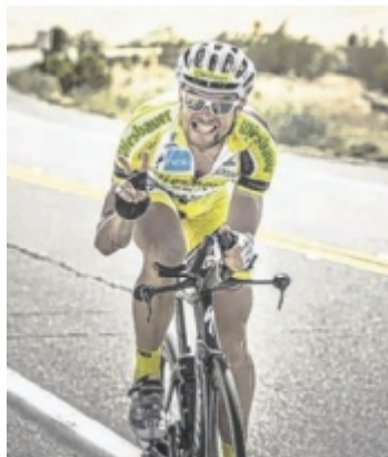
Ultra-Radsportler Christoph Strasser

Den Auftakt macht am Donnerstag, 5. Februar, Ultra-Radsportler Christoph Strasser mit seinem Multimedia-Vortrag „Weiterkommen“. Der sechsfache Sieger des Race Across America und 24-Stunden-Weltrekordhalter nimmt das Publikum mit auf eine persönliche Reise durch 20 Jahre Extremradsport. Mit eindrucksvollen Bildern und Videos erzählt er von legendären Erfolgen, bitteren Rückschlägen und seiner Suche nach neuen Herausforderungen im Ultracycling unsupported – ganz ohne Team und fremde Hilfe. Im Mittelpunkt steht die Frage, wie man die eigene Komfortzone ver-