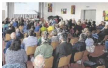
Die EEG Enns organisiert einen Infoabend im Aktivpark.