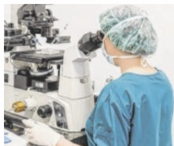
Sorgfältige Arbeit im Labor

nicht gestartet wurden, verfallen leider. Eine frühzeitige Beratung ist daher sowohl aus medizinischer als auch aus finanzieller Sicht wertvoll. ■ Anzeige