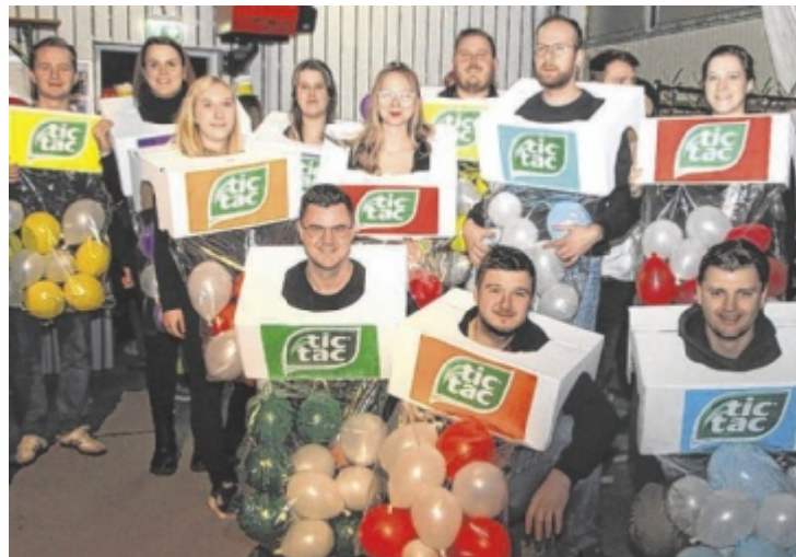
Die Rieder Fetzngaudi geht am 7. Februar in die siebte Runde.

In der Stockschützenhalle erwartet die Besucher am Faschingssamstag, 7. Februar, ein buntes Programm für alle Generationen. Von 14 bis 17 Uhr sorgt der Kinderfasching für Spaß bei den jüngsten Narren, ehe ab 20 Uhr die Halle zur Partyzone mit Musik, Tanz und ausgelassener Stimmung wird. Ein besonderes Highlight sind wieder die Prämierungen der besten Einzel- und Gruppenmasken. Alle, die teil-