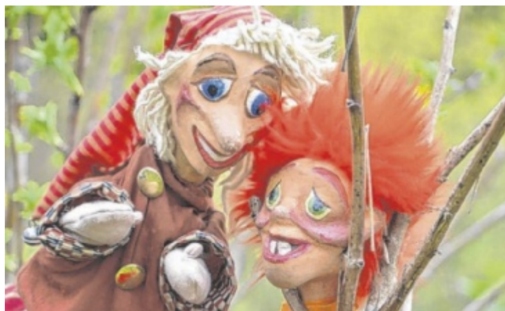
Das Kasperl-Abenteuer „Der Blumenkobold“ wird in Perg gespielt.