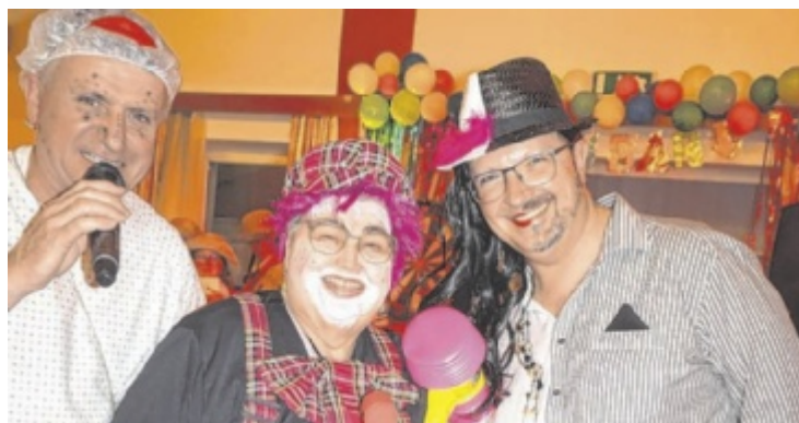
Der Musikverein Pergkirchen feiert die fünfte Jahreszeit.

ST. GEORGEN/GUSEN. Die EEG Enns, Perg-West, Steyregg informiert am Donnerstag, 26. Februar, 18.30 Uhr, im Aktivpark in St. Georgen an der Gusen über die Vorteile der Mitgliedschaft in ihrem Verein. Mittlerweile tauschen rund 300 Einspeiser und etwa 800 Konsumenten in der EEG Enns ihren Strom. Alle Bürger sind zur Informationsveranstaltung eingeladen. Auch Mieter und reine Konsumenten können teilnehmen. ■