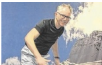
Skispaß abseits der Piste.