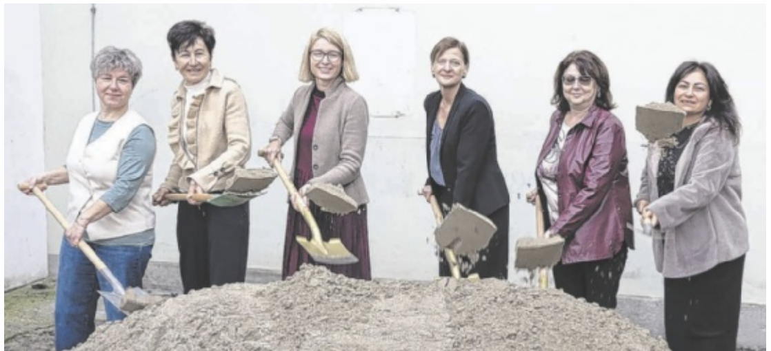
Frauenreferentin und Landeshauptmann-Stellvertreterin Christine Haberlander (Mitte, l.) und Nationalratsabgeordnete sowie Obfrau des Vereins „Frauenhaus Unteres Mühlviertel“, Sabine Schatz (Mitte, r.), setzten gemeinsam mit in der Frauenarbeit engagierten Damen den symbolischen Spatenstich im Innenhof des Perger Stadttamtes.

„Gewalt an Frauen ist eine der hässlichsten Seiten unserer Gesellschaft“, betont Landeshauptmann-Stellvertreterin und Frauenreferentin Christine Haberlander (ÖVP). „Mit dem Startschuss zum Bau des Frauenhauses Unteres Mühlviertel setzen wir einen weiteren wesentlichen Schritt im Ausbau unseres Schutznetzes für Frauen und Kinder.“ Die Adresse des Frauenhauses wird geheim gehalten, um zu verhindern, dass gewalttätige Partner die Frauen aufspüren können. Symbolisch wurde der Spatenstich für das Frauenhaus im Innenhof des Perger