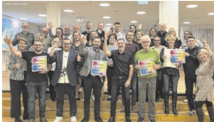
Das Wirk.Team von St. Georgen an der Gusen steht in den Startlöchern, um das Miteinander in der Gemeinde voranzutreiben.