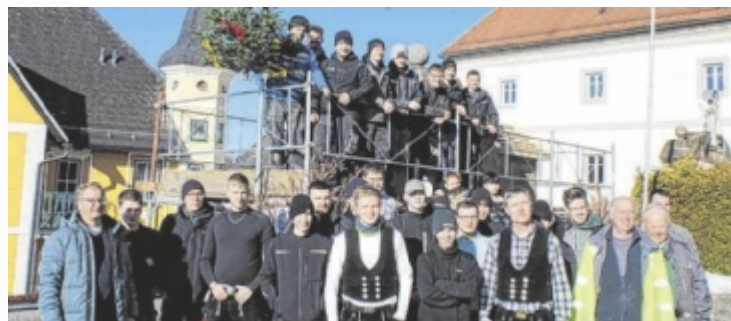
Die fleißigen Handwerker führten Sanierungs-Arbeiten durch.