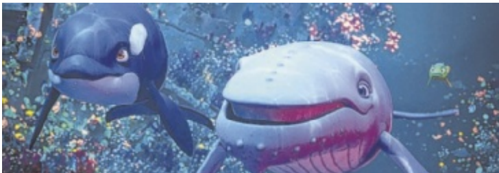
Buckelwal Vincent und seine Freunde beschützen die Ozeane.