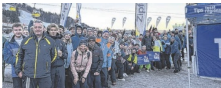
Die skibegeisterten Teilnehmer genossen den Tag im Skigebiet Hauser-Kaibling.