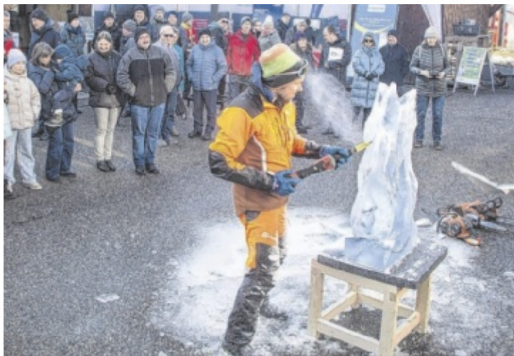
Mit ihrem Können, mit Feuer und mit schwerem Gerät wussten die Eismänner zu beeindrucken.

Vergangenen Samstag gelang es den Solariern in Engerwitzdorf bei schönstem Winterwetter die Besucher mit Ausstellung, Fachvorträgen und spektakulären Eiskünstlern zu begeistern. Die Hersteller der wichtigsten Marken an Heizkesseln und Wärmepumpen waren mit mobiler Ausstellung zur Beratung vor Ort. Fachvorträge über Heizen mit Pellets, Wärmepumpen und thermischen Solaranlagen, wie auch vom