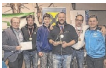
Gerüst Dich: Siegreiches Team.

weiteren Stockerplätze gingen an die Sportmittelschule Ebensee und die Mittelschule Tragwein. Der Landessieg ist zugleich auch die Qualifikation für die Schul-Olympics (Bundesmeisterschaft) im Ski Alpin, die von 3. bis 6. März 2026 ebenfalls am Hochficht ausgetragen werden. ■