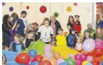
Die Kinderfreunde laden junge Narren ins Volksheim ein.