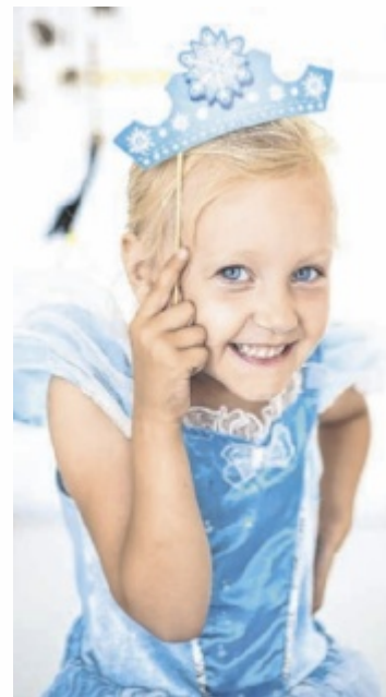
Nachhaltigkeit bereitet Freude im Carla-Shop.

Viele Kostüme liegen nach der Faschingssaison ungenutzt in Schränken oder Kellern, weil Kinder herausgewachsen sind oder die Verkleidungen nicht mehr gefallen. Die Carla-Shops der Caritas Oberösterreich nehmen gut erhaltene Kostüme für Kinder, aber auch für Erwachsene entgegen. Auf diese Weise können die Verkleidungen noch einmal einen neuen Besitzer glücklich machen. ■