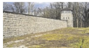
Mauthausen Memorial

Vorverkaufskarten für den Simandlball sind im Mercuri's sowie bei den Musikern und per Mail an ball@musikverein-katsdorf.at erhältlich.