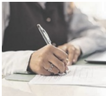
Große Freude über die neuen Betriebe im Bezirk.

BEZIRK PERG. Im vergangenen Jahr 2025 wurden im Bezirk Perg 267 Unternehmen gegründet. Zu den Neugründungen kommen 19 Betriebsübernahmen. Damit gibt es insgesamt 286 neue Unternehmen im Bezirk Perg. Die meisten Gründungen gab es in der Sparte Gewerbe und Handwerk (105), gefolgt von den Sparten Handel (102) sowie Information und Consulting (41). ■