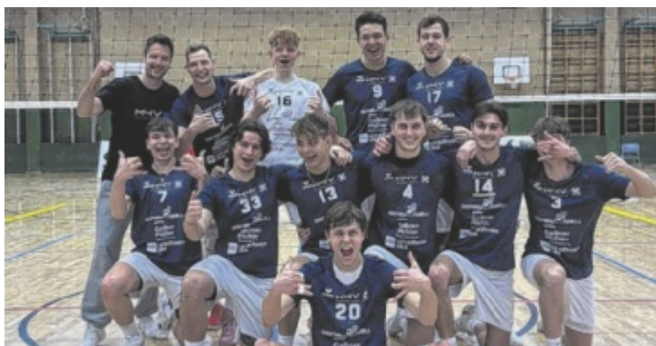
Heimsieg bringt die Mühlviertel Volleys ins Cupfinale.