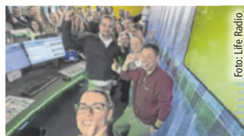
Life Radio feiert seinen Quotenrekord.

OÖ. Life Radio schreibt Radiogeschichte: Laut aktuellem Radiotest erzielt Life Radio einen neuen Quotenrekord und baut damit seine Position als erfolgreichster privater Radiosender aus Oberösterreich weiter aus(*). An einem durchschnittlichen Werktag schalten 254.700 Hörer (*) Life Radio ein – so viele wie noch nie in der fast 28-jährigen Sendergeschichte. Die Tagesreichweite in Oberösterreich ist im Jahresvergleich von 13,6 auf 17,1 Prozent gestiegen (*). In der Kernzielgruppe der 14- bis 49-Jährigen erreicht Life Radio eine Tagesreichweite von 20 Prozent und liegt damit in Oberösterreich klar vor dem ORF-Landesstudio Radio OÖ, das auf ca. zehn Prozent kommt (*).