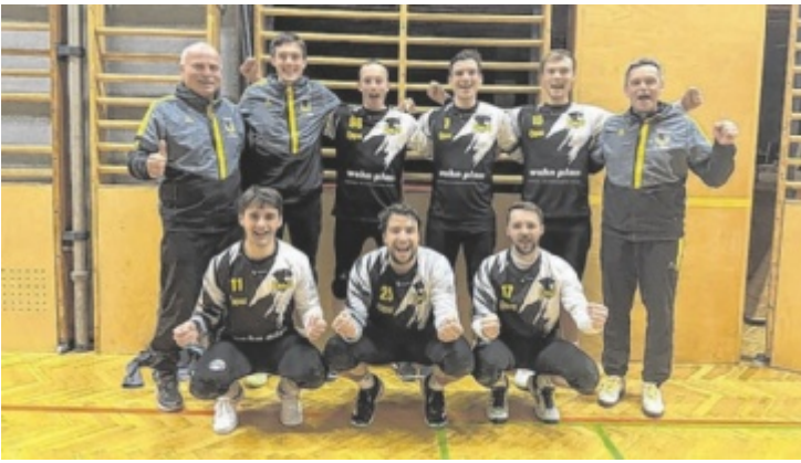
Die Ennsner beim Jubeln