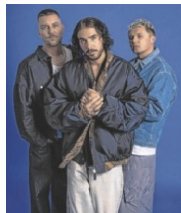
Das gefeierte Indie-Trio ClockClock kommt in den Posthof.