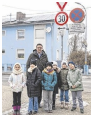
Tempo 30 bei der Volksschule St. Dionysen bedeutet mehr Verkehrssicherheit für die Schüler.

„Die Sicherheit unserer Kinder hat für mich immer oberste Priorität“, betont Koll. „Es freut mich außerordentlich, dass meine Forderung, die Höchstgeschwindigkeit auf der Weidfeldstraße im Bereich der VS St. Dionysen auf 30 km/h zu begrenzen, nun end-