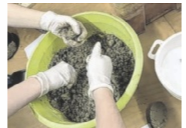
Beim Modellieren der Nisthilfen.

Verbindung von Artenschutz und moderner Materialentwicklung machte den Workshop besonders anschaulich und gab Einblick in neue berufliche und technologische Perspektiven. Am Ende stand nicht nur ein sichtbares Ergebnis in Form der gebauten Nisthilfen, sondern auch das Gefühl, selbst einen Beitrag leisten zu können. ■