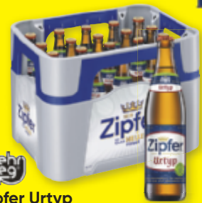
Zipfer Urtyp 0,5 Liter MEHRWEG-Flasche 20er-Kiste (0,5 l in der 20er-Kiste = 1.44) max. 4 Kisten niedrigster 30-Tage-Preis: 21.-

BIS ZU 50% auf ALLE ZIPFER BIERE* Zipfer