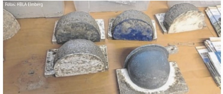
Schüler der HBLA Elmborg setzen auf innovative Materialien zum Artenschutz.