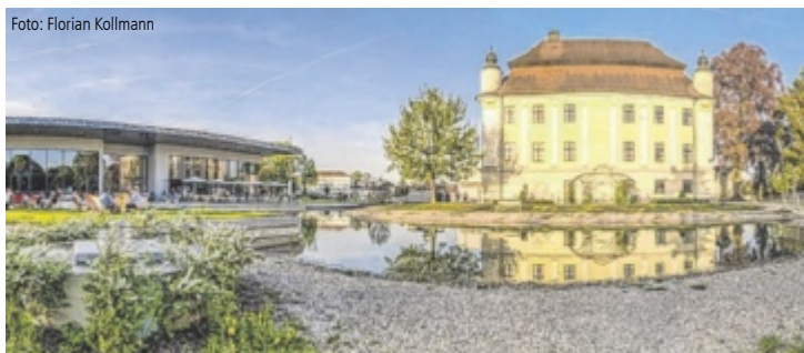
Rund um das Schlossrestaurant Traun prallen politische Sichtweisen aufeinander.