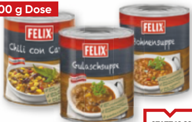
Felix Gulaschsuppe, Chili con Carne oder Bohnensuppe , 2900 g (1 kg = 4,48)