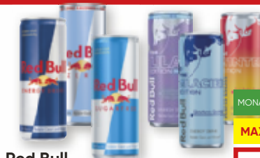
Red Bull Energy, Sugarfree, Zero, Editions oder The ORGANICS by Red Bull , verschiedene Sorten, 0,25 Liter oder 0,33 Liter ab 6 Dosen (1 l = 3,96/3.-)

MONATSSPARER MAXI.PACK STATT 1.59 AB 6 DS. JE 0 99 37 % BILLIGER