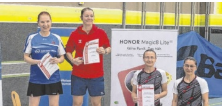
Bei der Siegerehrung