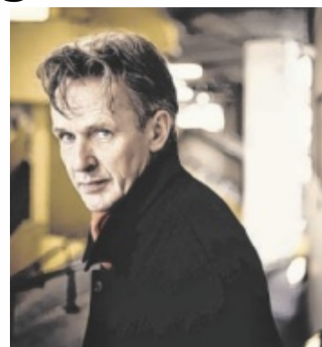
Tenor Ian Bostridge

Wenn das italienische Originalklangensemble, das zur Spitze der Alten-Musik-Szene weltweit zählt, sich mit Sängerpersönlichkeit Ian Bostridge zusammentut, um Werke am Übergang zwischen Renaissance und Barock in den Fokus zu nehmen, darf ein außergewöhnliches Konzerterlebnis erwartet werden. Bostridges Programme sind stets von intensiven Recherchen begleitet, die es ihm ermöglichen, tief in die Inhalte und historischen Kontexte einzudringen. Neben Claudio Monteverdis „Combattimento di Tancredi e Clorinda“ stehen Werke von Sigismondo D’India, Carlo Farina,