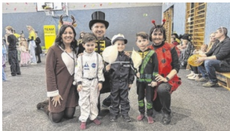
Farbenfrohe Kostüme beim Kinderfasching in Pasching

seine Runden. Kreativ gestaltete Wagen, fantasievolle Gruppen und kostümierte Narren sorgen für ein Spektakel, das jedes Jahr viele Besucher begeistert. Gegen 16 Uhr werden die besten Wagen und Gruppen ausgezeichnet. Parallel dazu steigt von 14 bis 20 Uhr die große Faschingsparty am Ennsner Hauptplatz. Für Kulinarik ist laut Veranstalter „bestens gesorgt“.