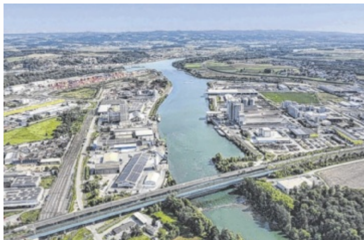
Der Ennshafen 2025: Weniger Schiffe, mehr Container, neue Betriebe.

Das Containerterminal Enns steigerte sein Volumen auf 376.000 TEU. Investitionen in zusätzliche Geräte erhöhten die Flexibilität im Betrieb. Bewegung zeigte sich auch bei den Be-