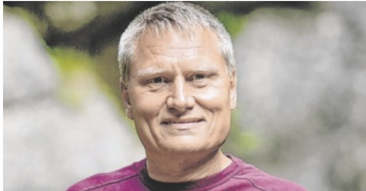
Zorn will mit einem Konsortium 50 Prozent des Flughafens kaufen.

„Dazu habe ich mit der Firma Ernst & Young Gespräche geführt, die dieses Gutachten erstellen würde. Ansonsten kann die Stadt Linz die Anteile gar nicht veräußern. Das Regulativ sieht vor, dass es im zweiten Schritt eine Beurteilung über den Wert des Flughafens geben muss, weil es sonst womöglich eine Bevorteilung eines Investors oder dieser privaten Initiative wäre, und das ist nicht das Ziel“,