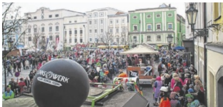
Bunte Kostüme und fröhliche Menschenmengen füllen den Ennsner Hauptplatz beim traditionellen großen Faschingsumzug.