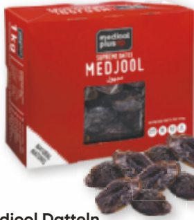
Medjool Datteln Klasse I, 1 kg Packung

jetzt am aktuellen Prospekt und in Ihrem Maximarkt!