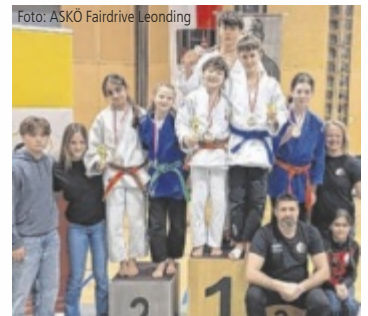
Vier Leofighters sind Landesmeister in der Klasse U16, einmal gab es Bronze.

LEONDING. Einen erfolgreichen Auftritt legte der ASKÖ Fairdrive Leonding bei den Judo-Landesmeisterschaften in Gallneukirchen hin. Insgesamt elf Athleten holten sich Gold und damit den Landesmeistertitel. Dazu kamen sieben Silber- und sieben Bronzemedailen.