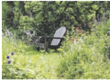
Ein naturnaher Garten lädt zum Entdecken ein.