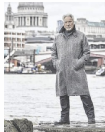
Tom Jones beehrt Linz.

Zeitlose Hits wie „It's Not Unusual“, „What's New Pussycat?“ oder „Sex Bomb“: Wer kennt ihn nicht, den „Tiger“ Tom Jones. Der Entertainer mit unvergleichlicher Stimme beehrt unter dem Motto „Come Gather Round“ wieder den Domplatz und wird für ein vergnügliches Konzerterlebnis im wunderbaren Ambiente sorgen. Jones, von Queen Elizabeth II zum Ritter geschlagen, mischt seit über 60 Jahren musikalisch das Showbiz auf, der „Tiger“ – im Juni 85 Jahre alt geworden – brüllt