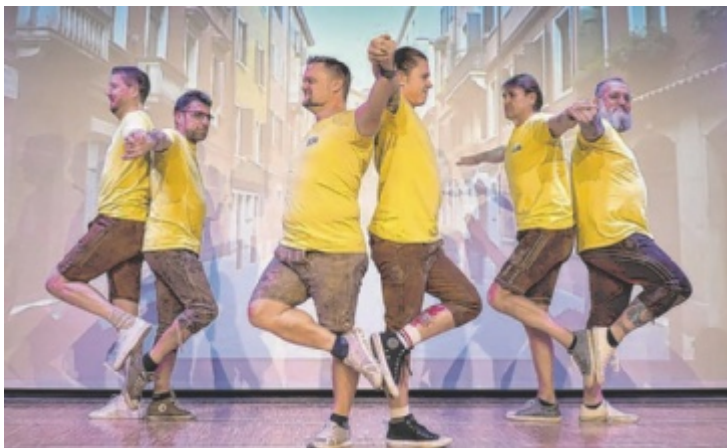
Humorvolles Männerballett beim Faschingskabarett in Asten.