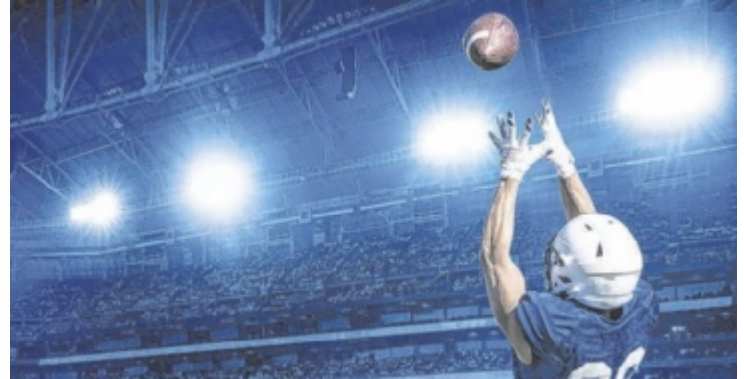
Das Football-Finale fasziniert auch in Linz

Die Traun Steel Sharks, Oberösterreichs Beitrag zur höchsten Football-Liga Österreichs, laden zur VIP-Party ins Linzer Lokal