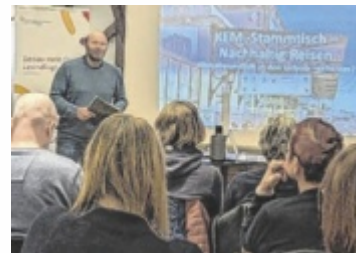
Diskussion über klimafreundliches Reisen.

LEONDING. Endlich Urlaub – doch wie lässt sich Reisen mit Klimaschutz vereinbaren? Dieser Frage widmet sich der nächste KEM-Stammtisch zum Thema „Klimafreundliches Reisen“, der am Donnerstag, 12. Februar, um 18.30 Uhr im Dachgeschoss des 44er Hauses stattfindet.