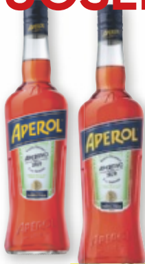
Aperol italienischer Aperitif, 0,7 Liter (1 l = 17,13)