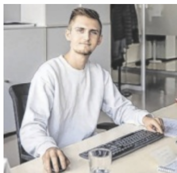
Gemeinsam lernen und wachsen im #TEAMKAINDL

LEONDING. Seit über 245 Jahren steht KAINDL in Leonding für technische Kompetenz, Verlässlichkeit und partnerschaftliche Zusammenarbeit. Was das Unternehmen dabei besonders auszeichnet, sind die Menschen dahinter. Rund 130 Mitarbeiter arbeiten täglich daran, für Industrie- und Gewerbekunden maßgeschneiderte Lösungen zu entwickeln.