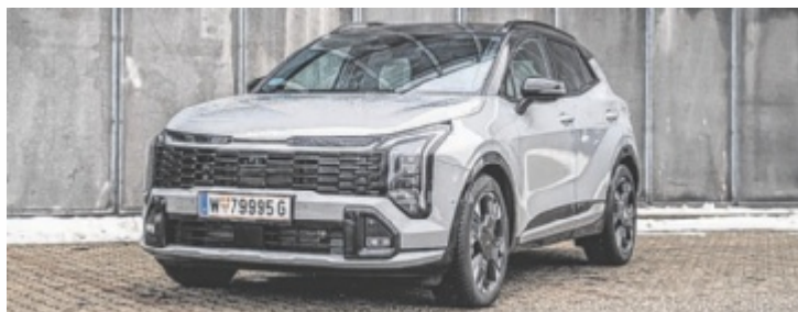
Kia Sportage 1.6 T-GDI AWD GT-Line

Schaut man auf Kia, könnte man meinen, die Koreaner haben sich vollends der E-Mobilität verschrieben. EV3, EV6 und EV9 sind in aller Munde, mit dem EV4 steht schon der nächste potentiell erfolgreiche Vollelektriker vor der Türe. Der Blick ist dabei stets auf die Interessen der Kunden gerichtet. Gesehen hat man dort den Wunsch nach Antriebsvielfalt und Beständigkeit. Ergo dessen wird es mit dem „K4“ einen Ceed-Nachfolger geben, bekam der Sportage ein Facelift. Front- und Heckleuchten sowie die Stoßfänger wurden neu gestaltet, optisch lehnt man sich an die EV-Geschwister an. Auch bei der Soft-