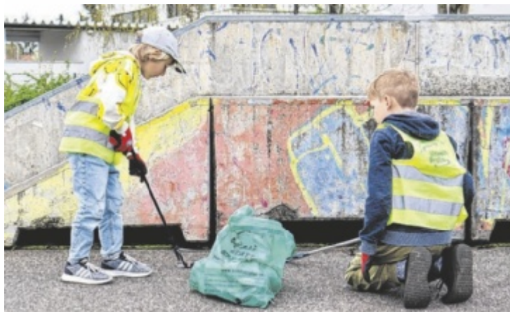
Die jüngsten Helfer werden erstmals mit einer Urkunde geehrt.