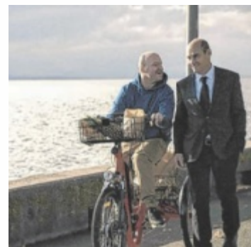
„Glück auf einer Skala von 1 bis 10“ ist eine Komödie über eine ungewöhnliche Freundschaft.

Gezeigt wird am Sonntag, 8. Februar, um 18 Uhr die französisch-schweizerische Produktion „Glück auf einer Skala von 1 bis 10“. Der Spielfilm erzählt von einer ungewöhnlichen Freundschaft zwischen dem körperlich behinderten Hobbyphilosophen Igor und dem ausgebrannten Bestatter Louis. Nach einem Unfall prallen zwei gegensätzliche Lebensentwürfe aufeinander, die sich auf einer gemeinsamen Reise im Leichen-