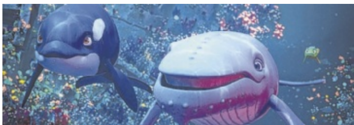
Buckelwal Vincent und seine Freunde beschützen die Ozeane.