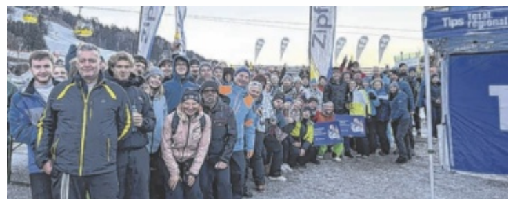
Die skibegeisterten Teilnehmer genossen den Tag im Skigebiet Hauser-Kaibling.