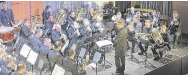
Die Brassband musiziert im Stadtsaal Mattighofen.