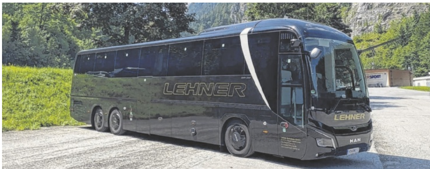
Unterwegs mit Lehner Busreisen: Qualität und Komfort für jede Gruppe