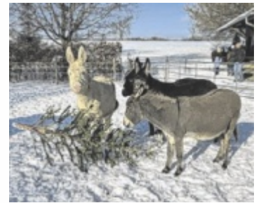
Die Tiere im Tiergarten Walding freuen sich über saubere und gut abgeräumte Christbäume. Eine Abgabe dieser ist direkt vor Ort möglich.