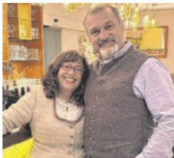
Trachtenmode SCHMID bringt jetzt die Preise zum Schmelzen