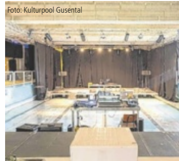
Kino und Konzerte im Alten Hallenbad