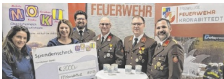
Bei der Spendenübergabe der FF Kronabittedt (Gemeinde Kirchschlag) an die Mobile Kinderkrankenpflege mit Sitz in Traun.

Am Feuerkogel wurde das richtige Verhalten im alpinen Gelände trainiert.