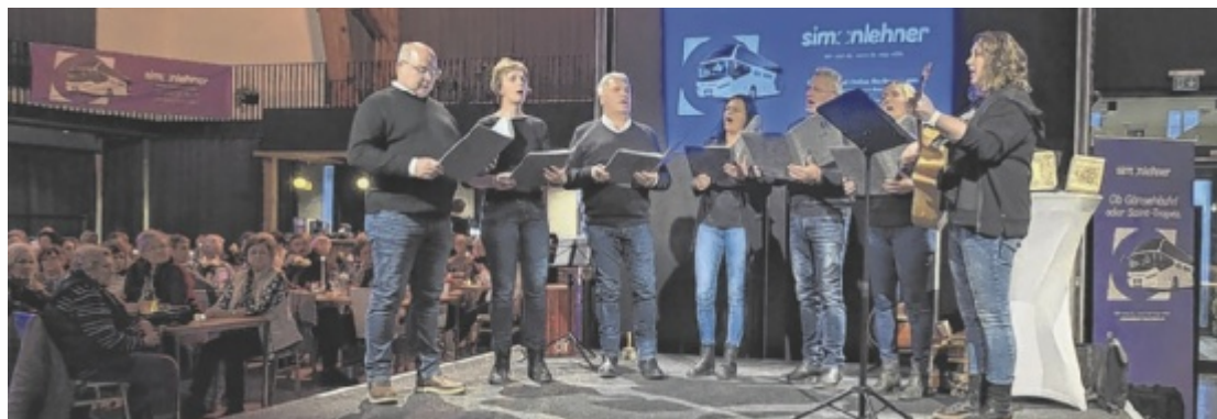
Die Advent-Roas 2025 von Simonlehner Busreisen war mit rund 300 Teilnehmern ein voller Erfolg.

Erste Station der Advent-Roas war der stimmungsvolle Adventmarkt im Schloss Weinberg. Im Anschluss stand in Freistadt ein gemeinsames Mittagessen im Restaurant Taurum auf dem Programm. Am Nachmittag stellte Simonlehner Busreisen ausgewählte Reisen aus dem neuen