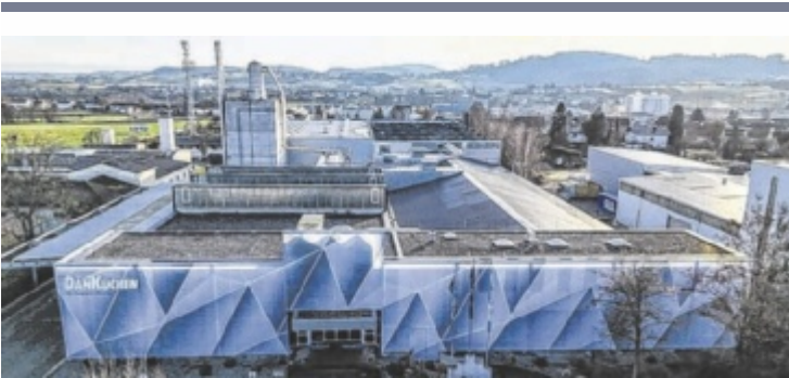
220 Mitarbeiter am Standort Gallneukirchen