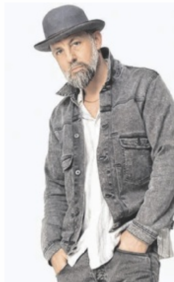
Das Bo Solo im Posthof.

Dass einer, der so viel Einfluss auf die Entwicklung des deutschsprachigen HipHop gehabt hat – egal ob als Teil der legendären Formation Fünf Sterne deluxe oder als Soloartist – noch nie auf einer Solotour war, ist geradezu unglaublich. Umso mehr kann man sich auf ein höchst interessantes Gastspiel im Posthof gefasst machen, das sich jetzt zum 25. Release-Jubiläum von „Türlich, Türlich.“ auf die Reise macht. Infos und Karten: www.posthof.at , Ö-Ticket. Tips verlost 4x2 Freikarten. ■