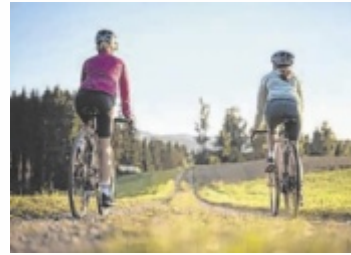
Gravelbiken bei Sonnenaufgang

Basis ist eine Kooperation aus 21 Partnerbetrieben in Hotellerie sowie weiteren Partnern aus Gastronomie, Sporthandel, Werkstätten und Service. So entsteht ein mühlviertelweites System aus Infrastruktur, Strecken-