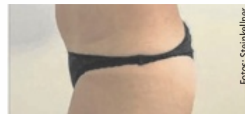
Vorher (l.) und das Ergebnis nach zehn „Abnehmen im Liegen“-Behandlungen

der richtig zu arbeiten – sogar im entspannten Zustand. Statt zusätzlichem Stress erhält er Impulse dort, wo klassische Diäten an ihre Grenzen stoßen. Wenn du das Gefühl hast, dein Körper arbeitet gegen dich statt für dich, dann ist das kein Endpunkt – sondern ein Zeichen, dass du einen anderen Weg brauchst“, sagt Steinkellner. Das Prinzip ist einfach und effektiv: Durch gezielte Ultraschall-Technologie werden Fettzellen geöffnet und entleert. Wasser und Giftstoffe werden über