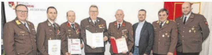
Bei der Jahreshauptversammlung wurden Kameraden geehrt.