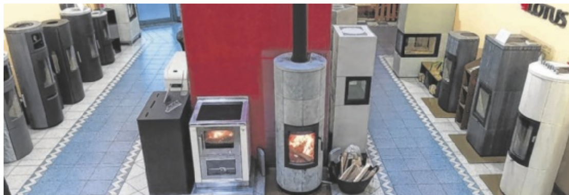
Am 30. und 31. Jänner gibt es wieder Wissenswertes rund um Öfen und Herde.

Präsentiert werden innovative Modelle führender Hersteller wie Greithwald, Heta, Lotus, Nordpeis, Dovre, Rika und Austroflam. Besonders die Pelletöfen von Piazzetta überzeugen durch leisen Betrieb, elegantes Design und einfache Bedienung. Kompakte, wassergeführte Herde von Greithwald beheizen auf Wunsch das gesamte Haus. Für Tiny Häuser – kleine, nachhaltige Wohnräume auf minimaler Fläche