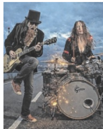
Mühlviertler Rock-Gschnas mit Herrbart & Fraulicht

Wer nicht dabei ist, hat nichts zu erzählen – so zumindest lautet die Devise des Abends. Das Rock-Gschnas verspricht einen Mix aus Eigenkompositionen und bekannten Rockhits, präsentiert von Herrbart & Fraulicht. Nicht nur musikalisch geht es zur Sache: Auch das passende Outfit gehört dazu. Willkommen ist alles, was rockt – von Lederjacken über Minirock bis hin zu aufgetupierten Mähnen, knallroten Fin-