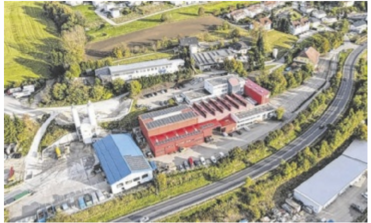
20 Arbeitsplätze konnten bei der Firma Hofmann gesichert werden.

Seit Anfang des Jahres wurde das operative Geschäft am Standort in Hellmonsödt wiederaufgenom-