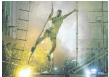
NinSCHI Warrior Das Action-Event NinSCHI Warrior findet am 7. Februar im Turnsaal in Hellmonsödt statt. Seite 24 / Foto: SVH/D.Mühlberger