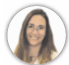
von JACKY STITZ