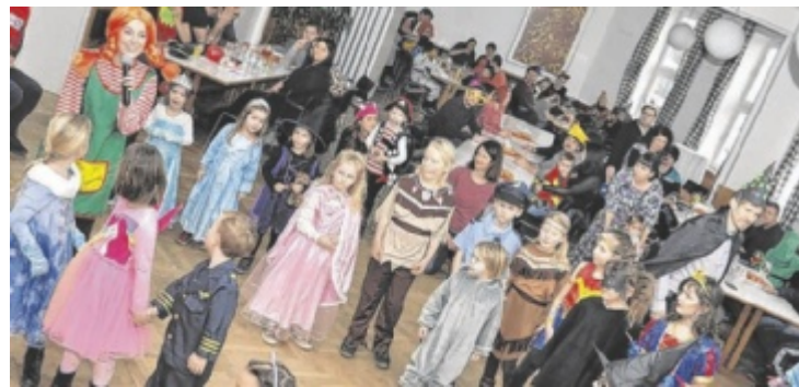
Spiel und Spaß im Gallneukirchner Gasthaus Riepl.