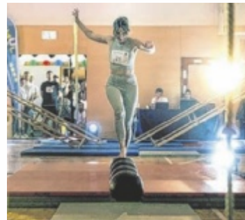
Das Sport-Event „NinSCHI Warrior“ geht in Hellmonsödt am 7. Februar schon zum zweiten Mal über die Bühne.

Nach dem Erfolg im Vorjahr mit 80 Teilnehmern und rund 250 Besuchern geht die Sportveranstaltung NinSCHI Warrior im Februar in die zweite Runde. Auch heuer erwartet die teilnehmenden Sportler ein abwechslungsreicher, herausfordernder Parcours mit zehn Stationen. Hier zählen nicht nur Kraft und Ausdauer, sondern auch Geschick und Schnelligkeit sind gefragt. Mitmachen können alle Sportbegeisterten ab 15 Jahren, Vorkenntnisse sind nicht nötig. Startgebühr: zehn Euro, die Teil-