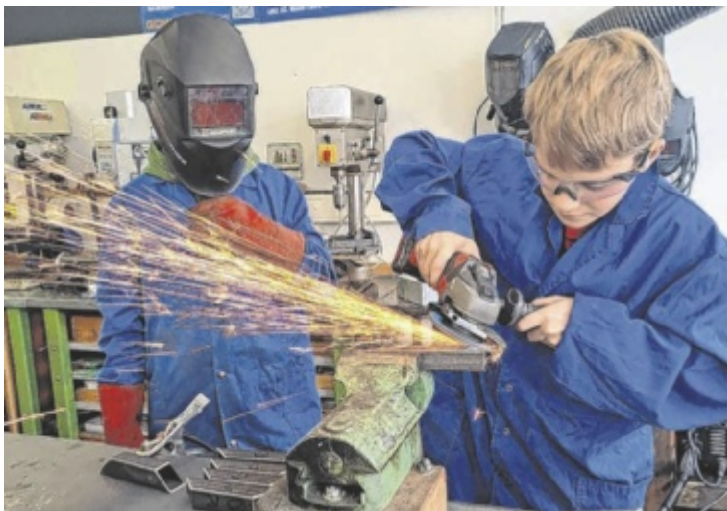
Jugendliche sowie deren Eltern erhalten anlässlich der PTS-Infotage in Ottensheim und Bad Leonfelden (Foto) Einblicke in den Schulalltag.