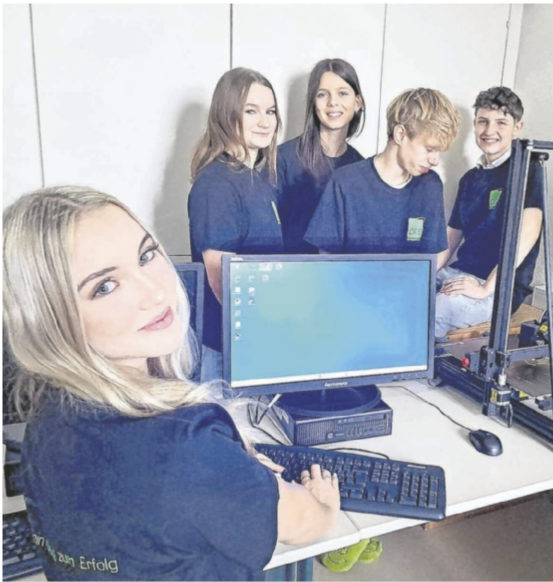
Berufsorientierung Die beiden letzten Polytechnischen Schulen des Bezirks laden zu ihren Infotagen ein: die PTS Bad Leonfelden am 26. Jänner und die PTS Ottensheim am 28. Jänner, jeweils ab 9 Uhr. Seite 25/ Foto: PTS Bad Leonfelden