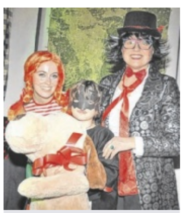
Kinderfasching Die Faschingszeit startet im Bezirk, etwa mit Pippi in Gallneukirchen am 25. Jänner. S. 29