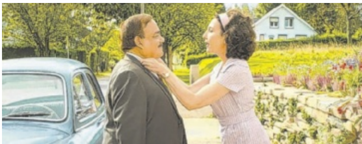
Von der heilen Welt der 1950er in das Jahr 2025.