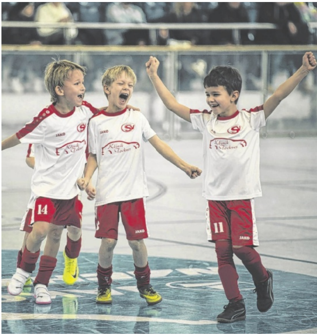
Nachwuchscup 56 Mannschaften und über 700 Kinder sind in sieben Altersklassen von 21. bis 23. Jänner beim Jako Hallenfußball Nachwuchscup des USV St. Ulrich dabei. Gespielt wird in der Stadthalle Steyr. Seite 16 / Foto: Thomas Bauer