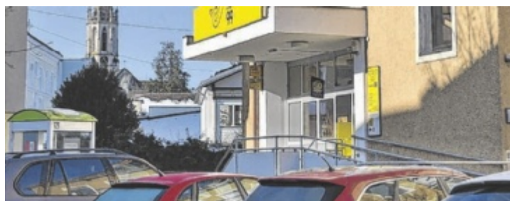
Ein barrierefreier Zugang samt Parkplätzen ist vorhanden.

pflichtet, auch eine Postpartnerschaft zu übernehmen. Interessenten können Details am Mittwoch, 28. Jänner, bei einer Veranstaltung erfahren. Anmeldungen dazu sind über die Gemeinde möglich. Eigentümer des Hauses ist seit 2024 die Firma Archionic aus Steyr. Verschieden große Mietvarianten bis zu 200 Quadratmeter werden angeboten. Bei der Postpartnerschaft sei mit Einnahmen von rund 3.200 Euro pro Monat zu rechnen. ■