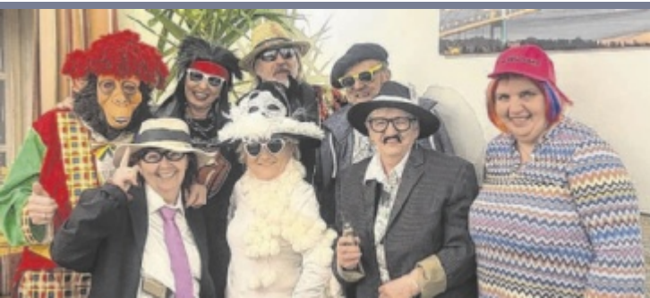
Fasching Das Faschingskomitee Weyer bereitet sich auf den Höhepunkt der Saison (Faschingdienstag, 17. Februar) vor. Bereits am Samstag, 24. Jänner, steht der Maskenball im Vereinssaal Unterlaussa auf dem Programm (20.26 Uhr).