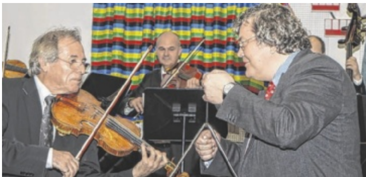
Hochkarätige heimische Musiker servieren „Wiener Schmankerl“.