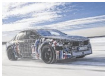
Das BMW Motorenwerk Steyr spielt bei den neuen M eDrive-Modellen eine wichtige Rolle.

freunde Fotogruppe Neuzeug. Die große Siegerehrung fand in Wels statt. ■