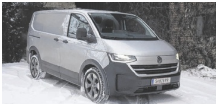
Der VW Transporter PanAmericana TDI 4M

Die kurze Antwort: Nein. Aber er kann einem mitunter tristen Arbeitstag etwas Glanz und Glamour verleihen. Schon der Name „PanAmericana“ beflügelt die Fantasie – völlig zurecht, denn die PanAmericana verbindet Alaska mit dem Feuerland. Die direkteste Verbindung ist 25.750 Kilometer lang und bis auf ein kleines Stück durchgehend befahrbar, sagt Wikipedia. Tatsächlich wäre der VW dafür gar keine so schlechte Wahl. Als Kastenwagen mit kurzem Radstand passen 5,8 Kubikmeter ins Heck. Im echten Leben ist der VW Transporter freilich ein so braves wie beliebtes Arbeitstier –