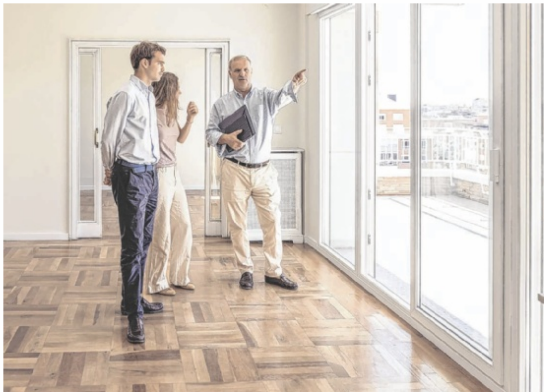
Unspektakulär, aber rund sollte es 2026 am Immobilienmarkt laufen.