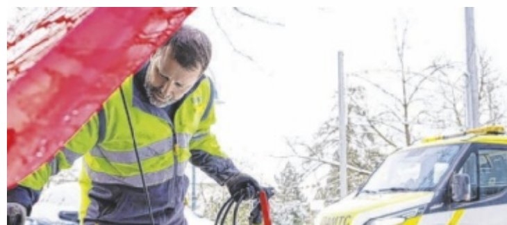
Die Techniker aus Steyr wurden 2025 zu 6.588 Einsätzen gerufen.

Stand: Jänner 2026. Angebotspreis setzt sich zusammen aus Listenpreis € 29.990,- abzüglich € 2.000,- Privatkundenbonus, € 1.000,- Edition Bonus, € 5.000,- Eintauschbonus, € 1.000,- Service Bonus bei Abschluss eines berechtigten Flex Care Produktes der Opel Austria GmbH sowie € 1.000,- Finanzierungsbonus bei Finanzierung über die Stellantis Bank SA. Neuwagenangebot von Opel Austria GmbH sowie Stellantis Bank SA Niederlassung Österreich gültig bis 31.03.2026. Sämtliche Abbildungen und Angaben ohne Gewähr, Satz und Druckfehler sowie Preis und Bonusänderungen vorbehalten. Symbolbild. Verbrauchs und Emissionswerte nach WLTP Stand Dezember 2025: CO 2 Emission in g/km: 0-135. Kraftstoffverbrauch kombiniert in l/100 km: 4,9-6,0. Energieverbrauch in kWh/100 km: 14,8-20,3. Symbolbild Stand 12/2025. Details bei deinem Opel Partner und auf opel.at .