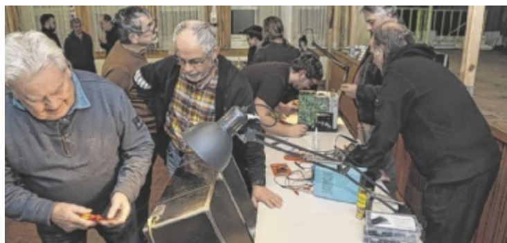
Das erste Repair Café in Reichraming wurde gut angenommen.

Färberweg 4 4202 Hellmonsödt www.grininger.at