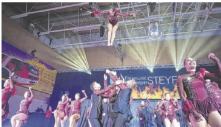
Die Akrobatikgruppe New Dimension aus Velden beeindruckte zu Mitternacht mit einer dynamischen Showeinlage und erntete großen Applaus.