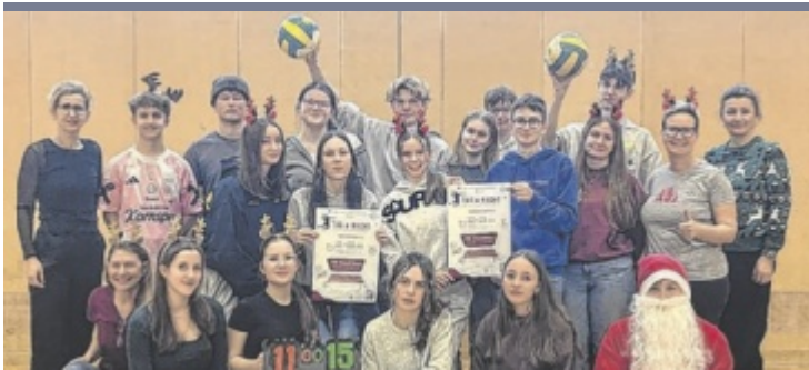
2.500 Euro erspielt 24 Stunden wurde an den Berufsbildenden Schulen (BBS) in Weyer Volleyball gespielt. Dabei wurden dank Spenden und Sponsoren 2.500 Euro für das Tierheim Steyr und den Verein Rollende Engel gesammelt.