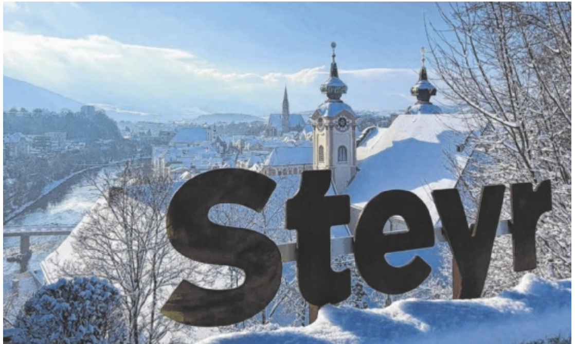
Seit einigen Wochen gibt es neben dem Panoramalift einen Fotopoint.

In der Innenstadt herrscht Aufbruchsstimmung, die Projekte im Siebensternehaus inklusive neuem Nahversorger oder das „Flair“ in der Enge sind positive Signale für den Handel in der Altstadt. „Es braucht immer Leute, die vorangehen“, sagt Bürgermeister Vogl. Neue Projekte stehen in den Startlöchern, am Stadtplatz wird ein Sportartikel-Händler eröffnen (ehemaliges Heimatwerk; neben dem Rathaus), am Grünmarkt ein Blumengeschäft.