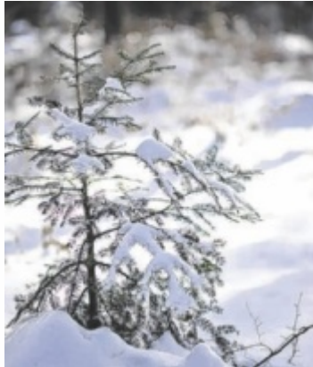
Junge Tanne

Die Tanne gehört zur Familie der Kieferngewächse und ist mit rund 50 Arten weltweit vertreten. In heimischen Wäldern dominiert die Weißtanne. Für die Österreichischen Bundesforste spielen Tannen als Mischbaumart eine zentrale Rolle. Dank ihrer tief reichenden Pfahlwurzeln sind sie fest im Boden verankert, können selbst in Trockenperioden wichtige Nährstoffe aufnehmen und sind widerstandsfähiger gegenüber Stürmen.