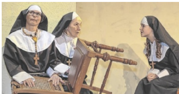
Eine himmlische Komödie wartet im VAZ Sierninghofen-Neuzeug.