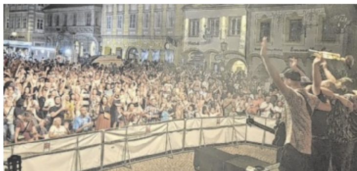
Das Stadtfest findet wieder am letzten Juni-Wochenende statt.