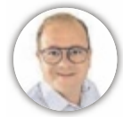
von THOMAS LEITNER

STEINBACH. Ein Dorf und seine Musik: Die Blasmusik in Steinbach am Attersee feiert heuer ein Jubiläum mit jahrzehntelanger Geschichte.