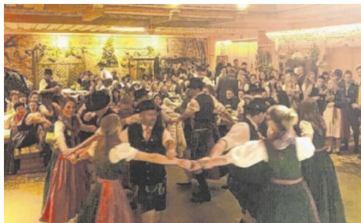
Bei der Lange Nacht der Tracht wird getanzt und gefeiert

sieben Euro. Ein inspirierender Abend über Ausdauer, Begegnungen und die Faszination eines ganzen Kontinents. ■