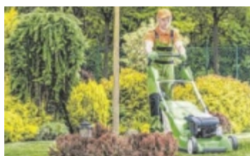
Jetzt mit dem WIFI einen pflegeleichten Garten anlegen.

Der Kurs richtet sich an alle Gartenliebhaber – egal Facharbeiter aus der grünen Branche oder Privatgartenbesitzer. Im Kurs lernen die Teilnehmer, was bei der Neuanlage oder Umgestaltung eines Gartens zu beachten ist, damit dieser wirklich pflegeleicht bleibt. Anhand von konkreten Beispielen und Bildern wird gemeinsam ein individuelles Pflegekonzept erarbeitet. Gärten werden besichtigt und man erhält vor Ort praktische Tipps für die Umsetzung. Die Kombination aus Exkursionen, Vorträgen und praktischen Übungen sorgt für einen abwechslungsreichen und praxisnahen Kursablauf. Jetzt von Expertenwissen profitieren und einen Platz