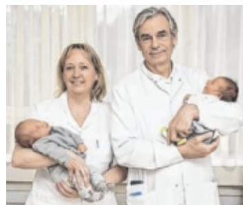
1.436 Babys kamen 2025 im Salzkammergut zur Welt.

Die Namenshitliste der im Salzkammergut Klinikum geborenen Buben führte Leo mit 15 Vergaben vor Maximilian und Jonas mit 14 Vergaben an. Bei den Mäd-