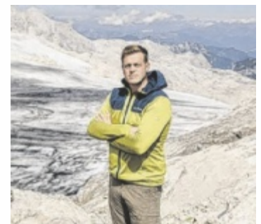
Großer Massenverlust am Hallstätter Gletscher

Ein besonders eindrückliches Beispiel für Klimafolgen in Oberösterreich ist der Hallstätter Gletscher. Im hydrologischen Jahr 2024/25 erlebte dieser Gletscher den größten gemessenen Massenverlust seiner Beobachtungsgeschichte. ■