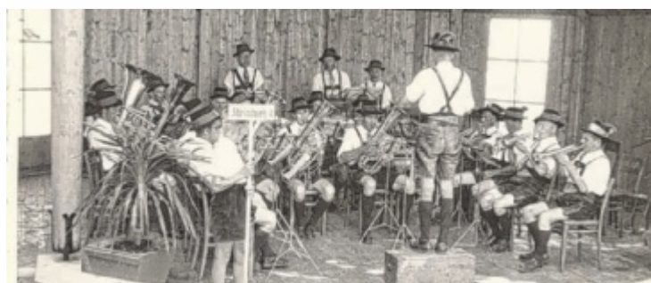
Ein Konzert der D'Schobastoana, bei dem bereits in Tracht musiziert wurde.

In den Sommermonaten schippert jeden Sonntagabend eine kleine Partie im Traunerl über den Attersee und lässt ihre Weisen weit über das Wasser klingen.