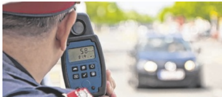
Polizei wird auch heuer zahlreiche Kontrollen durchführen

Im Jahr 2025 wurden im Bezirk 14.412 Alkohol- und Drogenvor-tests durchgeführt. In 704 Fällen folgten Alkomatuntersuchungen, dabei wurden 384 Alkoübertretungen festgestellt. Zusätzlich wurden 86 Fahrzeuglenker unter Drogen-einfluss aus dem Verkehr gezogen. Die Schwerverkehrsgruppe kon-