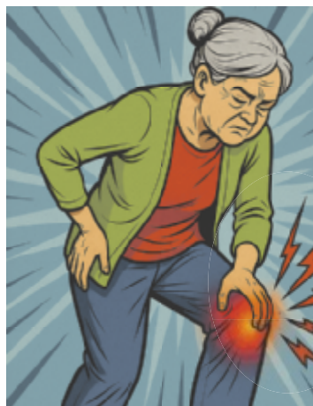
Millionen Betroffene leiden an einer Form von Arthrose.

Beginnt mit eingeschränkter Beweglichkeit und Schmerzen in Leiste und Gesäß. Fortgeschritten führt sie zum Hinken