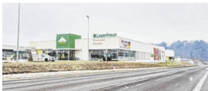
Aus dem Lagerhaus in Regau wird im Sommer eine Spar-Filiale

haus-Standorte, zudem hat Spar den betroffenen Beschäftigten Jobangebote gemacht. Besonders für das Ortszentrum und den Ortsteil Schalchham bringt der neue Markt künftig kürzere Wege. Lagerhaus-Geschäftsführer Norbert Hochrainer sieht in Spar einen Frequenzbringer für den Standort, der weiterhin auf Baustoffe, Brennstoffe, Tankstelle und Fachhandel für Haushalte und städtische Kundschaft ausgerichtet bleibt. ■