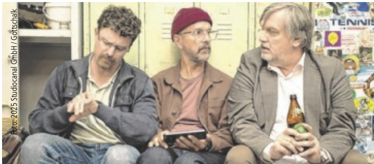
Braucht der Tennisclub einen extra Grill für das einzige türkische Mitglied?