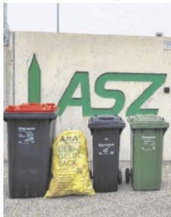
Beim Informationsabend wird geklärt, wie Müll richtig entsorgt wird.

Der Informationsabend richtet sich an alle Interessierten und bietet praxisnahe Tipps zur korrekten Entsorgung verschiedenster Abfälle. Fachkundige Auskunft sorgt dafür, dass Unsicherheiten ausgeräumt und die Abläufe der Abfalltrennung verständlich erklärt werden. Veranstalter sind die Gemeinden