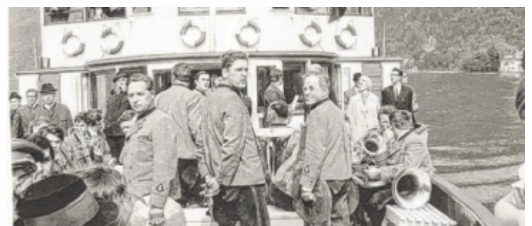
Auch auf den Fahrgastschiffen am Attersee wurden Konzerte gegeben.