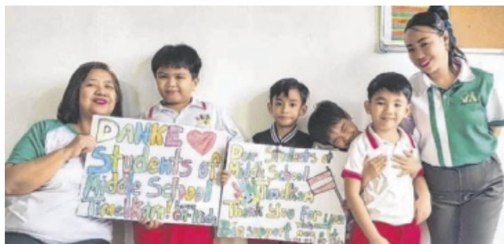
Die Freude an der Guardian Hand Schule war groß.

Für 2026 will die Polizei Alkohol- und Drogenkontrollen ausbauen. Auch Tempo, Handy am Steuer, Gurten, Kindersitze und Fahrzeug-technik bleiben im Fokus. ■