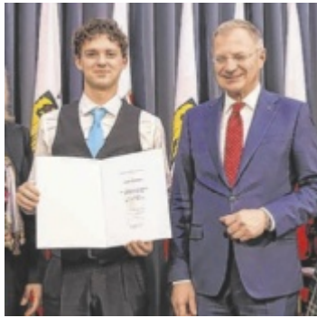
Feierliche Übergabe