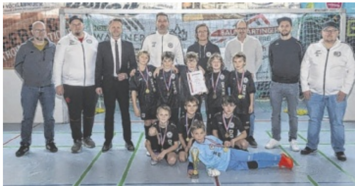
Die U-10 Siegermannschaft des SK Kammer mit Trainer sowie Funktionären des ATSV Rüstorf und Sponsoren

Dramatik pur gab es beim Finale der U-14 zwischen dem ATSV Rüstorf und Vorwärts Steyr. Bei diesem Spiel (2:2 nach 12 Minuten) entschied erst der zweite Durchgang beim Siebenmeterschießen den Turniersieg von Steyr. Ein großes Danke ging auch an die Sponsoren des Turniers. 60 Firmen leisteten ihren finanziellen Beitrag für die ATSV Rüstorf Nachwuchsabteilung. Beim Finale der Altersgruppe U-