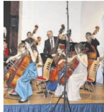
Mondsee Sinfonietta