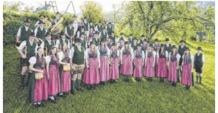
Die Trachtenmusikkapelle D'Schobastoana heute

Der Zweite Weltkrieg brachte die musikalische Arbeit vorübergehend zum Erliegen. Der Neubeginn nach 1945 war schwierig, politische Hürden bremsen die Entwicklung. Doch mit Unterstützung von Gemeinde und Verein