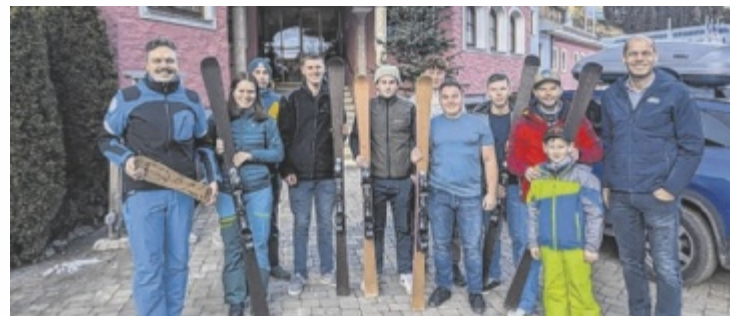
Gruppe der BS Attnang mit Michael Walchhofer (rechts)

Die Berufsschule Attnang durfte die für ein Schulprojekt erhaltenen Gratis-Skikarten direkt aus den Händen von Ex-Abfahrtsweltmeister und mehrfachen Gesamtweltcupsieger Michael Walchhofer in dessen Hotel entgegennehmen. Der Ausnahmekönner hielt sein Versprechen und sorgte damit für einen besonderen Abschluss des Projekts. Danach ging es auf die Piste, wo die selbstgebauten Skier einem Praxistest unterzogen wurden. Michael Walchhofer erzählte dabei aus seiner Zeit im Europacup, als er