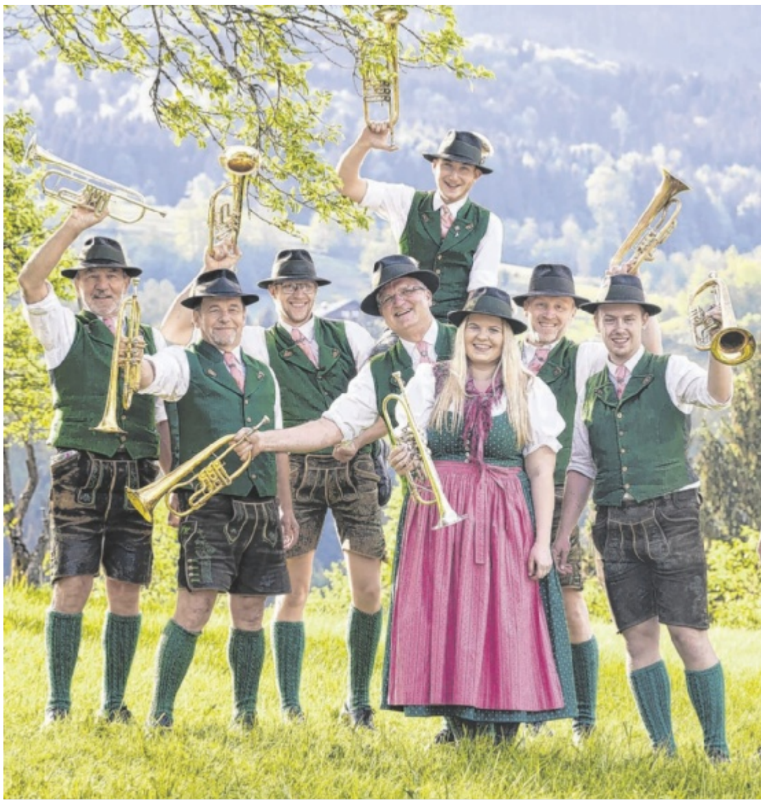
Jubiläum 160 Jahre Blasmusik in Steinbach am Attersee: Von den Anfängen im Jahr 1866 über Krieg und Neubeginn bis zur ersten Trachtenmusikkapelle der Region – eine klingende Dorfgeschichte mit großer Tradition. Seite 2