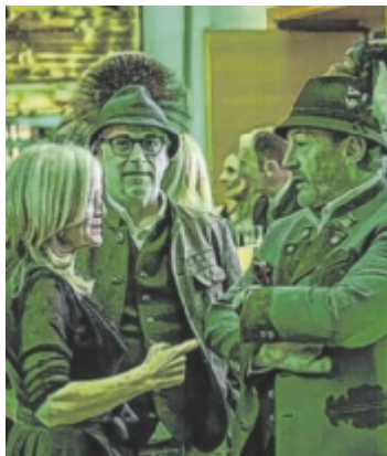
Jägers laden zum 2. Bezirksjägerball nach Gampern ein

Zur Ballmitte erwartet die Gäste um Mitternacht eine Überraschung, deren Inhalt noch geheim gehalten wird. Der Dresscode lautet stilvoll „trachtig-jagdlich“, was