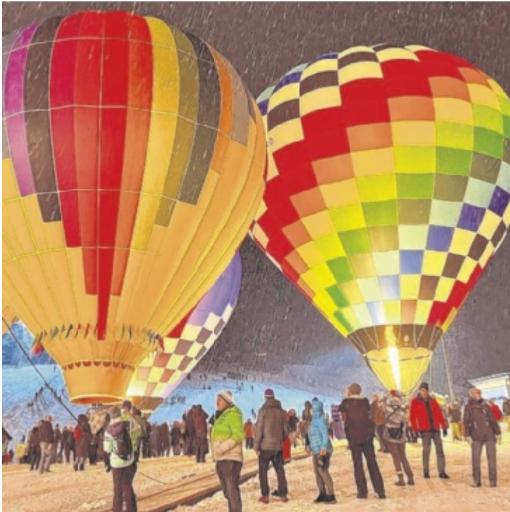
Nacht der Ballone in Gosau zieht jedes Jahr tausende Besucher an

der und Bergketten. Zahlreiche internationale Ballonteam bieten Mitfahrgelegenheiten an und sorgen für unvergessliche Eindrücke hoch über dem Gosautal. Wer einmal mit dem Wind über Berge und Täler schwebt, versteht rasch, warum dieses Event zu den beliebtesten Winterhighlights der Region zählt. Tickets und Gutscheine sind unter der Telefonnummer 06136 8841 erhältlich. Nacht der Ballone als Highlight Höhepunkt ist die „Nacht der Ballone“ am Mittwoch, 21. Jänner, ab 17.30 Uhr bei der Hornspitzbahntalstation. Dort werden die Ballons im Takt der Musik erleuchtet und schaffen ein faszinierendes Farbspiel vor der Bergkulisse. Kulinarische Angebote und ein abschließendes Feuerwerk runden den Abend ab. ■