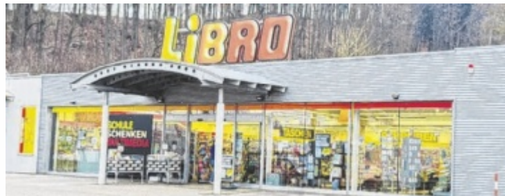
LIBRO-Filiale in Vöcklabruck schließt noch im Jänner

Für die vier Mitarbeiter in Vöcklabruck sollen jedoch Perspektiven innerhalb des Unternehmens geschaffen werden. Nach Angaben der Geschäftsführung wurden Möglichkeiten geprüft, eine Wei-