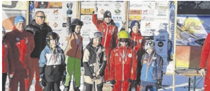
Charity-Rennen im Rahmen des Mondseelandcups

Austragungsort des Mondseelandcups ist der Skilift Oberaschau in Oberwang. Am Samstag, 17. Januar, findet eine Doppelveranstaltung mit Tombola statt. Um zehn Uhr beginnt ein Charity-Rennen zugunsten des Seniorenwohnheims Mondsee, um 13 Uhr folgt das zweite Rennen des Tages. Anmeldung, Ausschreibung sowie nähere Details sind auf der Website der Sportunion Oberwang zu finden. Das Seniorenwohnheim Mondsee ist ein Ort des Zusammenlebens, der Fürsorge und der Le-