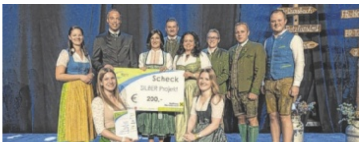
Ein Projekt der Landjugend Waldzell wurde ausgezeichnet.