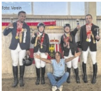
Die Reiter des Vereins waren erfolgreich.

Der Höhepunkt waren die Österreichischen Meisterschaften von