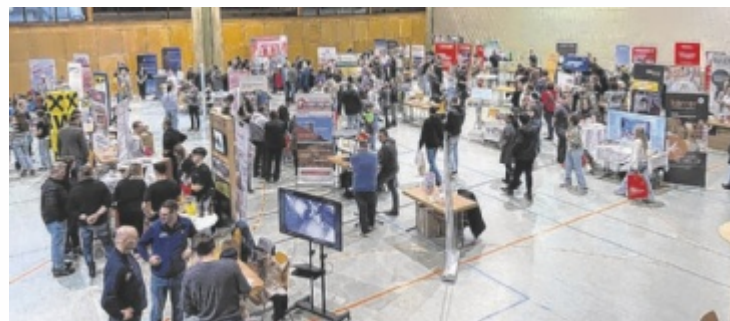
Jugendliche können sich über Lehre und Karriere informieren.

Für faire Bedingungen wurde auch bei der Standgestaltung gesorgt: Ob Großunternehmen oder