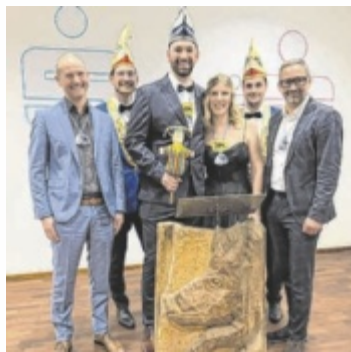
Das Prinzenpaar bei der Übergabe der „Saubärenbütt“