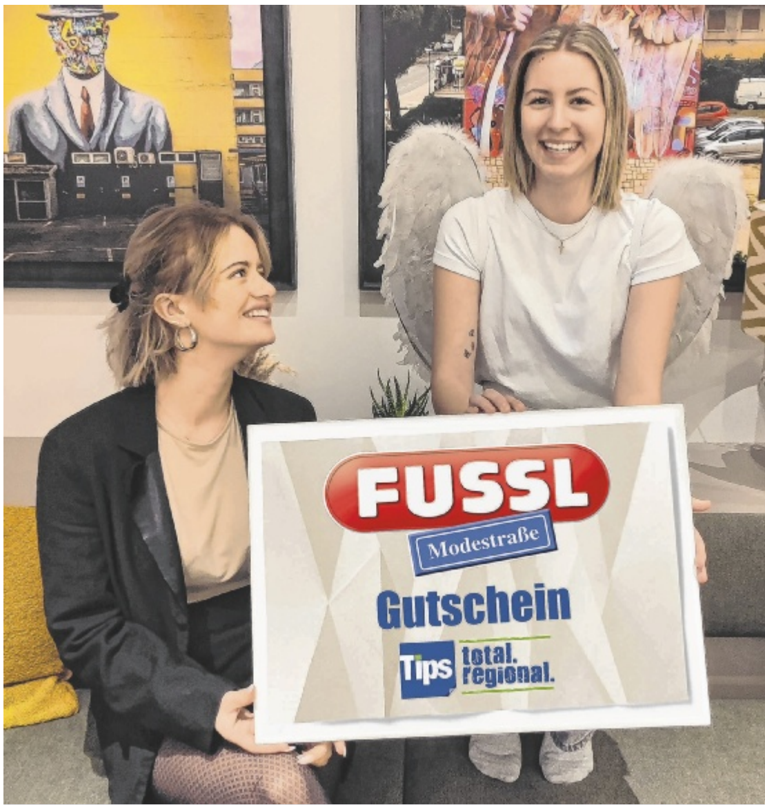
Tips-Glücksengerl Das Glücksengerl ist wieder im Anflug: Treue Leser, die auf die Frage nach ihrer Lieblingszeitung mit „Tips“ antworten, dürfen sich über Warengutscheine der Fussl Modestraße freuen. Seite 6