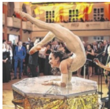
Der Ball will Jahr für Jahr besondere Höhepunkte bieten.

Schon bevor die 29. Auflage des Stadtbballs die Ballsaison einläutet, begann der Countdown mit einer besonderen Aktion: Seit Herbst sind Werke der Künstlerin Lydia Wassner im Team 7 Flagshipstore Ried zu sehen. Diese bleiben noch während der gesamten Ballsaison ausgestellt. Auch am Stadtbball werden ihre Werke den Abend schmücken. Der Ball will sich nach