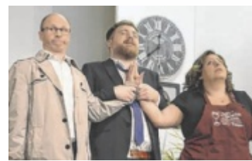
Die Komödie „Rent a Family“ verspricht Witz und Spannung.

Die Konzertbesucher erwartet ein Abend voller Emotion und eine musikalische Vielfalt wie nur selten. Mit Band und String-Quartett durchstreifen sie die gefühlvollen Lieder und „rocken“ an anderer Stelle ihr Publikum. Ein einzigartiges und außergewöhnliches Konzerterlebnis. ■