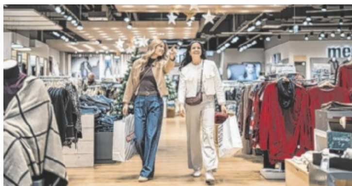
Attraktive Angebote und aktuelle Modetrends zu sensationellen Preisen: Beim WINTER SALE in der WEBERZEILE laden 50 Markenshops zum entspannten Schnäppchen-Shopping mitten in Ried ein.

Beim WINTER SALE präsentieren die Markenshops die besten Schnäppchen der Saison – perfekt, um die Garderobe mit hochwertiger und stilvoller Mode aufzufrischen. Zusätzlich sorgen attraktive Aktionen aus den Bereichen Sport, Elektronik, Drogerie, Deko und weiteren Branchen für noch mehr Shopping Vielfalt. So erwartet alle Kunden ein besonderes Erlebnis voller Trends, Inspiration und un-