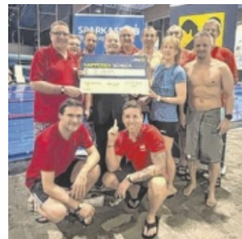
Die Schwimmer unterstützten das Kinder- und Jugend- schutzhaus.

„Diese wichtige Einrichtung unterstützt Kinder und Jugendliche in schwierigen Lebenssitua-