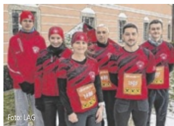
Läufer der LAG Genböck Haus Ried waren bei Silvesterläufen erfolgreich.