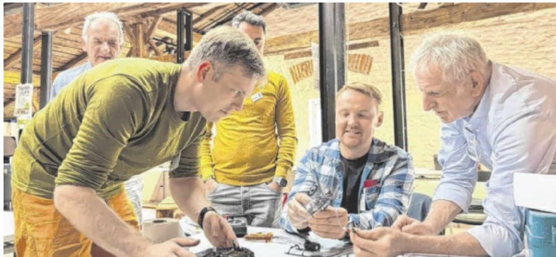
Beim Repair Café wird getüftelt und geschraubt.

Besonders gut entwickelte sich der Bereich der Fahrradreparaturen, der sich dank des Formats Repair Café „on tour“ mehr als verdoppelte. Auch Textilien waren mit 76 Reparaturen und Upcycling-Projekten sehr gefragt. Ein weiterer Meilenstein war der deutliche Zuwachs bei den Besucherzahlen. Insgesamt konnte das Rieder Repair Café im Jahr 2025 mit 620 Personen über 37 Prozent mehr Besucher begrüßen als im Vorjahr. Dieser Anstieg ist vor allem auf zahlreiche Kooperationen zurückzuführen (von Kleidertausch über Zeitbank bis zum Klimakasperl der KEM). Dadurch wurden neue Zielgruppen angesprochen. Neben den messbaren Zahlen spielen für das Repair Café auch der soziale und pädagogische Aspekt eine zentrale Rolle. „Das gemeinsame Reparieren fördert den Austausch zwischen den Generationen, schafft Begegnungs-