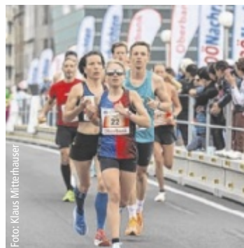
Jährlich sind tausende Teilnehmer beim Oberbank Linz Donau Marathon.

Seit 2002 steht der Linz Marathon für pure Bewegungsfreude und sportliche Begeisterung. Mit bis zu 20.000 Teilnehmern zählt er zu den größten Highlights im Laufkalender. Die dichte Zuschauerkulisse entlang der Strecke, vorbei an den schönsten Plätzen der Landeshauptstadt, sorgt Jahr für Jahr für eine außergewöhnliche Stimmung. Alle Infos sowie die Anmeldung gibts unter www.linzmarathon.at .