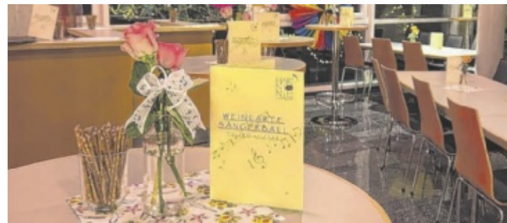
Der Gesangsverein „Harmonie mit Esprit“ veranstaltet einen Ball.

ePaper, Gewinnspiele und vieles mehr auf www.tips.at