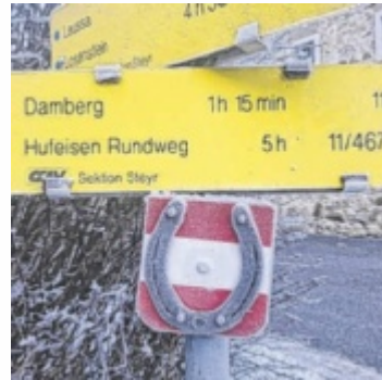
Gut (und originell) markiert ist der Hufeisenweg.