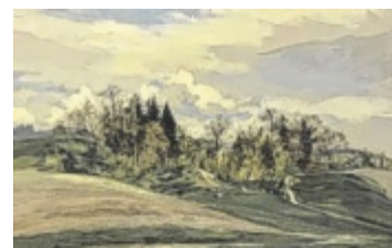
Eine Besonderheit: ein Landschaftsbild der Malerin Emmy Woitsch

Samstag, 31. Jänner Leitner Gut, Ort Einlass ab 19 Uhr / ab 29,90 Euro