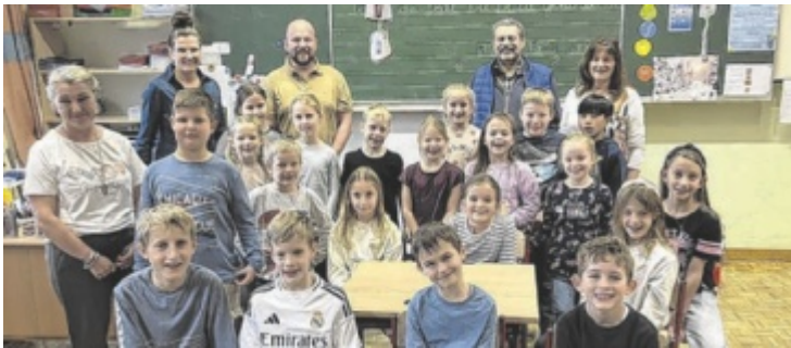
Die Schüler freuen sich über die neuen Schulmöbel.

EBERSCHWANG. Die Gemeinde setzt einen weiteren wichtigen Schritt zur Verbesserung der schulischen Infrastruktur. Für die Klassenräume wurden 30 neue Stühle sowie acht neue Tische angeschafft. Die Investitionssumme beläuft sich dabei auf rund 6.700 Euro. Darüber hinaus wurde in die Ausstattung der Klassenräume investiert: Für die Klasse 3a sowie den Gruppenraum 1 wurden zwei neue Flügeltafeln im Wert von etwa 3.600 Euro angekauft. Auch der Turnunterricht profitiert von Neuerungen – insgesamt 25 neue Schulturnmatten im Gesamtwert von rund 4.600 Euro sorgen künftig für mehr Sicherheit und Komfort. Besonders erfreulich ist die gute Zusammenarbeit mit dem ÖTB Eberschwang, der sich an den Kosten für die Turnmatten zur Hälfte beteiligt. ■