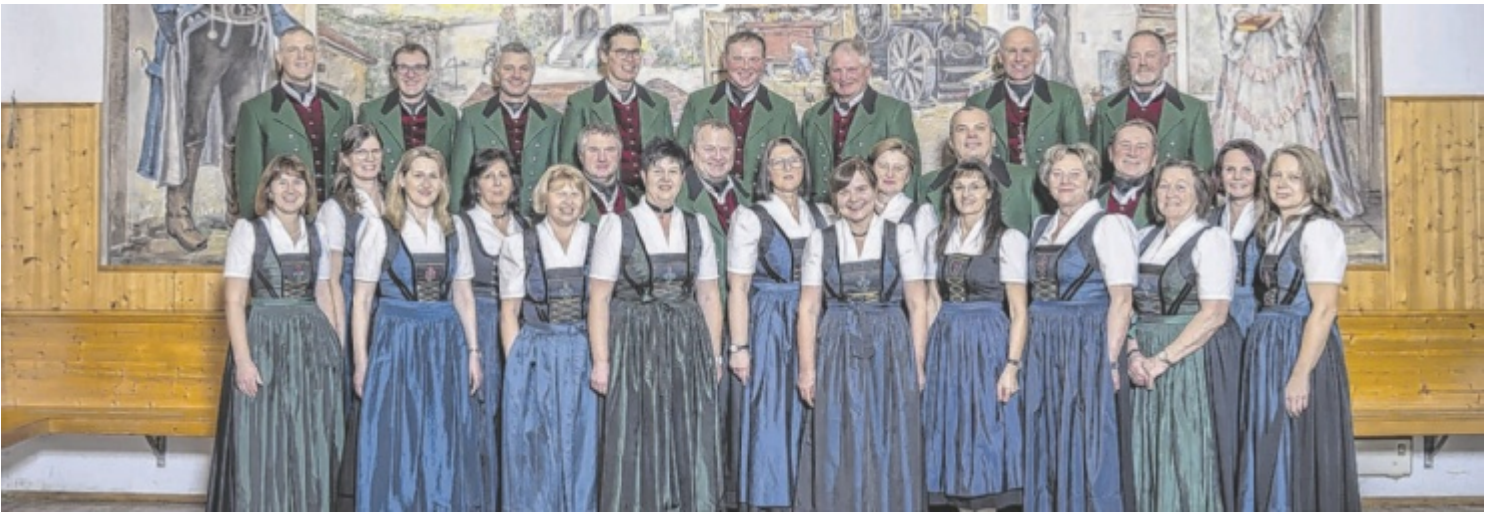
Gruppenfoto mit der Volkstanzgruppe Waldzell im Saal des Gasthauses Schachinger