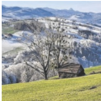
Herrliche Fernblicke beim Abstieg vom Damberg