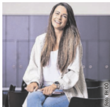
Masterstudium an der FH Oberösterreich

Die Gründe für ein Masterstudium sind unterschiedlich: persönliche oder akademische Weiterentwicklung, fachliche Vertiefung und praxisnahe Forschung, bessere Karrierechancen oder ganz einfach persönliches