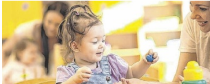
Die Arbeiterkammer Oberösterreich fordert mehr Investitionen in die Kinderbetreuung.

15 von 36 Gemeinden aus dem Bezirk Ried haben mitgemacht. Das erhobene Kinderbildungs- und -betreuungsangebot wird auf die drei Kriterien Öffnungszeiten, Mittagessen und Schließzeiten für die jeweilige Altersgruppe (Unter-Dreijährige, Drei- bis Sechsjährige, Volksschulkinder) überprüft. Daraus ergibt sich eine Bewertung zwischen Kategorie