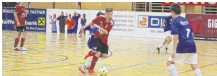
88 Mannschaften kämpfen um den Titel.

Hinter den Kulissen sorgen sechs engagierte Fußballvereine aus den insgesamt 22 Mitgliedsvereinen des Bezirkes für einen reibungslosen Ablauf. Sie stellen Hallensprecher, Schiedsrichter und kümmern sich um die Verpflegung am Buffet.