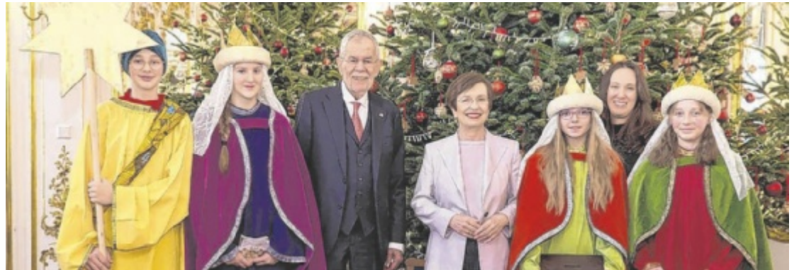
Sternsingerinnen aus Kremsmünster im Spiegelsaal der Hofburg mit Bundespräsident Alexander Van der Bellen.

Für die erfahrene Sternsingerinnen-Gruppe aus Kremsmünster war die Begegnung ein einmaliges Erlebnis. „Für mich war es sehr interessant, so viele Sternsinger an einem Ort zu sehen und