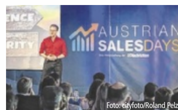
Top-Speaker treffen Vertriebsprofis.

Das Event widmet sich den aktuellen Herausforderungen im Vertrieb: Wie verändert Künstliche Intelligenz den Verkaufsprozess? Welche psychologischen Faktoren entscheiden über Kaufentscheidungen? Und wie gelingt Beratung in Zeiten steigender Kundenerwartungen? Die Vorträge und Masterclasses decken das gesamte Spektrum moderner Vertriebsthemen ab: Von digitaler Lead-Generierung über Kommunikationspsychologie bis zu zeitgemäßen Abschlusstechniken. Alfred