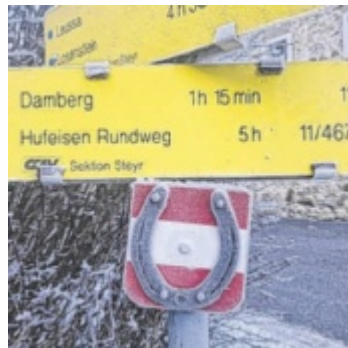
Gut (und originell) markiert ist der Hufeisenweg.