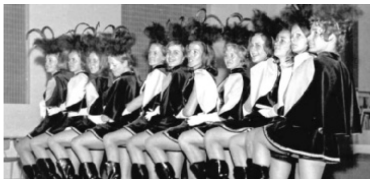
In den Siebzigern und Achtzigern stand die „Turneredoute“ stets unter einem klingenden Motto, von „Moulin Rouge“ bis „Petersburger Schlittenfahrt“.