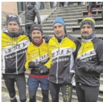
Quartett von der Laufgemeinschaft Kirchdorf beim traditionellen Silvesterlauf in Peuerbach.