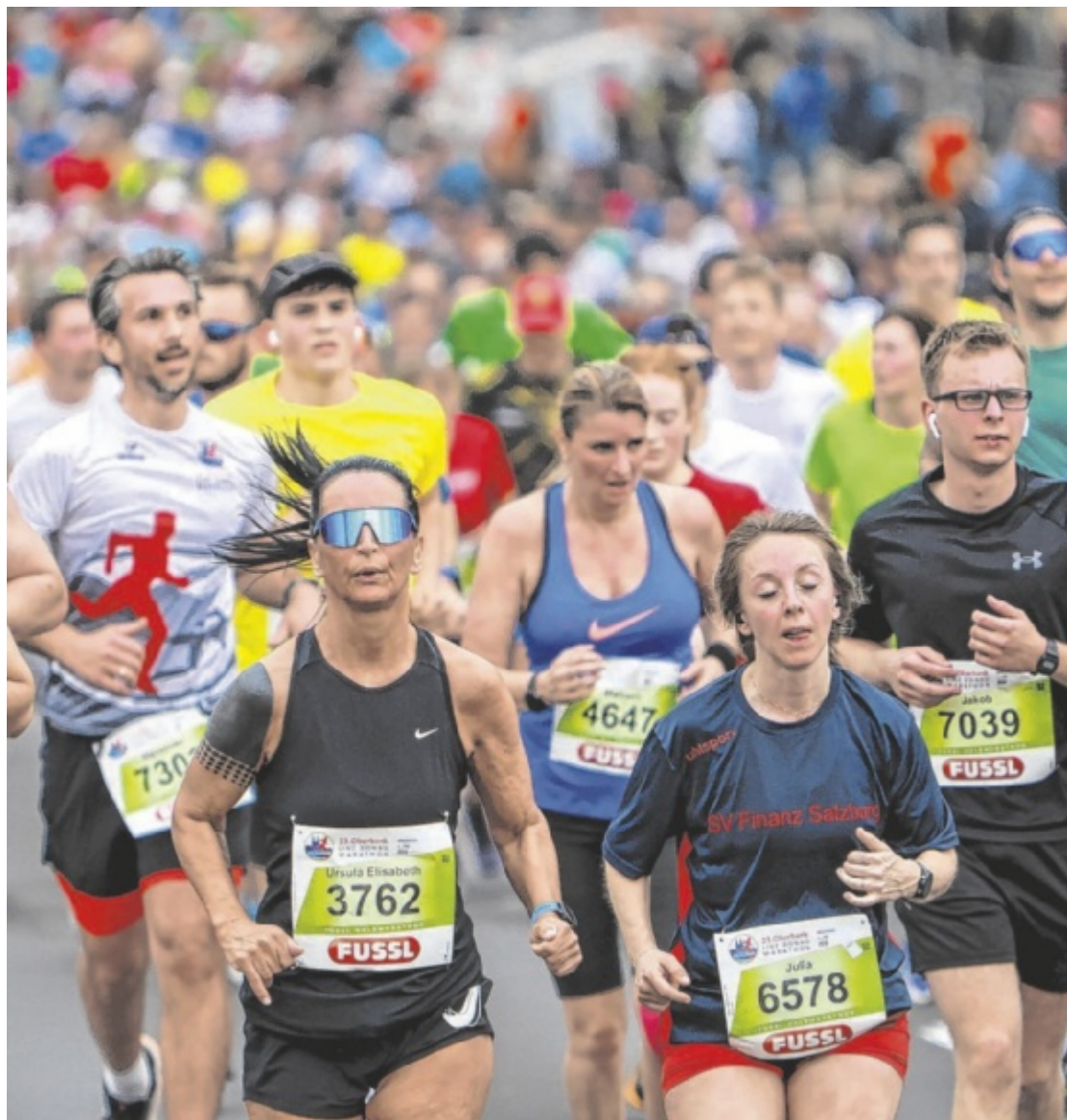
Marathon Der Oberbank Linz Donau Marathon ist auch für Laufbegeisterte aus dem Bezirk Kirchdorf ein Fixpunkt. Der Startschuss für die 24. Auflage fällt heuer am 12. April. Tips verlost 35 Startplätze. Seite 19