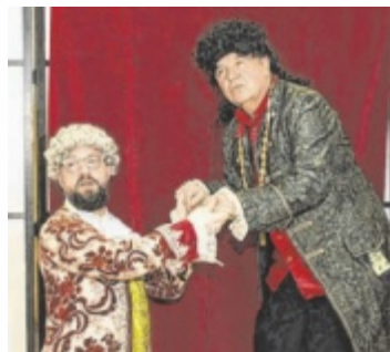
Das Peuerbacher Schlosstheater spielt Molières „Tartuffe“.