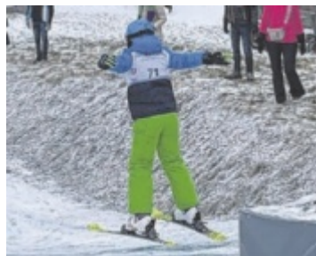
Erste Flugversuche beim Schanzenfest in Hinzenbach