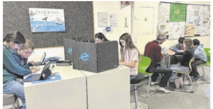
Im Lernbüro arbeiten die Schüler selbstständig.

blemlösungskompetenz der Jugendlichen. Der WERT-Zweig stärkt Persönlichkeitsentwicklung, soziale Verantwortung und kreative Ausdrucksformen – ergänzt durch vertiefte Englischförderung für eine sichere Kommunikation in einer globalen Welt. Am Freitag, 9. Jänner, lädt die TNMS Eferding Nord zum Tag der offenen Tür. ■