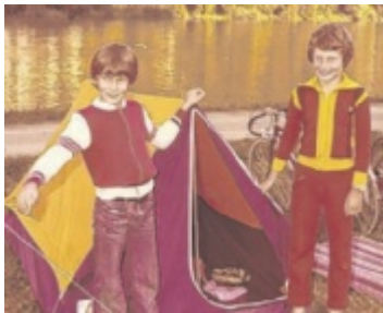
Zeltlager Exlau 1979