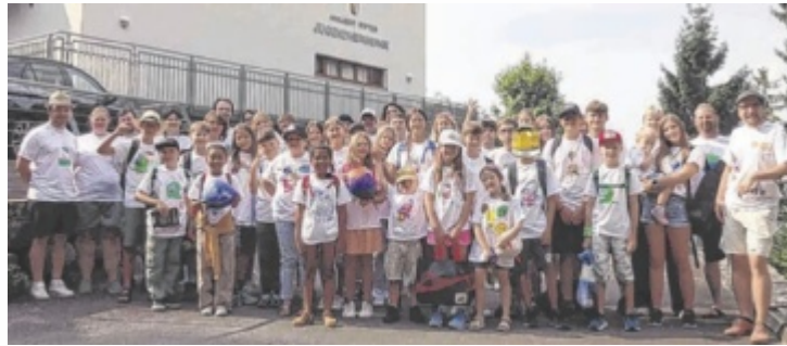
Ferienlager Aigen 2025