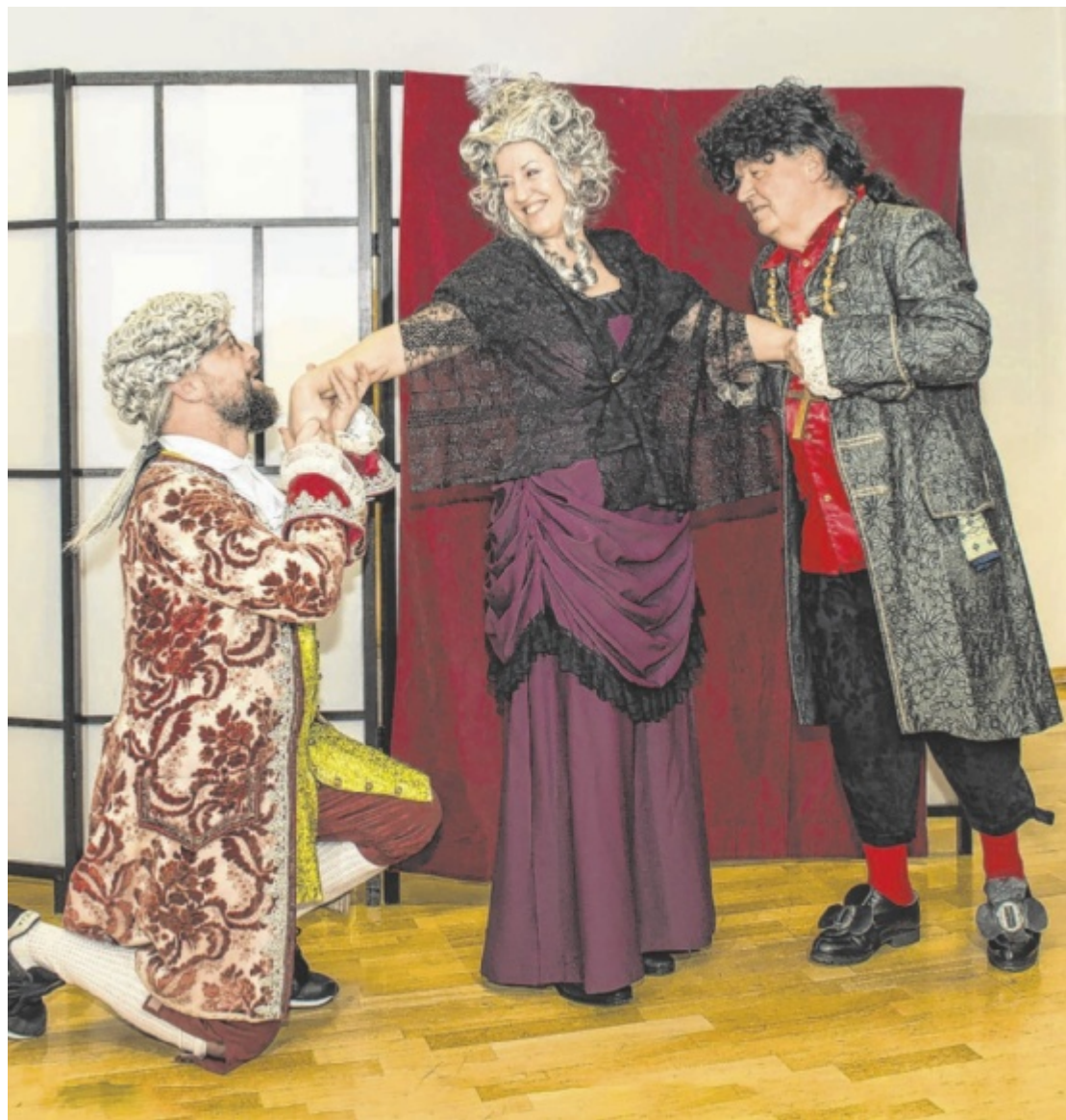
Schlosstheater Im Melodium Peuerbach wird ab Ende Jänner wieder Theater gespielt: Das Schlosstheater präsentiert Molières „Tartuffe“. Tips verlost 1 x 2 Karten für die Premiere am Freitag, dem 30. Jänner. Seite 19 / Foto: Helmut Krüger