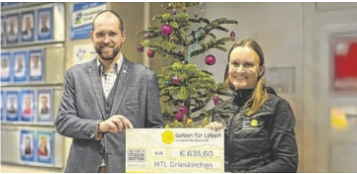
Spendenübergabe in der HTL Grieskirchen an „Geben für Leben“

Derzeit hat die Wintersaison mit den zahlreichen befristeten Arbeitslosmeldungen, überwiegend aus dem Bau- und Baunebengewerbe, den Arbeitsmarkt im Griff. Der Bezirk Grieskirchen hält sich dennoch mit einer Arbeitslosenquote von 4,6 Prozent auf Rang drei in Oberösterreich. Das Bundesland beendet als Einziges das Jahr mit einer rückläufigen Arbeitslosigkeit und mit der niedrigsten Arbeitslosenquote aller Nicht-Saison-Bundesländer (6,3 Prozent für Oberösterreich, im Vorjahr 6,4 Prozent), berichtet Barbara