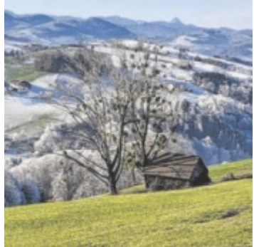
Herrliche Fernblicke beim Abstieg vom Damberg