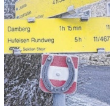
Gut (und originell) markiert ist der Hufeisenweg.

Vom Parkplatz beim ehemaligen Gasthof Hammermeister – etwa 200 Meter nach dem Gasthof Weidmann – markiert ein Hufeisen mit rot-weiß-roter Wegmarkierung den Einstieg in den Hufeisenrundweg, für den insgesamt rund fünf Stunden Gehzeit vorgesehen sind. Der Damberg mit seiner markanten Warte ist über den Weg Nr. 11 in etwa einer Stunde und 15 Minuten erreichbar.