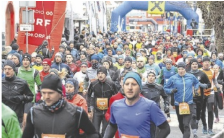
Beim Gebrüder Weiss Volkslauf waren 550 Läufer am Start.

Beim 43. Internationalen Raiffeisen Silvesterlauf in Peuerbach konnte mit 1.194 Anmeldungen und deutlich über 1.000 Finishern ein neuer Teilnehmerrekord erzielt werden. Die Bestmarke aus dem Jahr 2024 wurde noch einmal übertroffen. Im Volkslauf waren mit mehr als 550 Teilnehmern um 30 Prozent mehr Läufer am Start als im Vorjahr. Bei den Nachwuchsbewerben, die mit Starts im Fünf-Minuten-