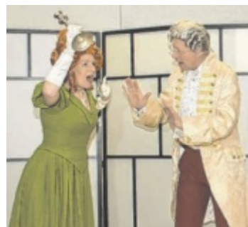
Premiere ist am Freitag, 30. Jänner.

Mitspielen bis 23.01.2026/08.00 Uhr www.tips.at/g/25664 oder SMS an 0676 8002525 Text: „25664 Vorname Nachname“