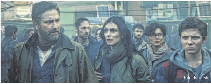
Gerard Butler schlägt sich mit seiner Familie durch ein verwüstetes Europa.