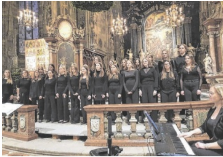
Die Chorifeen waren unter anderem im Wiener Stephansdom zu Gast.