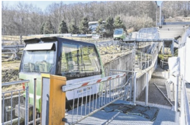
Seilbahn und Sommerrodelbahn werden endgültig abgerissen.

Nach Jahren des pandemiebedingten Stillstands gab es intensive Bemühungen um einen möglichen Neustart – leider erfolglos. Anfang 2025 wurde ein letzter medialer Aufruf zur Findung eines neuen Betreibers gestartet. Daraufhin meldeten sich zwei Interessenten aus völlig unterschiedlichen Metiers. Laut Beschluss des Gemeinde-