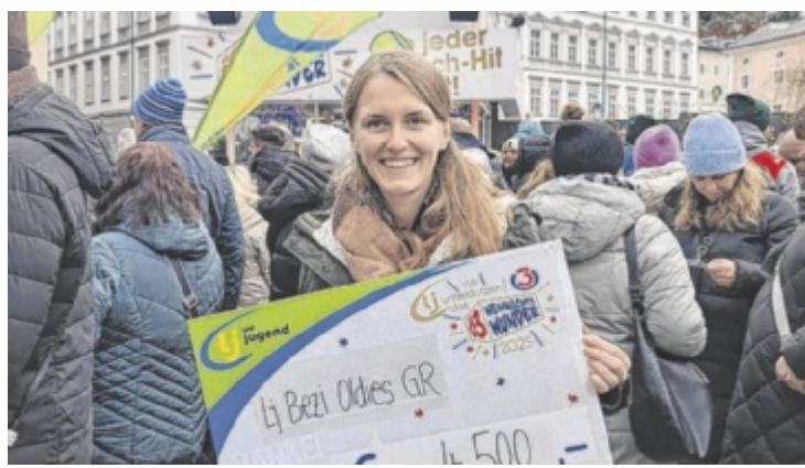
Ein Scheck aus dem Bezirk Grieskirchen in Salzburg