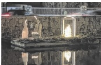
Die schwimmende Weihnachtskrippe in Freistadt

Jetzt als Gemeindereporter Geschichten teilen auf www.tips.at/gemeindereporter