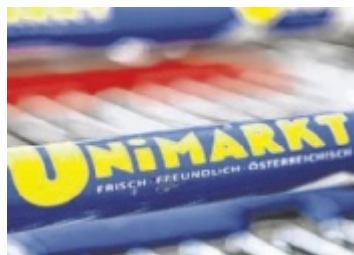
Unimarkt verschwindet auch aus der Marktgemeinde Liebenau.