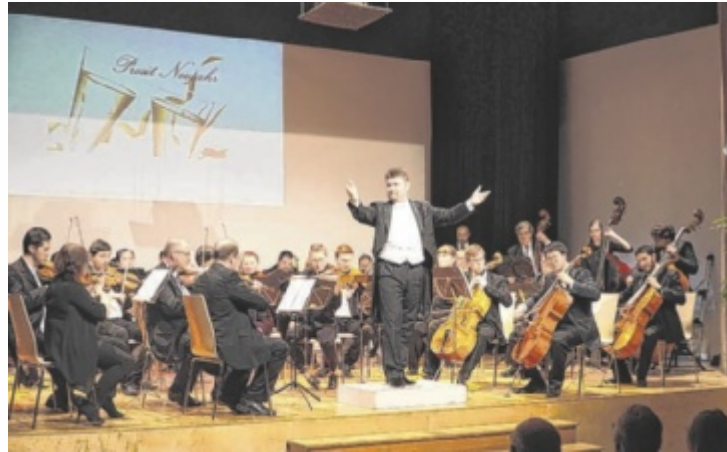
Ein abwechslungsreiches Programm präsentiert das Kammerorchester Münzbach bei drei Konzerten im Jänner.