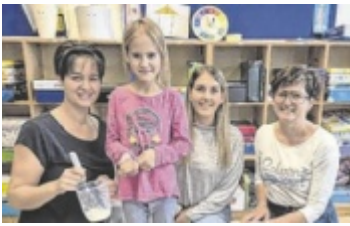
Besuch in der VS Pregarten