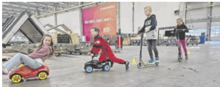
„Zeit zum Glühen“ bei Innovametal