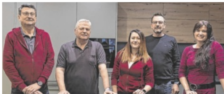
Das DANKÜCHEN-Team in Rohrbach

Qualitätsansprüche mit einem starken Preis-Leistungsverhältnis. Ein großer Vorteil: Mühsames Selbst-Zusammenschrauben von Einzelteilen – wie bei anderen Anbietern oft erforderlich – entfällt, denn die Kunden erhalten ihre Küchenmöbel fertig zusammengebaut in bewährter DAN-Qualität. Das Schnelllieferservice in nur drei Wochen ist ein zusätzliches Plus, denn die DAN FIRST Serie wird – wie alle Produkte von DANKÜCHEN – vor Ort in Oberösterreich hergestellt, und das garantiert kurze Lieferzeiten.