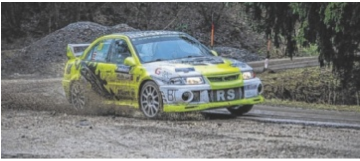
Die Sportunion Windhaag betreut die Actionzone auf der SP 2 und 4.