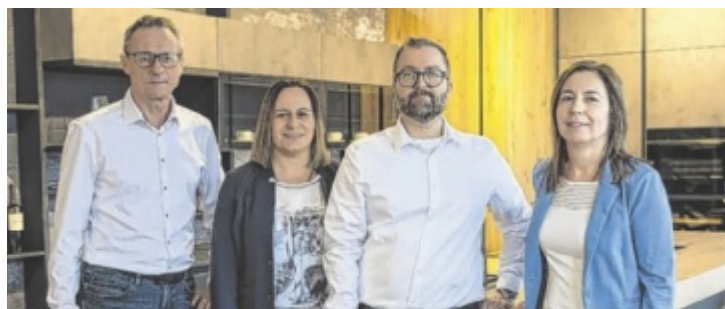
Das DANKÜCHEN-Team in Freistadt

Die neue Linie DAN FIRST ist der Einstieg in die Premium-Küchenwelt von DANKÜCHEN für alle Erstkäufer, junge Haushalte, Miet- und Übergangskunden und auch Bauträger. DAN FIRST verbindet als Einstiegslinie höchste