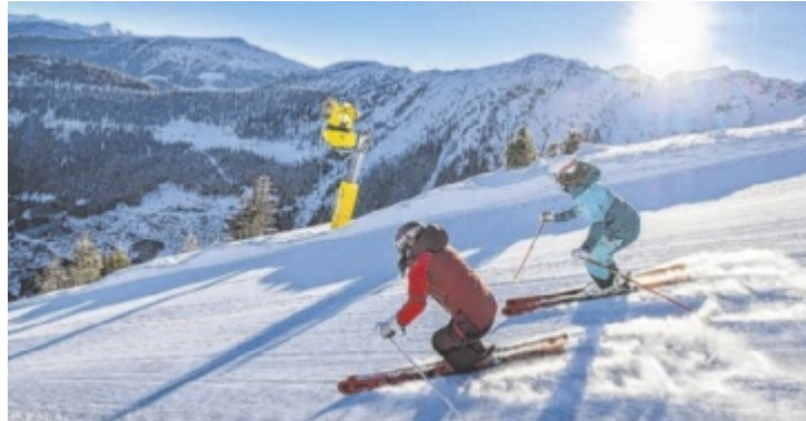
Auf die Teilnehmer wartet ein Traumtag auf und abseits der Piste.

Ein Highlight bildet die Kaiblinggrat-Achter-Sesselbahn, die als leistungsstärkste Sesselbahn der Steiermark gilt. Auch abseits der Pisten ist für Genuss gesorgt: Auf den Alm-Skihütten sowie auf der Genussinsel auf 1.800 Metern See-