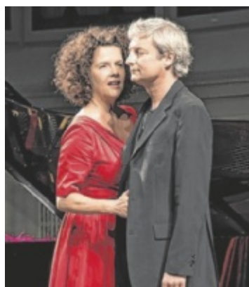
Neujahrskonzert Ein hochkarätiges Programm wird beim Neujahrskonzert auf Schloss Weinberg präsentiert. Seite 28 / Foto: Lukas Beck