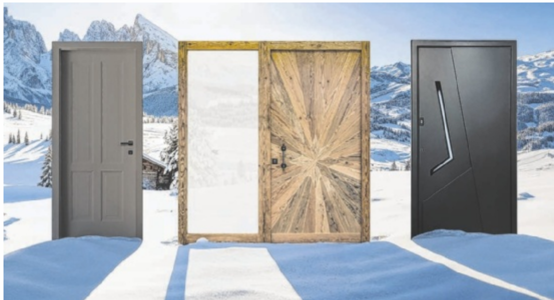
Wippro lädt von 3. bis 5. Jänner 2026 zur Neujahrs-Türen-Hausmesse 2026 nach Vorderweißbach.

Von Samstag, 3. Jänner bis Montag, 5. Jänner 2026, haben Besucher täglich von 9 bis 17 Uhr die Gelegenheit, sich direkt beim Hersteller über hochwertige Haus- und Innentüren sowie Schiebe- und Raumspartüren für Neubau und Sanierung zu informieren. Die Hausmesse bietet Inspiration, fundierte Beratung und attraktive Preisvorteile – ideal für alle, die ihr Bau- oder Renovierungsprojekt im neuen Jahr starten möchten.