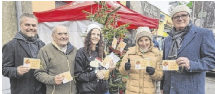
SPÖ-Bezirkspartei und Stadtpartei sammeln für CliniClowns.