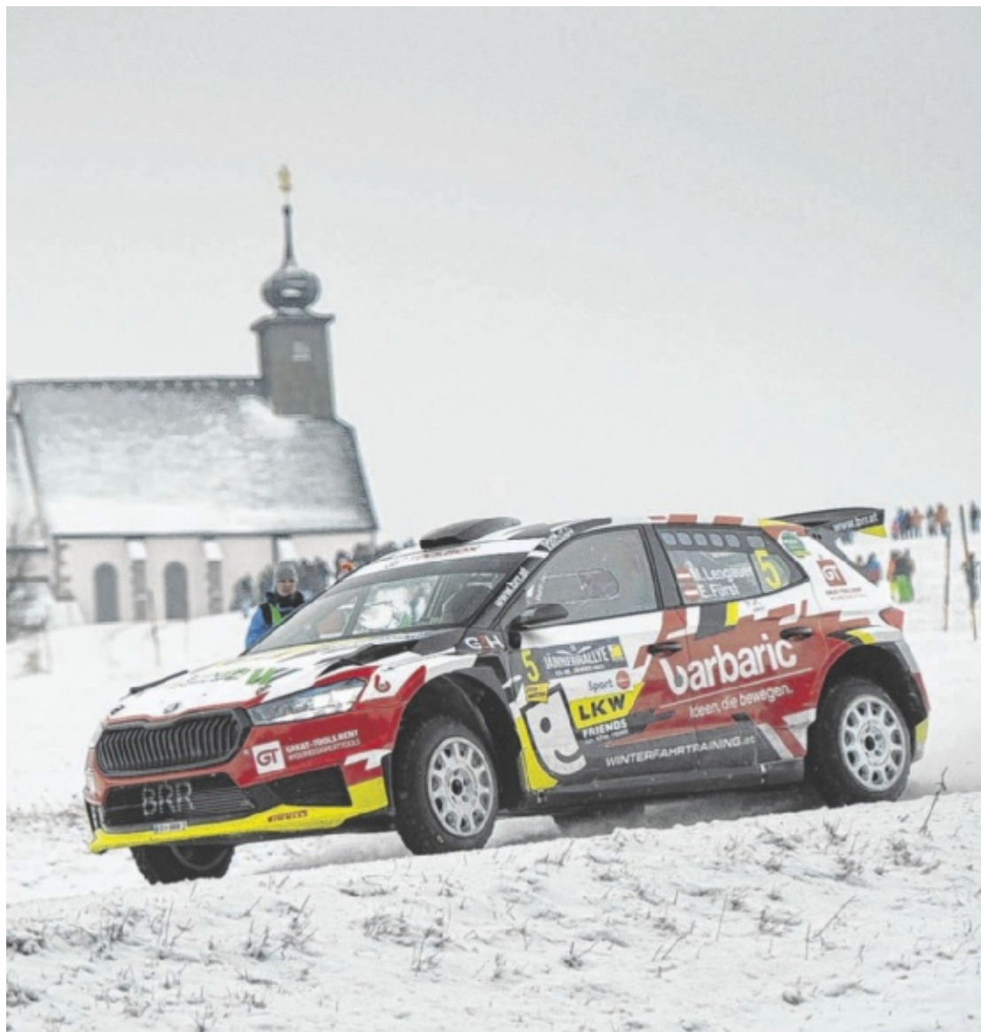
Rallye-Spektakel Tausende Zuschauer werden vom 2. bis 4. Jänner bei der Jännerrallye rund um Freistadt erwartet. 78 Teams aus sieben Ländern geben Gas und garantieren Drift-Action.