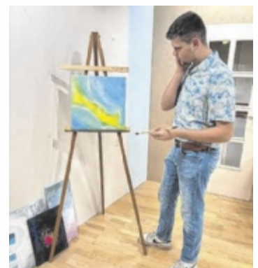
Der erfolglose Maler Lukas (Felix Langthaller) in Aktion

Der Mythos lässt die Preise steigen; Lukas und seine Frau Lisa sehen endlich ihren Traum vom eigenen Häuschen in Griffweite. Doch als die Tarnung zu platzen droht, muss Lisa ihrem Mann aushelfen. Für Lisa und Lukas bedeutet das ein Leben zwischen