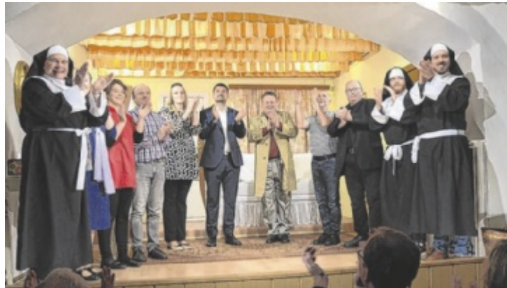
Großer Applaus nach der Premiere von „Lasst uns lügen!“

Eine atemberaubende Abfolge von treffsicher gesetzten Pointen