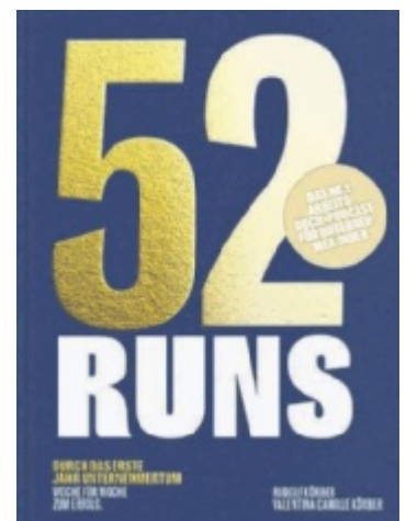
Das Buch zum Podcast von Rudolf Körber

Erfüllung entsteht, wenn Vision und Alltag nicht auseinanderdriften. Viele starten voller Energie, verlieren aber nach ein paar Jahren den Kontakt zu dem, was sie eigentlich antreibt. Dann arbeitet man nur noch „für den Laden“ – statt an den eigenen Zielen. Aus meiner Sicht braucht es drei Dinge, damit das nicht passiert: Klarheit darüber, warum man das alles macht. Strukturen, die einen nicht versklaven, sondern entlasten. Den Mut, regelmäßig neu anzufangen – Entscheidungen zu korrigieren, Dinge loszulassen und sich selbst nicht für vergangene Fehler zu bestrafen. Wenn man das schafft, kann Unternehmertum nicht nur wirtschaftlich erfolgreich sein, sondern auch persönlich wachsen lassen. Und genau dafür steht 52 Runs. ■