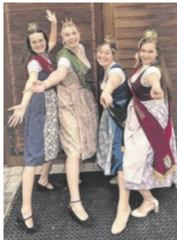
Die Mostköniginnen und Mostprinzessinnen freuen sich auf zahlreiche Bewerbungen.

In ungezwungener Atmosphäre können Fragen gestellt, Erfahrungen gehört und ein Eindruck gewonnen werden – ganz ohne Verpflichtung. Der Infoabend findet am Donnerstag, dem 4. Dezember, um 19 Uhr im Mostlandhof, Schauboden 4, 3251 Purgstall statt. Eine vorherige Anmeldung ist er-