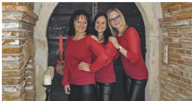
Die Formation „The Voices“ ist am 13. Dezember mit einem vorweihnachtlichen Programm im Gwölb zu Feldpichl in Neuhofen/Ybbs zu erleben.