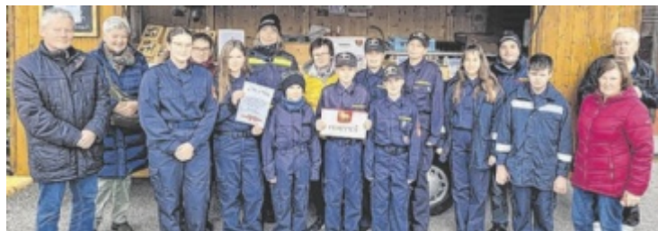
Die Freiwillige Feuerwehr Strengberg freut sich auf viele Besucher.

Feierstunde statt. Dabei werden auch die Adventkränze gesegnet. Gerti Rosenfellner wird Geschichten aus ihrem Buch „S'Christkind locht si oans“ vortragen. Die Katholische Frauenbewegung bietet im Rahmen des Pfarrkaffees von 15 bis 22 Uhr beim Adventmarkt im Gemeindezentrum eine große Auswahl an Gestecken, Kränzen und Keksen an. Der Verkauf wird am Sonntag von 8.30 bis 13 Uhr fortgesetzt. ■