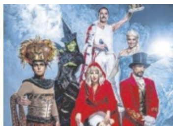
Nacht der Musicals

AMSTETTEN. Seit über 20 Jahren gastiert die erfolgreichste Musicalgala in über 150 Städten in ganz Deutschland und Österreich. Über zwei Millionen Besucher haben die Show bereits gesehen und so begeistert die Nacht der Musicals Zuschauer auch am 7. Jänner 2026 (19.30 Uhr) in der Pölz-Halle Amstetten.