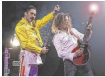
The Spirit of Freddie Mercury

„The Spirit of Freddie Mercury“ bietet eine extravagante Bühnenshow mit Lederoutfits, barocken Kostümen, Fantasieuniformen, Videoprojektionen und internationalen Top-Sängerinnen. „Queen Sensation“, eine der besten Queen Tribute Bands der Welt, erwecken Freddie Mercury zum Leben! Die Stimme – Das Gefühl – Die Leidenschaft ist das Motto der 90-minütigen Rock & Music Show mit