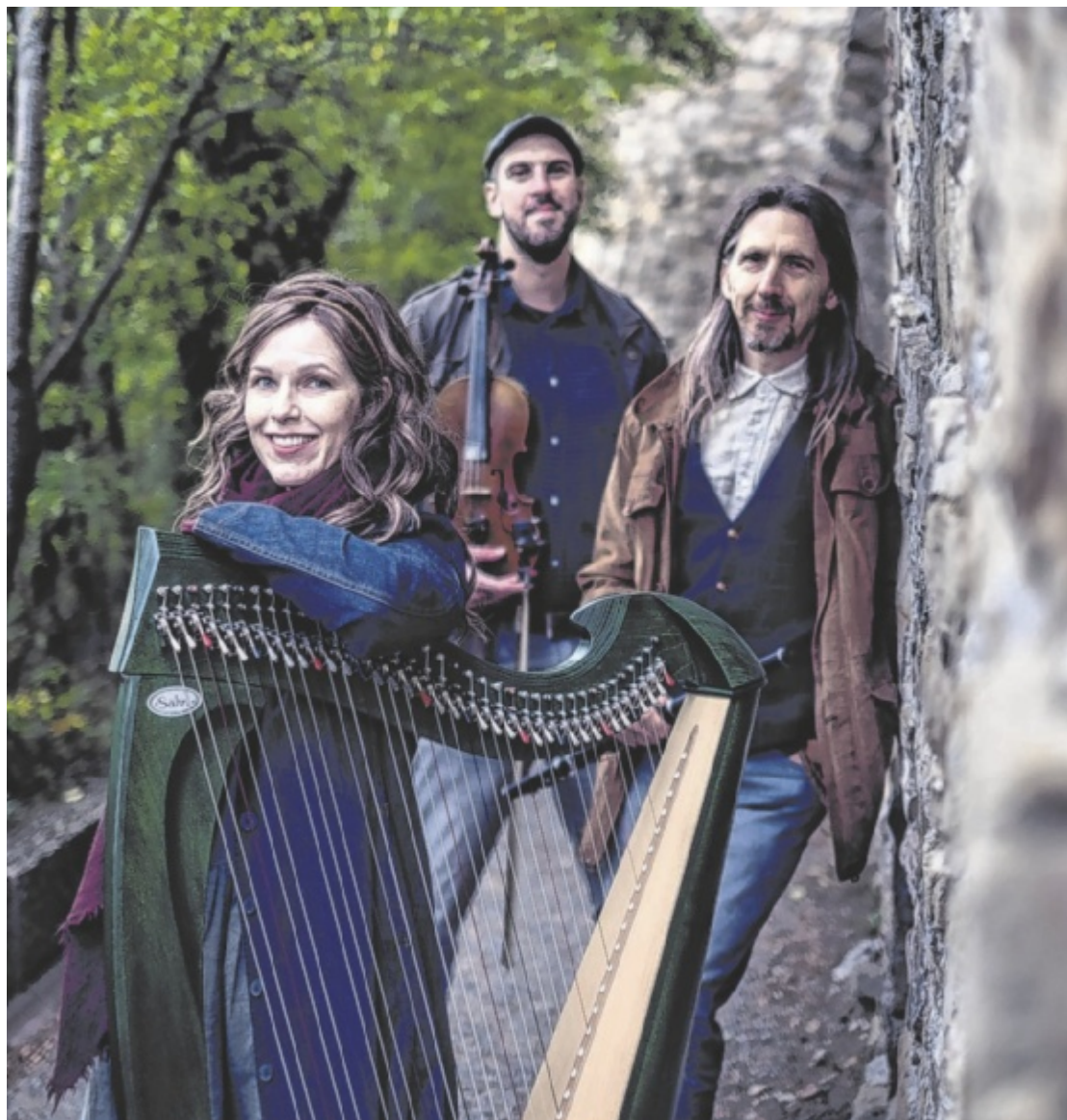
Celtic Christmas Weihnachtsstimmung mit keltischem Klang bietet das österreichische Celtic Folk Trio Spinning Wheel am 19. Dezember in Stephanshart. Im Einsatz ist unter anderem die irische Harfe. Seite 18 / Foto: Jan Lederer