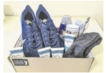
Die Pakete können bis 8. Dezember abgegeben werden.

STADT HAAG. Kinder in Osteuropa leiden im Winter unter schwierigen Bedingungen – oft fehlt es sogar an Schuhen. Die Liste für HaaG startet daher eine Sammlung, um notleidenden Kindern zu helfen.