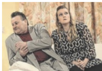
Regie: Manfred und Anna Heher

und und eine Prise Krimi-Spannung prägen das Stück „Lasst uns lügen!“ Die rasante Tür auf-Tür zu-Form erfordert von allen Darstellern präzises Timing, und das gelingt der Bühne Aschbach trefflich. Alle Darstellenden brillieren in ihren Rollen und zeigen große Spielfreude.