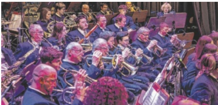
Der Musikverein lädt zum Weihnachtswunschkonzert.