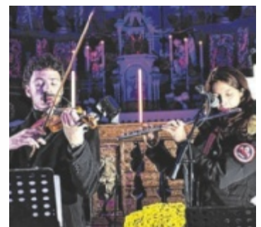
„Moments in Church“ gastierte auch in Seitenstetten

Doch „Echo der Stille“ ist kein klassisches Konzert: Es handelt sich um einen Erzählabend mit Musik, der aktuelle Themen sensibel auf-