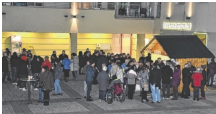
Der Laufsportclub Wolfsbach lädt am 6. Dezember zum zweiten Mal zu einer vorweihnachtlichen Ausstellung am Marktplatz ein.

ST. PETER/AU. Die Flammende Schlossweihnacht im Renaissanceschloss lädt am 29. und 30. November zum Einstimmen auf das schönste Fest des Jahres ein. Das Programm bietet für alle Generationen etwas. Rund 50 Aussteller präsentieren Kunsthandwerk, Geschenkideen und Dekoration. Besucher können sich auf eine Schmankerlroas durch den Schlosshof freuen – mit regionalen Köstlichkeiten, Mehlspeisen und wärmenden Getränken. Musikalisch umrahmen der Volksschulchor, Ensembles der Musikschule, Bläsergruppen des Musikvereins, die Jagdhornbläser sowie die Porstenberger Alphornbläser das Adventwochenende. Für die kleinen Gäste gibt es eine eigene Kinderbetreuung. Auch der Kasperl ist wieder mit dabei. ■