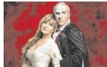
Das Phantom der Oper

Seit 2010 setzt Das Phantom der Oper neue Maßstäbe auf Europas Bühnen und wurde 2023 mit der Goldenen Sonne ausgezeichnet.