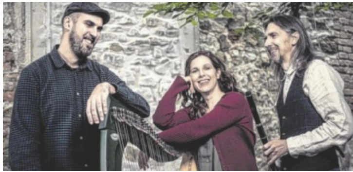
Spinning Wheel sind in Stephanshart zu erleben.

KÜRNBERG. Am ersten Adventwochenende findet im dorfHAUS Kürnberg der traditionelle Kürnberger Adventmarkt statt. Am kleinen, aber feinen Markt werden Adventkränze und Gestecke, handgemachte Weihnachtsdekorationen sowie Imkereiprodukte aus der Region angeboten. Weit über die Ortsgrenzen hinaus bekannt ist auch der Stand mit Bauernbrot, Kletzenbrot und Speck. Wie jedes Jahr öffnet auch die Volksschule in Kürnberg ihre Türen zur Buchausstellung. Besucher können dort in einer breiten Auswahl an Büchern stöbern. Öffnungszeiten der Buchausstellung: Samstag, 29. November, 9 bis 15 Uhr & Sonntag, 30. November, 10 bis 13 Uhr; Öffnungszeiten des Adventmarkts: Samstag, 29. November, 8 bis 15 Uhr & Sonntag, 30. November, 9 bis 14 Uhr. ■