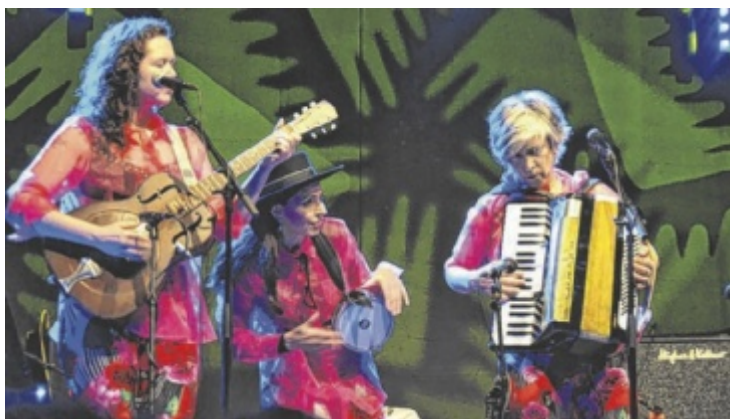
Die Vicky Christina Barcelona Band war 2024 beim ZOA-Festival vertreten.