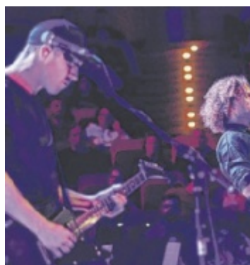
Das Orion Orchestra präsentiert Metallica-Songs im Klassik-Gewand.