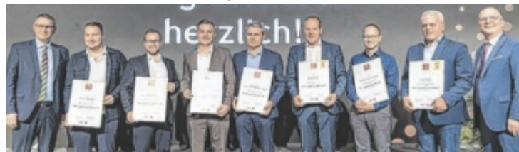
Unternehmen der Kategorie Wohnen, Haushalt und Garten