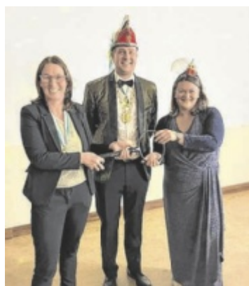
Faschingsauftakt Die Faschingsgilde Narraabia hat die Faschingsaison mit vielen Überraschungen eingeläutet. Seite 8