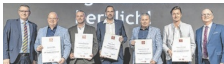
Ausgezeichnete der Branche „Mobilität“