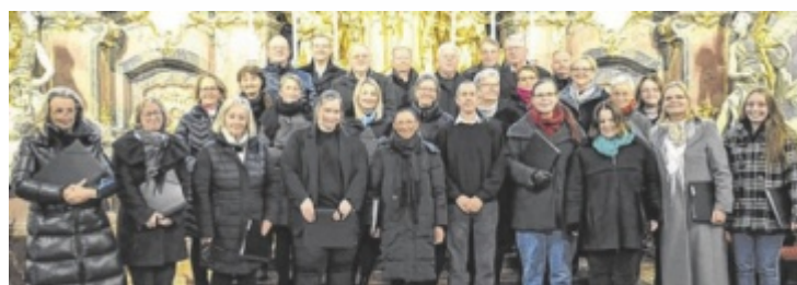
Stimmungswort wird es am 30. November wieder in der Subener Pfarrkirche.

Eigens dafür angemietet wurden die Räumlichkeiten oberhalb des Wirtshauses „Zur Bumsn“. Die Highlights sind Familienfotoshootings mit oder ohne weihnachtlichen Hintergrund. Es gibt Kaffee und Kuchen solange der Vorrat reicht. Bei einem Gewinnspiel gibt es vier Outdoor-Fotoshootings im Wert von zirka 350 zu gewinnen. Der Eintritt ist frei. ■