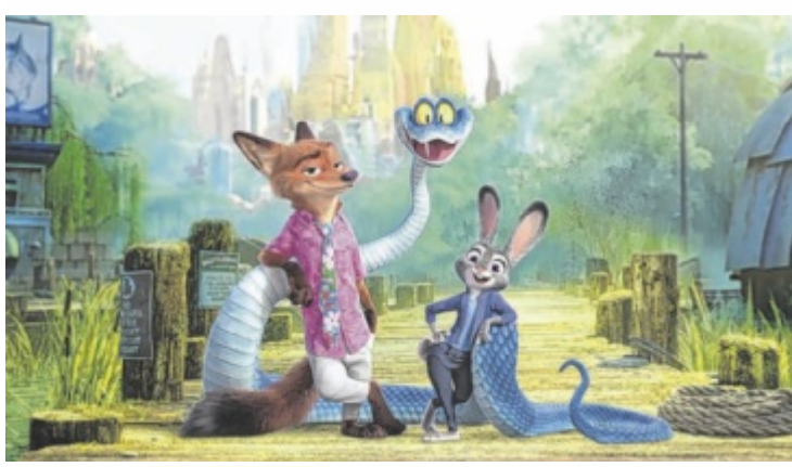
Die Partnerschaft der beiden Polizisten Nick Wilde und Judy Hopps wird bei ihrem neuen Fall auf die Probe gestellt.