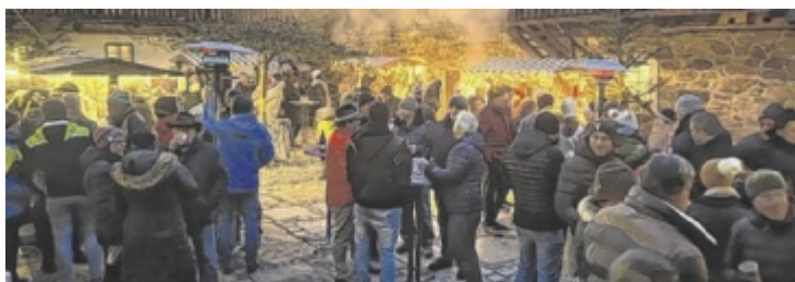
Das Alte Forsthaus bietet eine tolle Ambiente für den Weihnachtsmarkt.