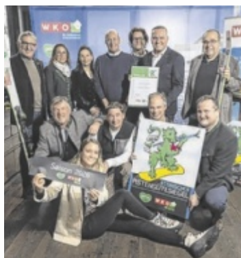
Der Hauser Kaibling wurde erneut mit dem Steirischen Pistengütesiegel ausgezeichnet.

Gleichzeitig wurde der Hauser Kaibling erneut mit dem Steirischen Pistengütesiegel ausgezeichnet. Die Verleihung am Grazer Schlossberg unterstreicht die hohe Qualität und Sicherheit des Skigebiets. Besonders gewürdigt wurde das Pistenteam, das täg-