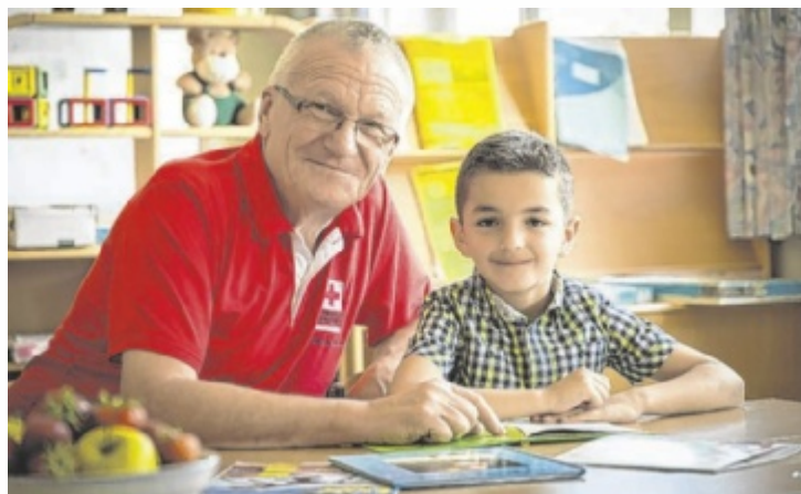
Lesecoaches und Kids arbeiten meist einmal pro Woche zusammen.

Damit soll ihnen gleichzeitig auch wieder mehr Freude an Bil- dung und Sprache vermittelt werden. Die ehrenamtlichen Le- secoaches vom Roten Kreuz arbeiten mit Volksschulkindern, die beim Lesen zusätzliche Unterstützung benötigen. Freu- de am Umgang mit Kindern, Ge- duld und natürlich auch ein biss- chen Zeit werden von den Lese- coaches verlangt. Es wird eine zweitägige Ausbildung angebo-