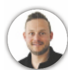
von ALEXANDER KOBLER

SCHÄRDING. Wie ein modernes Konzept aussehen muss, das alle Generationen unter einem Dach vereint und somit ein modernes Pflegemodell darstellt, wird im Kompetenzzentrum Tummelplatz in Schärding sichtbar. Weil sowohl Familien- und Sozialzentrum, Alten- und Pflegeheim sowie Vitales Wohnen Tür an Tür angesiedelt sind, kann hier Pflege neu gedacht werden und Menschen im Alter von null bis 100 Jahren zusammenbringen.