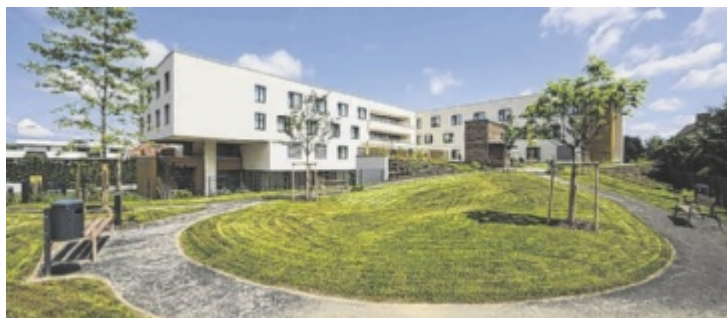
Im Kompetenzzentrum Tummelplatz in Schärding kommen die Generationen jeden Alters zusammen und pflegen einen wertschätzenden Umgang.