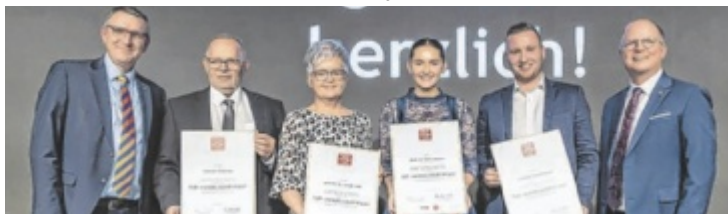
In der Kategorie Mode &amp; Lifestyle wurden diese Betriebe ausgezeichnet.