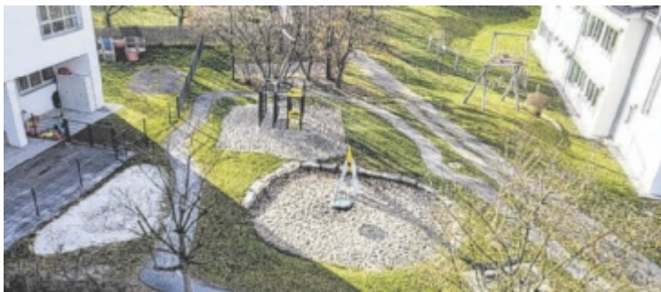
Im Frühjahr erhält der Spielplatz noch ein Karussell sowie eine Rutsche.