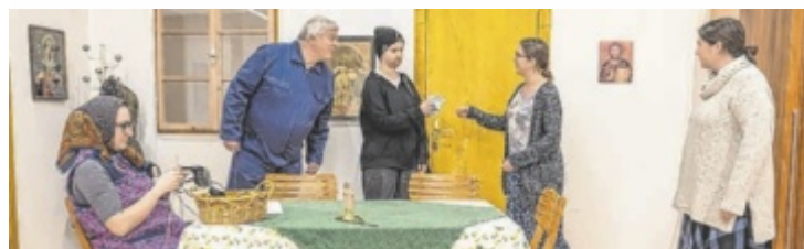
In diesem Jahr wird das Stück „Ziemlich beste Schwestern“ dargeboten.

Cafe-Bäckerei Pramtal:Bäcker Strasser-Huber GmbH 4755 Zell an der Pram | T: 07764 / 8321