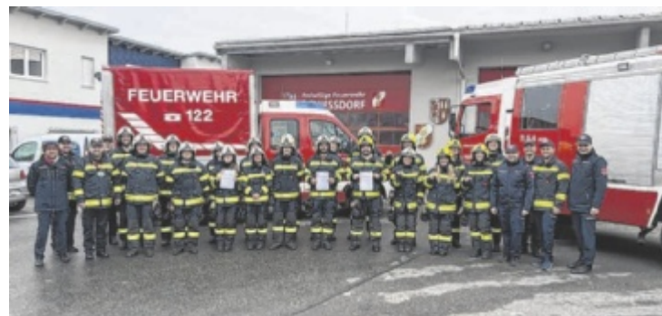
Die Kameraden meisterten die Prüfung mit Bravour.

in der Gerätekunde sowie das taktisch korrekte Vorgehen bei Löschangriff unter Beweis stellen. Dank intensiver Vorbereitung konnten alle Gruppen die Anforderungen zur vollsten Zufriedenheit erfüllen und die begehrten Abzeichen in Empfang nehmen. ■