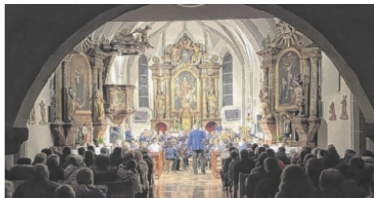
Das Konzert findet am 29. November in der Pfarrkirche statt.