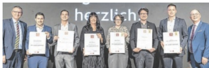
Die TOP-Handelsbetriebe der Kategorie Wellness &amp; Wohlbefinden