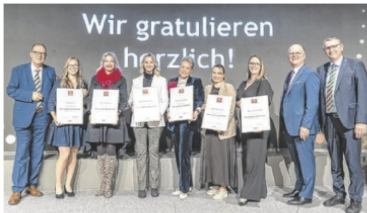
Die zertifizierten Direktberaterinnen 2025

es 150 aktiv zertifizierte Fachgeschäfte. Infos und Betriebe unter www.tophandelszertifikat.at ■