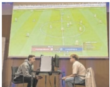
Volle Konzentration bei der OÖ Landesmeisterschaft in EA Sports FC