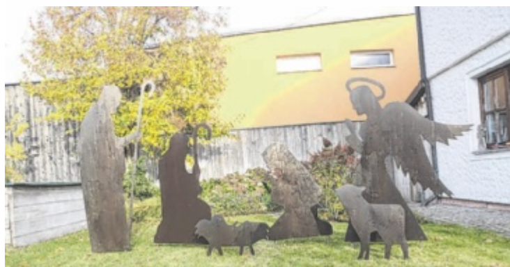
Die Krippenfiguren vor dem Pfarrhof

Eine Bläsergruppe der Jugendkapelle Schärding umrahmt diese Segnung mit Adventliedern und stimmt die Besucher musikalisch auf den Advent ein. Anschließend lädt die Pfarrgemeinde zu gemütlichem Beisammensein bei Punsch und Apfelbrot ein. ■