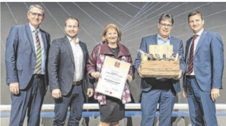
Bestes Verkaufsteam in Bronze: Gupfinger Einrichtungsstudio