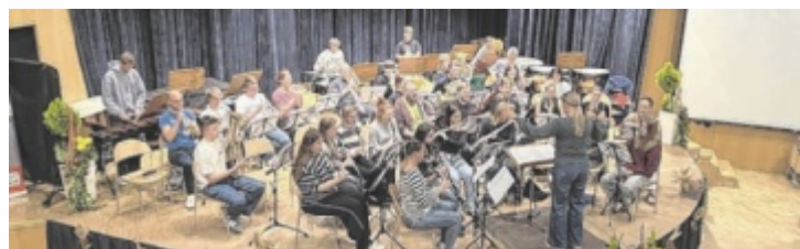
Das Schulblasorchester hat sich eigens für das Konzert formiert.

Schärding: Schlossgalerie: ...der Mond scheint auf alle Türen..., Elly Weiblen; Dauer der Ausstellung: bis 7. Dezember, Öffnungszeiten: Do - So von 14 - 17.00