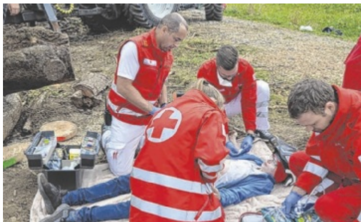
Die Rettungssanitäter leisten vor Ort Erste Hilfe.

Der erste Kurs beginnt am 28. Februar beim Roten Kreuz in Andorf und wird als Wochenendkurs durchgeführt. Der Sommerkurs startet am 13. Juli in Riedau und findet von Montag bis Freitag statt. Der dritte Kurs beginnt am 10. Oktober in Kopfing und ist als Abendkurs organisiert. Somit ist der Sommerkurs optimal für Schüler sowie für Studenten geeignet. Der Frühjahrskurs und der Herbstkurs sind hingegen optimal für Berufstätige ausgerichtet. Die Ausbildung umfasst 100 Stunden Theorie und 160 Stunden Praktikum, wobei das Praktikum flexibel und individuell eingeteilt werden