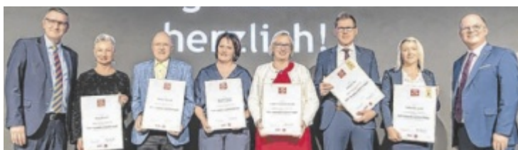
Betriebe in der Kategorie Genuss &amp; Gusto