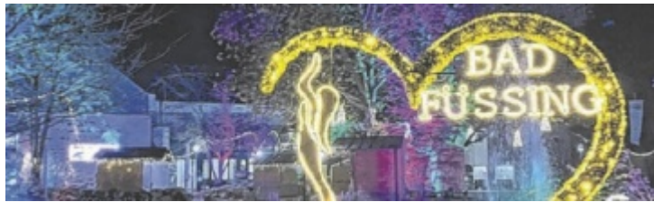
Bad Füssing lockt mit einem vielfältigen Programm.

Dort werden die Energiespender fachgerecht verwertet – Rohstoffe werden zurückgewonnen und Schadstoffe sicher entsorgt. So leisten Bürger einen wichtigen Beitrag zum Umweltschutz ■ Anzeige