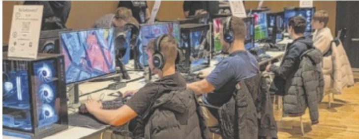
Neben Retro-Konsolen, Mario Kart, Virtual Reality, Ski- und Racing-Simulationen konnten auch neue Computer- und Brettspiele ausprobiert werden.