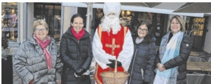
Auf dem Wochenmarkt werden gebackene Köstlichkeiten angeboten.