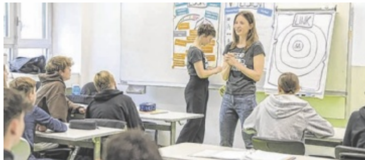
Das OÖ. Rote Kreuz lehrt niederschwellige Hilfsmaßnahmen.

Während körperliche Verletzungen meist klar erkennbar sind, bleiben seelische Wunden oft unsichtbar. Doch psychische Belastungen gehören längst zum Alltag vieler Menschen. Rund 40 Prozent haben bereits Erfahrungen mit Depressionen, Angststörungen oder Burnout gemacht. Besonders Jugendliche spüren Druck, fühlen sich unverstanden und wissen oft nicht, wohin sie sich wenden können. Genau hier setzt das OÖ. Rote Kreuz an.