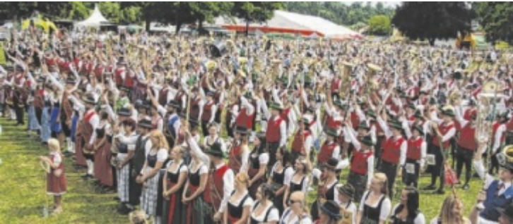
Das Jahr wurde vom großen Bezirksmusikfest Anfang Juli überstrahlt.

ZELL. Das Jahr 2025 war für den Musikverein Zell ein ganz besonderes, denn Anfang Juli war man Gastgeber des Bezirksmusikfests. Insgesamt 72 Musikvereine und knapp 8.000 Besucher kamen nach Zell, um gemeinsam zu feiern, zu tanzen und zu musizieren. Ein besonderer Höhepunkt war die Marschwertung, bei der die Zeller mit 92,55 Punkte und einer Goldmedaille belohnt wurden. Im August gab es dann ein Helferdan-