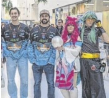
Black Wings-Spieler gemeinsam mit Cosplayern auf der Tips Game.On