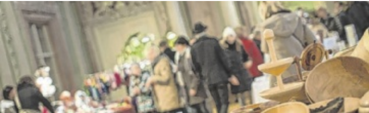
Im Schloss Zell gibt es unter anderem viel Kunsthandwerk zu entdecken.

stube im historischen Sallaberger Haus, wo die Kids etwa Kekse austechen und backen dürfen. Außerdem lädt Märchen-Margit jeweils um 14.30 Uhr zur Märchenstunde ein. Bei der Genussmeile im Innenhof können sich die Besucher mit Adventschmankerln und Punsch stärken. Vokalensembles stimmen im ganzen Schloss musikalisch auf Weihnachten ein. Der Eintritt pro Tag kostet fünf Euro, Kinder bis 15 Jahre sind frei. ■