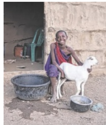
Diesmal werden Projekte in Tansania unterstützt.

Am Donnerstag, 27. November, von 17.30 bis 19 Uhr sind zwei Menschen aus Tansania in Münzkirchen im Pfarrsaal und erzählen über ihr Land, die Kultur und die Sozialprojekte mit denen Kinder, Jugendliche und deren Familien unterstützt werden. Dieser Abend bietet die Möglichkeit in direkten Kontakt mit den Menschen zu kommen, für die vielerorts Kinder und Erwachsene in der Weihnachtszeit als Sternsinger verkleidet Spen-