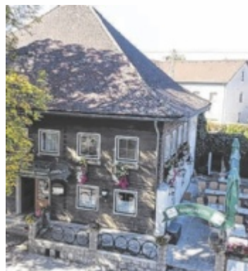
Das Gasthaus soll auch künftig zentraler Treffpunkt bleiben.

Zell soll nicht das gleiche Schicksal ereilen wie so viele andere in Oberösterreich, die ein Lied vom Wirtesterben singen können. „Daher haben wir uns im Gemeinderat entschieden, alles uns Mögliche zu tun, um dieses Gasthaus im Sinne von ganz vielen Einwoh-