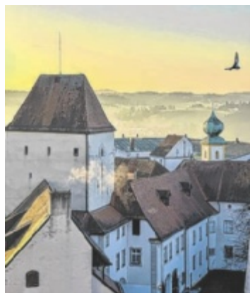
In den Weihnachtsferien bietet das Museum viele Führungen an.

Im Museum stehen der Nikolaus und weitere Heilige, verschiedene Weihnachtsbräuche und historische Objekte im Mittelpunkt, darunter ein geheimnisvolles goldenes Pferd. Die Führungen