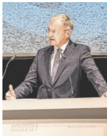
Landeshauptmann Stelzer (VP)

Rund zwei Drittel der befragten OÖVP-Mitglieder sind laut Umfrage ehrenamtlich in verschiedensten Bereichen tätig. Aber auch das Ehrenamt kommt nicht ohne