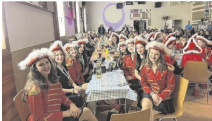
Das neue „Narrenchloss“ war zum großen Faschingsauftakt in Raab sehr gut gefüllt.

Eröffnet wurde der Abend mit einem Auftritt der neu gebildeten Jugendgarde, bestehend aus 14 Mädels. Auch die Prinzengarde darf sich über fünf neue Gardemädels freuen. Insgesamt zieht die Raaber Faschingsgilde mit 25 Gardemädchen in die närrische Saison. Mit dem „Raaba, Raaba Bier“ wurde auch ein neues Faschingsbier kreiert. Es entstand gemeinsam mit der Brauerei