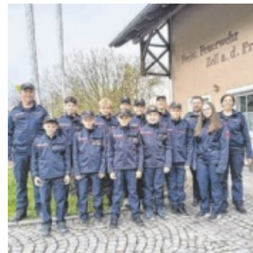
Die Jugendgruppe mit den Ausbildern