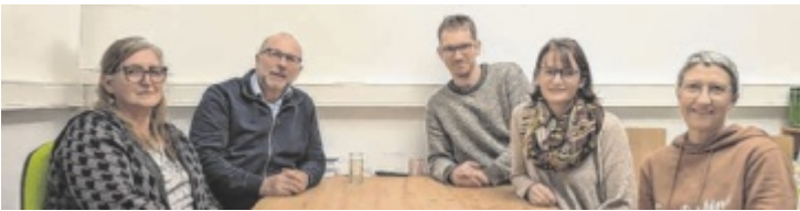
Das Kernteam beschloss das Aus der Vereinstätigkeit.