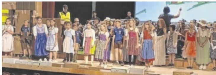
Die Volksschule Großbraming griff gemeinsam mit dem Musikverein Pechgraben das Thema unfairen Wettbewerbs bzw. Steuerparadiese im Ausland auf.