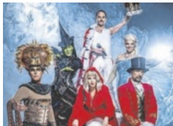
Musical-Highlights in Steyr

STEYR. Seit über 20 Jahren gastiert die erfolgreichste Musicalgala in über 150 Städten in ganz Deutschland und Österreich. Über zwei Millionen Besucher haben die Show bereits mehrfach gesehen, und so begeistert die Nacht der Musicals Zuseher auch am 6. Jänner 2026 (20 Uhr) im Stadttheater Steyr.