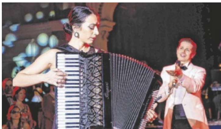
Musik nimmt mit auf eine Reise in die Seele.

LOSENSTEIN. Die örtlichen Bibliothekarinnen veranstalten am 15. und 16. November wieder eine Buch- und Spieleausstellung im Pfarrzentrum von Losenstein. Die Besucher können in Ruhe stöbern, entdecken und dabei regionale Fachhändler unterstützen. Im Mittelpunkt stehen Bücher, Gesellschaftsspiele und kreative Geschenkideen für Weihnachten. Die Buchhandlung Ennsthaler aus Steyr und die Spielhandlung Ebner aus Bad Hall stellen eine vielfältige Auswahl zur Verfügung. Ein Bestseller-Tisch bietet zusätzliche Inspiration. Auch eine persönliche Beratung ist möglich. Die Ausstellung öffnet am Samstag von 16 bis 19.30 Uhr und am Sonntag von 9 bis 12 Uhr. Der Eintritt ist frei. ■