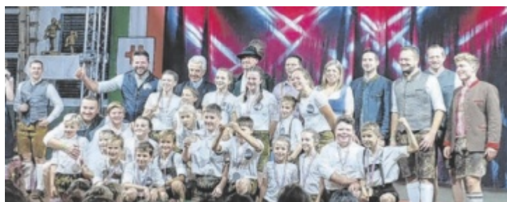
Die Gaflenzer Kindergruppe holte den zweiten Platz.