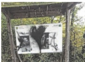
Tafel am „BlickWinkelWeg“