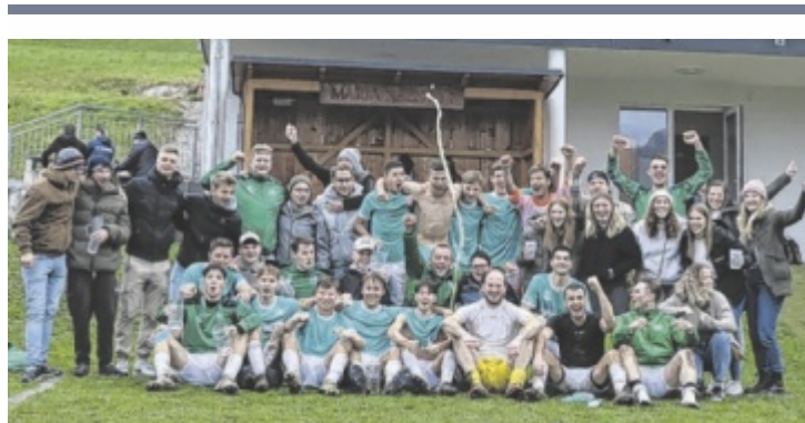
Damen und Herren der Union Maria Neustift feierten gemeinsam.