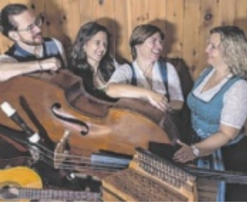
Das Ensemble „ZechFreiStil“

Weyer, Prevenhuberhaus, Marktplatz 6: "Grüne Enns" von Denes Bogdany; Dauer: 18. Oktober bis 23. November; Öffnungszeiten: Sa/ So 11 - 16.00