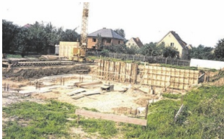
Kirche und Pfarrsaal am Tabor wurden zwischen 1972 und 1975 errichtet.

Nach dem Zweiten Weltkrieg dehnte sich Steyr immer mehr nach Norden aus. In der Folge war die Pfarre St. Michael überfordert. 1962 wurde eine Kasernenbaracke am Tabor für Gottesdienste errichtet. Als dann die Wohnblöcke in der Puch-, Porsche- und Resselstraße erbaut