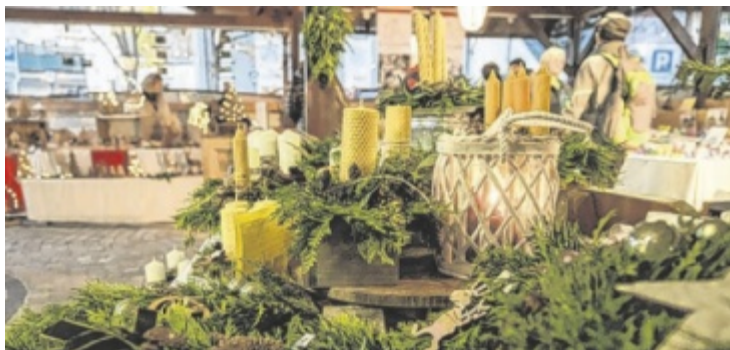
Kunst, Handwerk und Co. sorgen für stimmungsvolles Ambiente.