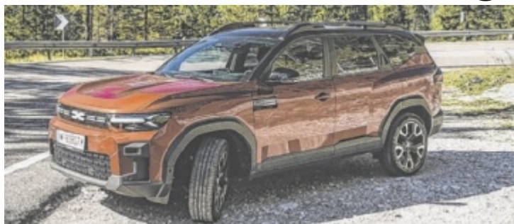
Der Dacia Bigster Hybrid 155 Journey ist ab 29.990 Euro zu haben.

Der Bigster ist die logische Fortsetzung dieser Strategie. Wer ihn als größeren Duster betrachtet, liegt richtig: Optisch ähneln sich die beiden, doch der Bigster wirkt durch sein deutliches Plus an Länge und Höhe wuchtiger und präsenter. Dazu passen die erstmals bei Dacia erhältlichen 19-Zoll-Alufel-