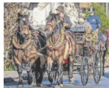
Festlich geschmückte Pferde und Reiter beim Leonhardiritt