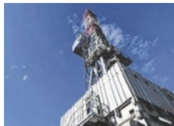
ADX darf nach einem Gerichtsurteil die Arbeiten in Molln fortsetzen.

Für die erste Jahreshälfte 2026 plant ADX zudem drei weitere Erdgas-Probebohrungen südlich von Wels und Ried im Innkreis. Die Bohrungen sollen mit maximalen Tiefen von etwa 1.100 Metern und einer Bohrzeit von jeweils rund zwei Wochen durchgeführt werden. In der zweiten Jahreshälfte 2026 ist eine Ölfeld-Erkundung (SGB-1) nahe des bestehenden Erdölfeldes Anshof vorgesehen.