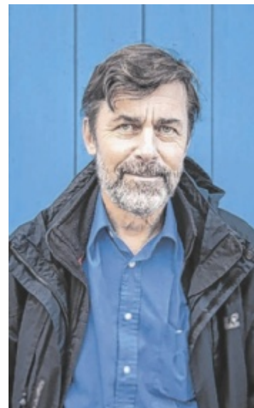
Peter Stamm

Der vielfach preisgekrönte Schweizer Autor kommt am Samstag, 15. November, um 20 Uhr für eine seiner eher seltenen Lesungen in Österreich in den Pavillon der Landwirtschaftlichen Fachschule Schlierbach – mitbringt er seinen Erzählband „Auf ganz dünnem Eis“. Stamm gehört zu den bekanntesten Stimmen der Gegenwartsliteratur. Sein druckfrisches Werk (erschienen am 8. Oktober) handelt von Neuanfängen, Krisen und der Suche nach Sinn. Einlass ist ab 19 Uhr bei Käse und Wein. Karten kosten 15 Euro und sind unter www.literarischenahversor-