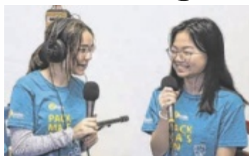
Aufnahme der Radioreportage auf Radio FRO

KREMSMÜNSTER. Tausende Jugendliche engagierten sich bei Österreichs größter Jugendsozialaktion „72 Stunden ohne Kompromiss“. In Kremsmünster setzten sie innerhalb von drei Tagen ein starkes Zeichen für Zusammenhalt und Erinnerung, indem sie sich intensiv mit dem Fremd-