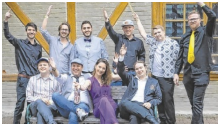
Die zehnköpfige Combo erfüllt auch so manchen Liedwunsch.

Spenden willkommen. Von 19 bis 20 Uhr gibt es eine Happy Hour, es warten günstige Getränke und Leberkäseemeln. Eine Besonderheit: In der ersten Hälfte des Abends können Besucher zu jedem Getränk einen Liedwunsch abgeben. In der zweiten Hälfte improvisiert die Band dann einige ausgewählte Songs. ■