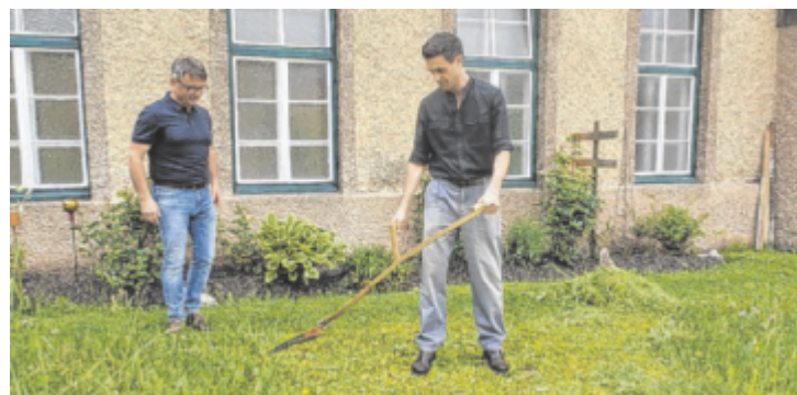
In Roßleithen entdeckt der Bayer das Weltkulturerbe „Sense“.