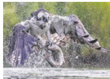
Einzelmedaille für Konrad Hageneders „Osprey I“

Konrad Hageneder erzielte gleich zwei Spitzenplätze: In der Sparte Natur erhielt er für sein Foto „Osprey I“ die Höchstwertung von 30 Punkten und in der Sparte Allgemein für „Osprey III“ ebenfalls die Maximalpunktzahl – jeweils ausgezeichnet mit einer Einzelmedaille. Waltraud Eichhorn erreichte in der Sparte Mensch mit 105 Punkten den neunten Rang und wurde mit einem Diplom geehrt. Ihr Bild „Weisheit“ brachte ihr zudem 29 Punkte und eine weitere