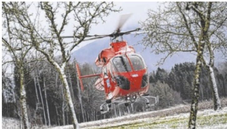
Rettungshubschrauber „Martin 3“ ist unverzichtbar für die Region.

Der Standort in Scharnstein ist seit 2017 Teil der Heli Austria und gilt als medizinisch und logistisch bedeutender Stützpunkt. Im Pool des Betreibers stehen rund 100 Notärzte im Einsatz, die oft lange Dienstzeiten absolvieren. Für sie seien