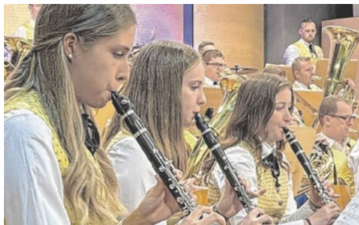
Der Musikverein Steinbach an der Steyr gibt ein Konzert in Adlwang.

200. Jubiläum von Johann Strauss (Sohn). Außerdem dabei ist ein Hit der Schweizer Band Fäaschtbänkler, einige Musikerinnen zeigen ihr Gesangstalent. Einlass ist ab 19.15 Uhr, los geht es um 20 Uhr. Kartenvorverkauf bei allen Musikern des MV Steinbach an der Steyr ■