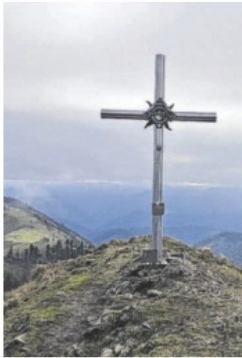
Ein mystisches Nebelmeer umhüllt das Gipfelkreuz auf dem 1.506 Meter hohen Almkogel.

Start der Tour ist beim kostenfreien Parkplatz „Bamacher“ auf 780 Metern Seehöhe. Von dort geht es südwärts – der Einstieg führt in den Wald, wo in Serpentin etwa 150 Höhenmeter zu bewältigen sind. Bei Kilometer eineinhalb hält man sich links, um auf der Forststraße „Oberplaißa“ Richtung Osten einzuschlagen. So gelangt man nicht direkt zur Ennser Hütte, sondern zunächst zum ersten Gipfel, dem Burgspitz. Hier erwartet einen ein Gip-