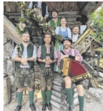
Goiserer Tanzl Musi

Musik. Für den musikalischen Auftakt sorgen die Krensllehnermusik, das Quartett der Ausseer Bradl Musi, die Klarinettenmusik der Landesmusikschule, die Goiserer Tanzl Musi und die Kufhaus-Musi aus Pinsdorf.