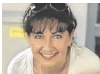
Infoabend Gesundheit verstehen, messen und aktiv fördern. Ein Vortrag zeigt, wie stille Entzündungen sichtbar werden. Seite 19

Optik Akustik Bauer 4644 Scharnstein Hauptstr. 27 • Tel. 07615 / 2860 www.optik-akustik-bauer.at