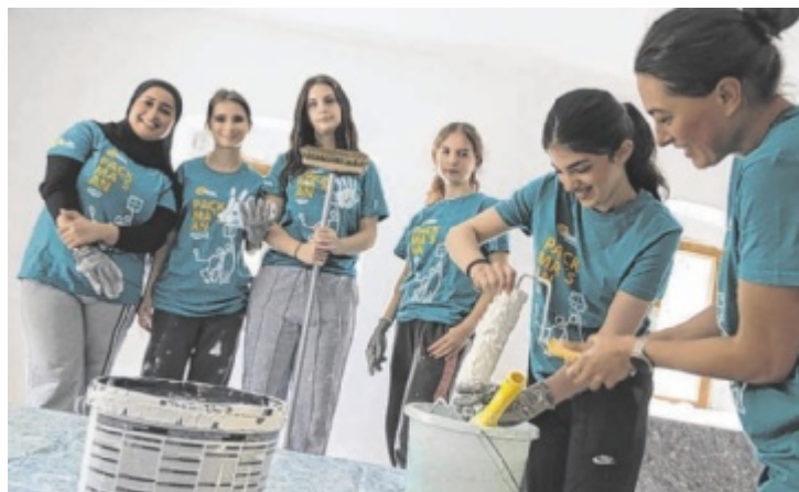
Jugendliche packten in Obertraun gemeinsam an.

Unter dem Motto „Pack ma's an“ engagierten sich in ganz Oberösterreich über 400 Jugendliche bei Österreichs größter Jugendsozialaktion „72 Stunden ohne Kompromiss“ – auch in der Region Gmunden wurde tatkräftig gearbeitet. Drei Tage lang malten, reparierten und gestalteten junge Menschen verschiedenste Einrichtungen und bewiesen eindrucksvoll, wie viel Kraft im gemeinsamen Tun steckt.