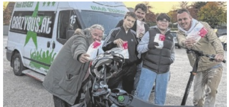
Es werden sogenannte „Rauschsackerl“ ausgegeben.

Zukunft Jugend setzt in seiner Arbeit auf Begegnung auf Augenhöhe. Der Ansatz: Wer junge Menschen ernst nimmt, erreicht sie auch. Der umgebaute Rettungswagen dient als Symbol für das, was Prävention leisten soll – nämlich rechtzeitig da zu sein, bevor es zu spät ist. „Prävention heißt für uns nicht, den Zeigefinger zu heben, sondern da zu sein, wenn's drauf ankommt. Wir wollen nicht abschrecken, sondern aufklären – ehrlich, direkt und auf Augenhöhe“, so Reischl. Im Inneren des Busses informieren geschulte Jugendarbeiter