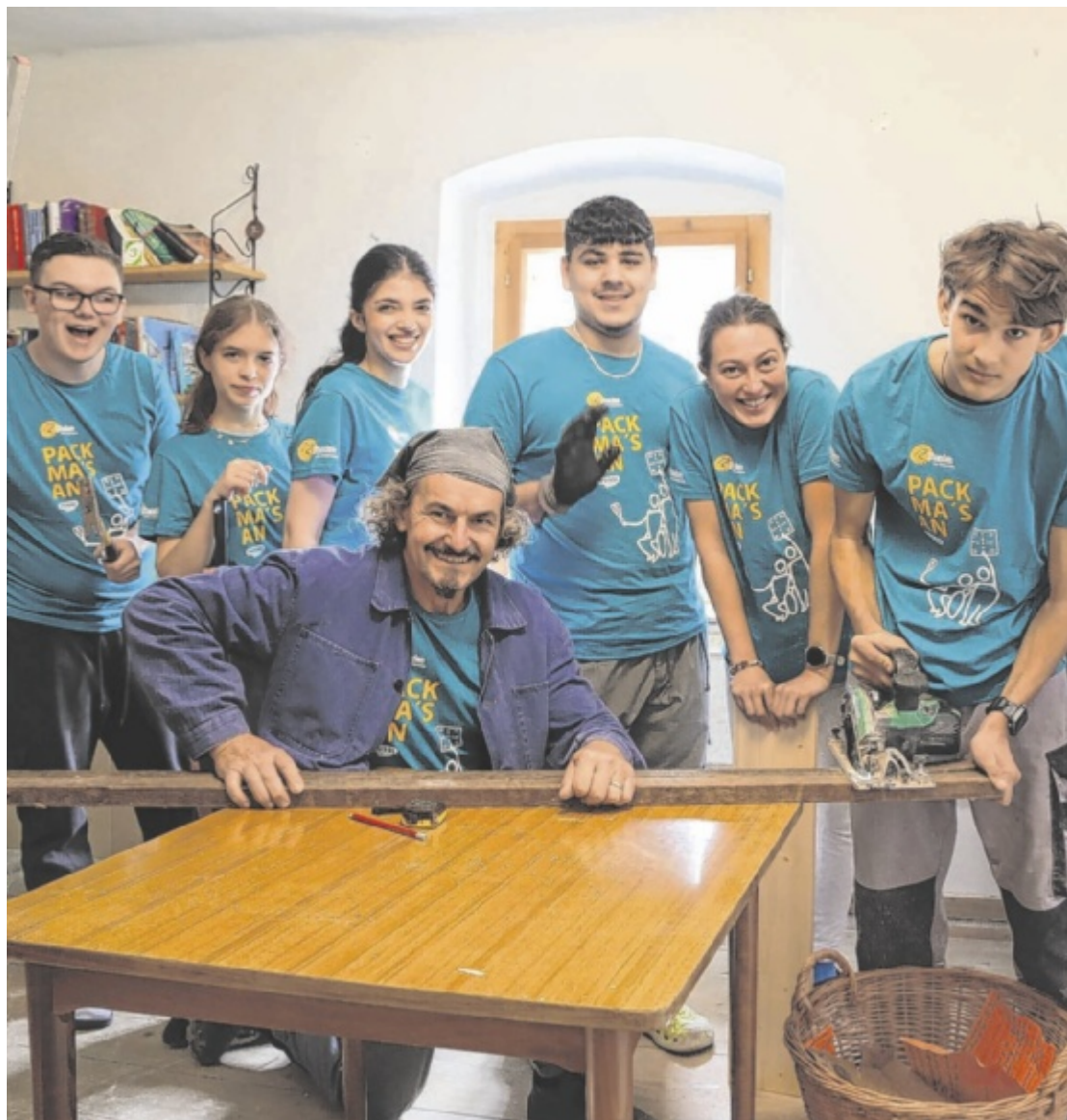
Gemeinsam anpacken Jugendliche aus Gmunden und Vöcklabruck packten bei „72 Stunden ohne Kompromiss“ kräftig an und machten das Gästehaus Obertraun mit Farbe, Einsatz und Teamgeist zukunftsfit. Seite 5