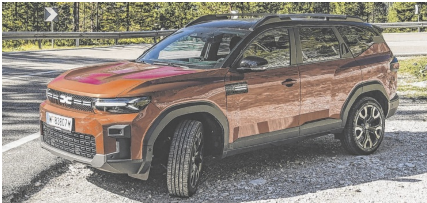
Der Dacia Bigster Hybrid 155 Journey ist ab 29.990 Euro zu haben.