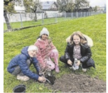
Naturnaher Schulgarten

Bereits im Rennen sind unter anderem aus dem Bezirk Gmunden die HTBLA Hallstatt mit ihrem Kuchenbuffet für den guten Zweck, die Sportmittelschule Ebensee mit dem Kurzfilm „Wasser - Leben - Brunnen“, die HLW Bad Ischl mit „Fahrräder fit für die Saison“, die VS Traunkirchen mit „Kleine Füße - große Schritte“ und die VS Pinsdorf mit ihrer naturnahen Schulgar-