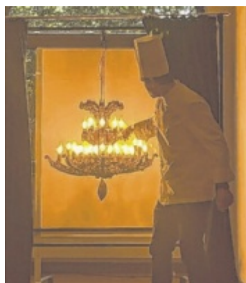
Ausbildung Zwei Genuss-Talente aus dem Salzkammergut zählen zu Österreichs ersten Schokoladensommeliers. Seite 7