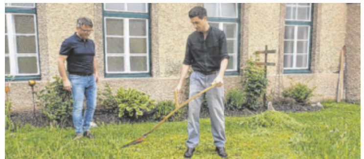
In Roßleithen entdeckt der Bayer das Weltkulturerbe „Sense“.