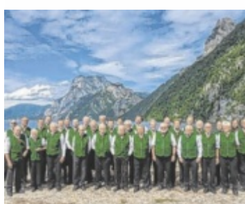
AGV Kohlröserl

und Zusammenhalt. Ab 18.30 Uhr startet der Abend mit Musik für alle – ein buntes Programm, das auf gute Laune, Begegnung und Miteinander setzt. Die Initiatoren wollen zeigen, dass Feiern keine Grenzen kennt und Lebensfreude für jeden zugänglich ist. ■