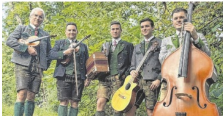
Die Bradl Musi wird im Ischler Kurhaus für Stimmung sorgen.

Die neue Veranstaltungsreihe bringt das Lebensgefühl vergangener Zeiten zurück – mit echter Volksmusik, gemüthlicher Atmosphäre und regionaler Kulinarik. Im dekorierten Kleinen Saal erwarten die Besucher traditionelle Wirtshautische, herzliche Bewirtung und handgemachte