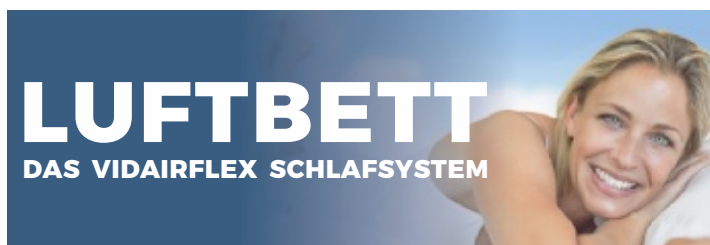
Das stromlose VIDairFlex®-Luftbett-Schlafsystem für ein druckfreies Schlafen

Menschen haben verschiedene Schlafbedürfnisse. Das VIDairFLEX®-Luftbett-Schlafsystem wird fast allen Ansprüchen gerecht. Luft ist das einzige Element, welches sich selbstständig, dreidimensional und druckfrei jedem Körper anpasst. Der aufliegende Körper ruht