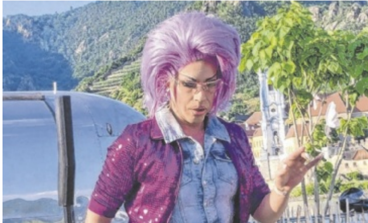
Travestie-Show für den guten Zweck in der Mittelschule Neukirchen

Die Viechtauer Schiachperchten starten heuer in ihre 30. Saison – und das mit einer besonderen Feier. Am Samstag, 8. November 2025 findet um 19.39 Uhr in der Neuen Mittelschule Neukirchen bei Altmünster eine Benefizveranstaltung zugunsten des Vereins Rollende Engel sowie Wir helfen Neukirchen statt. Für Unterhaltung sorgt Saschas Show & Travestie, die mit einem humorvollen Programm und großartigen Künstlern aufwartet. Seit 25 Jahren begeistert Sascha Rier mit seiner Gruppe auf den