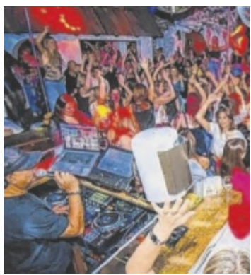
Feiern im G'spusi

Am Freitag, 7. November, lädt das G'spusi Vöcklabruck zur ersten „All Together Party“ ein. Unter diesem Motto entsteht ein Abend, an dem wirklich alle willkommen sind – unabhängig von Alter, Herkunft oder Beeinträchtigung. Die Idee hinter der Veranstaltung ist einfach, aber stark: Menschen mit und ohne Handicap sollen gemeinsam feiern, tanzen und neue Begegnungen erleben. Gerade in Zeiten, in denen vieles trennt, setzt das G'spusi damit ein bewusstes Zeichen für Offenheit, Respekt