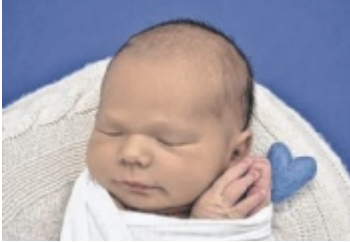
GEBURT: Aldina & Sebastian Gartner: Armin