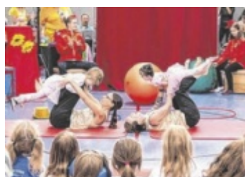
Spitzenschule Tips sucht gemeinsam mit der Sparkasse OÖ und dem Land OÖ wieder die coolsten Schulprojekte. Seite 6 / Foto: Oberbichler