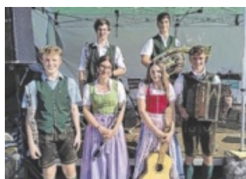
Musik Am Samstag, 8. November, lädt das Kongress & Theaterhaus in Bad Ischl zur Eventreihe „Zaumgspüt“ ein. Seite 18 / Foto: privat