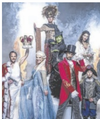
Musicals in Bad Ischl

Gefeierte Stars der Originalproduktionen entführen die Zuschauer in eine bunte und glit-