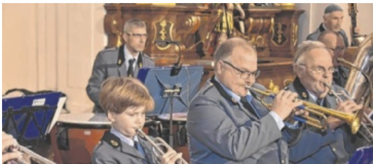
Klangvolle „Evocazioni“ in der Ebenseer Kirche