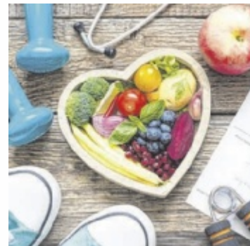
Gesundheit verstehen

Immer mehr Menschen sehnen sich nach Sicherheit, wenn es um ihre Gesundheit geht. Am Mittwoch, 12. November, lädt das Medical Beauty Sylvia Jodl am Stadtplatz 36 im Burgstall erneut zu einem besonderen Infoabend ein, der genau diese Fragen in den Mittelpunkt stellt. Die Referentinnen Sylvia Jodl und Michaela Leitner werden praxisnah aufzeigen, wie körperliche und seelische Belastungen sichtbar gemacht werden können. Dabei geht es nicht nur um das Erkennen von Beschwerden, sondern auch darum, welche Schritte zu nachhalti-