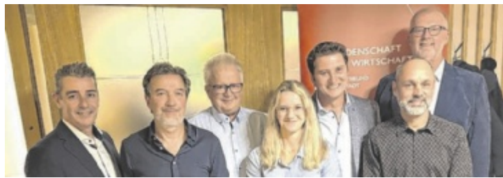
Der neugewählte Vorstand mit Ehrengästen