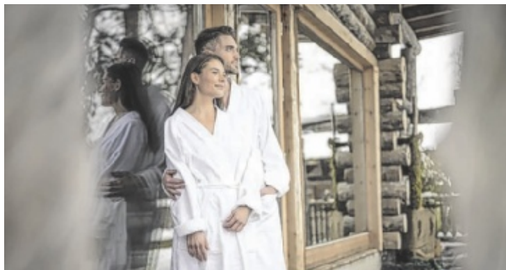
Auszeit genießen bei den Advent-Sparwochen in der Sole Felsen Welt

Ihr Mutmachbuch ist bald im Buchhandel – etwa bei Thalia Freistadt, in der Bücherei Windhaag sowie online im Buchschmiede-Shop erhältlich oder kann ab sofort unter heilungsweg.ingrid@gmail.com vorbestellt werden. Tips verlost drei Exemplare des Buchs online auf www.tips.at/gewinnspiele . ■