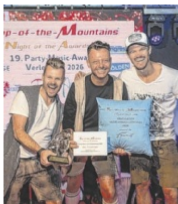
Alpen Oscar Die Kefermarkter Musiker von Zwirn wurden mit dem Alpen Oscar ausgezeichnet.

Seite 9/Foto: Top of the Mountains/Rinnhofer