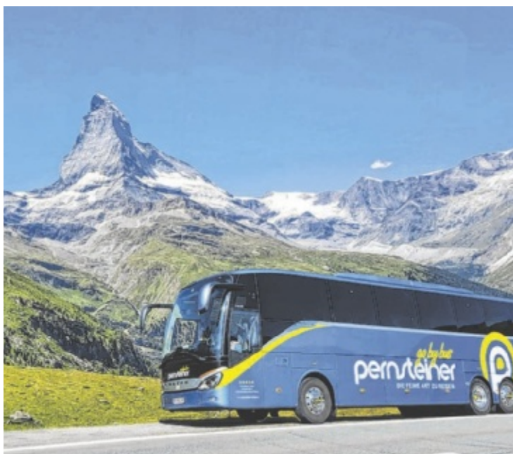
Im Pernsteiner Luxusbus die Welt entdecken