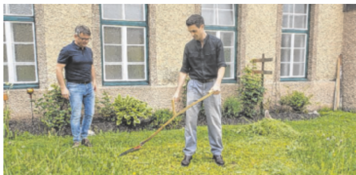
In Roßleithen entdeckt der Bayer das Weltkulturerbe „Sense“.

Der Reinhaltungsverband Freistadt und Umgebung besteht seit 1992 aus der Stadtgemeinde Freistadt, den Gemeinden Rainbach und Lasberg sowie Grünbach und Waldburg. Seit 2017 läuft eine Kanalwartungskooperation mit Hirschbach sowie den Gemeinden Reichenau und Schenkenfelden. Die Kläranlage verfügt nach dem Ausbau über eine Kapazität von 48.000 Einwohnerwerten. ■