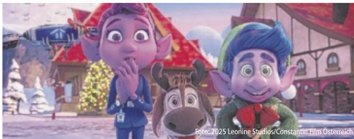
Mission Santa: Der junge Yoyo hat seinen ersten Tag in Santas Werkstatt.