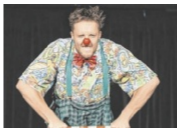
Kindertheater in Rainbach

miere findet am Samstag, 8. November, um 20 Uhr im Pfarrsaal Unterweißenbach statt. Weitere Infos zu Aufführungsterminen und Karten gibt es online unter www.theater-uw.at (öfter vorbeischauen wegen möglicher Stornoplätze), am Theaterhandy: 0677 61732355 sowie bei der Raiffeisenbank Unterweißenbach (während der Öffnungszeiten). ■