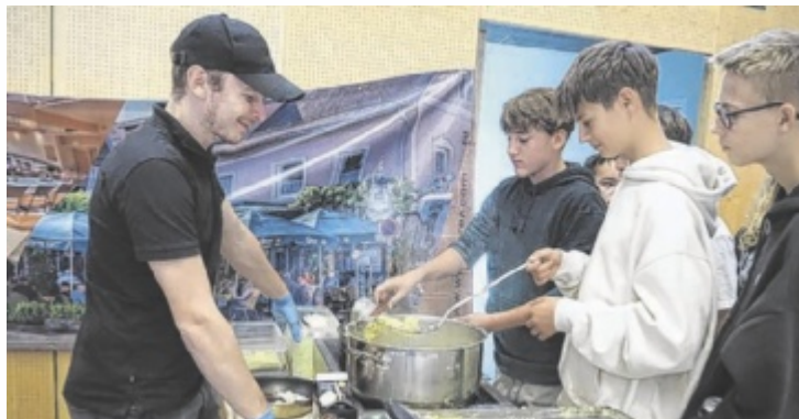
Bei vielen ausstellenden Firmen und Schulen darf man Hand anlegen.

Am Freitag, 14. November, öffnen sich von 13 bis 18 Uhr in den Freistädter Messehallen die Türen zur größten und wichtigsten Veranstaltung rund um Ausbil-