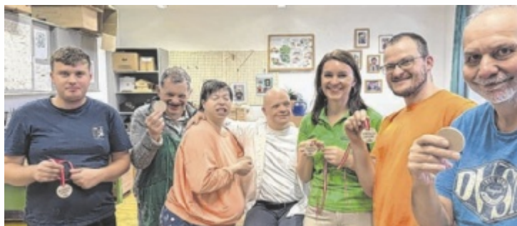
Die Finisher-Medaillen werden aus Buchenholz gefertigt.

Aus einem Stück Buchenholz entsteht Schritt für Schritt ein kleines Stück Erinnerung. Es wird gesägt, geschliffen, gebohrt und am Ende mit einem rot-weiß-roten Band versehen – alles in Handarbeit. Jede Medaille geht durch viele Hände, und jede trägt ein Stück Herzblut in sich. Die Aktion zwischen der Lebenshilfe und dem Sportverein zeigt, was möglich ist, wenn man zusam-