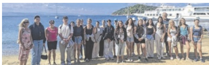
Freistädter Musikmittelschüler auf Bildungsreise in Griechenland.