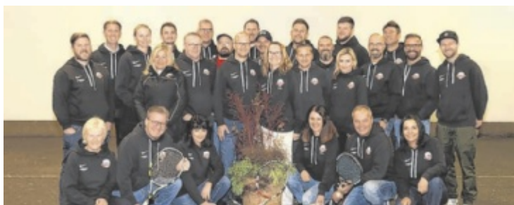
Vorfriede auf die Ballnacht: die Vereinsleitung und das Ball-Komitee