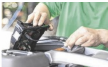
Topservice für den Rasenroboter – jetzt im Lagerhaus Freistadt

Rasenroboter leisten mit bis zu 1.000 Betriebsstunden pro Saison deutlich mehr als herkömmliche Rasenmäher. Damit die empfindlichen Mechatronik-Komponenten langfristig zuverlässig funktionieren, ist ein professionelles Service unerlässlich. Das Lagerhaus Freistadt bietet umfassende Wartungs- und Serviceleistungen für Rasenroboter an: fachgerechte Wartung durch erfahrene Techniker, gründliche Reinigung und Funktionsprüfung, Software-Updates (bei Bedarf), Akku-Check und Pflege. Zusätzlich besteht die Möglichkeit, den Rasenroboter über die Wintermonate sicher einzulagern. Dabei wird besonders auf die optimale Lagerung des Akkus geachtet, um das Gerät