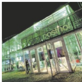
Der Posthof wird zum Club, beim neuen Format „Takeover“.

Statt Stuhlreihen und Applaus heißt es Bassdruck, Strobo und ein Floor, der bis in die Morgenstunden vibriert. Platonic Records bringt die Vibes an die Decks. Der Posthof liefert Raum, Technik und Energie. Platonic Records sind ein gemeinnütziges Kollektiv der freien Szene in Linz. Der Verein bringt Menschen mit Leidenschaft für Musikproduktion und DJing zusammen und veranstaltet eigene Events. Mit dabei sind am 14. November Kutsu (Rave Cave), Magz und Nyse (beide Shaken Audio), Estha, Jess, Pla-