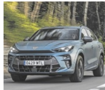
Der CUPRA Terramar