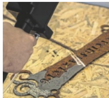
Präzise Laserreinigung

Eva Gusenbauer: In der Industrie, bei Maschinen, Werkzeugen, Stromschienen oder Metallteilen – aber auch in der Denkmalpflege, bei Oldtimern und in der Graffiti-entfernung. Sowie überall dort, wo