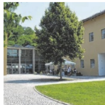
Für die Gastronomie in der Bruckmühle wird ein neuer Pächter gesucht.