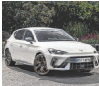
Der neue CUPRA Leon

Mit dem CUPRA Terramar betritt die Marke neues Terrain. Das kompakte SUV soll ab 2025 das