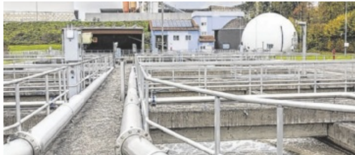
Die erweiterte Kläranlage Freistadt ist offiziell in Betrieb.

Bei den Führungen informierte das Anlagen-Team über die neuen Komponenten, wie eine zweite Rechenstraße für höhere Zulaufmengen, ein fünftes Belebungsbecken als Kapazitätspuffer, ein Austausch großer Energieverbraucher (Pumpen, Belüfterkompressoren) durch energieeffiziente Aggregate, ein zweiter Faulturm für bessere Stabilisierung des Klärschlammes und höhere Gasaus-