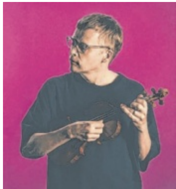
Geiger Pekka Kuusisto

Unter Jukka-Pekka Saraste präsentiert das Orchester mit dem Geiger Pekka Kuusisto ein Programm, das die Stärken der Musizierenden perfekt zur Geltung bringt. Saraste und sein Orchester gelten als ausgewiesene Sibelius-Experten: Erst kürzlich nahmen sie alle symphonischen Werke des finnischen Nationalkomponisten auf, darunter auch die kraftstrotzende 1. Symphonie, die beim Konzert im Brucknerhaus auf dem Programm steht. Neben Outi Tarkianens „Songs of the Ice“, für das sich die finnische Komponistin vom Atmen des Eises in der Arktis inspirieren ließ, zeigt der Ausnahmegeiger Kuusisto mit Igor