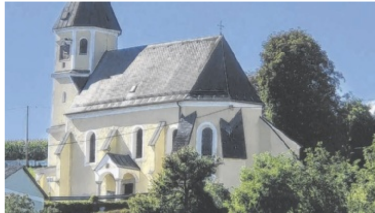
Die Leonhardikirche in Pucking

Kirchenchor und der Bauernschaft gestaltet. Um 11 Uhr findet die traditionelle Pferde- und Tiersegnung statt. Für das leibliche Wohl sorgen die Puckinger Direktvermarkter sowie die Goldhaubenfrauen. Als neue Attraktion wird ein „Leonhardizwickl“ ausgeschenkt. Kunst und Handwerk runden das Programm ab. ■