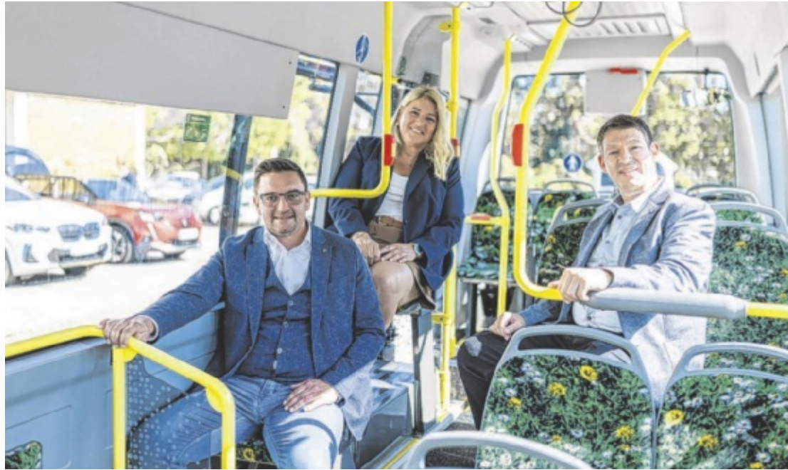
Zukünftig chauffiert der „Spetzi“ die Trauner als guter Freund durch die Stadt.

Als sympathischer Freund im Verkehrsalltag erfüllt der Trauner Stadtbus „Spetzi“, der in enger Zusammenarbeit zwischen der Stadt Traun, dem Land Oberösterreich und dem OÖ Verkehrsverbund neu gestaltet wurde, zentrale Mobilitätsbedürfnisse auf einfache, komfortable und nachhaltige Weise. „Sechs elektrisch betriebene und zwei dieselbetriebene, wendige und leise Minibusse werden ab 15. Dezember zu den wichtigsten Verkehrsknoten wie der Trauner Kreuzung, dem Trauner Bahnhof und dem Trauner Hauptplatz fahren. Damit sind attraktive Umstiege zwischen den Stadtbussen zu den Regionalbussen und den Nahverkehrszügen sowie der Straßenbahn garantiert“, so Koll. Im Vergleich zum bisher bestehenden Fahrplanangebot werden die Fahrplankilometer um rund