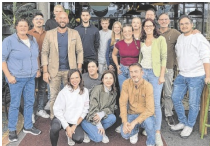
Die Mitarbeiter sind das Herzstück von Tante kaethe.

Das Team legt besonderen Wert auf Ausbildung und Nachwuchsförderung. „Unter dem Motto ‚Talent of Tomorrow‘ arbeiten wir eng mit der Hotelfachschule