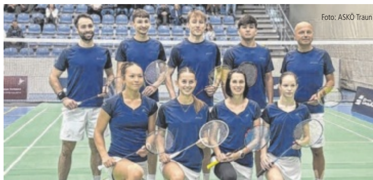
Auf eine empfindliche Niederlage folgte ein souveräner Sieg über den Meister.