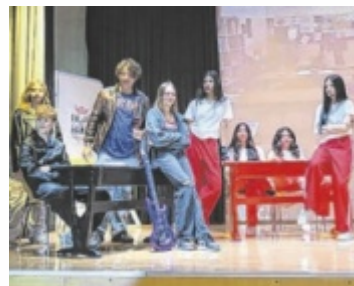
„Meet your Future“-Tage in der MMS Leonding.

Am Donnerstag, 20., und Freitag, 21. November, erhalten Besucher bei geführten Rundgängen einen Einblick in den Schulalltag und lernen das Angebot der Schule kennen. Die Führungen sind wie ein Spaziergang durch das Schulhaus gestaltet und ermöglichen einen Blick in die Klassenräume sowie in die kreativen Fachbereiche. Ob Musik, Multimedia, Kreativität, Teamgeist oder Persönlichkeitsbildung – die MMS Leonding steht für eine ganzheitliche Förderung und fordert gleichzeitig dazu heraus, sich aktiv in die Gemeinschaft einzubrin-