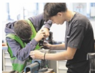
Lass dich beim Schnuppertag für deinen Wunschlehrberuf begeistern!

Hast du gewusst? Mehrmals täglich bist du mit Produkten in Kontakt, die auf ENGEL Maschinen gefertigt wurden. Unsere Spritzgießmaschinen verarbeiten Kunststoffe zu Produkten, die du aus