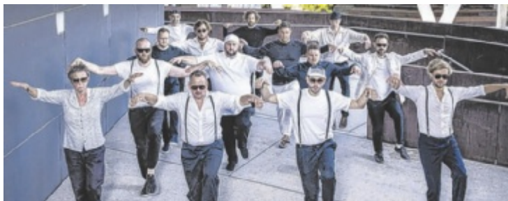
5/8erl in Ehr'n und das Jazzorchester Vorarlberg spielen im Posthof.

Mitspielen bis 11.11.2025/09:00 Uhr www.tips.at/g/25456 oder SMS an 0676 8002525 Text: „25456 Vorname Nachname“