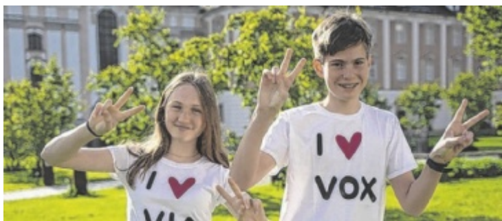
Der Tag der offenen Tür ist am 7. November.