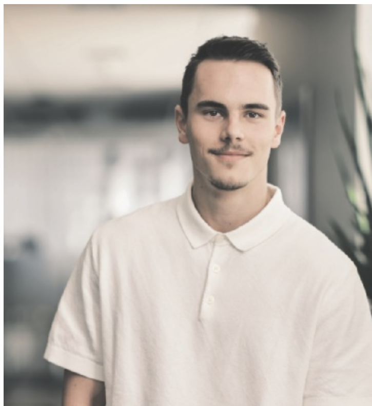
Infotage besuchen und Lehrling bei EREMA werden!