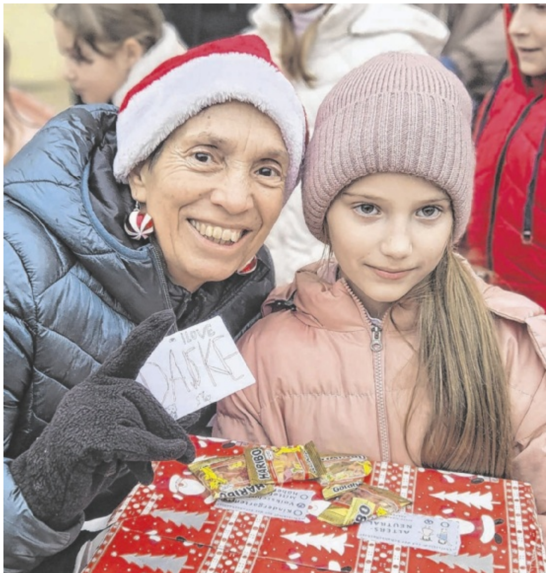
Weihnachtsfreude Das Stadtmarketing Traun unterstützt die Aktion „Christkindl aus der Schuhbox“ der OÖ Landlerhilfe und schenkt auch heuer wieder Kindern in der Ukraine und Rumänien ein Lächeln. Seite 14