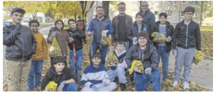
2.500 Blumenzwiebel sollen das Haider Schulzentrum zum Blühen bringen.