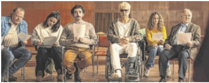
Florian David Fitz landet als erfolgloser Sänger Daniel in der Anstalt.