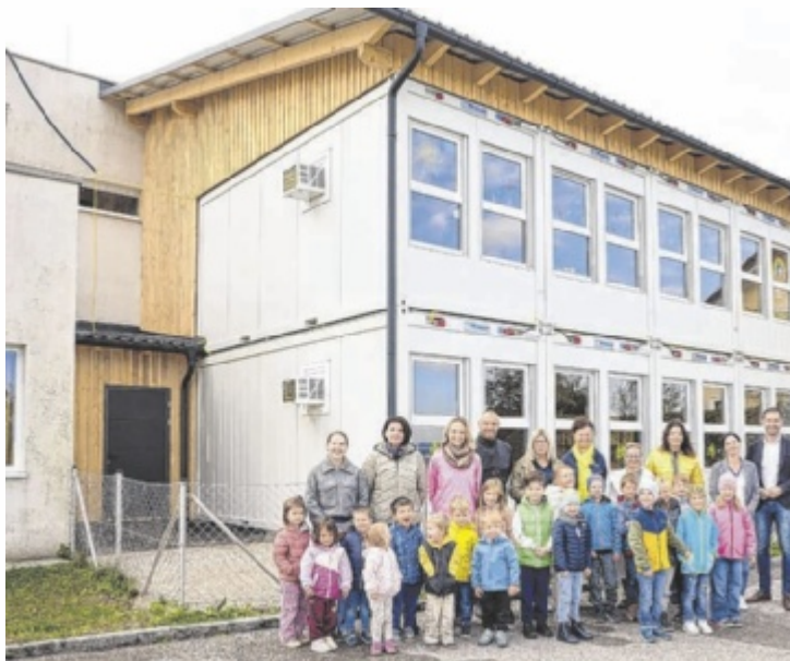
In St. Marien wurde in nur wenigen Monaten zusätzlicher Raum für Kinderbetreuung geschaffen.

Das Projekt wurde in Rekordzeit umgesetzt: Pünktlich zum Beginn des Betreuungsjahres Anfang September konnten die neuen Gruppen eröffnet werden.