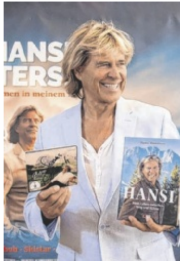
Hansi Hinterseer kommt ins Hollywood Megaplex.

Mit Film und Buch nimmt Hansi Hinterseer mit auf eine ganz persönliche Reise und gibt seltene Einblicke in seine außergewöhnliche Karriere – vom erfolgreichen Skirennläufer zum gefeierten Entertainer. Die Arbeit daran hat ihn reflektieren lassen: „Da kommen natürlich Erinnerungen auf. Ich bin an und für sich ein Mensch, der nach vorne schaut. Aber ich kann jetzt auch nicht leugnen, was bei mir al-