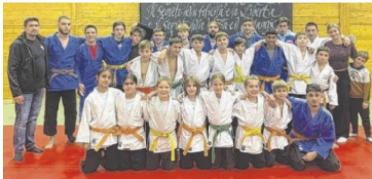
Die SchülerInnen-Mannschaft des ASKÖ Fairdrive Leonding gewinnt mit 12:4 gegen Multikraft Wels und zieht damit ins OÖ Schüler Final Four ein.

Auch der Nachwuchs des Vereins zeigte Stärke: Die Schülerinnen-Mannschaft gewann auswärts gegen Multikraft Wels klar mit 12:4 und steht damit frühzeitig im OÖ Schüler Final 4 am 29. November. Weniger Glück hatte hingegen die Männer-Mannschaft, die sich Wels mit 6:16 geschlagen geben musste.