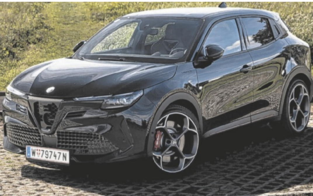
Der Alfa Romeo Junior Elettrica Veloce ist ab 48.900 Euro zu haben.