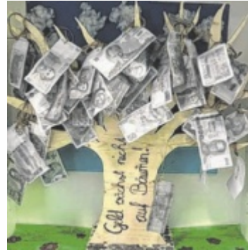
Das Projekt „Geld wächst nicht auf den Bäumen“ der 3a der MS Schardenberg

Gemeinsam mit der Sparkasse OÖ und dem Land OÖ sucht Tips die engagiertesten Schulen des Landes. Eingereicht werden können abgeschlossene Projekte aus dem letzten Schuljahr sowie laufende Aktivitäten.