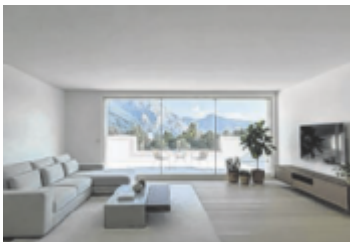
Perfekte Akustik

Neu im Angebot ist die Renovierung bestehender Akustiklochdecken. Damit bietet MALEREI HAUSER individuelle Lösungen für jede Raumsituation. ■ Anzeige