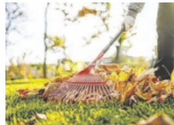
Zu dicke Laubschichten können dem Rasen schaden.

Mulch hat gleich mehrere Vorteile: Die Schutzschicht schützt Pflanzen vor Kälte, hält die Feuchtigkeit im Boden, verbessert die Nährstoffversorgung und