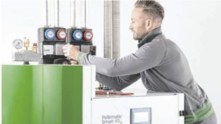
Bis 2030 stehen jährlich 360 Millionen Euro für den Heizungsumstieg zur Verfügung, insgesamt 1,8 Milliarden Euro.

Weil die Fördermittel begrenzt sind, ist rasches und gezieltes