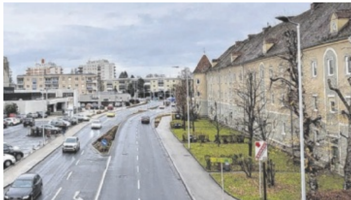
Ein Team von 16 Personen war für die Studie ehrenamtlich im Einsatz.

Die Erfassung des Nutzfahrzeug-Verkehrs (Lkw über 3,5 Tonnen und Reisebusse) fand an zwei Wochentagen im Mai 2024 in je drei Zählsschichten im Abschnitt zwischen den Zählpunkten Kreisverkehr-Nordspange und Kreuzung-Taborland im Stadtgebiet von Steyr statt.