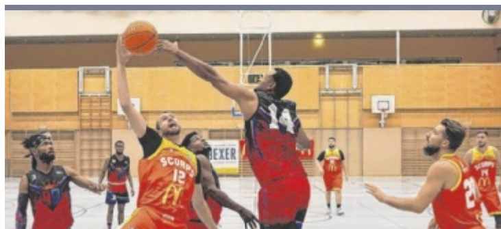
Basketball Der BBC Steyr schlug in der Herren-Landesliga die Red Devils aus Linz souverän mit 90:55 und feierte im dritten Saisonspiel den ersten Sieg. Alle elf verfügbaren Spieler erhielten Einsatzzeit.