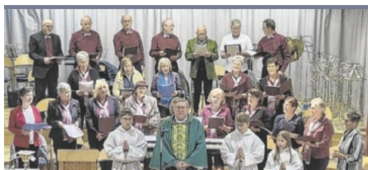
Jubiläumsfeier Auf 175 Jahre bewegte Geschichte blickt die Gemeinde Reichraming zurück. Das Jubiläum wurde an zwei Tagen gebührend gefeiert. Nachbericht online auf www.tips.at/n/701269