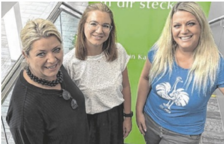
Team WIFI Steyr

tieren sich an den Bedürfnissen der Region und bieten so passgenaue Qualifikationen – von Technik über Sprachen bis hin zu Management. Jetzt weiterbilden – dort, wo die Zukunft beginnt Mit dem WIFI Oberösterreich gelingt der nächste Karriereschritt ganz in der Nähe – persönlich, flexibel und zukunftsorientiert. Weiterbildung, die bewegt – und Perspektiven schafft. ■ Anzeige