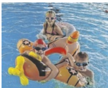
Der Spaß steht im Vordergrund.