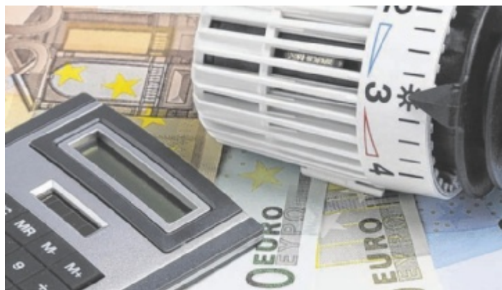
Ein Heizungstausch ist eine finanzielle Herausforderung.