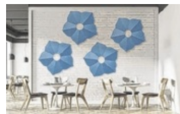
Akustikpaneele aus Schafwolle von whisperwool

In der modernen Architektur kommen meist große Glasfronten sowie Sichtbeton zum Einsatz. Doch was gut fürs Auge ist, ist nicht zwangsläufig gut fürs Ohr. Die glatten Oberflächen begünstigen die Entstehung und Übertragung von Störgeräuschen – es beginnt zu hallen. Doch es gibt zahlreiche nachhaltige und zugleich designstarke Lösungen zur spürbaren Verbesserung der Raumakustik, zum Beispiel weiche Akustikpaneele oder -tapeten aus Schafwolle. Das Naturmaterial eignet sich wie kaum ein zweites dazu, Schall zu absorbieren und folglich laute Räume zu beruhigen. Darüber hinaus tragen die Paneele dazu bei, die Qualität des Raumklimas zu optimieren. Wolle ist nicht nur in der Lage, Schadstoffe aus der Luft zu filtern. Sie speichert auch Feuchtigkeit aus der Raumluft und wirkt wärmeisolierend. ■