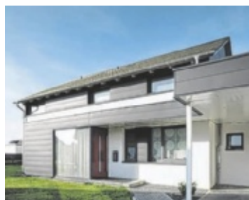
Ein Haus mit einer hinterlüfteten Aluminium-Fassade

Regen? Hagel? Sturm? Die in unterschiedlichen Baubreiten und Oberflächenstrukturen erhältlichen Paneele sind robust und widerstandsfähig und bleiben selbst bei extremen Witterungseinflüssen an Ort und Stelle. Die Aluminium-Paneele, deren Farbspektrum von verschiedenen Braun-, Grau- und Rottönen über Moosgrün und Schwarz bis hin zu Weiß und Metallic-Nuancen reicht, können vertikal, horizontal oder diagonal verlegt werden. Sie werden als vorgehängte hinterlüftete Fassade ausgeführt: Der Hinterlüftungsraum, der durch die Montage auf einer Unterkonstruktion entsteht, verhindert Schimmelbildung und schützt die Bausubstanz. ■