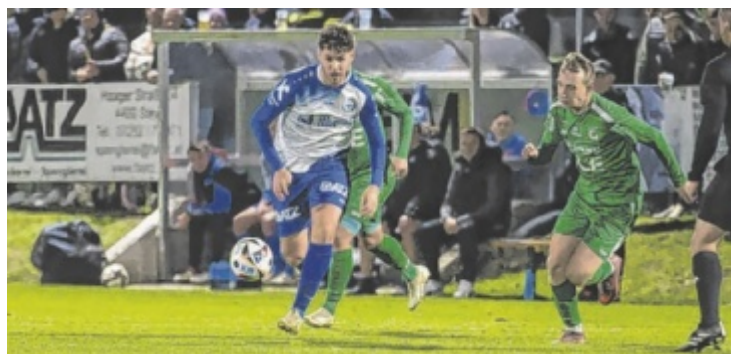
Das Derby zwischen St. Ulrich und Garsten war hart umkämpft.