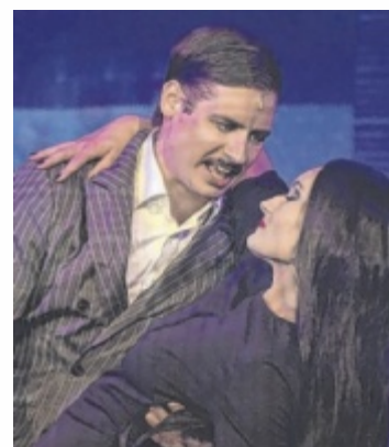
Musicalherbst in Steyr

Zum Monatsende wird es schaurig: „The Addams Family“ kommt ins Alte Theater von Steyr. Wednesday Addams ist in einen ganz normalen Jungen verliebt – das sorgt für Chaos. Das