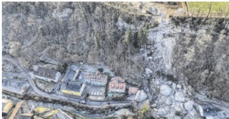
Der Felssturz im Februar 2023 forderte zwei Todesopfer.