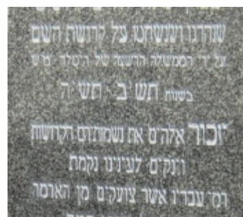
Massengrab am Jüdischen Friedhof in Steyr.