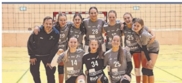
Volleyball Die U18 des TV Steyr (Bild) startete mit zwei Siegen in die Saison. Das junge Damen-Team in der 3. Landesliga verbuchte einen 3:2-Erfolg gegen Atterseevolley 2 sowie eine 1:3-Niederlage gegen Eberstallzell-Kirchham.

per Elfmeter in der 88. Minute den entscheidenden Treffer. In der LT1 OÖ-Liga nähert sich der SK BMD Vorwärts Steyr dem Herbstmeistertitel. Nach holprigem Start wurde Weißkirchen vor 1.200 Zuschauern durch Tore von Pepe Brekner, Roko Mislov und Milan Jurdik mit 3:0 besiegt. Am Samstag, 25. Oktober, gastieren die Rot-Weißen beim Tabellen dritten Edelweiß Linz (15 Uhr). ■