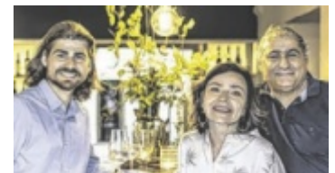
Familie Hamdan öffnet wieder extra für Singles ihr Gasthaus.