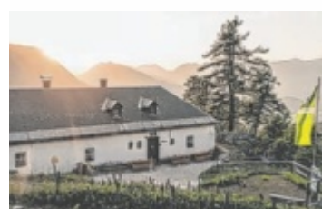
Geöffnet ist die Hofalm heuer noch bis Sonntag, 26. Oktober.

Produktkataloge und viele weitere Infos von EUROPAS NR. 1 GRATISHOTLINE: 0800 20 2013 | WWW.LEEB.AT