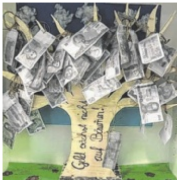
Das Projekt „Geld wächst nicht auf den Bäumen“ der 3a der MS Schardenberg

Gemeinsam mit der Sparkasse OÖ und dem Land OÖ sucht Tips die engagiertesten Schulen des Landes. Eingereicht werden können abgeschlossene Projekte aus dem letzten Schuljahr sowie laufende Aktivitäten.