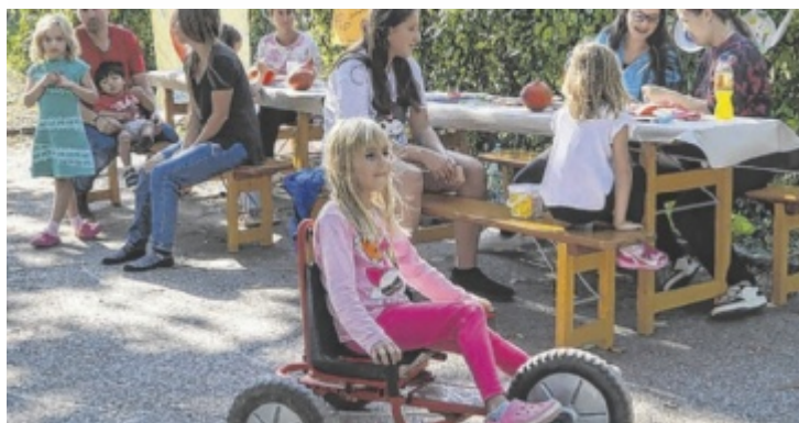
Beim Herbstfest warten auch verschiedene Kinderfahrzeuge.