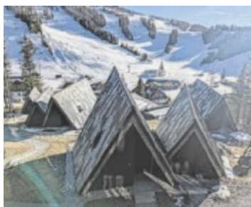
Triforet in Hinterstoder