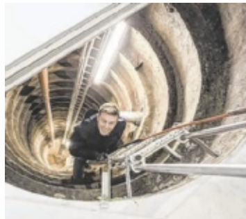
Umwelt- und Klima-Landesrat Stefan Kaineder bei der Besichtigung eines Brunnens

BEZIRK KIRCHDORF. Im Rahmen der Aktion „Für unser Trinkwasser unterwegs“ wurden 26 private Einzelwasserversorgungsanlagen im Bezirk Kirchdorf untersucht. Die Ergebnisse zeigen teils erhebliche bauliche Mängel und Schwankungen in der Wasserqualität.