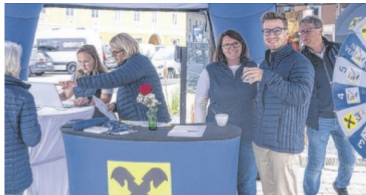
Reger Andrang beim Gewinnspiel und zahlreiche interessierte Besucher am Infostand