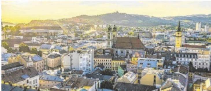
Österreichs Städte sind international gesehen „billig“.

Attraktiv für Investoren Interessant ist der Blick auf die Städte: Während Wien mit 6.432 Euro pro Quadratmeter 27 Prozent über dem Österreichschnitt liegt, ist die Hauptstadt im Vergleich zu Luxemburg (11.074 Euro), München (10.800 Euro) oder Paris (10.760 Euro) noch deutlich günstiger. Noch erschwinglicher sind Graz (3.838 Euro) oder Linz (4.579 Euro). Damit bleiben Immobilien in Öster-