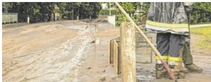
Für Haushalte in Hochrisikogebieten deckt bei Naturkatastrophen selbst ein erweiterter Versicherungsschutz oft keinen Totalschaden.

Zwar sind Schäden durch Sturm oder Hagel meist standardmäßig abgedeckt, außergewöhnliche Naturereignisse wie Überschwemmung oder Lawinen hingegen oft nur in einer Basisva-