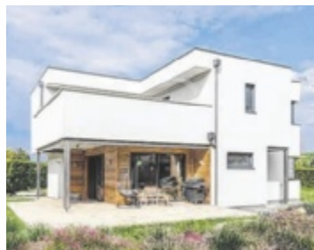
Alles aus einer Hand – WOLF liefert Haus und Unterbau!

Wer selbst mit anpackt, spart: Bei klar definierten Arbeiten können Bauherren mit Familie und Freunden mitarbeiten – unter Anleitung von erfahrenen Vorarbeitern und mit voller Garantie auf die ausgeführten Eigenleistungen. Technisch anspruchsvolle Gewerke