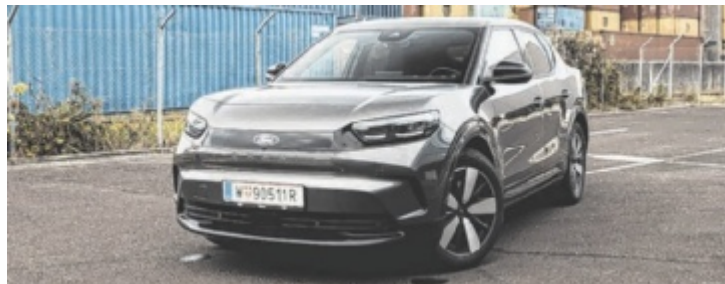
Der Ford Capri ER RWD 77 kWh Premium ist ab 54.990 Euro zu haben.

Bei Älteren weckt der Name Erinnerungen an ein sportliches Coupé der 70er-Jahre, Jüngere denken eher an Fruchtsaft und Sonne. Ford geht bei der Wiederbelebung alter Modellnamen unkonventionell vor – und der Kreis