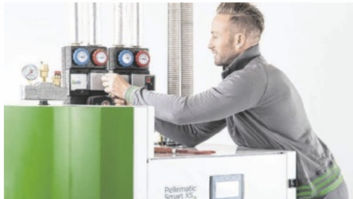
Bis 2030 stehen jährlich 360 Millionen Euro für den Heizungsumstieg zur Verfügung, insgesamt 1,8 Milliarden Euro.

Weil die Fördermittel begrenzt sind, ist rasches und gezieltes