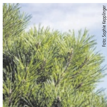
Frische Latschen, direkt vom Berg

Früher war das Entfernen der Latschen mit Aufwand und gesetzlichen Auflagen verbunden: