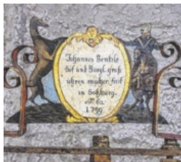
Das historische Schild

Liegenschaft befindet sich seit 1955 im Eigentum der Republik Österreich und wird von den Bundesforsten betreut. Schloss Lamberg wurde in den vergangenen Jahren schrittweise renoviert. Exklusive Flächen können seitdem als Event- und Hochzeitslocation angemietet werden. Teile der historischen Räumlichkeiten sind im Rahmen von Führungen für Besucher geöffnet, wobei der Uhrturm selbst nicht öffentlich zugänglich ist. ■