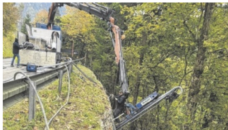
Hangsicherungsarbeiten an der L552.

2024 wurden in zwei Abschnitten 460.000 Euro in die Hangsicherung investiert, heuer ein weiteres Baulos mit einer Investition von 200.000 Euro abgeschlossen. Zudem folgt in den kommenden Wochen die Umsetzung des Bauloses „MS 1–5“ auf der talseitigen Straßenseite. Diese Arbeiten erfolgen in fünf Abschnitten und umfassen ein Investitionsvolumen von rund 500.000 Euro. „Gerade in Gebirgsregionen wie dem Stodertal sind regelmäßige Sicherungsmaßnahmen unerlässlich. Mit diesen Investitionen setzen wir