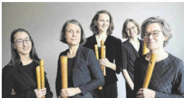
Die Gruppe „Element of Prime“ eint die Liebe zur „Flauto dolce“.