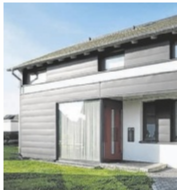
Ein Haus mit einer hinterlüfteten Aluminium-Fassade

Sie fällt zuerst ins Auge und prägt das Erscheinungsbild eines Gebäudes. Doch der schöne Schein ist nicht alles, es kommt auch auf die inneren Werte an. Soll heißen: Eine Fassade muss auch funktionalen Ansprüchen gerecht werden. Ein Material, das sowohl optisch als auch in seiner Funktionalität überzeugt, ist