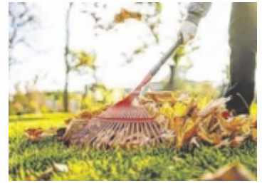
Zu dicke Laubschichten können dem Rasen schaden.

Mulch hat gleich mehrere Vorteile: Die Schutzschicht schützt Pflanzen vor Kälte, hält die Feuchtigkeit im Boden, verbessert die Nährstoffversorgung und