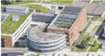
Die Anlage am Neuromed Campus

Beim Neuromed Campus des Kepler Universitätsklinikums wurden im Zuge des Neubaus bereits 2004 drei große Solaranlagen gebaut. Zu diesem Zeitpunkt steckte die Nutzung von Solarenergie im großen Stil noch in den Kinderschuhen. Die drei thermischen Solaranlagen versorgen sowohl Bettenbereiche als auch die Küche des Klinikums mit Warmwasser. Durch wassersparende Maßnahmen in den letzten 21 Jahren ist der Warmwasserbedarf gegenüber den damaligen Annahmen deutlich gesunken. Obwohl