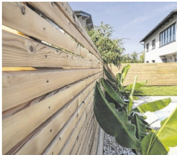
Zaun von der SECA Holzwelt in Ottensheim

Die durchschnittliche Zaunhöhe im Wohnbereich liegt bei 1,20 bis 1,80 Metern. Unterschiedliche Lattenbreiten können Abwechslung bringen. ■