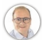
von THOMAS LEITNER

SALZKAMMERGUT. Sieben Regionen, ein unvergleichliches Erlebnis: Der Salzkammergut Advent 2025 lädt zu stimmungsvollen Märkten, gelebtem Brauchtum und festlicher Atmosphäre ein.