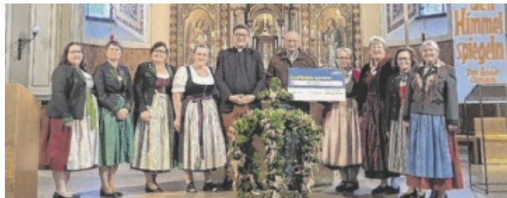
Spendenübergabe an den Verein „Ich bin Ich“ in der Ischler Kirche.

Durch Verkaufsstände der Ischler Bäuerinnen und der Goldhaubengruppe Bad Ischl Verkaufsstände sowie durch die Erntedanksammlung kam ein Betrag von 2.000 Euro zusammen, der dem Verein „Ich bin Ich“ zugutekommt. Vor der Ern-