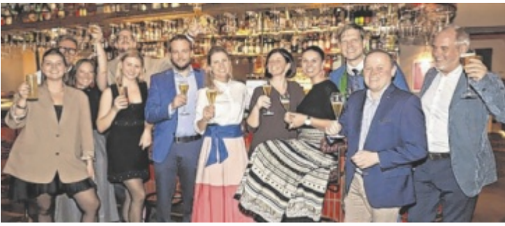
Elf Betriebe kamen mit ihren Partnern aus Wirtschaft, Tourismus und Medien zusammen um in festlicher Runde zu feiern und sich auszutauschen.