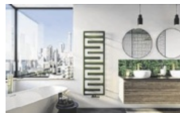
Design-Heizkörper - hier das Modell „Tetris“ von Zehnder.

sind. Info: X-Markt in Wels, Jasminstr. 5 (Nähe SCW), Tel. 07242 60044, www.x-markt.at (Montag bis Freitag, 9 bis 18, Samstag 9 bis 17 Uhr). ■ Anzeige