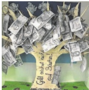
Das Projekt „Geld wächst nicht auf den Bäumen“ der 3a der MS Schardenberg

Gemeinsam mit der Sparkasse OÖ und dem Land OÖ sucht Tips die engagiertesten Schulen des Landes. Eingereicht werden können abgeschlossene Projekte aus dem letzten Schuljahr sowie laufende Aktivitäten.