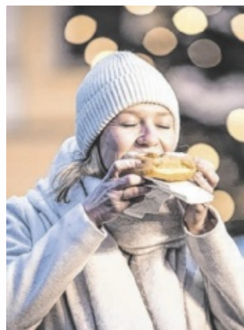
FrISChe Bauernkrapfen gehören dazu.

In der Kaiserstadt Bad Ischl verschmelzen Geschichte und Feststimmung zu einem Erlebnis. Der Christkindlmarkt der Ischler Handwerker in der Trinkhalle begeistert mit traditioneller Handwerkskunst und regionalen Produkten. Direkt davor sorgt das Schmankerldorf bis Anfang Jänner für genussvolle Momente. Ein neues Highlight 2025 ist der Adventzauber in den Stallungen der Kaiservilla, der Ende November erstmals stattfindet. Ausgewählte Aussteller präsentieren hochwertige Handwerkskunst, Mode und Düfte – begleitet von Musik und Kulinarik im Lichterglanz der historischen Mauern.