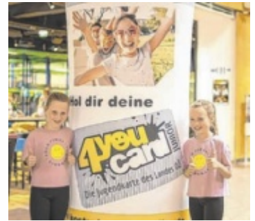
Mit der kostenlosen 4youCard Junior tolle Angebote sichern.

ÖÖ. Für Kinder von acht bis elf Jahren öffnet sich die Tür zu einer Welt voller Rabatte, Aktionen und Erlebnisse. Ob Kino, Shopping oder Workshops – mit der kostenlosen Karte vom Land Oberösterreich wird Freizeit zum Abenteuer.