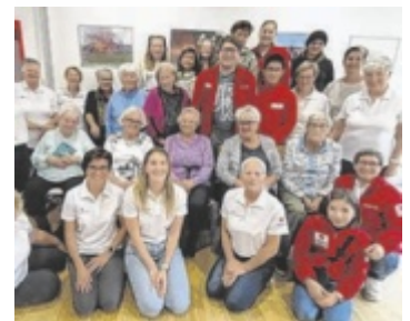
Treffen von Alt und Jung.