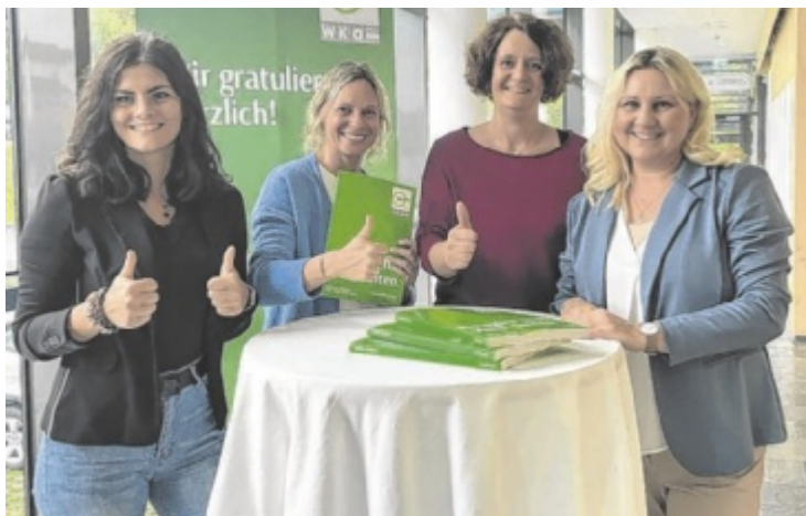
Team WIFI Bad Ischl und Gmunden