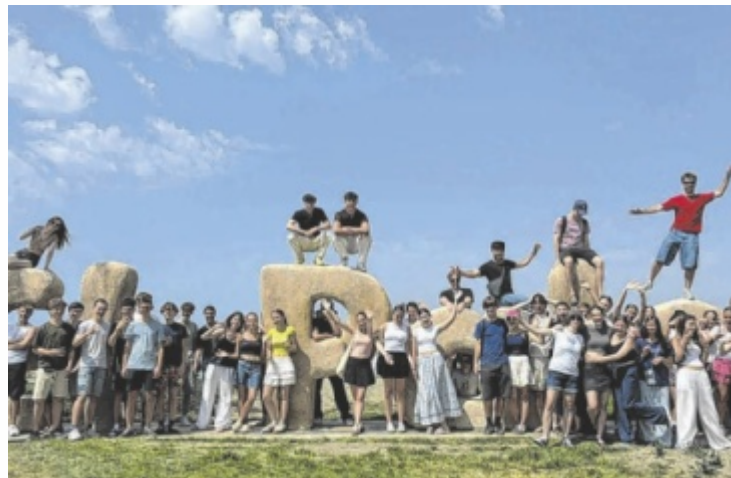
38 Maturanten arbeiten an der Vorbereitung des Maturaballs.

Der Ball bietet ein abwechslungsreiches Programm: Saalbar, Shotbar, Disco, eine Einlage um 22 Uhr, die Mitternachtseinlage gemeinsam mit Lehrern, der Tanz von Eltern und Maturanten, Tombola, Fotobox, Kuchenbuffet, Rosenverkauf und die Eröffnung durch das Eintanzen der Maturanten. Zudem wird die Maturazeitung präsentiert. „Wir freuen uns besonders auf die Mitternachtseinlage, weil sie eine lustige Neuversion der Aladdin-Geschichte ist und die Tänze besonders gut gelungen sind“, sa-