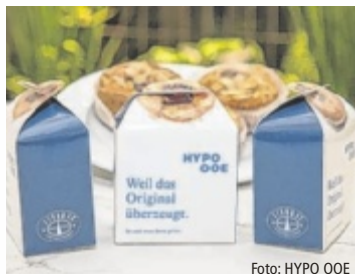
Linzer Torten als Weltspartagsgeschenk

Attraktive Zinsaktion Passend zum Weltspartag bietet die HYPO Oberösterreich auch dieses Jahr eine attraktive Zinsaktion