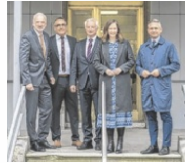
Die Minister Claudia Plakolm und Wolfgang Hattmannsdorfer (ganz rechts) besuchten das Zementwerk Rohrdorfer.