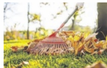
Zu dicke Laubschichten können dem Rasen schaden.

Unkraut jäten lohnt sich: „Denn wenn Sie dieses noch vor dem Winter entfernen, wächst es im Frühjahr nicht so unkontrolliert nach“, weiß Gajer. ■