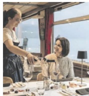
Genussvolle-Eventreihe am Attersee startet