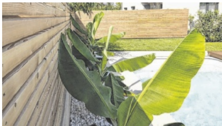
Zaun von der SECA Holzwelt in Ottensheim