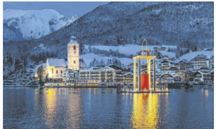
St. Wolfgang mit der schwimmenden Laterne