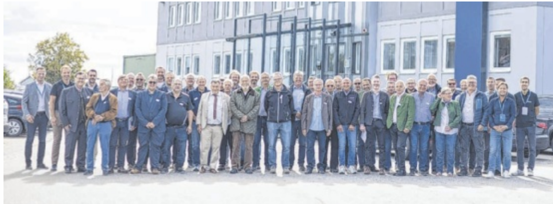
Zur 50. Jahreshauptversammlung wurde ein Programm inklusive Betriebsführungen geboten.

Der erste Tag begann mit einer Betriebsbesichtigung im Werk Röchling in Oepping. An sieben Stationen informierten Produktmanager über aktuelle Entwicklungen und Fertigungsprozesse des Unternehmens. Im Anschluss fand im Seminarzentrum des Stifts Aigen-Schlägl die eigentliche Jahreshauptversammlung statt. Dabei wurden fünf langjährige Mitglieder, die