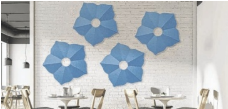
Akustikpaneele aus Schafwolle von whisperwool

Wolle ist nicht nur in der Lage, Schadstoffe aus der Luft zu filtern. Sie speichert auch Feuchtigkeit aus der Raumluft und wirkt obendrein wärmeisolierend.