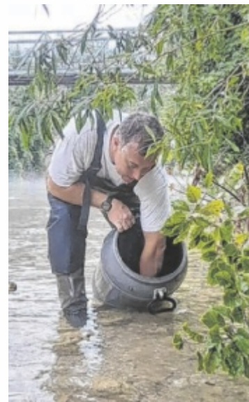
3.000 Jungfische eingesetzt

die nächste Saison wieder unter besten Bedingungen starten – zur Freude der Fischer, Naturfreunde und Gäste des Almtals. ■