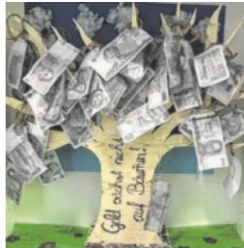
Das Projekt „Geld wächst nicht auf den Bäumen“ der 3a der MS Scharndenberg

Gemeinsam mit der Sparkasse OÖ und dem Land OÖ sucht Tips die engagiertesten Schulen des Landes. Eingereicht werden können abgeschlossene Projekte aus dem letzten Schuljahr sowie laufende Aktivitäten.