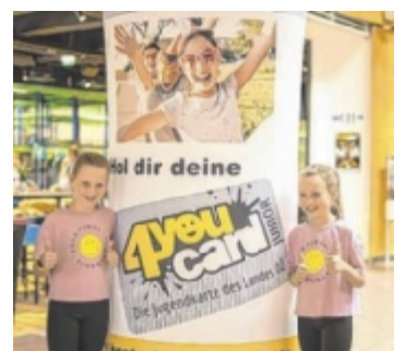
Mit der kostenlosen 4youCard Junior tolle Angebote sichern.

Mit der 4youCard Junior warten spannende Gewinnspiele, coole Try.it-Tage und das Magazin mag4you Junior auf alle Inhaber. Newsletter-Abonnenten erhalten