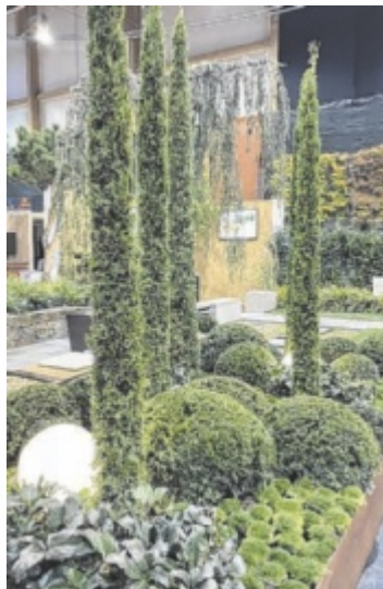
Galerie des Wohnens

Beim Rundgang durch die Hallen haben Interessierte die Möglichkeit, bei rund 200 Ausstellern zu vergleichen und sich in-