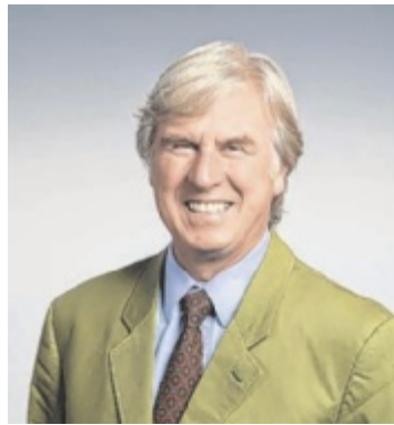
Georg Adam Starhemberg