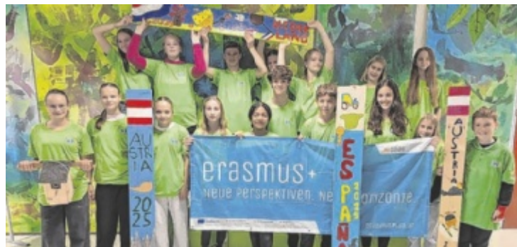
Die Schüler der MS St. Agatha absolvierten mit ihren Gästen aus Holland und Spanien verschiedene Aktivitäten zum Thema „Get fit for a greener world“.

Die Gäste wohnten in dieser Zeit bei neun Kindern aus den dritten und vierten Klassen der Mittelschule. Unter dem Motto „Get fit for a greener world“ wurden gemeinsam zahlreiche Aktivitäten mit Hinblick auf Nachhaltigkeit, Klima- und Umweltbewusstsein absolviert. Der grüne Gedanke zog sich als roter Faden durch die ganze Woche, wobei Englisch als