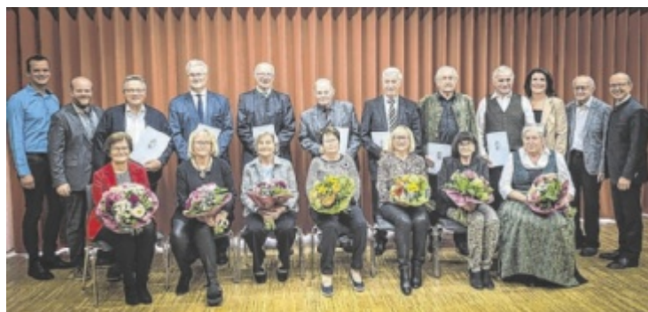
Die Paare, die 50 oder 60 Jahre verheiratet sind, mit den Gratulanten

schen und katholischen Kirche die Paare zum Jubiläum. Ein kurzer Rückblick aus der Gemeindechronik auf Geschehnisse in den Hochzeitsjahren 1965 und 1975 ließ Erinnerungen wach werden. Nach der Überreichung der Urkunden des Landes Oberösterreich sowie Aufmerksamkeiten der Marktgemeinde und dem gemeinsamen Essen gab es noch Gelegenheit für Gespräche. ■