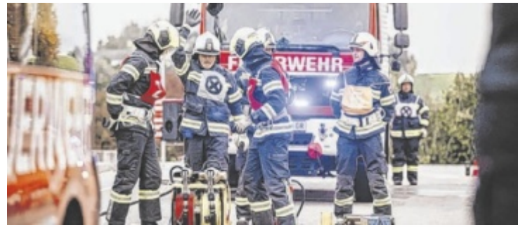
27 Kameraden der FF Grieskirchen haben sich der Prüfung gestellt.