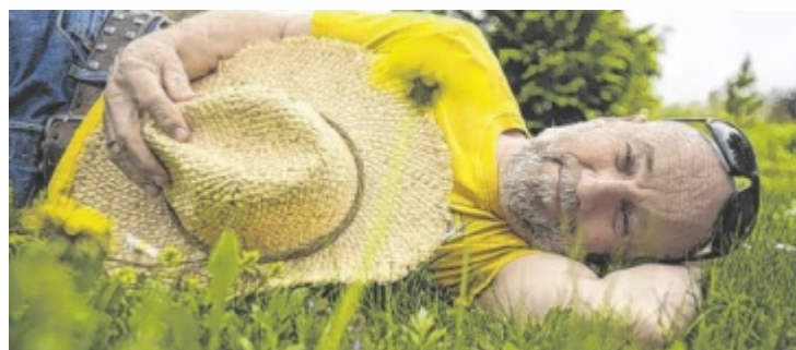
Roland Düringer gastiert im Bräuhaus in Eferding.

Mitspielen bis 04.11.2025/08:00 Uhr www.tips.at/g/25429 oder SMS an 0676 8002525 Text: „25429 Vorname Nachname“