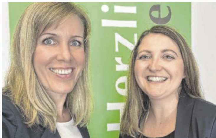
Team WIFI Grieskirchen

Alle Infos und Kursangebote unter: wifi.at/ooe/grieskirchen Tel.: 05 7000-5360