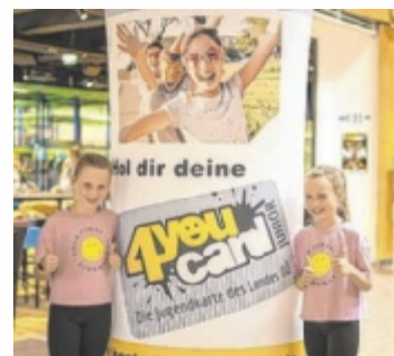
Mit der kostenlosen 4youCard Junior tolle Angebote sichern.

Mit der 4youCard Junior warten spannende Gewinnspiele, coole Try.it-Tage und das Magazin mag4you Junior auf alle Inhaber. Newsletter-Abonnenten erhalten