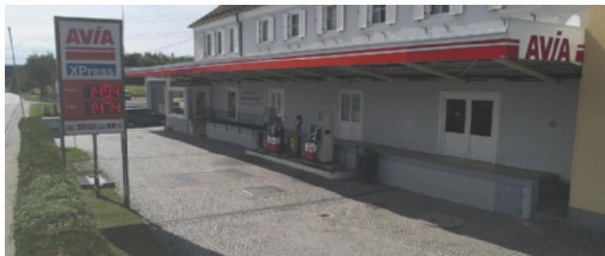
AVIA XPress in Weibern