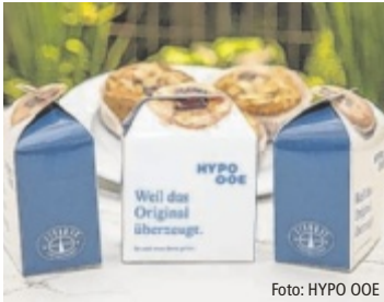
Linzer Torten als Weltpartagsgeschenk

Passend zum Weltpartag bietet die HYPO Oberösterreich auch dieses Jahr eine attraktive Zinsaktion