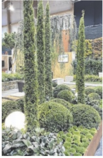
Galerie des Wohnens

RIED. Die Messe „Haus & Bau“ findet vom 7. bis 9. November zum 28. Mal statt. Unter dem Motto „Traum trifft Umsetzung“ bietet sie wieder hohe Qualität und große Vielfalt der Aussteller und somit wertvolle Entscheidungshilfen für die Besucher bei anstehenden Investitionen. Die Haus & Bau zählt seit knapp drei Jahrzehnten zu den erfolgreichsten und beliebtesten Messen in Ried. Dies bestätigen regelmäßig die hervorragenden Ergebnisse bei Besucher- und Ausstellerbefragungen. Rund 200 Aussteller Beim Rundgang durch die Hallen haben Interessierte die Möglichkeit, bei rund 200 Ausstellern zu vergleichen und sich in-