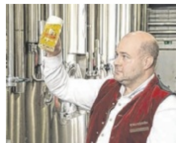
Bockbieranstich in Neumarkt