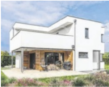
Alles aus einer Hand – WOLF liefert Haus und Unterbau!

Kosten senken durch Eigenleistung Wer selbst mit anpackt, spart: Bei klar definierten Arbeiten können Bauherren mit Familie und Freunden mitarbeiten – unter Anleitung von erfahrenen Vorarbeitern und mit voller Garantie auf die ausgeführten Eigenleistungen. Technisch anspruchsvolle Gewerke