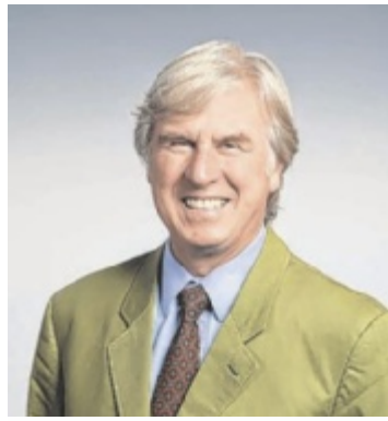
Georg Adam Starhemberg