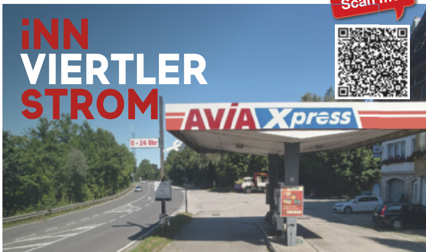
AVIA XPress in Bad Schallerbach

AVIA Seifriedsberger setzt auf 100% erneuerbare Energien und bietet mit dem AVIA-Naturstrom eine umweltfreundliche Alternative für alle, die einen aktiven Beitrag zum Klimaschutz leisten möchten. Die Kombination aus günstigen Preisen und nachhaltiger Energieversorgung hat viele Kunden überzeugt, den Stromanbieter-Wechsel zu AVIA Seifriedsberger durchzuführen.