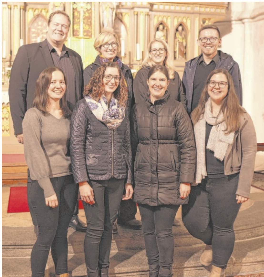
„Nacht der Lichter“ Als Gegenstück zu Halloween findet am 31. Oktober in der Pfarrkirche Neuhofen das Konzert „Nacht der Lichter“ statt. Mit dabei: die Ensembles „3Klong“ und das Vocalissimo Quartett. Seite 22 / Foto: Marco Zehetgruber Fotografie