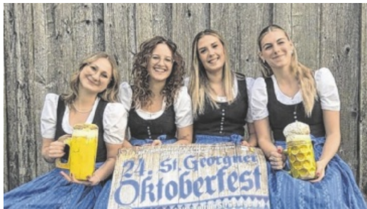
Die Trachtenkapelle freut sich auf viele Besucher.