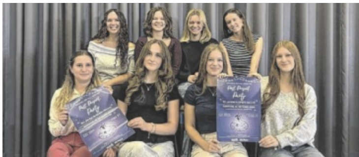
Das Ballkomitee der fünften Klassen freut sich auf viele Ballgäste.