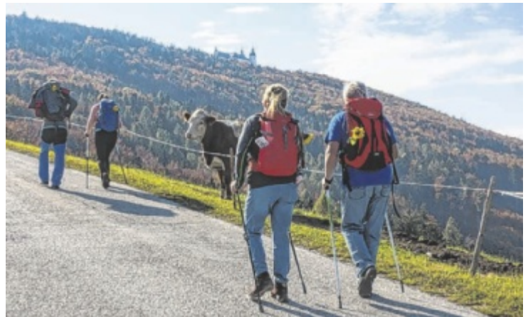
Himmelwärts pilgern zum Sonntagberg

Bücherflohmarkt Einen Bücherflohmarkt organisieren die Senioren von Stift Ardagger am 18. Oktober (13 – 17 Uhr) und am 19. Oktober (9 – 12 Uhr) im Pfarrheim. Auf die Besucher warten Kinder- und Jugendbücher, Romane, Fachbücher, Geschichtsbücher, Kochbücher, Reiseliteratur, Spiele und vieles mehr. Außerdem werden Leseomas und Leseopas vor Ort Lesungen abhalten: am Samstag um 14, 15 und 16 Uhr sowie am Sonntag um 10 und 11 Uhr.