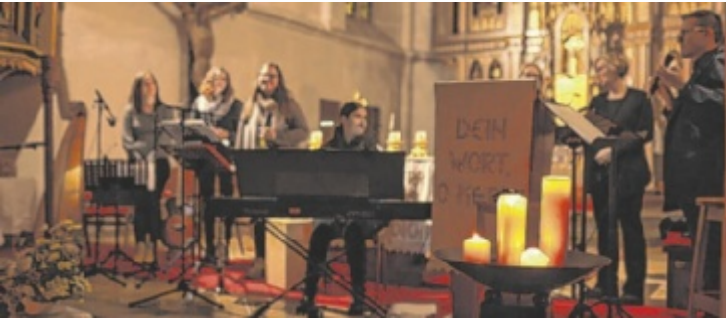
Das Konzert versteht sich als Gegenstück zu Halloween.