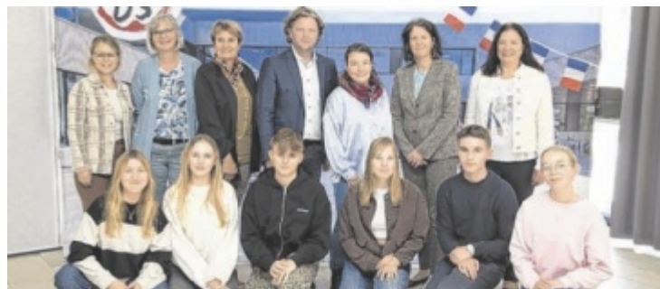
Empfang für die französischen Gäste in der HLW Amstetten