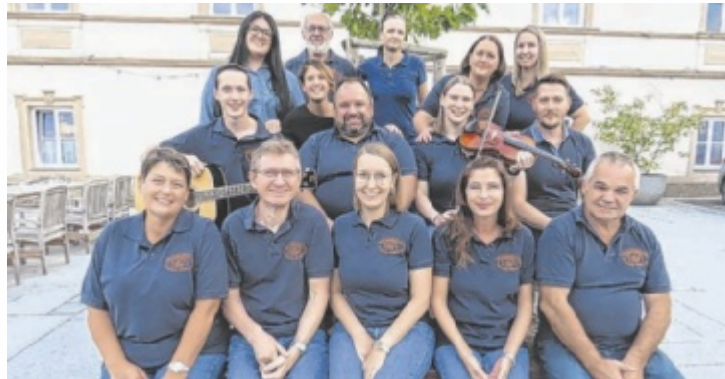
Seit Mitte August probt die Theatergruppe Wallsee-Sindelburg zweimal pro Woche und freut sich heuer über fünf neue Mitglieder.

Seit Mitte August probt die Gruppe zweimal pro Woche und freut sich heuer über fünf neue Mitglieder, die ihre Bühnenpremiere feiern. Im Vorjahr spielte die Theatergruppe Wallsee-Sindelburg das Dreiakter-Stück