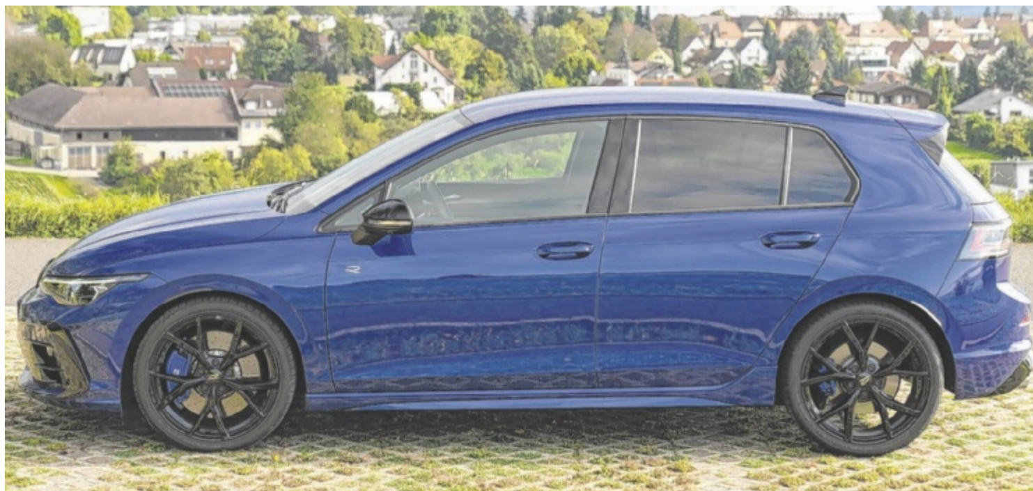
Der VW Golf R TSI 4MOTION ist ab 69.590 Euro zu haben.