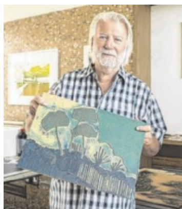
Einblicke Anlässlich der Tage der offenen Ateliers öffnet die kunst&DRUCKwerkstatt in Hausmening ihre Tore. Seite 19