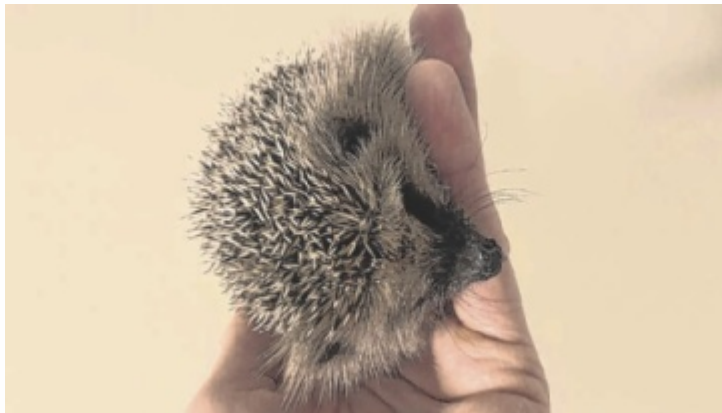
Michaela Litschl betreut schwache, untergewichtige Igel.

Aufgrund einer neuen Heizungsanlage stehen ihr heuer die bisherigen Räumlichkeiten, in denen die Tiere überwintern konnten, jedoch nicht mehr zur Verfügung. Daher sucht sie nun liebevolle Pflegeeltern, die be-