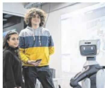
Zukunft soll im Digital City Studio erlebt werden können.

Die Stadt Linz und die IT:U laden in Diskussionen, Work-