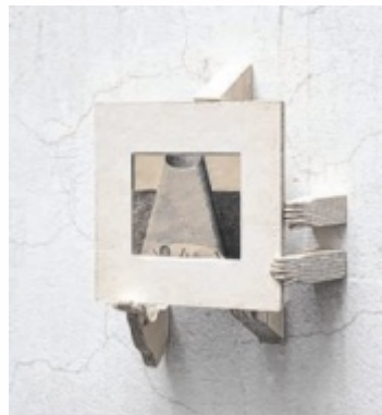
Eine aktuelle Arbeit von Georg Pinteritsch, „Ohne Titel“. Foto: Bildrecht, Wien 2025

Die Arbeiten von Georg Pinteritsch zeichnen sich durch eine unverkennbare Bildsprache aus: Kunstgeschichtliche Symbolik, christliche Ikonografie und Versatzstücke der visuellen Alltagskultur verweben sich zu surreal anmutenden Erzählungen. „Pinteritschs Zeichnungen und Installationen schaffen komplexe Bildräume, in denen sich Vergangenheit, Gegenwart und Zukunft überlagern und keine eindeutigen Interpretationen zulassen“, so Kuratorin Sarah Jonas. Der in Wien und Linz lebende Künstler studierte