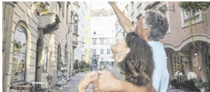
Im Juli und August gab es einen Besucheransturm.

Mit insgesamt 202.941 Nächtigungen in diesen beiden Monaten überschritt Linz erstmals die 200.000er-Marke in den Ferienmonaten. Allein im August wurden 101.366 Nächtigungen verzeichnet, ähnlich dem Rekordwert vom vergangenen Jahr. In Summe bewegt sich die Stadt von Jänner bis August mit 676.566 Nächtigungen nahezu auf Vorjahresniveau. Die etwas schwächeren Nächtigungszahlen im Juni konnten also wieder kompensiert werden. Die meisten Gäste kamen aus Österreich, ge-