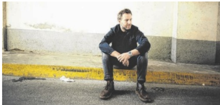
Musiker Josh. gastiert am 23. Oktober in der TipsArena Linz.

Ja klar, aber das waren viele. Linz ist, glaube ich, von allen Städten diejenige, in der ich am häufigsten