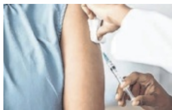
Linzer bietet die Gratis-Grippeimpfung an.

sorgte eine Abordnung der Musikkapelle Kleinmünchen. Auf die Besucher warteten auch Überraschungen: Unter allen Gästen wurden von den Markthändlern Gewinne verlost, vom gefüllten Einkaufskorb bis zu kulinarischen Spezialitäten. ■