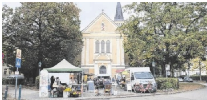
Der Grünmarkt Kleinmünchen am Vorplatz der Pfarrkirche St. Quirinus.