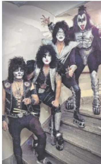
Die Kiss Forever Band spielt bei der Wildstyle & Tattoo Messe ein Konzert in voller Länge.