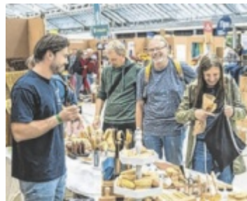
Rund 150 Aussteller präsentieren sich bei der WeFair.

Je langlebiger ein Produkt, desto nachhaltiger ist es. Deshalb kön-