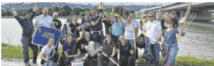
IT-Unternehmen der Digitale Mile Linz halten ihre Meile sauber.