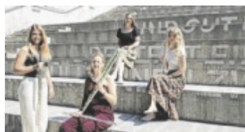
Holzblasinstrumente stehen im Mittelpunkt von „SOS Music“.