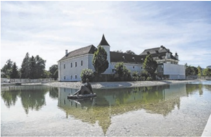
Unvergessliche Abende warten im Schloss Traun.

Am 31. Oktober spielt wieder die Band OllaHighLiegn, die mit ihrer energiegeladenen Musik den Saal zum Beben bringen wird. Kurz darauf, am 9. November, entführt die Besucher Yagody mit ukrainischer Folklore in