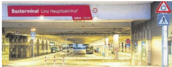
Die Sanierung und Modernisierung war dringend nötig.

Nach der Wiedereröffnung sollen nun ein eigens eingerichtetes Gebäudemanagement und ein Sicherheitsdienst vor Ort nachhaltig für ein langfristig angenehmes Ankommen und Weiterreisen am Busterminal Linz sorgen. Im Zuge der Sanierung wurde die Zahl der für den Regionalbusverkehr nutzbaren Abfahrtstellen von 15 auf 13 reduziert.