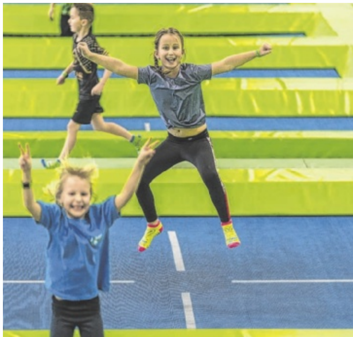
Bewegung und Spaß bei jedem Wetter im JUMP DOME

Ob Familienausflug, Kindergeburtstag oder sportlicher Nachmittag mit Freunden – im JUMP DOME kommt garantiert keine Langeweile auf. Eltern können