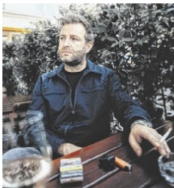
Josh. im Gespräch

Ich würde zu mir sagen: Du musst gar nicht so viel Angst haben! Irgendwie wird's schon. ■