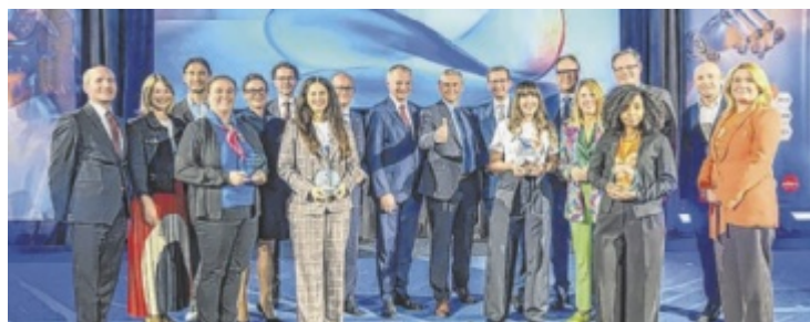
25 Jahre UAR wurden in der Kepler Hall gefeiert, dabei auch die „diversity4innovation Awards“ 2025 verliehen.