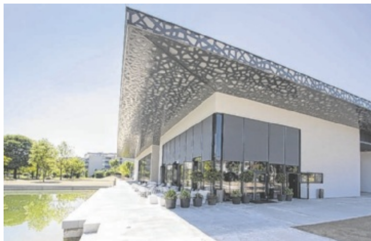
Die Spinnerei Traun: modernes Ambiente für Kultur, Feste und Seminare