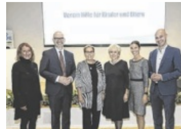
Jubiläum wurde gefeiert.

Der Nachmittag begann mit einer Fachtagung, bei der Experten aktuelle Entwicklungen im Kin-