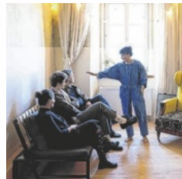
Die Hausbesuche finden in den eigenen vier Wänden statt.

Die Künstler Ariathney Coyne, Teresa Fellingner, Xenia Lesniewski, Tomaz Simatovic und András Meszerics können am 16. und 17. Oktober für eine ganz persönliche Performance in den eigenen vier Wänden gebucht werden. Die Gastgeber entscheiden selbst, ob noch Gäste dazu eingeladen werden oder man das Ganze lieber allein oder im Kreis der Mitbewohner erleben möchte. Jede Begegnung wird auf die räumlichen Gegebenheiten abgestimmt, kein Wohnraum ist zu