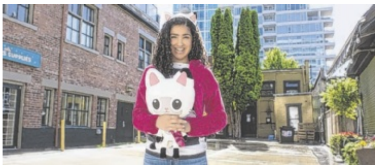
Gabby erlebt ein katzastisches Abenteuer.