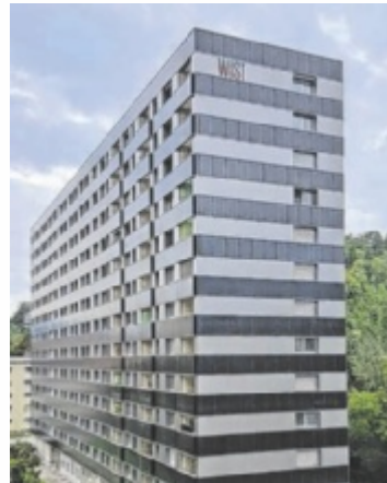
Das Wist-Heim an der Uni.

Alleine kann die Wist OÖ (Wirtschaftshilfe der Studierenden Oberösterreich) das Vorhaben allerdings nicht stemmen. Förderungen würden nötig sein, wird klargelegt. Bei der Uni beobachtet man den Fortlauf des Projekts: „Die Johannes Kepler Universität Linz begrüßt natürlich Initiativen, die Wohnmöglichkeiten für Studierende schaffen oder fördern – insbesondere für internationale Studierende sind leistbare Heimplätze fürs