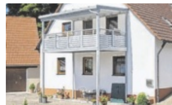
Vorstellbalkon mit Stützen

OÖ/NÖ. Ein Anbaubalkon von Leeb schafft zusätzlichen Wohnraum und steigert die Lebensqualität. Ob Neubau, Altbau oder nachträglicher Anbau – Leeb bietet für jedes Gebäude die passende Lösung, individuell angepasst und in hochwertigem Design.