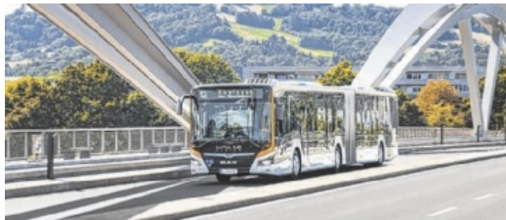
Neue Schnellbusse sind gefordert (Symbolbild).