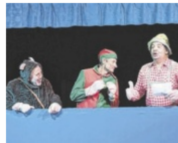
Auch der Kasperl schaut beim Bunkl wieder vorbei.

Schon zur Tradition geworden ist der Bunkl für die Pregartner Stadtbevölkerung. In diesem Kabarett der Union Pregarten werden im Pfarrheim Ereignisse und komische Situationen der Stadt und der Allgemeinheit aufs Korn genommen. Das Publikum wird sehen und hören können, worüber „Radio Leitnerberg“ berichtet, der Kasperl wird die Lachmuskeln der Zuschauer trainieren. Auch die Muppets sind abermals dabei. Video-Clips der „Tragweinersträbler“ und lustige Sketches sowie musika-