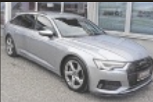
Audi A6 Avant 40 TDI quattro sport

204 PS, EZ 7/2019, 183.110 km, Diesel € 30.990,-