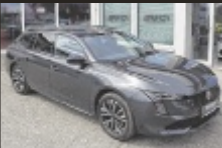
Peugeot 508 SW 1,5 BlueHDI

131 PS, EZ 7/2024, 27.150 km, Titanium Grau, Diesel € 29.990,-