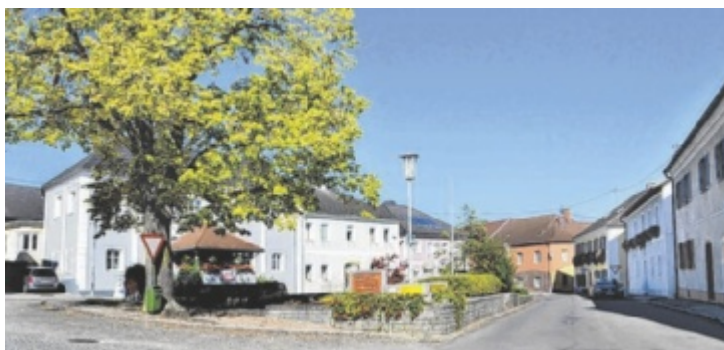
Der aktuelle Lasberger Marktplatz