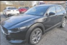
Mazda CX-30 e-Skyactive

150 PS, EZ 5/2024, 12.630 km, jet schwarz, Benzin € 33.990,-