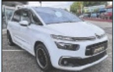
Citroën C4 Spacetourer PureTech

131 PS, EZ 1/2019, 66.240 km, Benzin € 16.488,-