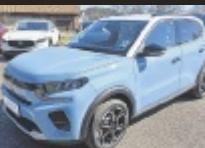
Citroën C3 e-C3 Electric 113

114 PS, EZ 2/2025, 10 km, Monte Carlo Blau, Elektro € 26.990,-