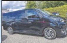
Toyota Proace Verso 2,0 D-4D

177 PS, EZ 7/2022, 174.048 km, Schwarz Met., Diesel € 36.988,-