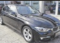
BMW 318d Luxury Line Aut.

150 PS, EZ 5/2016, 52.391 km, schwarz, Diesel € 22.990,-