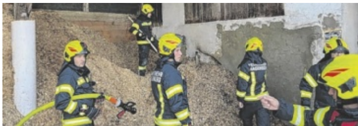
Den Kameraden blieben nur noch die Nachlöscharbeiten.

Infos und Anmeldung unter: www.kinderuni-ooe.at/weblab