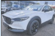
Mazda CX-30 e-Skyactive

122 PS, EZ 6/2024, 22.358 km, Snowflake Weiß Mat., Benzin € 27.490,-