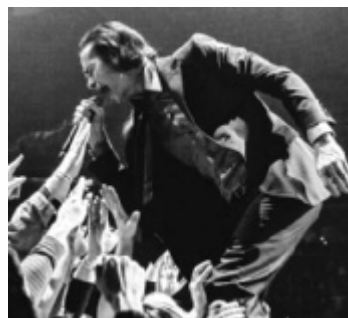
Nick Cave &amp; The Bad Seeds

Auch Tream, einer der erfolgreichsten deutschsprachigen Live-Acts der Gegenwart, macht auf sei-