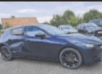
Mazda Mazda3 e-Skyactiv

122 PS, EZ 9/2024, 4.500 km, Deep Crystal Blau, Benzin € 27.988,-