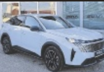
Peugeot 3008 Hybrid

145 PS, EZ 7/2024, 26.900 km, Okenite Weiß, Hybrid Elektro/ Benzin € 33.990,-