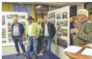
Eröffnung der Ausstellung im September

Das Jubiläum wird am 18. und 19. Oktober mit einem großen Fest gefeiert. Das Programm am Samstag startet um 14 Uhr mit dem Eintreffen am Marktplatz unter musikalischer Begleitung der Trachtenmusikkapelle Lasberg, um 14.30 Uhr folgt die Festrede von Hannes Etzlstorfer in der Pfarrkirche. Ab 15 Uhr werden Besichtigungen und Führungen durch die öffentlichen Einrichtungen in der Gemeinde, sowie Führung durch die Ausstellung „900 Jahre Lasberg“ angeboten. Ab 18 Uhr wird in der Mühlviertler Kernlandhalle mit einem Rückblick und Musik gefeiert. Am Sonntag wird um 8.30 Uhr mit der Aufstellung am Marktplatz zum festlichen Einzug in die Kernlandhalle begonnen, wo um 9.30 Uhr ein Festgottesdienst mit dem Propst von St. Florian, Klaus Sonnleitner, stattfindet. Ab 10.30 Uhr findet das Pfarrfest mit Frühschoppen und Musik mit der Trachtenmusikkapelle Lasberg statt. ■