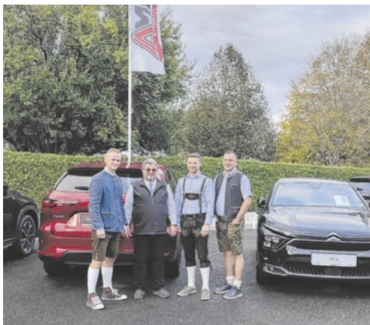
Viele Autos stehen beim Ambros-Oktoberfest zur Probefahrt bereit.

Vorführgewagen und Jahreswagen von Alfa Romeo, Fiat, Isuzu und Peugeot sowie Citroën und Mazda stehen an allen Tagen zur Besichtigung bereit. Premiere feiert der neue vollelektrische Mazda 6e, der mit tollem Design und moderner Technik überzeugt, sowie das neue Ligier JS50.