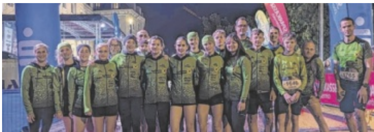
Die erfolgreichen Läufer