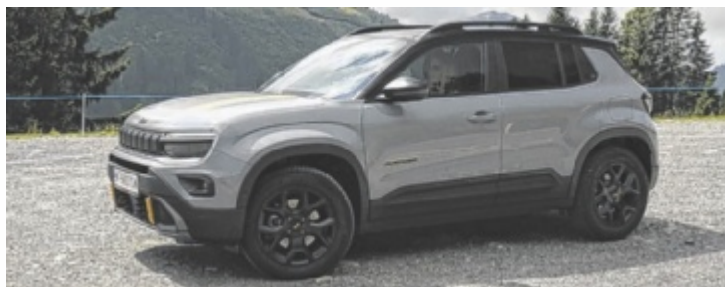
Der Jeep Avenger 4xe „The North Face“-Edition

Als Marke mit einem klaren Profil hat Jeep mit dem Avenger ein Fahrzeug geschaffen, das zunächst ohne Allrad startete – für viele ein Widerspruch zum Jeep-Image. Doch der Erfolg gab ihm recht, und mit dem später erschienenen „4xe“ kehrte auch die markentypische Geländekompetenz zurück. Die Kooperation mit dem Outdoor-Label „The North Face“ unterstreicht den Abenteuercharakter zusätzlich. Limitiert auf 4.806 Exemplare – die Höhe des Mont Blanc – zeigt die Edition Liebe zum Detail: topografische Linien am Armaturenbrett, 3D-Gebirgszüge in