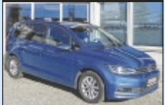
VW Touran Comfortline

116 PS, EZ 5/2019, 123.150 km, Diesel € 21.490,-