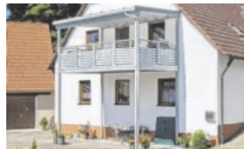
Vorstellbalkon mit Stützen

OÖ/NÖ. Ein Anbaubalkon von Leeb schafft zusätzlichen Wohnraum und steigert die Lebensqualität. Ob Neubau, Altbau oder nachträglicher Anbau – Leeb bietet für jedes Gebäude die passende Lösung, individuell angepasst und in hochwertigem Design.