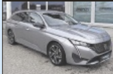
Peugeot 308 SW BlueHDI

131 PS, EZ 6/2024, 30.330 km, Artense Grau, Diesel € 24.990,-