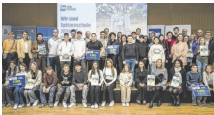
Die Gewinner-Schulen werden bei der Siegerehrung gefeiert.

Bewegung in der Schule, Tierwohl, Klima & Umwelt und Umgang mit Geld: Eine fachkundi-