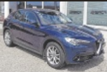
Alfa Romeo Stelvio Super 2,2

209 PS, EZ 8/2027, 67.300 km, Blue Montecarlo, Diesel € 27.990,-