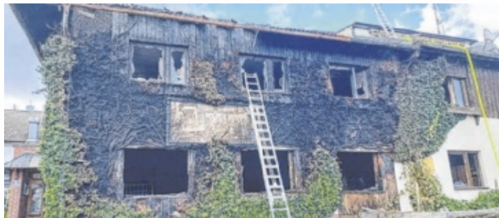
Am 21. November wird in Sachen Brandstiftung weiterverhandelt.