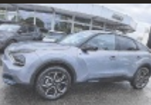
Citroën C4 Elektro 136

136 PS, EZ 4/2023, 4.900 km, Artense Grau, Elektro € 24.990,-