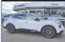
Citroën e-C4 X

136 PS, EZ 4/2023, 3.500 km, Nacre Weiß, Elektro € 25.990,-