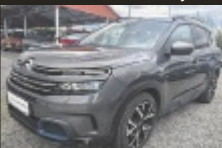
Citroën C5 Aircross Shine Hybrid

181 PS, EZ 4/2021, 98.688 km, Benzin € 22.990,-