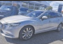
Mazda Mazda6 Sport Combi

194 PS, EZ 3/2024, 39.909 km, Platinum Quartz Met., Benzin € 39.490,-