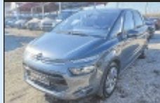
Citroën C4 Picasso Familyvan e-HDI

116 PS, EZ 6/2015, 173.587 km, Diesel € 10.488,-