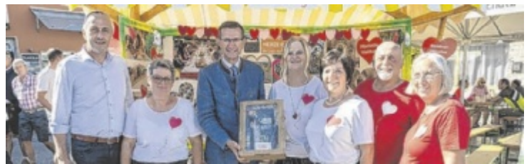
Eine Abordnung des Waldburger Verschönerungsvereins war bei der Ortsbildmesse vertreten (am Bild mit Landesrat Markus Achleitner)

Herzerlschießbude, die heuer erstmals zum Einsatz kam und großen Anklang fand. Ein besonderes Gesprächsthema war der neue Herzerlweg, der im Juni dieses Jahres offiziell eröffnet wurde. Landesrat Markus Achleitner, sowie zahlreiche Bürgermeister aus der Region und Bürgermeister Josef Eilmsteiner waren ebenfalls zu Besuch beim Waldburger Stand. ■