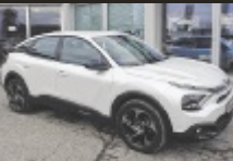
Citroën C4 BlueHDI 130 S&S

131 PS, EZ 3/2024, 22.741 km, Nacre Weiß, Diesel € 24.988,-