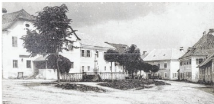
Marktplatz von Lasberg vor circa 100 Jahren

LASBERG. Ein fünfköpfiges Team hat sich ein Jahr intensiv mit der Geschichte Lasbergs beschäftigt und eine Präsentation der vergangenen Jahrhunderte zusammengestellt. Neben 14 Info-Tafeln werden dabei auch geschichtliche Objekte wie ein Tüllenbeil aus 1.000 vor Christus gezeigt. Die Ausstellung ist bei freiem Eintritt noch bis 18. Oktober an Wochenenden am Freitag und Samstag von 14 bis 18 Uhr, und am Sonntag von 8.30 Uhr bis 12 Uhr geöffnet. ■