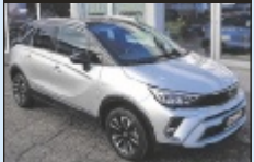
Opel Crossland 1,2 Turbo Elegance

110 PS, EZ 4/2024, 29.494 km, Quartz Grau Metallic, Benzin € 18.990,-