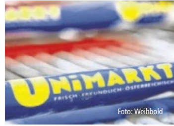
Unimarkt zieht sich vom Markt zurück.