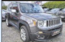
Jeep Renegade 2,0 MultiJet II

140 PS, EZ 3/2017, 116.514 km, Diesel € 18.990,-