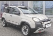
Fiat Panda TwinAir 85 4x4 4x40°

86 PS, 12/2023, 10.200 km, Elfenbein, Benzin € 24.990,-