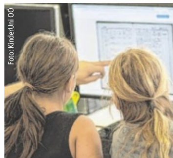
Programmieren, Experimentieren und spielerisch die digitale Welt entdecken.

Im Weblab haben junge Teilnehmer von Montag, 27. bis Freitag, 31. Oktober die Möglichkeit, in vielfältige digitale Welten einzutauchen. Dabei steht nicht nur der Spaß im Vordergrund, sondern auch das Sammeln wichtiger Erfahrungen im Umgang mit Technologien, Medien und Informationen. Ein zentrales Thema ist der sichere Umgang mit Daten, Fake News und Deepfakes. Die Teilnahme ist