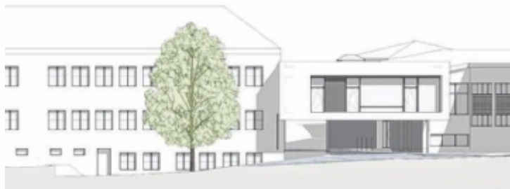
Straßenansicht Erweiterung Schule und Kindergarten

LASBERG. Die Marktgemeinde Lasberg setzt einen weiteren wichtigen Schritt in Richtung Familienfreundlichkeit und Zukunftssicherung: Die bestehende Infrastruktur von Volksschule und Kindergarten wird in den kommenden Jahren deutlich erweitert und modernisiert.