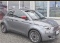
Fiat 500 Elektro Red Edition

118 PS, EZ 1/2023, 19.900 km, Mineral Grau, Elektro € 24.490,-