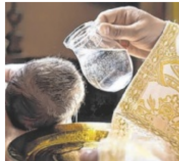
Fast 8.000 Menschen wurden 2024 in Oberösterreich getauft.

BEZIRK FREISTADT. 588 Aus- und 51 Wieder- bzw. Neueintritte verzeichnete die Katholische Kirche im Bezirk Freistadt im Jahr 2025.