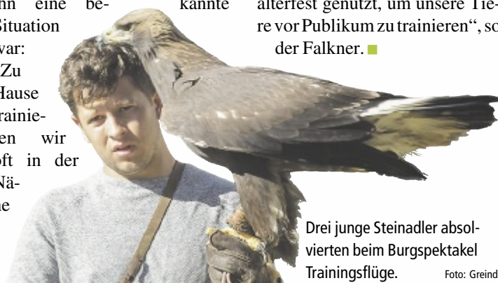
Drei junge Steinadler absolvierten beim Burgspektakel Trainingsflüge.

von Kühen. Das Tier wird ja grundsätzlich vom Falkner abgeholt, das war er gewohnt.“ Die Flüge beim Burgspektakel waren übrigens Trainingsflüge für die Vögel des Greifvogelhofs. Sie werden für die Jagd vorbereitet und absolvieren üblicherweise keine Flugvorführungen. „Heuer haben wir Jagderlaubnis in Schönau und haben das Mittelalterfest genützt, um unsere Tiere vor Publikum zu trainieren“, so der Falkner. ■