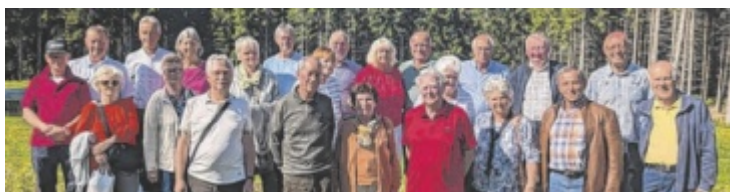
Die ehemaligen Schüler beim Klassentreffen