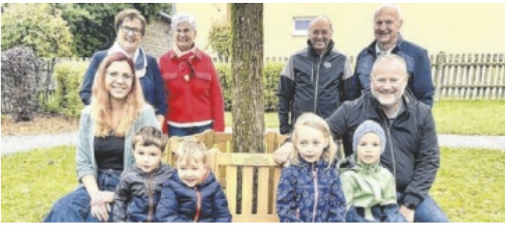
Das Bankerl wurde an die Kindergartenkindern überreicht.