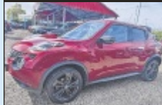
Nissan Juke 1,2 DIG-T Tekna

116 PS, EZ 5/2016, 108.080 km, New Red Metallic, Benzin € 10.988,-