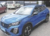
Peugeot 2008 PureTech

131 PS, EZ 4/2024, 34.720 km, Vertigo Blau, Benzin € 25.290,-