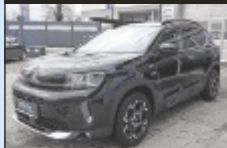
Citroën C5 Aircross BlueHDI 130

131 PS, EZ 4/2024, 28.881 km, Perla-Nera-Schwarz, Diesel € 30.990,-