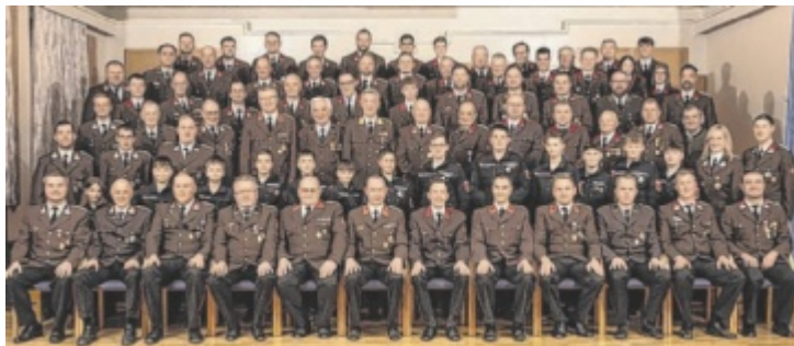
Die aktuelle Mannschaft bei der Vollversammlung 2025