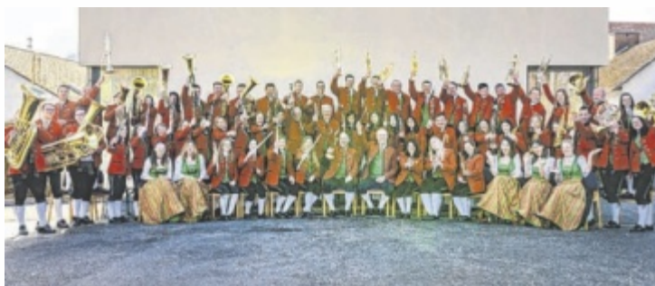
Der Musikverein Lasberg zählt aktuell rund 70 aktive Musiker.