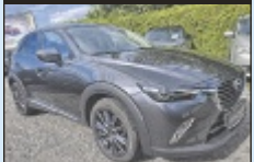
Mazda CX-3 CD105 AWD

105 PS, EZ 8/2017, 57.178 km, Machine Grau Met., Diesel € 15.990,-