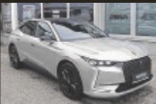
DS Automobiles DS 4 BlueHDI

131 PS, EZ 5/2024, 34.350 km, Kristall-Silber, Diesel € 30.990,-