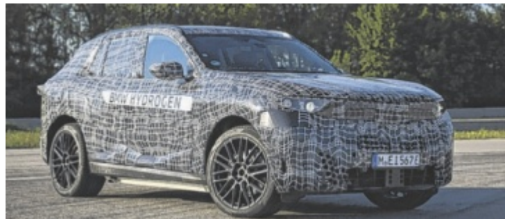
Nach der erfolgreichen Erprobung der Pilotflotte wird der neue BMW iX5 Hydrogen als erstes wasserstoffbetriebenes Serienmodell auf den Markt gebracht.

Nach erfolgreichen Tests mit einer Pilotflotte bringt BMW den iX5 Hydrogen als erstes wasserstoffbetriebenes Serienmodell auf den Markt. „Er wird ein echter BMW mit typischem Fahrvergnügen“, so Michael Rath, Leiter Wasserstofffahrzeuge. Das System basiert auf der dritten Generation der Brennstoffzellentechnologie. Es ermöglicht eine kompaktere Bauweise, höhere Effizienz, größere Reich-