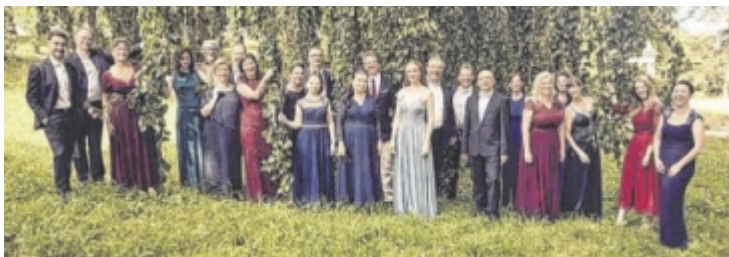
Das Wohlsang Ensemble präsentiert Stücke von Brahms und Schumann.