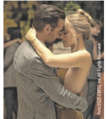
Margot Robbie und Colin Farrell

Die Singles Sarah (Margot Robbie) und David (Colin Farrell) treffen sich zum ersten Mal auf einer Hochzeit und begeben sich anschließend, dank einer überraschenden Wendung des Schicksals, zusammen auf eine große, gewagte und grandiose Reise – auf ein witziges, fantastisches und mitreißendes Abenteuer, bei dem sie nicht nur gemeinsam in ihre jeweilige Vergangenheit eintauchen. Sie erkennen auch, wie sie dorthin gekommen sind, wo sie heute sind und dass sie vielleicht