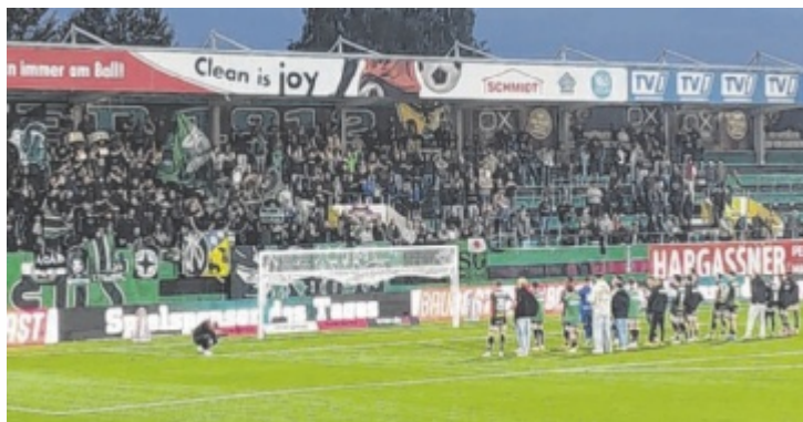
Trotz des Punkteverlustes gab es Applaus von der Westtribüne.