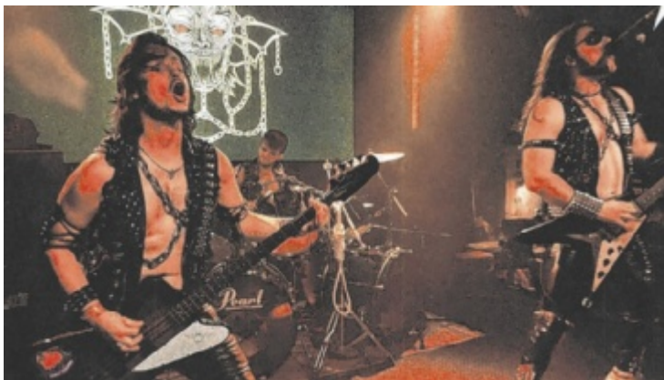
„Hellcrash“ kommen aus Italien nach Mehrnbach.

Mitspielen bis 03.10.2025/08 50 Uhr www.tips.at/g/25316 oder SMS an 0676 8002525 Text: „25316 Vorname Nachname“