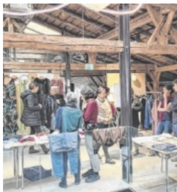
Der Kleidertauschmarkt erfreut sich großer Beliebtheit.

RIED. Die Giesserei lädt zum nächsten Kleidertauschmarkt in das zweite Obergeschoß ein. Die Besonderheit dieses Kleidertausches, es fließt kein Geld – stattdessen können gut erhaltene Kleidungsstücke einfach getauscht oder kostenlos mitgenommen werden. Jeder Besucher darf maximal fünf gewaschene, gut erhaltene Kleidungsstücke mitbringen, die vor Ort kurz begutachtet werden. Auch wer selbst nichts mitbringt, ist will-