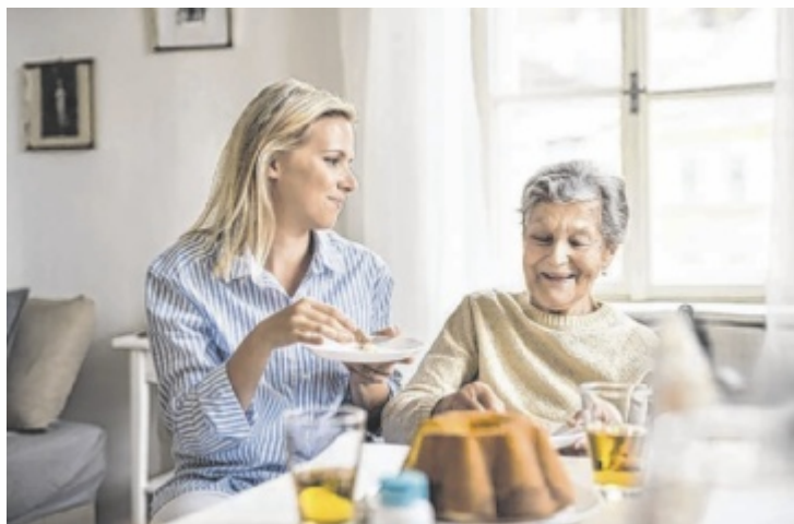
Ein Miteinander der Generationen sorgt für mehr Lebensqualität im Alter und bereichert das Leben der helfenden Menschen.

Das afrikanische Sprichwort „Es braucht ein ganzes Dorf, um ein Kind großzuziehen“ lässt sich auch aufs Altern übertragen: Altern gelingt dort am besten, wo Menschen füreinander Verantwortung übernehmen und wo sich Generationen gegenseitig unterstützen. Betreuung sollte nicht nur institutionelle Aufgabe, sondern auch gesellschaftliche Kul-