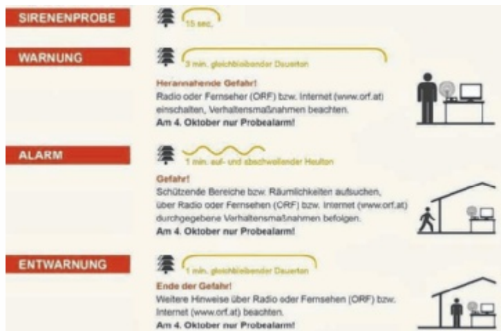
Die Bedeutung der Sirenensignale

Die Zivilschutz-Sirenensignale sind anders als diejenigen für die