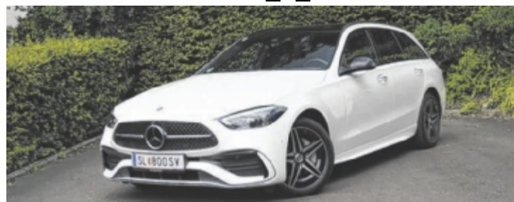
Der Mercedes C 300 de T-Modell ist ab 65.500 Euro zu haben.

Bei „Plug-in-Hybrid“ denkt man an Benziner plus E-Antrieb. Mercedes geht einen anderen Weg: Diesel und E-Motor. Der C 300 de T zeigt, dass diese Kombination viel Sinn macht und beeindruckende Fahrleistungen liefert.