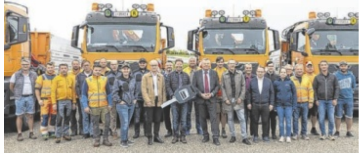
Die Übergabe ÖAMTC-Übungsplatz in Marchtrenk

Die Fahrzeuge wurden auf dem Verkehrsübungsplatz des ÖAMTC in Marchtrenk übergeben. Die Fahrer wurden hier umfassend eingeschult. Haupt- und Reservefahrer konnten die LKW