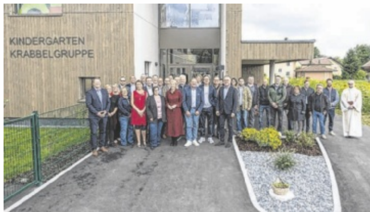
Die Festgäste vor dem Neubau

„Wir haben ein gemeinsames Ziel: Oberösterreich zum Kinderland Nr. 1 zu machen. Jede Gemeinde, die Investitionsmaßnahmen im Bereich der Kinder-