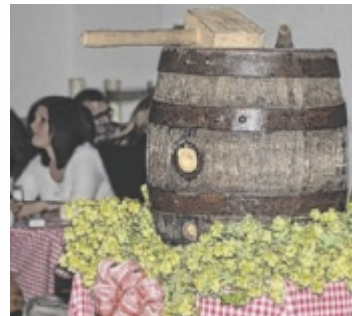
Die Brauerei Raschhofer feiert den Bockbieranstich.

Der Raschhofer Bockbieranstich ist ein musikalisches Fest der Freundschaft, der Begegnung und des Genusses. Gestartet wird um 18.30 Uhr mit einer Happy Hour im Rösslpark. Anschließend wird der Bock feierlich im Gwölb angeschlagen. Erstmals wird heuer eine Gruppe der Altheimer Stadtmusik den Abend gestalten. Kapellmeister Franz Feichtinger wird dabei mit Walzer und Ländler für gute Stimmung sorgen. Das Motto: sich unterhalten und unterhalten werden. ■