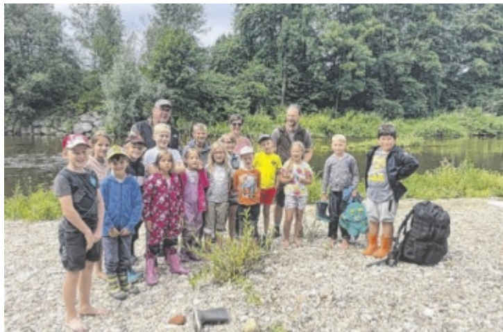
Die Kinder hatten viel Spaß bei den Ausflügen.

Das abwechslungsreiche Programm reichte von Fledermaus-Spaziergängen bei Nacht, verschiedenen Exkursionen bis hin zum Bau von Wildbienen-Hotels. Insgesamt beteiligten sich 16 Gemeinden an der Aktion. Experten des Naturschutzbundes OÖ begleiteten die Ausflüge und sorgten mit altersgerechter Vermittlung, dass absolut keine