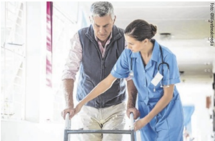
Pflegekräfte leisten einen unverzichtbaren Beitrag für die Gesellschaft.

Beim Symposium „Mental Health – Changemaker in der Pflege“, das am 1. Oktober um 15 Uhr im Welios in Wels stattfindet, suchen Experten und Praktiker gemeinsam nach neuen Wegen für das Pflegewesen. Zentrale Fragestellung ist dabei: Wie kann die Arbeit in der Pflege