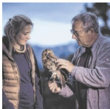
Tiere der Nacht

Der Naturpark Attersee-Traunsee und viele österreichische Naturparke feiern die Earth Night und laden dazu ein, bei der „Langen Nacht der Naturparke“ die natürliche Dunkelheit zu entdecken. Besucher können spannenden Nachtgeschichten lauschen, die Nachtnatur mit Experten erleben, das Reich der Fledermäuse erkunden, Nachtgeschöpfe basteln, erstaunliche Blicke ins Weltall werfen, unterschiedlichen Vorträgen lauschen und mit Forschern Schmetterlinge anlocken und bestimmen. Am 19. September um 22 Uhr wird in Altmünster das Licht abgedreht –