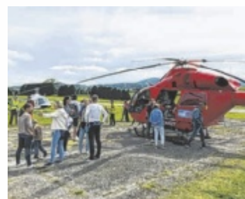
Rettungshelikopter zu Gast