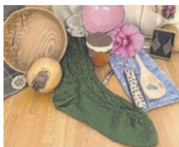
Volksfest in Ebensee