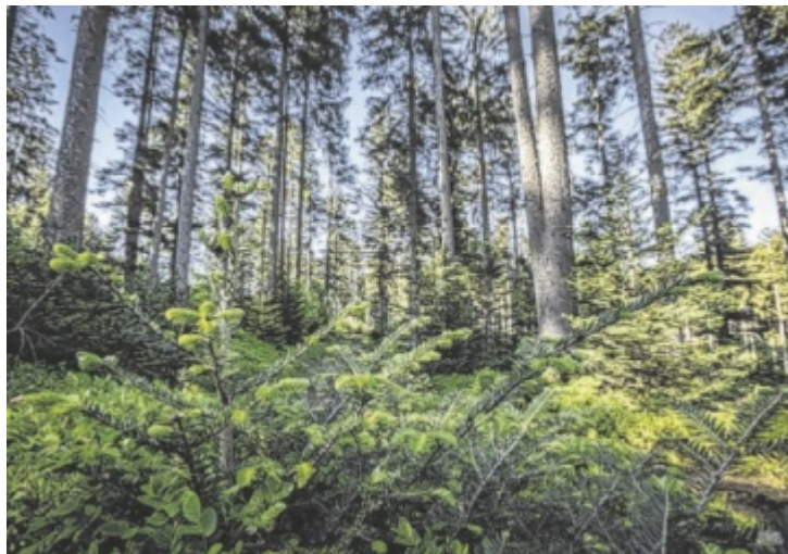
Klimafitter Wald der Zukunft