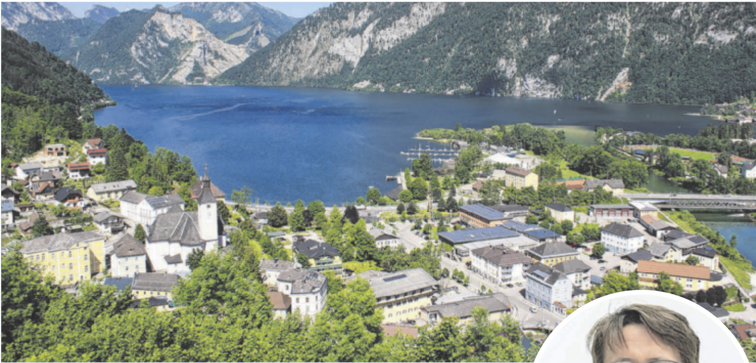
Von der Krabbelgruppe bis zur Schwimmplattform: Ebensee investiert