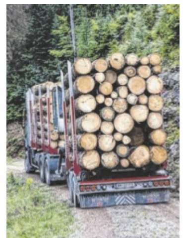
Abtransport von Schadholz

„Auch wenn dieser Sommer für viele kühl und verregnet war – für den Wald waren es gute Wochen“, lautet die Bilanz der ÖBf-Vorstände. Mit einer stabilen Holzversorgung, einer gesunkenen Schadholzmenge und den Fortschritten beim Waldumbau blickt man vorsichtig optimistisch in die Zukunft. Gleichzeitig bleibt klar: Am Ende bestimmt die Natur den Takt – und abgerechnet wird, wie jedes Jahr, erst mit dem 31. Dezember. ■