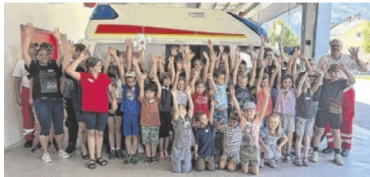
Der Besuch bei den Einsatzorganisationen war ein Höhepunkt.

Besonderen Zuspruch fanden Aktivitäten in der Natur. Bei einer Wanderung mit „Moar Alpaka Moments“ begleiteten die Kinder die vier Alpakas Othello, Ocean, Mouny und Bernhard. Mit KLAR Bad Ischl – Ebensee ging es unter dem Motto „Natur pur am Offensee“ hinaus ins Freie, wo heimische Pflanzen und Tiere spielerisch erkundet wurden. Geduld war beim Kinder-Fliegenfischen gefragt. Auch der Sport kam nicht zu kurz. Der SV