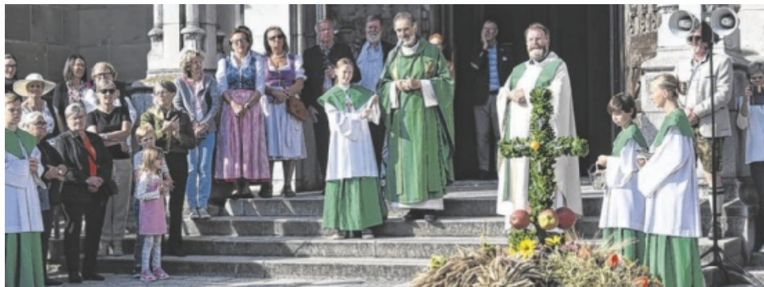
Wertschätzung für bäuerliche Arbeit und Lebensmittel wird mit einem Gottesdienst und einem Schmankerlmarkt in und um den Linzer Mariendom zum Ausdruck gebracht.

Von 11 bis 15 Uhr findet ein Schmankerlmarkt statt, bei dem