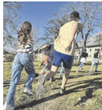
Rubenshof Lauf