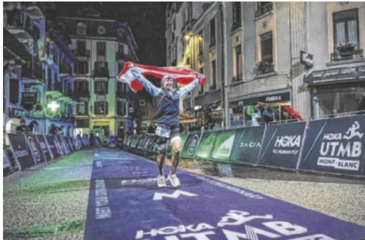
Nach etwas mehr als 16 Stunden glücklich im Ziel in Chamonix.