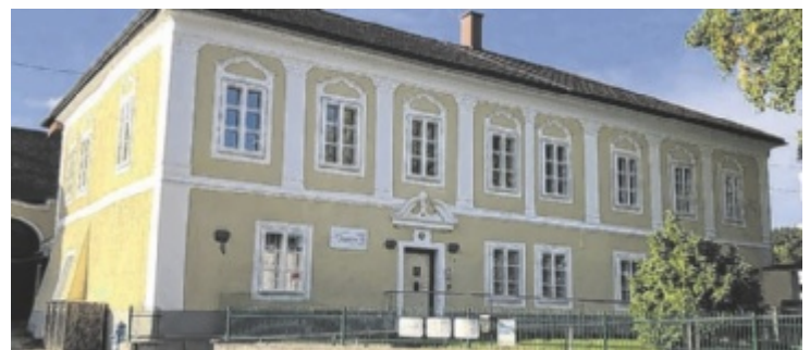
Das Quartier 16, ein Haus für Frauen in Not, der Franziskanerinnen Vöcklabruck wurde 2023 mit einem Anerkennungspreis ausgezeichnet.