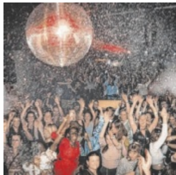
Mamas auf der Tanzfläche

Am Samstag, 27. September, öffnet das G'SPUSI in Vöcklabruck erneut die Türen für ein besonderes Event: „Mama geht tanzen“. Diese After-Care-Party bietet Müttern die Gelegenheit, den Alltag hinter sich zu lassen und ungestört zu feiern. Ab 20 Uhr gehört die Tanzfläche ganz den Frauen, die sich eine wohlverdiente Auszeit nehmen möchten. Ab 23 Uhr dürfen dann auch die Männer dazukommen. Das Konzept ist einzigartig und genau auf die Bedürfnisse von Müttern abgestimmt. Während die Kinder zu Hause schlafen,