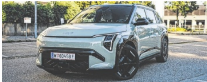
Der KIA EV3 GT-Line ist ab 53.190 Euro zu haben.

Nach dem großen EV9 sorgt nun der EV3 für Aufsehen und wirbelt das Segment der kompakten E-SUVs auf. Getestet wurde die Top-Ausstattung „GT-Line“ mit großem Akku: 81,4 kWh, Reichweite bis 563 Kilometer. Dazu 204 PS und 0–100 km/h in 7,7 Sekunden – flott, aber stets alltagstauglich. Optisch wirkt er aggressiver, als er fährt, doch das passt: Komfort und