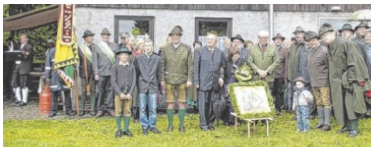
Die Schützen zeigen ihr Können mit dem Kleinkalibergewehr.