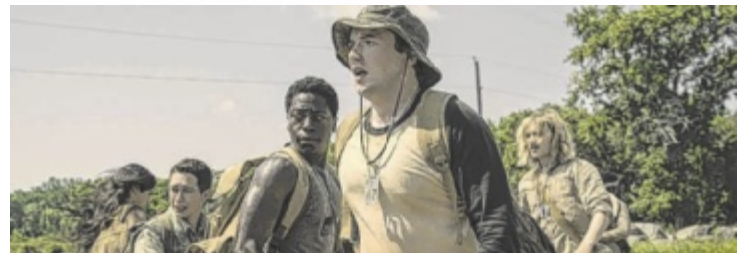
Szene aus „The long Walk - Der Todesmarsch“

Ab 11. September bei Star Movie www.starmovie.at