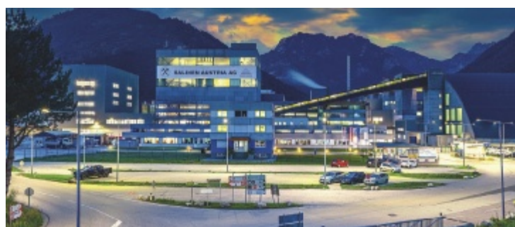
Das Headquarter der Saline in Ebensee

stark nachgefragt wird. Schon jetzt gehen knapp 60 Prozent der Produktion in den Export, besonders nach Deutschland, Italien und Osteuropa. Ein weiterer Wachstumsmotor ist hochreines Pharmasalz, das weltweit nur wenige Hersteller anbieten. Es wird vorwiegend nach Südamerika und Asien geliefert und findet Einsatz in Dialyse, Medikamenten und Hygieneprodukten. Auch bei Speisesalz, Pökelsalz und der Marke Bad Ischler sind Mengensteigerungen geplant. Wesentlich ist auch der Ausbau der Logistik: Eine 170 Meter lange Förderbrücke wird ab 2026 die Produktion direkt mit den Lagerhallen in Ebensee verbinden und bis zu 130 Paletten pro Stunde transportieren. Parallel wird im Bergbau in zusätzliche Prospektionsbohrungen und neue Bohr-