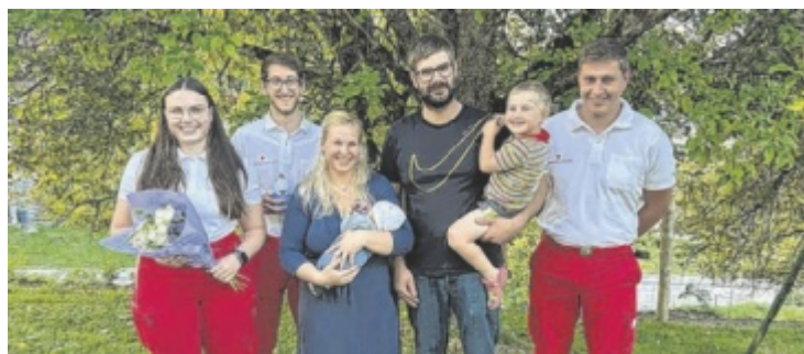
Die Vorchdorfer Sanitäter mit den glücklichen Eltern