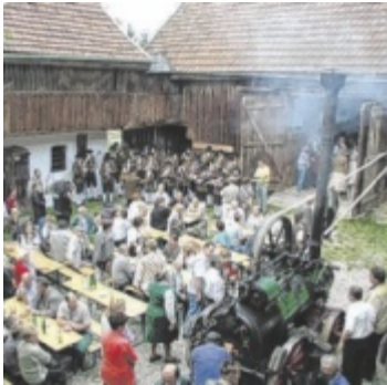
Druschwoche lädt ein

Am Stehrerhof in Neukirchen an der Vöckla findet von 13. bis 21. September 2025 die 46. Druschwoche statt, die Besucher in die Welt alter landwirtschaftlicher Traditionen entführt. Eröffnet wird das Fest am Samstag um 14 Uhr, begleitet von der Musikkapelle Neukirchen. Schon am ersten Wochenende warten Vorführungen wie Dampfmaschinendreschen, Handdreschen, Pferdegöpelfahrten und zahlreiche Handwerksarbeiten, dazu Volksmusik, Krapfenbacken und Kräuterschnapsbrennen. Am Sonntag gesellt sich ein großes Traktor-Oldtimertreffen hinzu, ab Mittag wird zum Volkstanz geladen. Von Mittwoch bis Freitag stehen die „Tage der Schu-