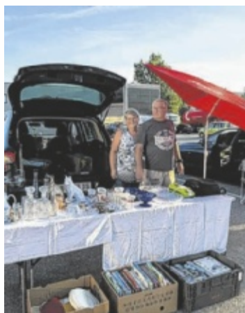
Flohmarkt in Ampflwang

Der Parkplatz beim Spar Köster in Ampflwang wird am 14. September von 8 bis 12 Uhr zum bunten Marktplatz. Die Kinderfreunde Ampflwang laden zu einem Kofferraumflohmarkt, bei dem jeder unkompliziert mitmachen kann. Das Prinzip ist simpel: Auto parken, Kofferraum öffnen und verkaufen, was man selbst nicht mehr braucht – von Kleidung und Spielsachen bis hin zu Büchern oder kleinen Schätzen. Käufer können gemütlich von Kofferraum zu Kofferraum schlendern, stöbern und das eine oder andere Schnäppchen machen. Das Besondere: Für Ver-