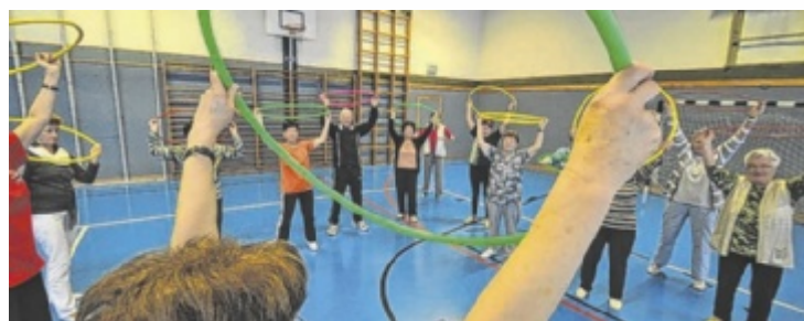
Die Kurse haben das Ziel Körper und Geist im Alter zu stärken.

Auch Übungen, die körperliche und geistige Prozesse miteinander verbinden, sind Teil des Programms. Damit soll sowohl die körperliche Fitness verbessert als auch die geistige Leistungsfähigkeit unterstützt werden. Die Kurse beginnen am Montag, 22. September, um 10 Uhr in der Rotkreuz-Ortsstelle Ebensee. Geleitet werden die Einheiten von erfahrenen Übungsleitern. Anmeldung für Neustarter unter 07612/65093-106. ■