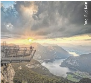
Sonnenuntergang am Krippenstein.

Eine Anmeldung ist aus organisatorischen Gründen bei der Tourismusinformation Obertraun erforderlich (Tel. 05 95095-40). Infos unter www.obertrauner-bergerlebnis.at ■