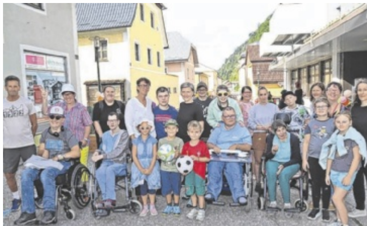
Sichtbares Zeichen für ein respektvolles Miteinander.

Das Straßenbild war geprägt von fußballspielenden und tanzen- den Kindern, aber auch Erwachsene beteiligten sich aktiv am Geschehen. Viele nutzten die Gelegenheit, den Straßenraum einmal ohne motorisierten Verkehr zu erleben und die Gemeinschaft in ungezwungener Atmo-