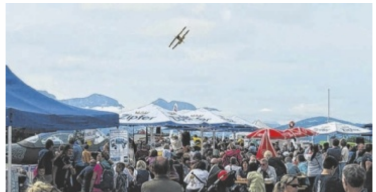
Volles Haus beim Flugplatzfest in Gschwandt

Ein weiterer festlicher Programmpunkt war der Frühschoppen mit Feldmesse und Flugzeugsegnung. Kulinarisch punktete das Fest mit Streetfood, kühlen Getränken und gemütlichen Sitzmöglichkeiten rund um das Flugfeld. Begleitet von einer Blasmusiker-Gruppe genossen die Besucher eine lockere Atmosphäre, die das Flugplatzfest zu einem gelungenen Familienwochenende machte. ■