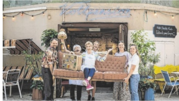
Vollpension in Bad Ischl soll dauerhafte Generationencafés anregen.

Mit der Tour durch Österreich möchte die Vollpension prüfen,