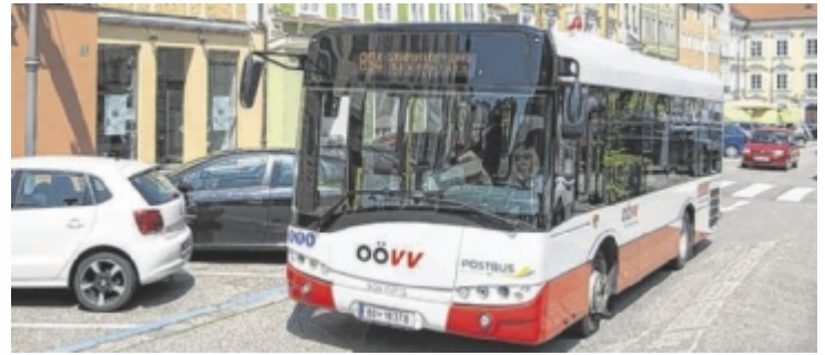
ÖÖVV-Freifahrten während der Mobilitätswoche

Gerade im innerstädtischen Verkehr können die Freifahrten einen großen Unterschied machen: In Vöcklabruck stehen die Stadtbuslinien für alltägliche Wege zum Einkaufen, zur Arbeit oder in die Schule kostenlos zur Verfügung. Auch Bad Ischl bietet mit seinen Stadtbussen eine attraktive Möglichkeit, während der Mobilitätswoche unkompliziert und klimafreundlich unterwegs zu sein. In Gmunden profitieren Fahrgäste von kostenlosen Fahrten mit den Citybussen – ein An-