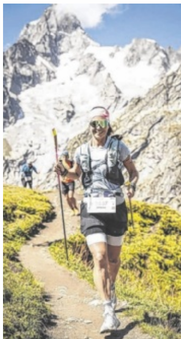
Unterwegs beim CCC

ihre Liebe zum Trail entdeckt. Der Traillauf ist eine Form des Langstreckenlaufs, die abseits asphaltierter Straßen stattfindet. 2015 hat der Leichtathletik-Weltverband den Traillauf als offizielle Disziplin anerkannt. Seitdem hat der Sport einen ungeheuren Zuspruch. Hatten Veranstalter noch vor wenigen Jahren Probleme, genug Starter für ihre Rennen zu bekommen, gibt es jetzt bei vielen Trailrennen Lotterien, um überhaupt einen Startplatz zu ergattern.