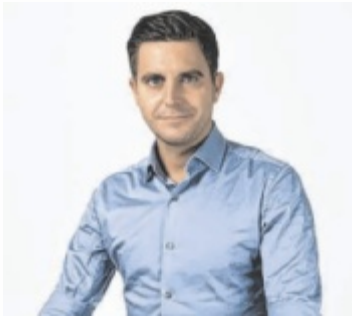
Veranstalter Philipp Roitingger

ge so gestaltet werden, dass sie die mentale Gesundheit der Beschäftigten fördert und nicht