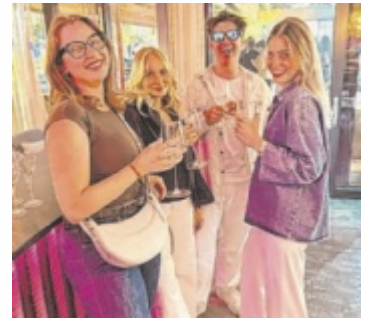
Gäste genossen das Event

und Seeterrasse tanzten und den Blick über den Attersee genossen. Sonne, Drinks, Beats – und dazu ein Publikum, das wie aus einem Mode-Magazin entsprungen schien. Die „Lake Life Day Party“ setzte ein sommerliches Statement: So jung, stylish und vibey zeigt sich der Attersee nur selten – und machte klar, dass dieser Hotspot auch in Sachen Lifestyle ganz vorne mitspielt. ■