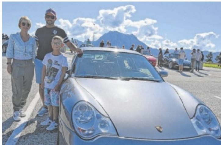
Das achte Treffen der Porsche Freunde Salzkammergut beim Berggasthof Urzn am Gmundnerberg brachte einen neuen Teilnehmerrekord.

Schon beim Eintreffen der ersten Fahrzeuge wurde deutlich, dass die Veranstaltung neue Dimensionen erreichen würde. Die besondere Lage mit Blick auf Traunsee und Traunstein sowie das sonnige Wetter boten den passenden Rahmen. Vertreten waren sämtliche Baureihen und Baujahre, von klassischen Modellen bis hin zu aktuellen Varianten. Auch zahlreiche Gäste ohne eigenen Porsche nutzten die Gelegenheit, die Fahrzeuge aus nächster Nähe zu sehen. „Ich