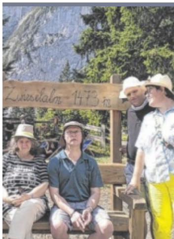
Ausflug Die Bewohner der Lebenshilfe-Wohngemeinschaft Bad Ischl unternahmen einen Ausflug auf die Gosauer Zwieselalm.

weiterhin gute Beschäftigungschancen bestehen. Vor allem für junge Menschen ist die Situation günstig. ■