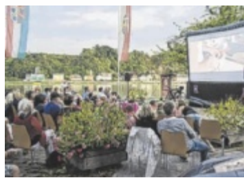
Sommerkino der SPÖ