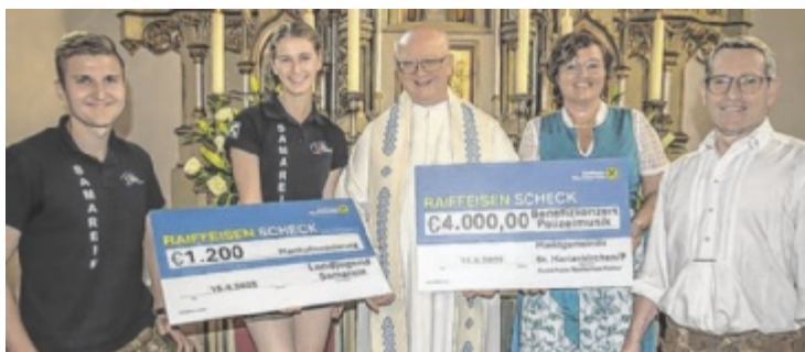
Spendenübergabe in der Samareiner Pfarrkirche