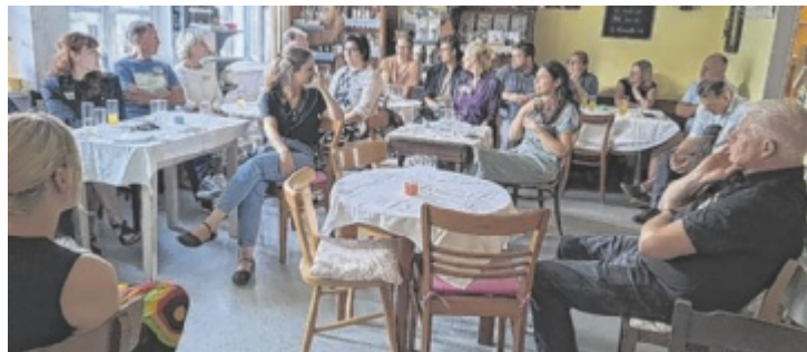
Keresztes hat zahlreiche „Pioniere“ aus der Region Mostlandl Hausruck zu einer Diskussionsrunde in „D'Spezerei“ in Weibern eingeladen.

Keresztes hat sich an die Initiatoren und Betreiber ganz verschiedener Projekte gewandt, um ein breitgefächertes Spektrum an Erfahrungen zu erhalten. Darunter waren der Pollhamer Bauernladen „Baula“, die Furthmühle in Pram, das Gasthaus Hofwirt in Michaelnbach, das „Körberl“ vom Verein 4722 bodenständig in Peuerbach, das HairZstück in Taufkirchen, das Regionalladen-Café „D'Spezerei“ in Weibern, „Feli &