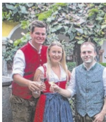
Weinfest Die Tegernbacher Feuerwehr lädt am Samstag, 13. September zum Weinfest in die Hofbühne. Seite 32