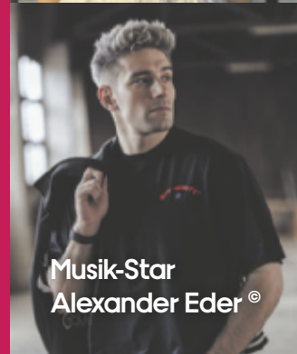
Musik-Star Alexander Eder