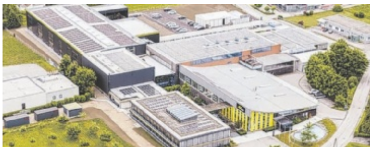
Die Firma Stumpfl hat mit dem Bau der neuen Halle in Wallern ihr mögliches Produktionsvolumen verdoppelt.