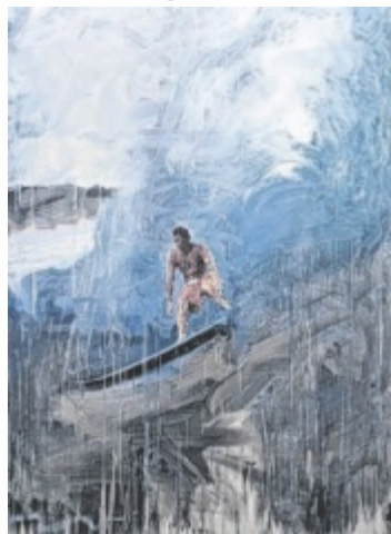
„Dirty Surfing“, Hans Weigand Foto: Weigand

Im Rahmen von „Kunst im Kabinett“ wird die oberösterreichische Künstlerin Marion Kilianowitsch mit ihrer Technik der geschweißten Bilder auf Stahl und Aluminium mit Acryl und Text ausgestellt.