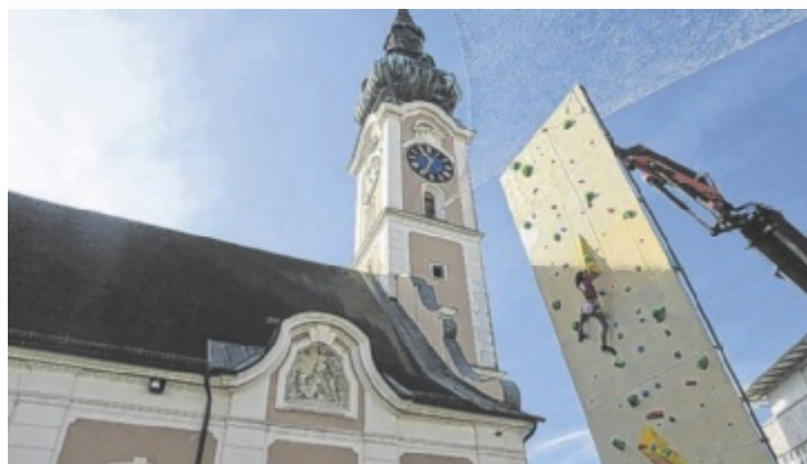
Bei „Rock the Wall“ messen sich Kletterer in Grieskirchen.

werbs zwei Routen in einer vorgegebenen Zeit. Die Wand wird von Durchgang zu Durchgang steiler aufgerichtet. Start der Veranstaltung ist um 10 Uhr. Zusätzlich wird ein kleiner Kletterturm aufgestellt, an dem erste Kletterversuche unternommen werden können. Bei Schlechtwetter findet die Veranstaltung nicht statt. ■