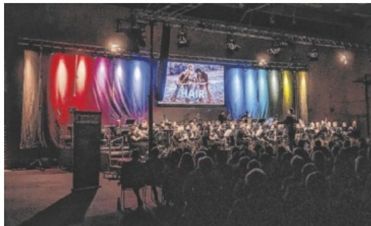
Das Bezirksjugendorchester Grieskirchen lädt zum gemeinsamen Konzert mit dem OÖ Landesjugendchor und den Academy Singers.

gemeinsam mit dem oberösterreichischen Landesjugendchor und den Academy Singers auf. Vorverkaufskarten um 15 Euro gibt es beim Team des BJO Grieskirchen oder unter bjo.grieskirchen@gmail.com . An der Abendkasse kosten sie 18 Euro. ■