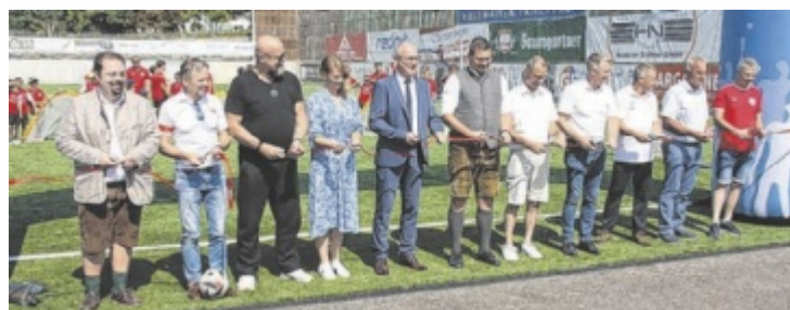
Der Sportplatz wurde im Beisein zahlreicher Ehrengäste eröffnet.

von den insgesamt 1,5 Millionen Euro umfassenden Kosten und circa 8.000 vom Verein geleistete Arbeitsstunden brachte die Union Ikuna Natternbach auf. Der Rest wurde durch Förderungen des Landes Oberösterreich aus Sport- und Bedarfszuweisungsmitteln sowie durch Zuschüsse des Oö. Fußballverbandes und der Marktgemeinde Natternbach finanziert. Die neue Anlage wurde im Beisein zahlreicher Gäste mit einer Segnung feierlich eröffnet. ■