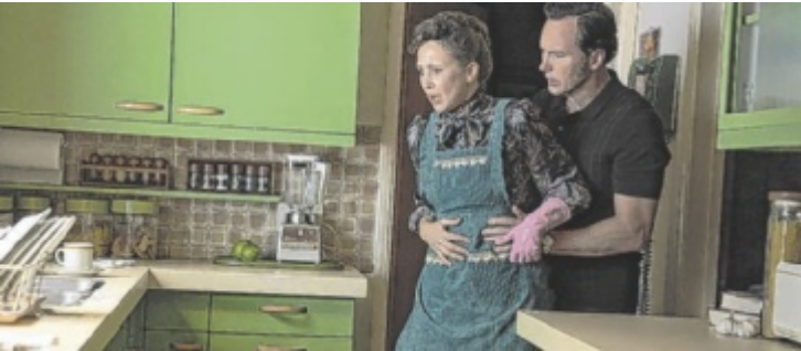
Vera Farmiga und Patrick Wilson ermitteln in paranormalen Fällen.