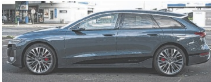
Der Audi A6 Avant e-tron quattro ist ab 81.200 Euro zu haben.

Der Audi ist ein Poser mit Substanz, ein technisches Gesamtkunstwerk für all jene, die Technik lieber fahren als verstehen. Aufmerksamkeit ist garantiert: futuristische Front, elegante Silhouette, Plasmablau Metallic und 21-Zöller. OLED-Leuchten samt