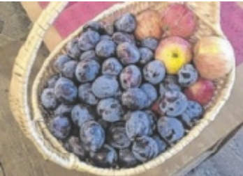
Erntefrisches Obst