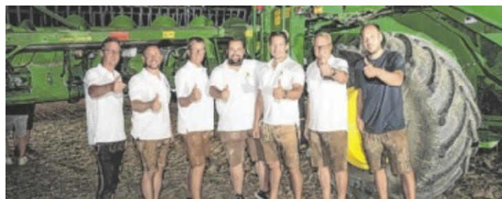
Das Lagerhaus Eferding OÖ-Mitte lud zum großen Feldabend.

tinger und Einböck vorgeführt: 13 John-Deere-Traktoren, ein Mäh-drescher sowie die neue 6M-Serie zeigten ihr Können. Ergänzt wurde das Programm durch Fachgespräche, Probefahrten, einen Lenksystem-Test sowie den Agrarcommander-Infostand mit Gewinnspiel. Nach der Vorführung konnten die Besucher die Maschinen selbst testen. ■