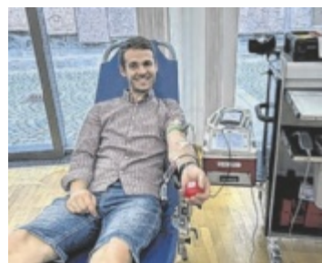
Die Landjugend im Bezirk Eferding hat Blut gespendet.