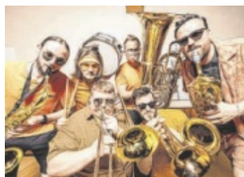
Naturwunda LT1 OÖ und Musikverein Haibach laden wieder zur größten Musikwanderung des Landes ein. Seite 31

„Falkner und die Linie im Sand“ heißt der zweite Krimi des Regisseurs und Drehbuchautors Oliver Jungwirth aus Haag. Die oberösterreichische Columbo-Hommage wurde zum Teil in Haag und Gaspolthofen gedreht. Die Hauptrollen spielen Alexander Knaipp und Musical-Star Daniela Dett. Am 11. September ist Premiere im Star Movie Ried. Seite 2