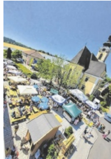
Die Marktgemeinde Scharten lädt zum zweiten Marktfest.

Am Samstag, 6. September, sorgt ab 18.30 Uhr die „Buchkirchner Tanzmusi“ im Festzelt für Stimmung. Um 21 Uhr folgt ein Dämmerchoppen mit DJ-Sound, organisiert von der Landjugend Eferding Umgebung. Am Sonntag, 7. September, gibt es um 10 Uhr einen ökumenischen Gottesdienst. Danach gestaltet der Musikverein Scharten einen musikalischen Frühschoppen. Um 13 Uhr hat die Volkstanzgruppe „Tanzhaufen“ ihren Auftritt. Zu-