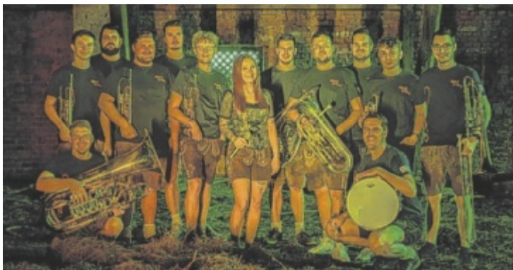
Auch die BlechBradla treten beim Naturwunda in Haibach auf.