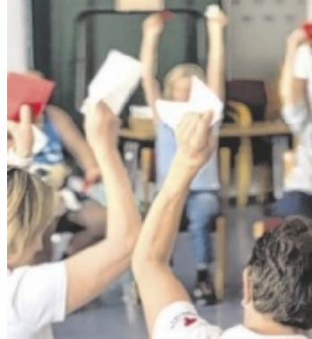
Im Rotkreuz-Haus kommt man zusammen um der Einsamkeit den Kampf anzusagen.

Die monatlichen Nachmittage im Rotkreuz-Haus in Grieskirchen bringen abwechslungsreiche Themen, die für Freude, Überraschungen und Anregungen sorgen. In gemütlicher Atmosphäre lädt das Rote Kreuz zu Kaffee und Kuchen ein, um gemeinsam eine schöne Zeit zu genießen. Die Teilnahme ist kostenlos, freiwillige Spenden sind aber gern gesehen.