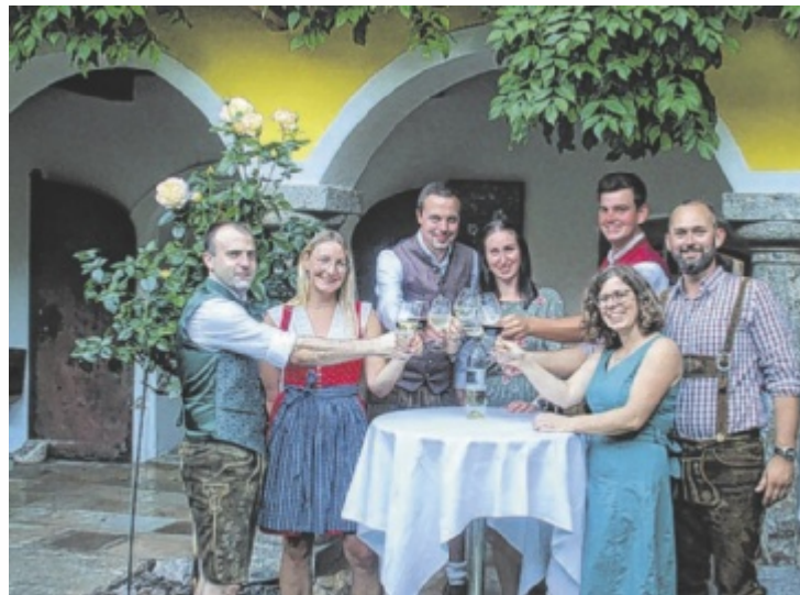
In der Hofbühne Tegernbach bieten die Mitglieder der Freiwilligen Feuerwehr und ihre Helfer Weine aus Österreich an.

In Vorbereitung des Festes haben die Mitglieder der Feuerwehr in den vergangenen Monaten Reisen unternommen. Sie waren in namhaften Weinregionen Österreichs unterwegs und suchten nach den besten Weingütern und wählten mit großer Sorgfalt die edelsten Tropfen aus. So erwartet die Besucher eine