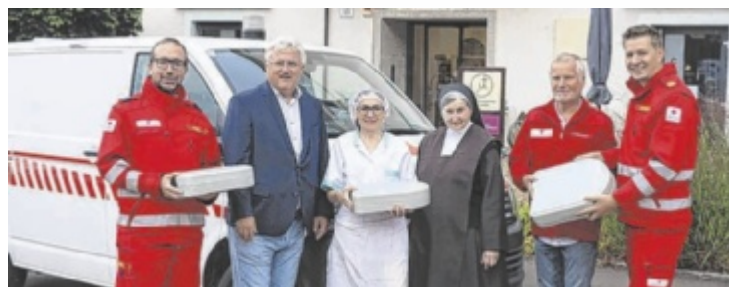
Das Rote Kreuz Eferding liefert „Essen auf Rädern“.

lacken zusammen, was die Gemeinden entlastet und für eine einfacheren sowie schnellere Abwicklung für die Klienten sorgt. Die Zustellung der Mahlzeiten erledigt weiterhin das Rote Kreuz Eferding, aber die Essensan- und -abmeldungen, Änderungswünsche sowie die Abrechnung erfolgen künftig direkt über die Partnerküche St. Teresa Bad Mühlacken. ■