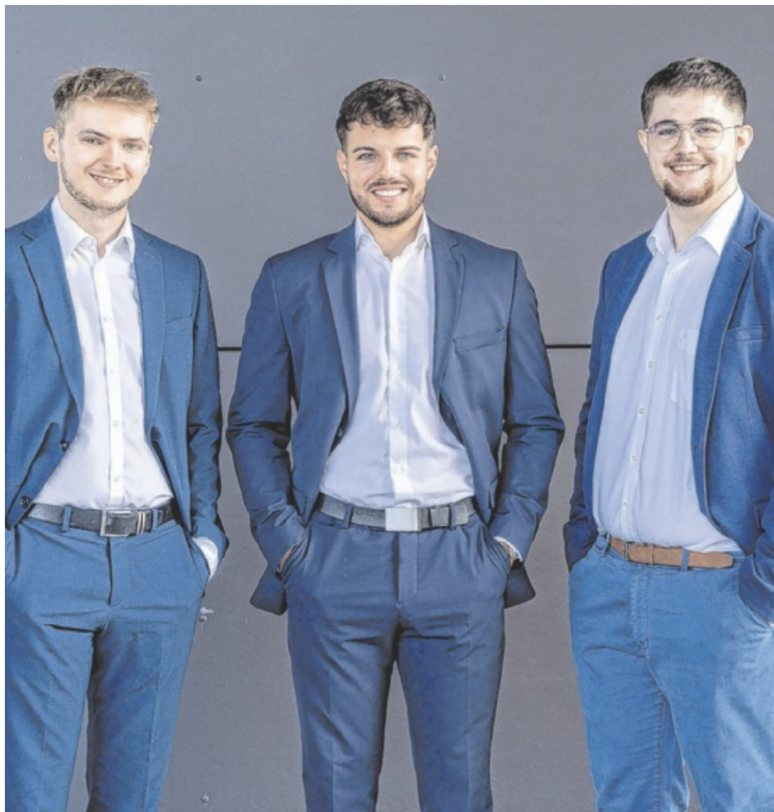
Automatisierung und Digitalisierung Das Softwareunternehmen Neon verlegt seinen Hauptsitz nach Grieskirchen und bringt Betriebe mit Digitalisierung und Automatisierung auf Effizienzkurs. Seite 13 / Foto: Nadine Höller / Anzeige