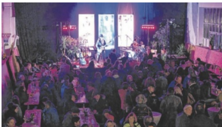
„Rock im Hof“ vom Institut Hartheim feiert Jubiläum.