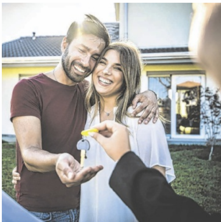
Wohnräume erfüllen mit den richtigen Finanzierungslösungen

Neun von Zehn sind dabei überzeugt, dass Immobilien eine wertbeständige Anlage für die Zukunft sind. Und jede zweite Person sagt, sie habe in der Pension eine Sorge