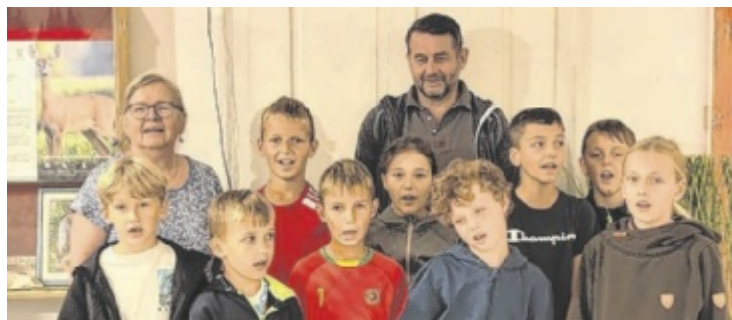
Die Kinder besichtigten im Rahmen der Ferienaktion die Sonderausstellung im Haager Heimatmuseum.