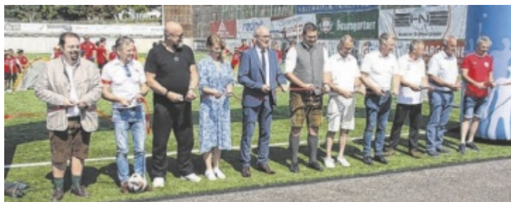
Der Sportplatz wurde im Beisein zahlreicher Ehrengäste eröffnet.

von den insgesamt 1,5 Millionen Euro umfassenden Kosten und circa 8.000 vom Verein geleistete Arbeitsstunden brachte die Union Ikuna Natternbach auf. Der Rest wurde durch Förderungen des Landes Oberösterreich aus Sport- und Bedarfszuweisungsmitteln sowie durch Zuschüsse des Oö. Fußballverbandes und der Marktgemeinde Natternbach finanziert. Die neue Anlage wurde im Beisein zahlreicher Gäste mit einer Segnung feierlich eröffnet. ■