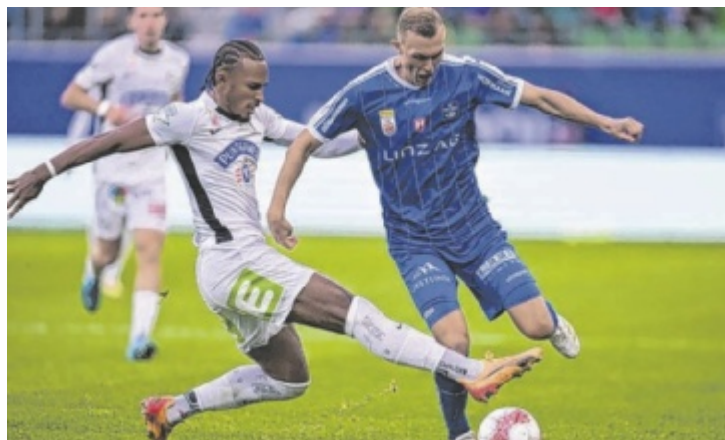
Sky und Ligaportal haben eine sensationelle Aktion.

Die Aktion richtet sich an alle, die den Nervenkitzel beim Wetten lieben und gleichzeitig hochklassigen Live-Sport genießen wollen. Sky X Sport bietet 100 Prozent Live-Sport mit allem, was das Herz begehrt: internationaler Spitzensport, ADMIRAL Bundesliga, hochkarätiges Tennis, Motorsport, Golf und viele weitere Sportarten – jederzeit und überall verfügbar. Die Teilnahme ist einfach: Zuerst wird beim Wettanbieter ein neues Wett-