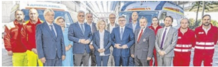
Pressetermin: Rettungs- und Notfallversorgung in Niederösterreich