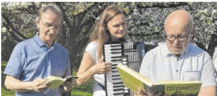
Abend mit Liedern von Hermann Leopoldi (1888–1959)