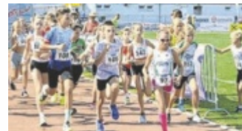
Schüler- und Jugendläufe

Beim Schnupperlauf für die Jahrgänge 2018 und jünger erhalten alle Kinder im Ziel eine Medaille und ein Überraschungssackerl. Bei den Schüler- und Jugendläufen der Jahrgänge 2017 bis 2008 werden sämtliche Jahrgänge separat gewertet. Ehrenpreise gibt es bis Rang sechs, zusätzlich lockt eine Sachpreisverlosung. Aus dem traditionellen Zwei-Stege-Lauf wird heuer