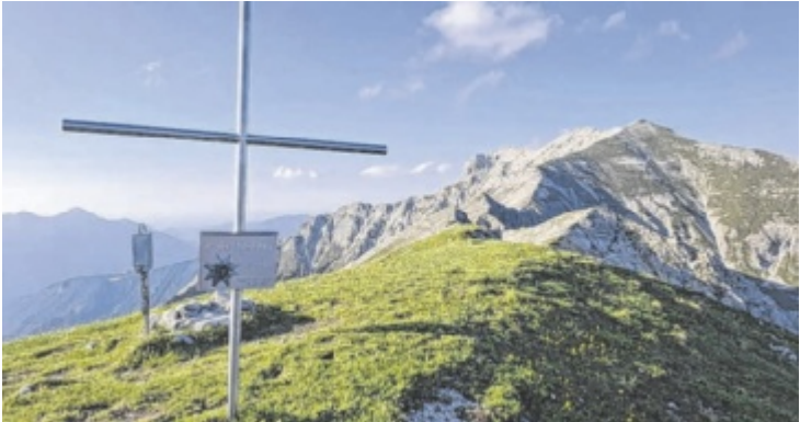
Rückblick vom Kleinmölbings-Gipfel auf die schöne Gratwanderung

Vorbei an der imposanten Bergkulisse von Spitzmauer und Priel, die sich im Wasser spiegeln, bietet sich ein fast kitschiges Startfoto. Am südlichen Ende des Sees beginnen die ersten Anstiegsmeter. Etwa 200 sind es, bis neben den Füßen auch die Hände zum Einsatz kommen. Das schwierigste Wegstück, für das absolute Trittsicherheit erforderlich ist, ist der seilversicherte, ausgesetzte Aufstieg zum Schrocken auf 2.882 Meter.