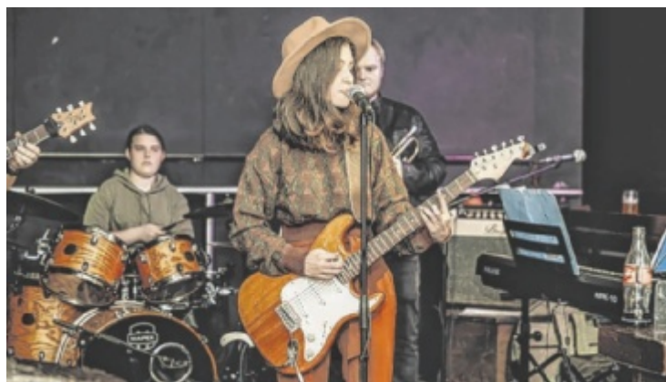
Auf der Bühne stehen mehrere Musiker aus der Region.