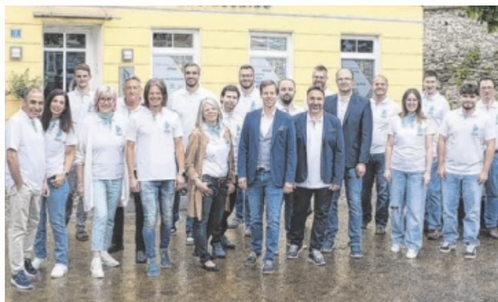
Das Team von Schatz Engineering lädt am 12. September zu einem Fest.

Seit der Firmengründung 1990 durch Franz Schatz entwickelte sich die Firma Schatz GmbH vom Einzelunternehmen zum international tätigen Planungsbüro für Industrieanlagen. Das Planungsspektrum reicht