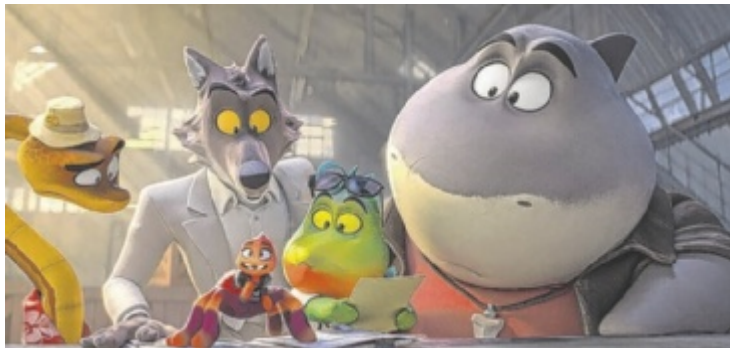
Es wird wieder spannend und chaotisch.