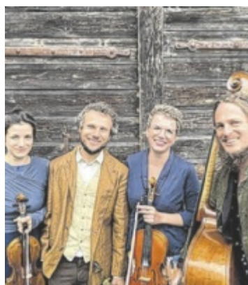
„Jakob, es ist Herbst“ Ab September findet in Neustadt/D. eine traditionsreiche Veranstaltungsreihe statt. Seite 19