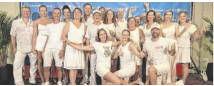
Ab 1. September lädt der Salsa Club wieder zu Workshops ein.