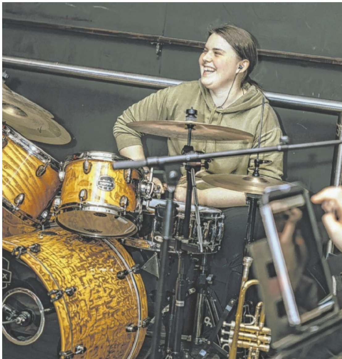
Final Jam Festival Das erste Final Jam Festival am Hauer-Hof in Hauersdorf lädt dazu ein, die Sommerferien mit einem abwechslungsreichen Line-up lokaler Bands ausklingen zu lassen. Seite 18