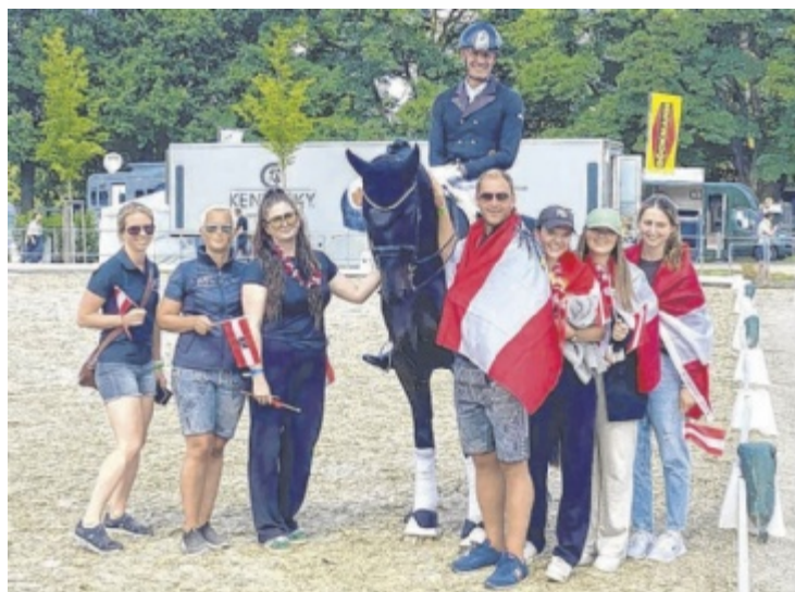
Freude bei allen Beteiligten über den Erfolg in Deutschland