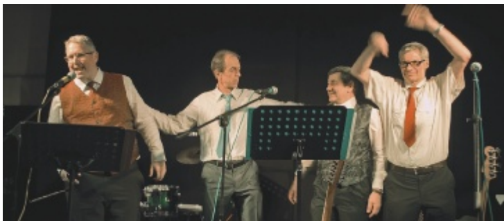
Auch die Band „Teachers' Project“ wird zu erleben sein.