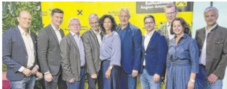
Vor dem Konzert lud die Raiffeisenbank zu einem Empfang ein.

Anlässlich des Internationalen Jahres der Genossenschaften 2025 wollte die Raiffeisenbank ihren Mitgliedern heuer etwas Einzigartiges bieten und konnte mit der