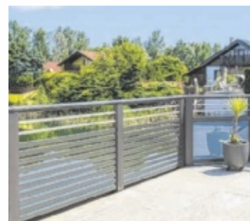
Balkonmodell Barcelona aus Aluminium – nie wieder streichen

Nie wieder streichen: Dank der patentierten Alu Comfort Plus®-Beschichtung sind Leeb-Balkone extrem langlebig, witterungsbeständig und nahezu wartungsfrei. Dadurch bleiben sie dauerhaft schön – ganz ohne Aufwand. Individuelle Gestaltung: Vielfältige Materialien, Farben und Formen – perfekt abgestimmt auf das Zuhause. Nachhaltig produziert: Gefertigt im Familienbetrieb in Kärnten,