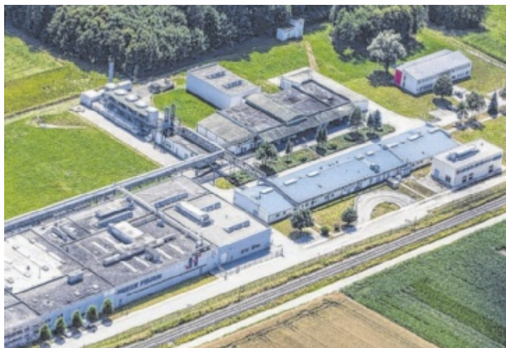
Hueck Folien entwickelt und fertigt ausschließlich in Baumgartenberg.

BAUMGARTENBERG. Den Produkten des weltweiten Beschichtungsspezialisten Hueck Folien begegnet man jeden Tag: den glänzenden Sicherheitsfäden auf den Banknoten, der pflegeleichten Oberfläche der Küchenschränke oder dem brillanten Etikett auf dem Shampoo. Das Unternehmen feiert in diesem Jahr sein 55-jähriges Bestehen und blickt dabei nicht nur auf eine erfolgreiche Vergangenheit zurück, sondern richtet den Blick ganz klar in die Zukunft.