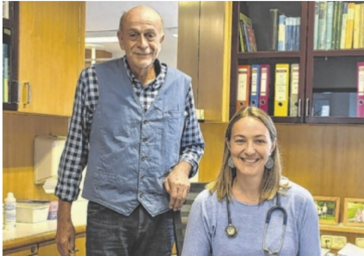
Für Vater und Tochter ist der Arztberuf auch Berufung.