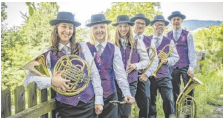
Mitglieder des Musikvereins Pabneukirchen spielen beim Frühschoppen.