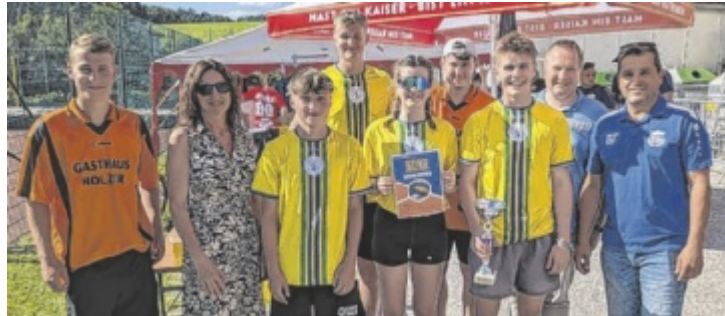
Die Sieger des Beachvolleyballturniers: Joga Bonito 1

Auch das Beachvolleyball-Finale war an Dramatik kaum zu