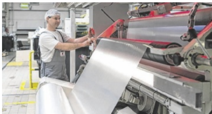
Bis zum Jahr 2035 will Hueck Folien ökologisch neutral produzieren