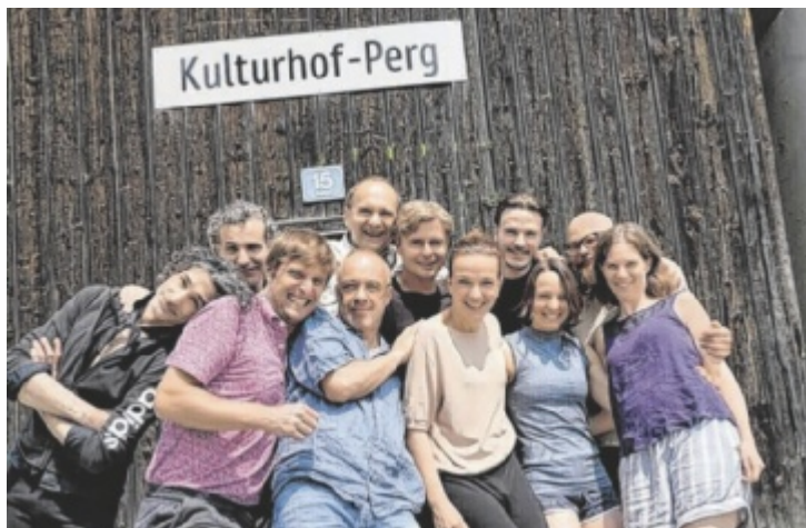
Zum Zehn-Jahres-Jubiläum präsentiert der Kulturhof Romeo und Julia.

Der Kulturhof Perg etwa feiert heuer sein zehnjähriges Bestehen – und das mit einer besonderen Inszenierung: William Shakespeares Romeo und Julia wird in einer eigenständigen Fassung auf die Bühne gebracht.