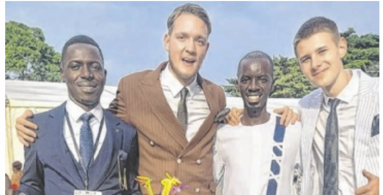
Voll integriert in der Gemeinschaft: auf der Hochzeit eines Mitarbeiters

Im Rahmen von zwei Vorträgen berichtet er über seine Arbeit beim Bildungsprojekt Bbanga Project auf den abgelegenen Sese-Inseln im Viktoriasee. Er erzählt von der Eröffnung einer Schule, Besuchen bei Familien in abgelegenen Dörfern – aber auch von Mo-