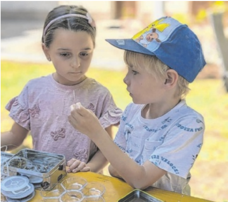
Mit einem Kennenlernfest fiel der Startschuss für die Europa-Volksschule vom Guten Hirten, die ab Herbst 16 Taferlklassler besuchen werden.

Der Zugang zur Bildung sei einfach ein anderer als in der Regelschule. „Jedes Kind soll in seinem eigenen Tempo lernen können“, so Pfeiffer, dessen Tochter im Herbst die erste Klasse der Privatschule besuchen wird. Unterrichtet wird in der Europa-Volksschule vom Guten Hirten