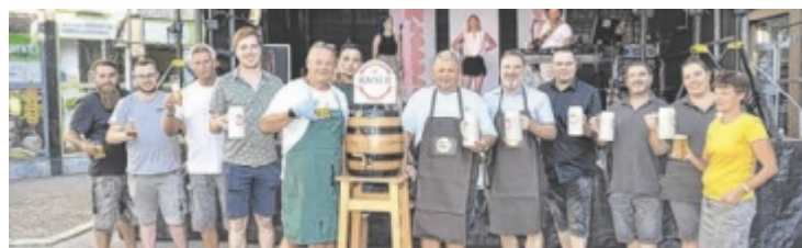
Der Bieranstich erfolgt um 18 Uhr.

Naturerlebnis Bei einer Wanderung zur Teufelskanzel führte die Route die Naturfreunde Mauthausen ausgehend vom Hochstraßwirt über malerische Wald- und Wiesenwege, die die Schönheit der Umgebung eindrucksvoll zeigten.