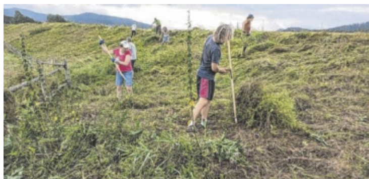
Es wird wieder für den guten Zweck „gehackelt“.