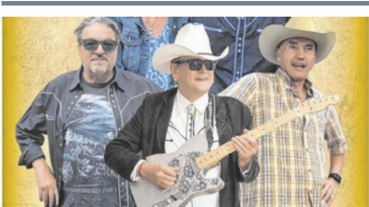
Country Foto: privat

Zwei-Tages-Ausflug MAUTHAUSEN/WIESBADEN. Zwei Nächte auf der Wiesbadener Hütte verbringen interessierte Teilnehmer bei der Hochtour Ochsenkogel / Piz Buin (3.312 Meter) von 30. August bis 1. September. Infos unter bertrowsky@gmail.com