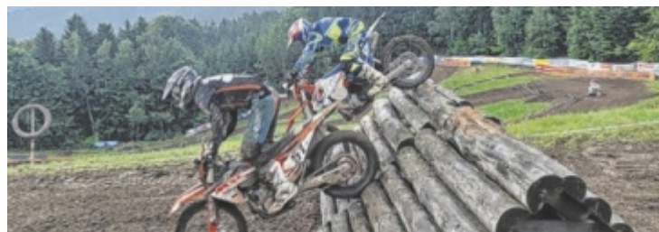
Der Regen machte aus der Strecke beim Spezial-Enduro eine Rutschpartie.