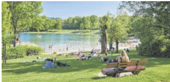
Einen Beitrag zum Erhalt der Qualität der Naturbadestellen können durch umsichtiges Verhalten auch die Badegäste leisten.

Alle acht Landes-Badestellen weisen ausgezeichnete Wasserqualität auf, bei den 43 EU-Badegewässerstellen wurde bei 39 eine ausgezeichnete, bei vier eine gute Wasserqualität festgestellt. „Diese Ergebnisse zeigen: Der Schutz unserer Flüsse und Seen wirkt. Wasserqualität auf höchstem Niveau ist kein Zufall, sondern das Ergebnis jahrzehntelanger Arbeit in der Gewässerreinigung und ökologischen Wasserwirtschaft“, erklärt Umwelt-