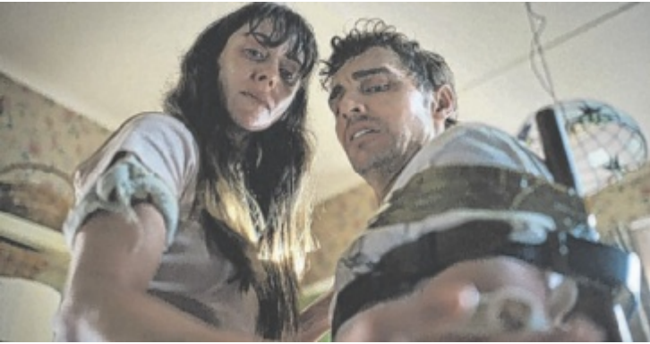
Horror und Mystery mit Alison Brie und Dave Franco