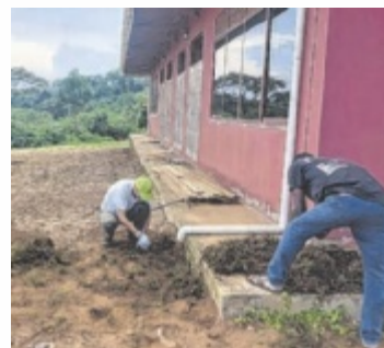
Hier wird Rasen angelegt.

junge Menschen, die sich selbst ein Jahr im Ausland vorstellen können oder sich für globale Themen und Entwicklungshilfe interessieren. Nach dem Vortrag werden Produkte des Frauenprojekts der NGO (Nichtregierungsorganisation) Bbanga Project gegen Spenden angeboten – darunter handwerklich sehr ansprechende Puppen, Einkaufstaschen, Rucksäcke, Toilettenaschen und vieles mehr. ■