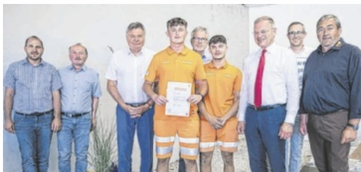
Die Freude über die Auszeichnung ist groß.