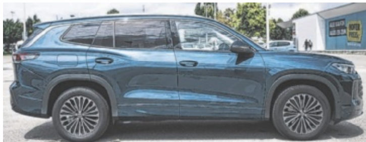
Der VW Tayron eTSI DSG Friends ist ab 50.090 Euro zu haben.

Überraschung ist das jetzt keine, Volkswagen und SUV hat immer funktioniert. Was noch gefehlt hat, war ein Nachfolger vom nicht überragend verkaufsstarken Tiguan Allspace. Technisch basiert der Tayron auf dem neuen Tiguan, optisch steht er aber komplett für sich alleine. Die Testfahrer von Fahrfreude fuhren schon lange keinen VW mehr, der sich so um sie bemühte. Der analoge Tasten und großzügige Platzverhältnisse über so manch moderne Verschlimmberung stellt. Und der trotz feiner Serienausstattung preislich attraktiv bleibt. Freilich hängt das von der Modellwahl ab. Ein Tay-