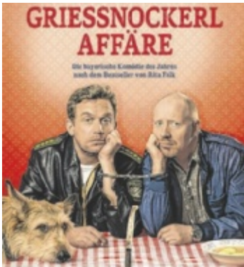
Open-Air-Kino: „Grießnockerlaffäre“

Musik und ein Kinderprogramm. Bei gutem Wetter startet um etwa 19 Uhr die Gewinnerin der Heißluftballonfahrt vom Eröffnungsball des Jubiläumsjahres in die Lüfte. Der Festausklang findet am Sonntag, 17. August, statt. Nach einem Dankgottesdienst um 9 Uhr in der Stiftskirche folgt ab 10 Uhr bei jeder Witterung ein gemütliches Beisammensein im Pfarrgarten. Für schwungvolle Musik sorgen die „Schwerverblecher“. ■