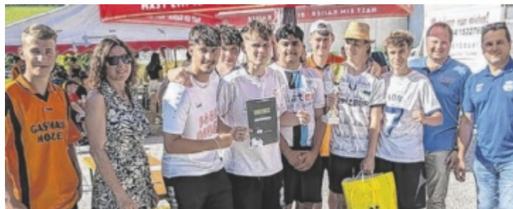
Die Gruppe FC Saufhampton entschied das Soccerturnier für sich.

überbieten. Mit einem knappen 16:14 im entscheidenden dritten Satz holte sich das Team Joga Bonito 1 gegen die Gruppe Vollpfosten United den Titel.