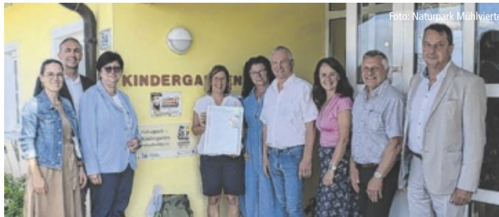
Zahlreiche Ehrengäste gratulierten zum Prädikat „Naturpark-Kindergarten“.

Um Naturpark-Bildungseinrichtung zu werden, ist es notwendig, zwölf definierte Kriterien zu erfüllen und in der täglichen pädagogischen Arbeit umzusetzen.