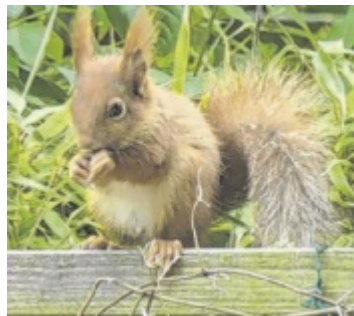
„Das Eichkätzchen ist eines der vielen Tiere, das uns auf unserer Terrasse in Bodendorf/Katsdorf besucht“, so Angelika Landl.

Haben auch Sie eine besondere Aufnahme aus dem Bezirk? Dann senden Sie das Foto in hoher Auflösung samt einiger Infos (Name, Wohnort, Aufnahmeort) an redaktion-perg@tips.at unter dem Betreff „Leserfoto“.