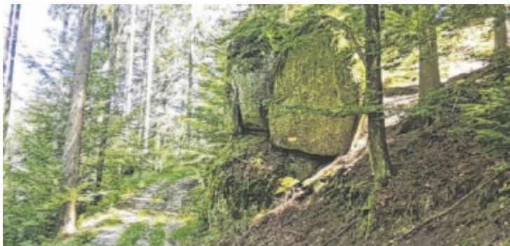
Mit Fantasie sieht man im Naarntal sogar steinerne Elefanten.