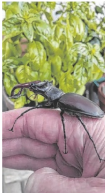
Ingrid Kloibhofer aus Allerheiligen im Mühlkreis überzeugt mit Fachwissen: „Dieses Hirschkäfer-Männchen ernährt sich hauptsächlich von Baum-/Pflanzen-saft und wird maximal acht Wochen alt.“