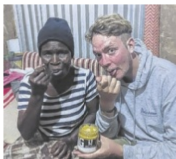
Verkostung: Honig aus Österreich