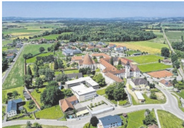
Baumgartenberg feiert im August 25 Jahre Markterhebung.

Leutgeb: Neben der Volks- und der Mittelschule, den berufsbildenden Schulen und dem Europagymnasium gibt es die Altenbetreuungsschule des Landes. Im Herbst eröffnet die private Europa-Volkschule vom Guten Hirten. Sehr viele Schüler reisen mit der Bahn an, weshalb eine öffentliche WC-Anlage beim Bahnhof sehr wichtig wäre. Diese ist leider 2023 nach der Adaptierung des für mehrere hundert Schüler viel zu schmalen Bahnsteigs entfernt worden. Der Gemeinderat hat die Errichtung eines Bahnhofs-WCs in die Prioritätenreihung aufgenommen, im Herbst soll es nächste Schritte geben.