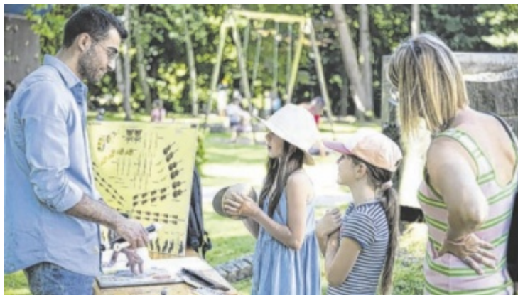
Beim Familienmusiktag wird gebastelt, getanzt und musiziert.