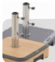
Motivsockel ca. 50 kg