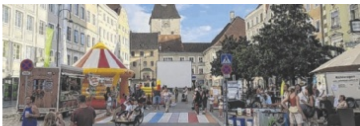
Für Groß und Klein wartet ein Kino unter freiem Sternenhimmel.

und mehr. Abends – bei Einbruch der Dunkelheit gegen 21 Uhr – wird der Disney-Film „Vaiana 2“ auf einer großen Leinwand gezeigt. Getränke und Popcorn gibt es ab dem Nachmittag an der Bar, Sitzgelegenheiten oder Picknickdecken sollten selbst mitgebracht werden. Bei Anreise zu Fuß oder mit dem Fahrrad wartet eine kleine Belohnung. Bei Schlechtwetter entfällt die Veranstaltung. ■