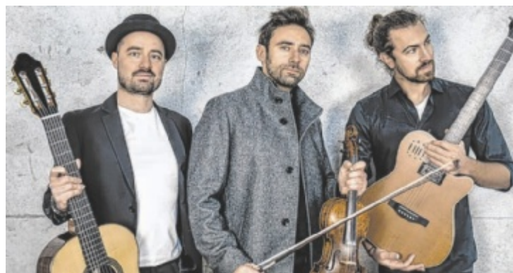
Virtuos und mitreißend: Das Trio Cobario