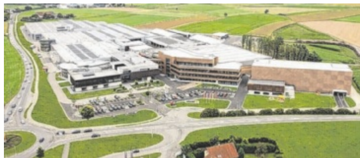
Der Kreisverkehr vor dem Hargassner-Werk soll entlastet werden.

Herzstück des Projekts ist der direkte Anschluss der Gemeindestraße aus dem Ortsteil Stern/Altheim an die B142 sowie ein verlängerter Abbiegestreifen zur Firma Hargassner. Damit kann Verkehr gezielt aus