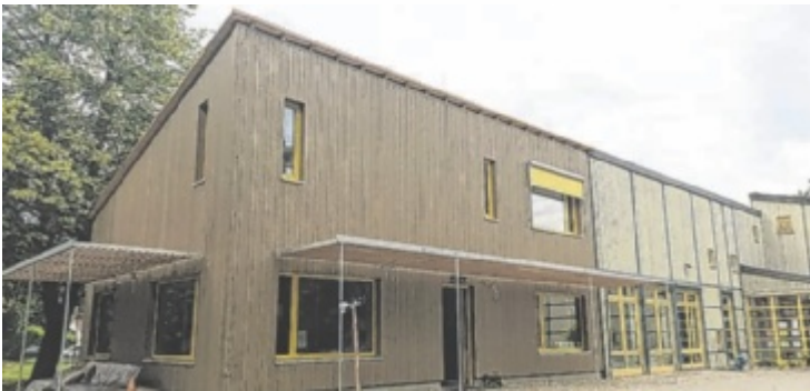
Mit heimischem Holz wurde der Hort-Anbau umgesetzt.