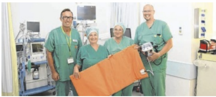
Das neue System bringt mehr Komfort und Energieeffizienz.

Sicherheit Im Rahmen des Stadtfestes hatte auch die Polizeiinspektion Simbach zusammen mit der Kreisverkehrswacht wieder einen Infostand. Unter dem Motto „Vorsicht. Rücksicht. Umsicht.“ gab es wertvolle Tipps für Radfahrer, die im Verkehr besonders gefährdet sind. Auch beim Gewinnspiel kann man noch bis 1. Oktober wertvolle Preise gewinnen. www.sichermobil.bayern.de