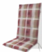
Gartenmöbelauflagen Diverse Größen