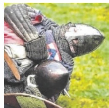
Beim historischen Ritterturnier wird authentisch gekämpft

An beiden Tagen bringt ein Shuttledienst die Besucher vom Rathausplatz zum Schauplatz. Infos: www.burgfreundejulbach.de ■