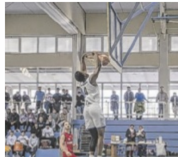
Spektakuläre Dunks bringen Spannung ins Spiel

nung, mit Gerüst, Elektroarbeiten und neuer Linierung auf rund 49.000 Euro brutto. 10.000 Euro davon übernimmt der TSV. Auch die Querspielfelder sollen zeitgleich erneuert werden beschlossen der Stadtrat und plant die geschätzten Kosten von 35.000 Euro im Haushalt 2026 mit ein. ■