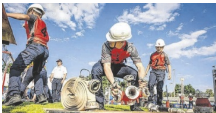
Aktiv- und Jugendgruppen zeigten beim Wettbewerb, was in ihnen steckt.

das Festzelt, wo hunderte freiwillige Helfer für das leibliche Wohl sorgten. Für die Gastgeber gab es doppelt Grund zur Freude: Die Bewerbungsgruppe Mauerkirchen holte den zweiten Platz in Bronze A und Platz drei in Silber A. ■