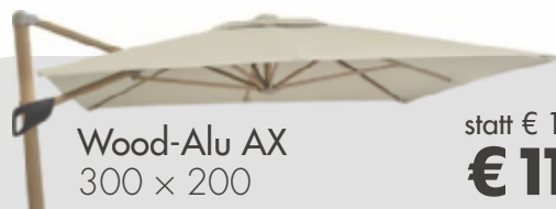
Wood-Alu AX 300 x 200