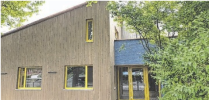
Mehr Platz für das Personal entstand beim Ost-Anbau

machen und auch spielen können. Nicht weniger notwendig war die Schaffung von Personalräumen, denn das Team wird auf Grund der hohen Belegung ebenfalls größer. Der Hort wurde in Richtung Garten errichtet, die Personalräume zur Jakob-Weindler-Straße hin. Beide Projekte passen sich dem ursprünglichen Grundriss, der schon mehrmals erweitert wurde harmonisch an und auch der große Garten bietet weiterhin viel Platz zum Spielen und Entdecken. ■