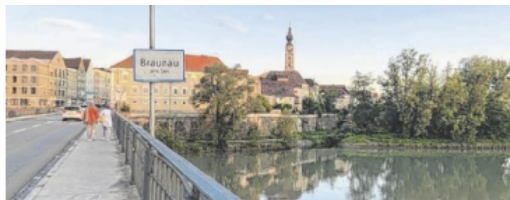
In Braunau werden zwei historisch belastete Straßen umbenannt.