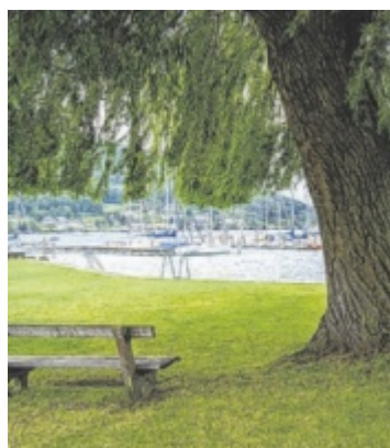
Seezugang Die Bundesforste schaffen gemeinsam mit der Gemeinde Schörfling neuen Zugang zum Attersee. Seite 3