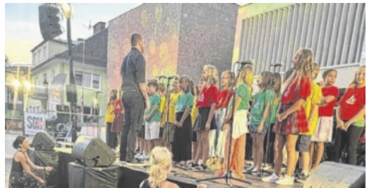
Schüler der Musikvolksschule hatten auch einen Auftritt bei der großen Galanacht der Marktmusik Timelkam.

Ein besonderes Erlebnis war der Ausflug in die Wiener Staatsoper, in der die Kinder „Die Zauberflöte für Kinder“ hautnah erleben durften – ein märchenhaftes Bühnenabenteuer, das allen lange in Erinnerung bleiben wird. Zum Schuljahresende glänzten die Kinder aus dem Musikschwer-