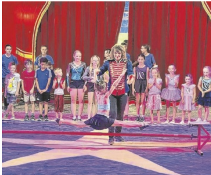
Zirkus-Feriencamp am Freizeitgelände Vöcklabruck

Die Workshops starten jeweils montags – am 4., 11., 18. und 25. August – und laufen von Montag bis Freitag, jeweils von 9 bis 16 Uhr. Für das leibliche Wohl der Kinder ist bestens gesorgt: Frühstück, Mittagessen, Snacks, Getränke und sogar Eis sind im Preis inkludiert. Der krönende Abschluss jeder Woche ist die große Vorstellung am