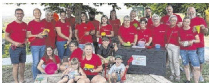
Der Spielplatz auf der Schanze ist beliebt, jetzt gab es von der SPÖ Wolfsegg für die Kinder neue Sandspielsachen und eine Aufbewahrungsbox.