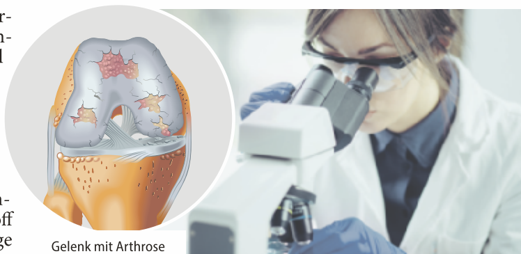
Gelenk mit Arthrose

Der Wirkstoff überzeugt deswegen bei Arthrose, da er schmerzlindernd wirkt. Dieser