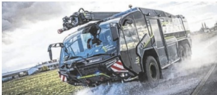
100 Kinder werden versuchen, den PANTHER zu ziehen.

Zahlreiche Einsatzorganisationen und Unternehmen aus der Region