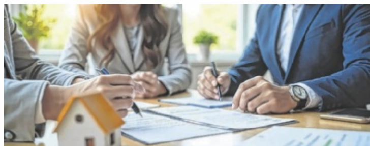
Die neuen Richtwerte sind gesetzlich nicht mehr bindend.

„Was sich mit dem Auslaufen der KIM-V ändert, ist, dass Banken von diesen drei Vorgaben nun abweichen können, solange trotz-