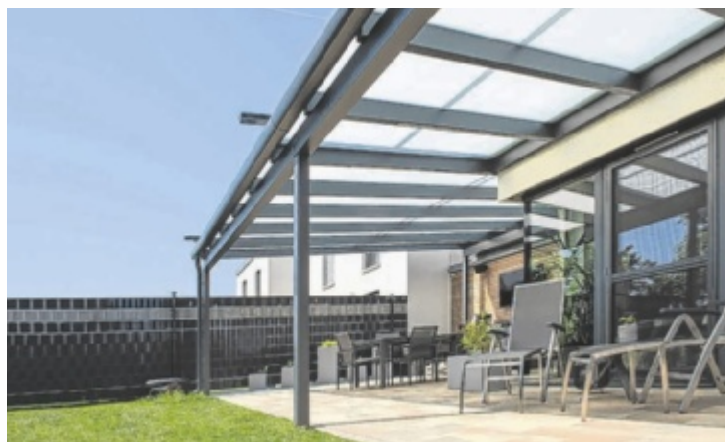
Stilvolle Terrassenüberdachung von Leeb

Ein Sommergarten von Leeb erweitert den Wohnraum und bringt die Natur direkt ins Haus. Eine Rundumverglasung schützt vor Wind, Regen und Kälte, der großzügige Lichteinfall schafft eine helle und angenehme Atmosphäre. Zusätzliche Schiebeelemente sorgen für individuellen Sonnenschutz und Pri-