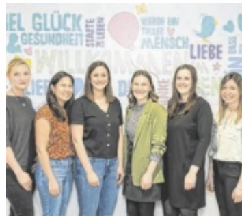
Die Hebammen bieten Akupunktur für werdende Mamas an.