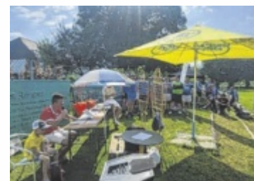
38 Partien mit 189 Toren