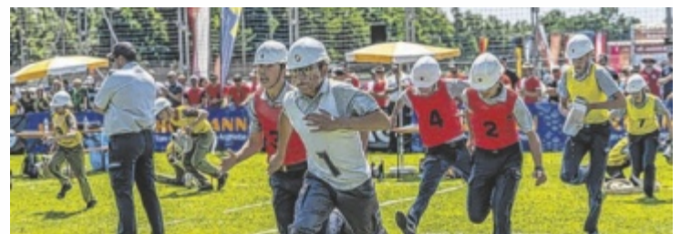
Landesbewerb der Feuerwehren in Mauerkirchen

Mauerkirchen wurde kürzlich zum Zentrum des oberösterreichischen Feuerwehrwesens: Beim 61. Landes-Feuerwehrleistungsbewerb sowie dem 48. Landes-Feuerwehrjugendleistungsbewerb stellten insgesamt 1834 Gruppen aus dem ganzen Bundesland ihr Können unter Beweis. Besonders stark präsentierten sich dabei die Feuerwehren aus dem Bezirk Vöcklabruck, die mit insgesamt 24 Rangplatzierungen ein beeindruckendes Ergebnis erzielten. Acht Jugendgruppen und 16 Aktivgruppen aus dem Bezirk sicherten sich Spitzenplätze und bewiesen damit nicht nur ausgezeichnete Ausbildung, sondern