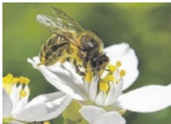
Eine Biene

Eine einfache Möglichkeit ist, bienenfreundliche heimische Pflanzen in deinem Garten oder auf deinem Balkon zu pflanzen. Blumen wie Lavendel, Sonnenblumen, Klee oder Wildblumen und Kräuter bieten Bienen und