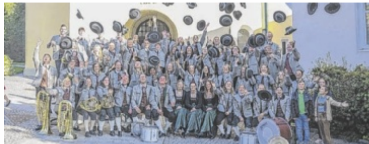
Der MV Niederthalheim lädt zum Jubiläumsfest mit Margarita-Kirtag.

Dabei werden sich am Freitag, 18. Juli, ab 18.15 Uhr (Festakt um 19.30 Uhr) sowie Samstag, 19. Juli, ab 17.45 Uhr (Festakt um 19 Uhr) Gastkapellen sowie befreundete Vereine aus dem gesamten Bezirk und darüber hinaus ihr Stelldichein als Gratulanten geben. An beiden Tagen kann man sich auf Gastmusikkapellen und Vereinseinmärsche, feierliche Festakte und Gesamtspiele am stimmungsvollen Kirchenvor-