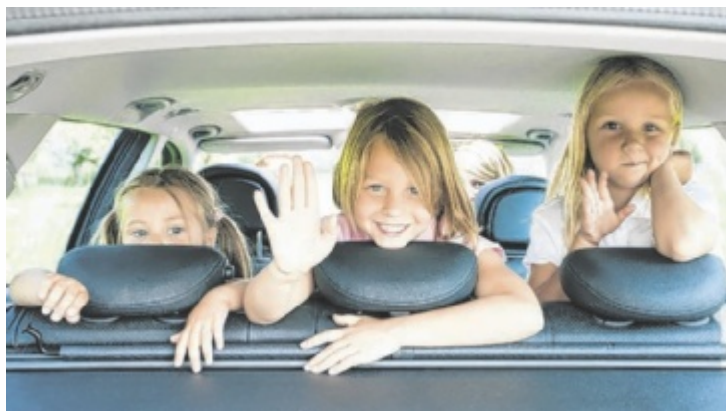
Autofahrten mit Kindern können eine Herausforderung sein.

Um sowohl Kinder als auch Fahrer nicht zu überfordern, sollten vor allem bei längeren Fahrten Zwischenstopps eingelegt werden. Die Pausen bieten eine Möglichkeit zur Bewegung an der frischen Luft oder zur Be-