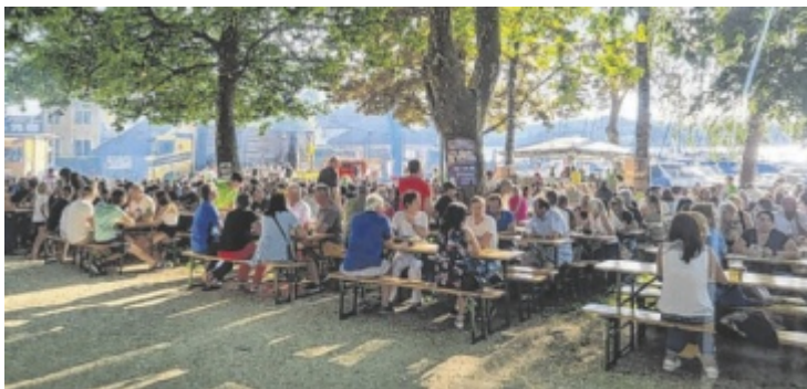
Sommerliches Flair am Attersee