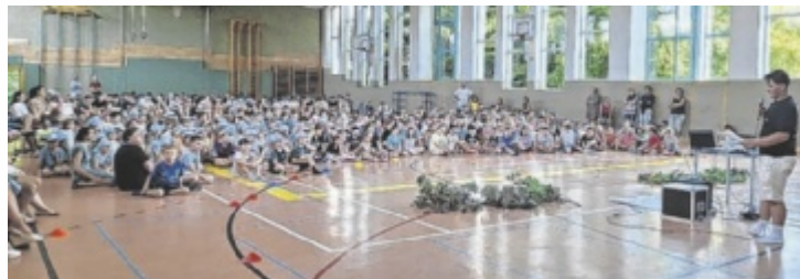
Die Klimaprojekte der Schulen wurden präsentiert.

Mit dabei waren die Volksschulen Regau und Rutzenmoos sowie die Landwirtschaftliche Fachschule Vöcklabruck (LFS VB). Der Auftakt erfolgte in der VS Regau, wo alle drei Schulen ihre spannenden Klimaprojekte präsentierten: Die Schüler berichteten von ihren Energie-Challenges, vom Klimabuddy-Tag, von „Bodenzombie-Experimenten“, welche die Bodenfruchtbarkeit sichtbar machen