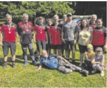
Attergauer Bowhunters

Danke schön!-Ehrenamtspreis Infos und Anmeldung unter www.tips.at/ehrenamt