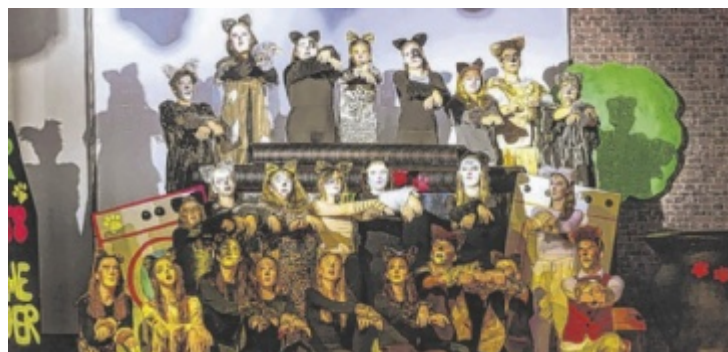
Die Schüler begeisterten mit dem Musical „Cats“.