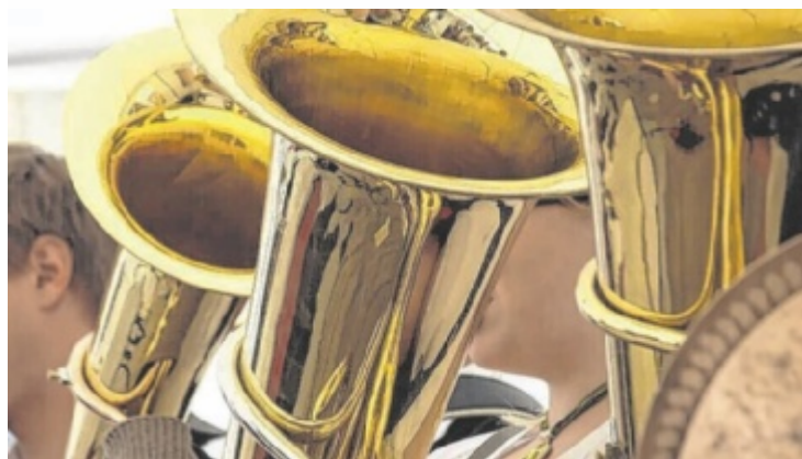
Blasmusiker unterhalten beim Hopfenair