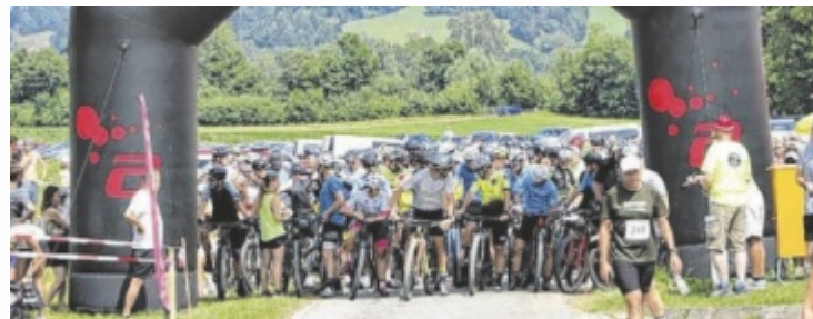
Der Duathlon Powang war wieder eine großartige Veranstaltung.