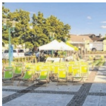
Open Air Kino in Seewalchen

Besonderer Stargast des Sicherheitstages ist der aus dem Bezirk stammende Ski-Weltcupfahrer Daniel Hemetsberger, der sich unter die Besucher mischen und das Event unterstützen wird. Neben jeder Menge Action gibt es auch informative Vorträge, Sicherheits-Tipps und interaktive Stationen für Kinder. Für das leibliche Wohl und beste Unterhaltung ist ebenfalls gesorgt. ■