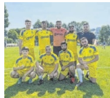
Eine Mannschaft beim Hobby-Fußballturnier

die weit angereisten Kicker des SK Vorwärts Promille. ■