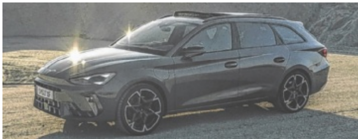
Der CUPRA Leon SP Kombi VZ eHybrid ist ab 51.900 Euro zu haben.

Der CUPRA Leon Kombi ist dafür bestes Beispiel. Bei den Antrieben wird vom 150 PS leisten-