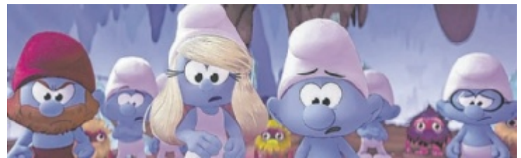
Schlumpfine, Hefty, Clumsy und Co wollen Papa Schlumpf retten.

Alle Infos, Teilnahmebedingungen und Anmeldung unter www.youngatart.at ; bis zu drei Werke pro Teilnehmer können eingereicht werden, Vorjahressieger sind für die Edition 2025 ausgeschlossen. Einreichen bis 2. November.