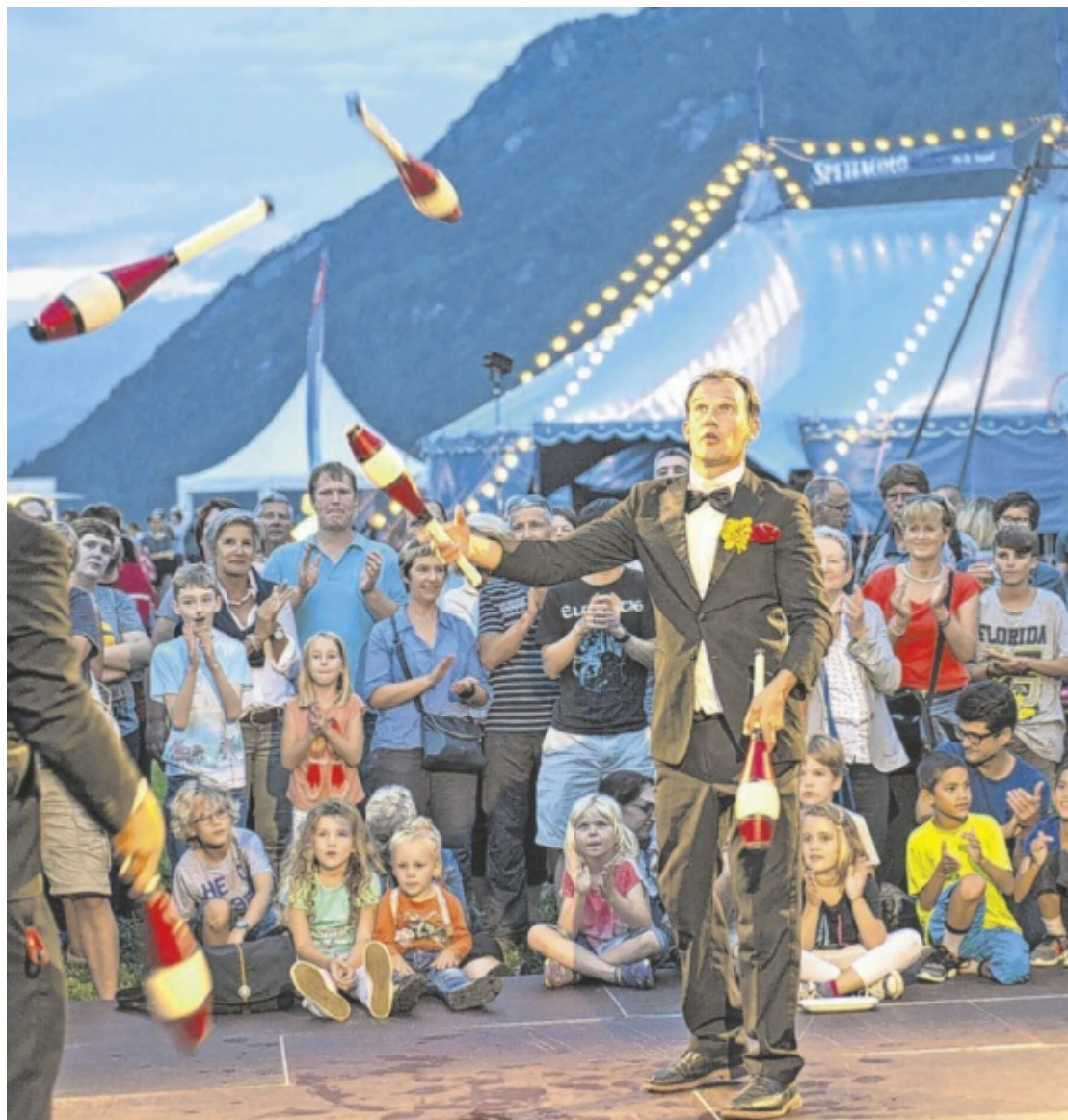
Marktfest Im Jubiläumsjahr verwandelt sich ganz Frankenburg am Sonntag, 20. Juli, von 15 bis 22 Uhr in eine große Bühne mit Straßenkünstlern, Bands und einem bunten Programm für große und kleine Besucher. Seite 35