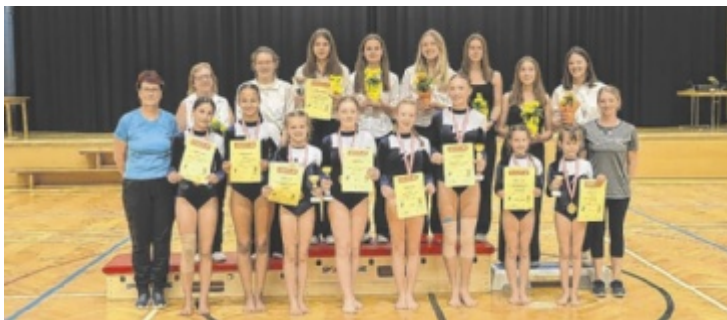
Der ATSV Timelkam freute sich über Erfolge.

zinische Betreuung und Alltagshilfen sind dringend nötig – doch vieles davon ist nur mit externer Unterstützung möglich. Mit dieser Veranstaltung wollte man ein Zeichen setzen, ein Zeichen der Solidarität. Ein Zeichen, dass Menschen aus der Region zusammenhalten, wenn jemand Hilfe braucht. ■