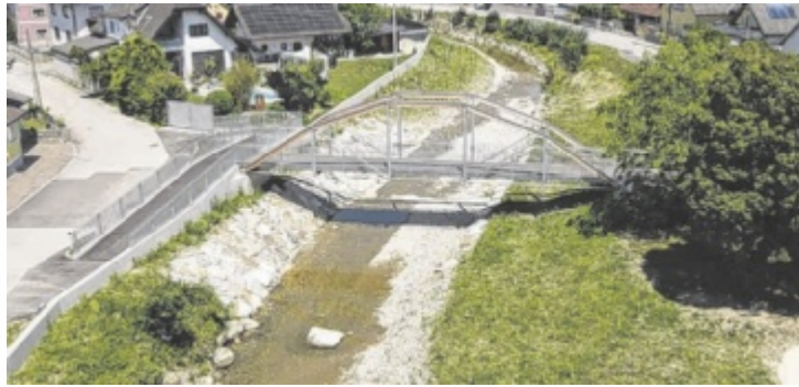
Die neue Fußgänger- und Radfahrbrücke über die Dürre Ager entstand, die alte Brücke in der Voitlau wurde saniert und gehoben.

Kernstück des Projekts war die Aufweitung des Flussbetts, wodurch die Dürre Ager künftig bei Starkregenereignissen mehr Raum erhält. Zusätzlich wurden Schutzmauern und Dämme errichtet, die das angrenzende Siedlungsgebiet wirksam abschirmen. Unter der Mauer sorgt ein Durchlasssystem dafür, dass Regenwasser nur in eine Richtung abfließen kann, von den an-