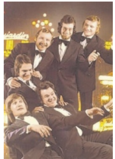
The Mustangs Anfang der 70er Jahre

Am Freitag, 8. August 2025, lädt die Kultband zu einem besonderen Jubiläumskonzert ein. Unter dem Titel „Prügger Nostalgienacht“ werden sie ab 19.30 Uhr im Lokal Die Wirterei in Schmidham noch