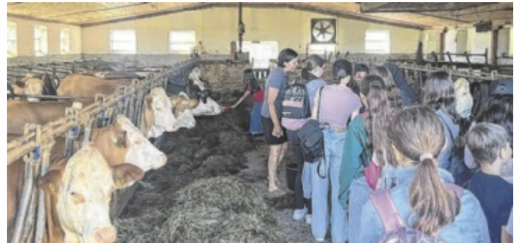
Tag der Landwirtschaft am Betrieb Baldinger Puchkirchen

Nicht weniger spannend: die Station rund ums Ei. Mitten im Hüh-