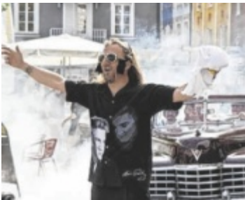
Elvis, King of Rock 'n Roll