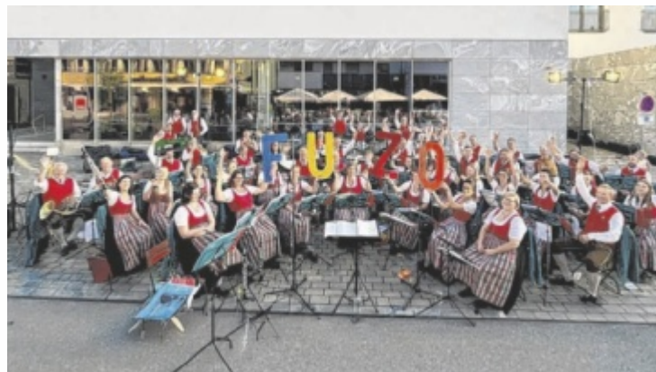
Die Musikkapelle St. Georgen/A. freut sich auf ihr Konzert der Saison.

Bereits ab 16 Uhr bietet der Kunsthandwerksmarkt mit rund 25 Ausstellern liebevoll Selbstgemachtes – von Dekoration bis Schmuck. Auch für die jüngsten Besucher ist bestens gesorgt: Hüpfburg, kreative Bastelangebote und Kinderschminken garantieren einen abwechslungsreichen Nachmittag. Kulinarisch verwöhnt die Vöcklakäserei gemeinsam mit den Berger Bauern