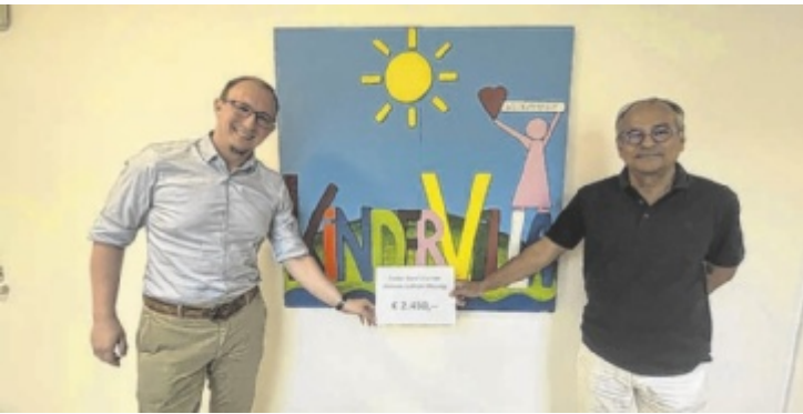
Übergabe des Spendenschecks an die Kindervilla in Steinbach