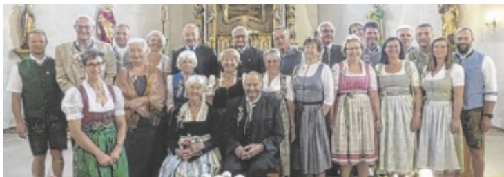
Elf Jubelpaare feierten ihre Liebe.