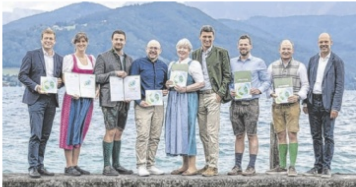
Auszeichnung der Hotels als Klimabündnis-Betriebe