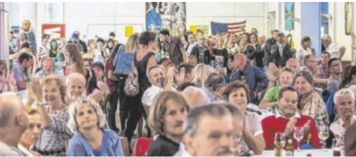
Kleinstes Elvis-Festival der Welt in der Trinkhalle Bad Ischl.