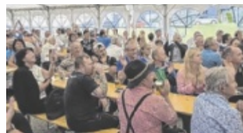
Volles Haus und tolle Stimmung herrschte bei der HONS Hausmesse.