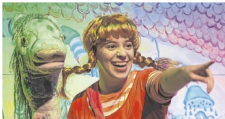
Kindertheater in Ohlsdorf mit Pippi Langstrumpf

Sonntag auf der finalen Etappe von Bad Wimsbach nach Straß im Attergau über 109,2 Kilometer fällt. Die Zielankunft bei der Volksschule in Straß wird um 14 Uhr erwartet. Die Siegerehrung der 50. Int. „Keine Sorgen“ Junioren Rundfahrt findet dann gleich im Anschluss an die Zieleinfahrt statt. Die Etappen am Samstag und Sonntag werden live im TV übertragen. ■