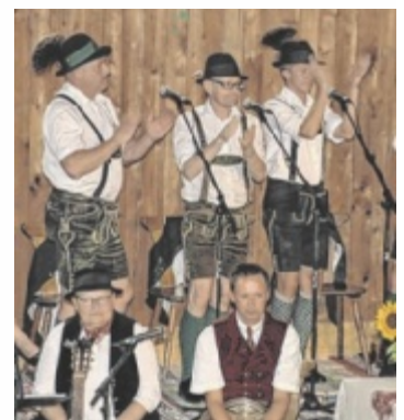
Flotte Klänge kamen von der Sonnseitenmusi.

Beim G'stanzlsinga standen bei den vier Gruppen Humor, Musik und Gesang im Mittelpunkt und die Sonnseitenmusi vom Wolfgangsee, die zum ersten Mal am Stehrerhof dabei war, begeisterte mit ihrer flotten Spielweise und ihrem schneidigen Päschen schnell die zahlreichen Besucher. Bei strahlendem Sommerwetter strömten tags darauf ca. 700 Oldtimerbesitzer mit ihren zwei- und vierrädrigen Gefährten zum Stehrerhof. Viele Freunde alter Fahrzeuge nutzten diese einmalige Gelegenheit, so unterschiedliche Fahrzeuge bestau-