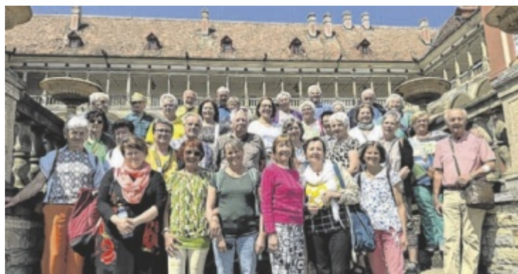
Die Reisegruppe besuchte das Riesengebirge in Tschechien.