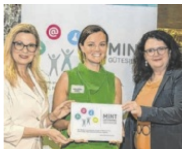
Verleihung des Gütesiegels

Die Gesamtinvestitionen beliefen sich auf 1,85 Millionen Euro. Finanziert wurde das Projekt gemeinschaftlich durch den Bund (39,8 Prozent), das Land Oberösterreich (40 Prozent) und die Marktgemeinde Timelkam (20,2 Prozent). Die Planung und örtliche Bauaufsicht lag in den Händen der HIPI ZT GmbH aus Vöcklabruck. ■