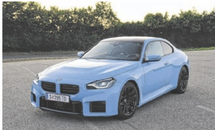
Der BMW M2 ist ab 88.000 Euro zu haben.

Der M2 stellt das Kraftpaket, welches er ist, ziemlich unverblümt zur Schau. Eleganz ist seine Sache nicht, besonders das extrem auffällige Heck mit den breit ausgeformten und muskulösen hinteren Radhäusern sorgt für klare Verhältnisse. Den Rest übernehmen Kanten, rahmenlose Niere und die typischen M-Aerodynamik-Elemente. Das Interieur kann bei dieser Wucht