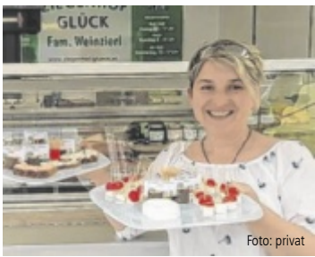
Verkostung am Bauernmarkt Bad Hall

Der Bauernmarkt ist nicht nur Einkaufsmöglichkeit, er ist auch Treffpunkt für Kommunikation und Pflege sozialer Kontakte. Mit einem Einkauf am Bauernmarkt trägt man aktiv zur Erhaltung und Lebenskraft der Höfe und der Kulturlandschaft bei. Im Juli und August gibt es bei den Bauernmärkten in der Region Steyr-