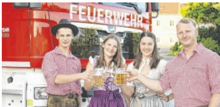
Bei der FF Waldneukirchen wird zwei Tage lang gefeiert.

STEYR. Im Eltern-Kind-Zentrum (Ekiz) Bärentreff wird es im Sommer ruhiger, im Juli gibt es etwa noch den offenen Spielvormittag und den offenen Babytag. Im August und in der ersten Septemberwoche bleibt das Ekiz dann geschlossen. Beratungen, die Begleitung in Trennungssituationen und die Besuchsbegleitung finden nach Vereinbarung aber weiterhin statt (Kontakt: ekiz@baerentreff.at). Im Herbst startet das Bärentreff dann mit einem vielseitigen Kursprogramm ins Herbst-Winter-Semester. Es warten neue Kurse für Schwangere und Babys, Babyschwimmen, Babymassage, Eltern-Kind-Gruppen, offene Treffs, Workshops für Erwachsene und vieles mehr. Zum Programm und zur Anmeldung geht es unter www.baerentreff.at . ■