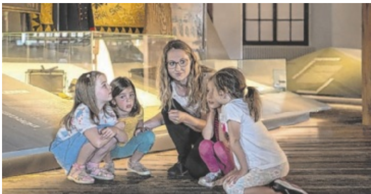
Im Steyrer Stadtmuseum gibt es auch für Kinder viel zu entdecken.