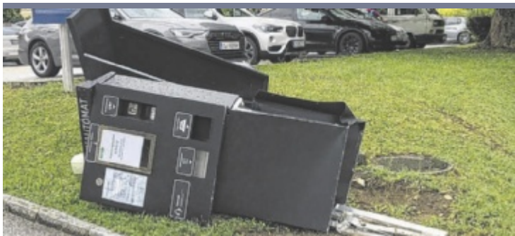
Sachschaden Auf einem Parkplatz der Eurotherme in Bad Hall wurde ein Automat aus der Verankerung gerissen und schwer beschädigt. Offensichtlich wurde der Kassenautomat frontal von einem Fahrzeug gerammt.