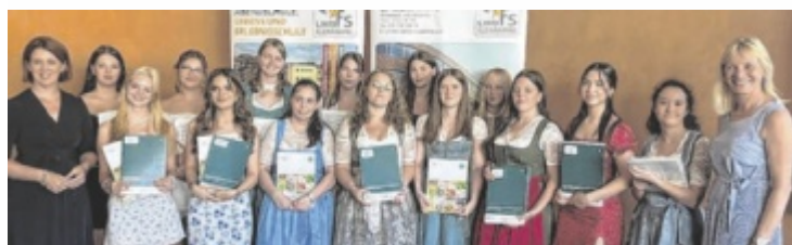
Drei Jahre dauert die Ausbildung an der LWBFS Kleinraming.