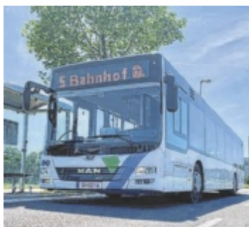
Seit Montag gilt in Steyr der Sommerfahrplan.