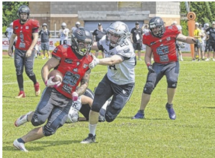
Die Predators (in Rot) setzten sich im Halbfinale gegen die Raiders II aus Tirol durch und stehen im Endspiel der Division III.

STEYR. Über 300 Zuschauer sorgten beim AFL-Halbfinale der Division III zwischen den Predators Steyr und den Raiders II aus Tirol für tolle Stimmung. Das Heimteam setzte sich in einer umkämpften Begegnung mit 21:14 durch.