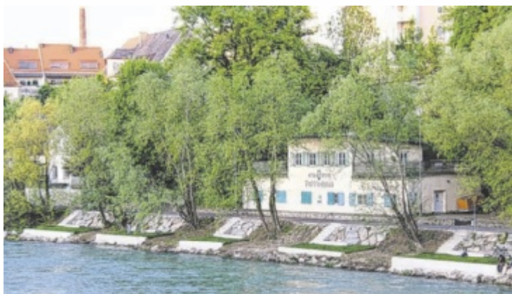
Die im Paddlerhaus gelagerten Boote des ATSV Steyr werden nach Zwischenbrücken übersiedelt.