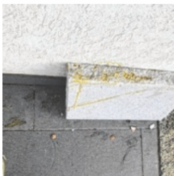
Eier-Werfer treiben in Steyr-Gleink ihr Unwesen.

Infos zur Stammzellenspende: www.gebenfuerleben.at