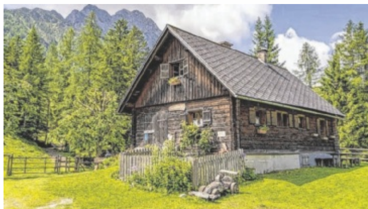
Seit 1957 steht die Ochsenwaldalm zwischen Bosruck und Pyhrgas in Spital am Pyhrn – rund 48 der 60 Hektar Fläche dienen als Sommerweide für Mutterkühe und Jungtiere.

Die Gästebewirtschaftung ist vorerst bis Oktober geplant. Ob Julia und Ida nach der Winterpause wiederkehren, steht noch offen. Aber eines wissen sie jetzt schon ganz sicher: „Die Hütte hat volles Potenzial.“ ■