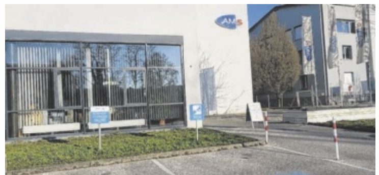
Das AMS Steyr ist Anlaufstelle für Menschen aus 21 Gemeinden.

Die Zahl der unselbstständig Beschäftigten lag im Mai 2025 in Oberösterreich bei 664.097 und damit deutlich über dem Wert von Mai 2019 (638.734). Nur in zwei Arbeitsmarktbezirken gibt es ein Minus, nämlich in Eferding (-174) sowie in Steyr (-176). In Steyr und Steyr-Land waren im Mai 2025 exakt 41.019 Personen unselbstständig beschäftigt, vor sechs Jahren waren es noch 41.195. Die aktuelle Arbeitslosenquote (Juni) liegt bei 7,7 Prozent. 3.427 Menschen sind derzeit arbeitslos gemeldet, dazu kommen 884 Schulungsteilnehmer, die ebenfalls auf Jobsuche sind. ■