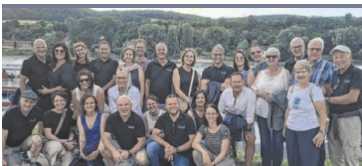
Theatergruppe Die Theatergruppe Behamberg verbrachte ihren heurigen Ausflug in der Wachau. Unter anderem standen eine Schifffahrt und eine Führung im Stift Melk auf dem Programm.