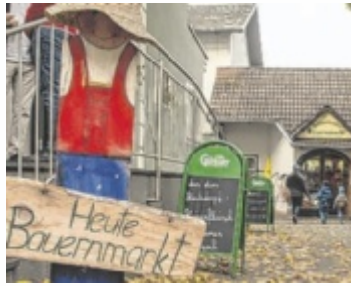
Bauernmarkt Schlierbach

Der Bauernmarkt ist nicht nur Einkaufsmöglichkeit, er ist auch Treffpunkt für Kommunikation und Pflege sozialer Kontakte. Das Produktangebot spiegelt die Jahreszeiten der Landwirtschaft wider. Mit einem Einkauf am Bauernmarkt trägt man aktiv zur Erhaltung und Lebenskraft der Höfe und der Kulturlandschaft bei. Im Juli und August gibt es ein Gewinnspiel für die Kunden. Wer vier Stempel bis 9. September sammelt und seinen Pass rechtzeitig abgibt, nimmt an der Verlosung von regionalen Schmankerl-Körben teil. ■