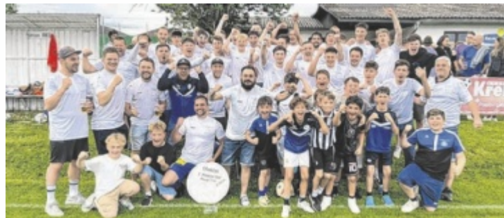
Die Kampfmannschaft der Union Ried im Traunkreis feiert den Meistertitel 2025 – ein starkes Zeichen nach dem Abstieg im Vorjahr.