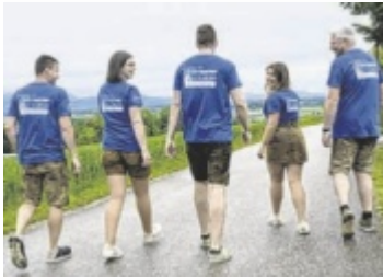
Der Musikverein Voitsdorf bereitet sich intensiv auf das Bezirksmusikfest 2027 vor.

Ein besonderes Ereignis wirft bereits seine Schatten voraus: Von 11. bis 13. Juni 2027, wird Voitsdorf Gastgeber des Bezirksmusikfests sein. Die Planungen für das Großereignis laufen bereits auf Hochtouren. Unter dem Motto „Voigas in Voitsdorf“ freut sich der Musikverein auf zahlreiche Besucher. Aktuelle Infos und das Programm werden laufend auf der Website des Vereins veröffentlicht. ■