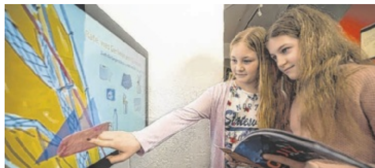
Mit einem Quizheft erforschen junge Besucher im Spitaler Museum knifflige Fragen rund um das Extrembergsteigen.

Ausstellungshaus widmet sich dem Leben der Aichtausender-Bezwingerin Gerlinde Kaltenbrunner aus Spital am Pyhrn mit originaler Ausrüstung, Filmen und Hörstationen. Im Erlebnisraum spüren die Besucher auch nach, wie sich extreme Wetterbedingungen am Mount Everest anfühlen. Mit OÖ Familienkarte freier Eintritt für Kinder und Ermäßigung für Erwachsene ■