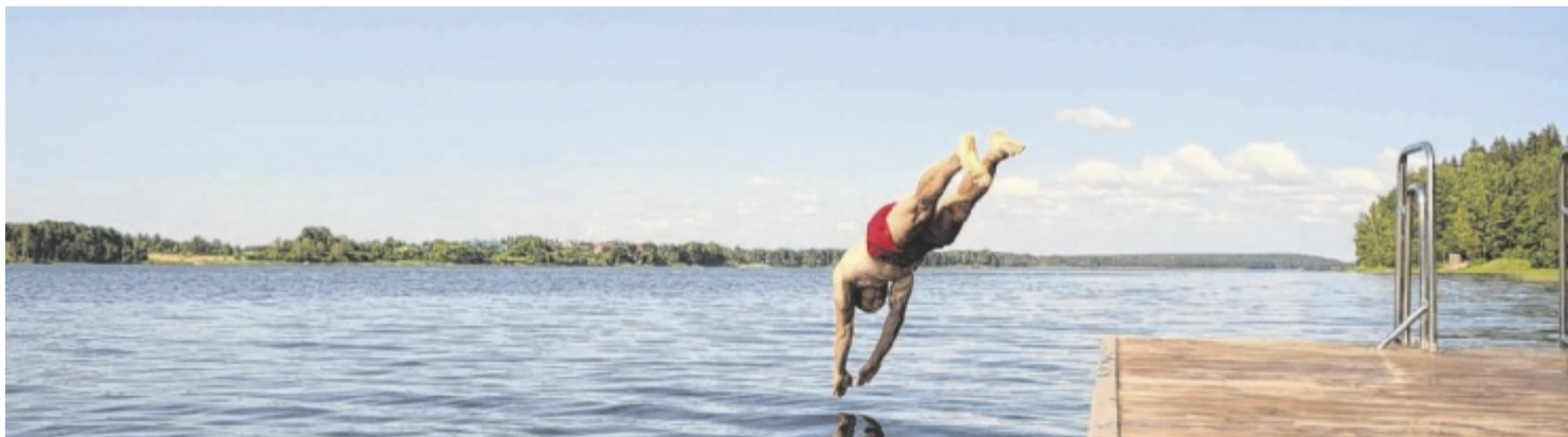
Ausreichend trinken, Schatten suchen, abkühlen und körperliche Anstrengung vermeiden – so schützt man sich vor hitzebedingten Gesundheitsrisiken.

Ein besonderer Hinweis gilt Personen, die regelmäßig Blutdruck- oder Herzmedikamente einnehmen: „In solchen Fällen ist es wichtig, Dosierungen und die optimale Flüssigkeitszufuhr mit dem Arzt abzusprechen.“ ■