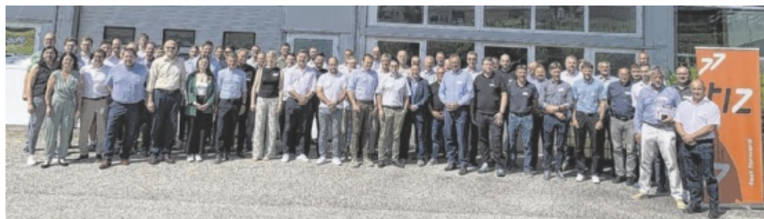
Organisiert vom TIZ Kirchdorf in Kooperation mit dem Kunststoff-Cluster stand die Veranstaltung ganz im Zeichen von Digitalisierung, Nachhaltigkeit und technologischem Fortschritt.