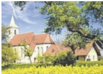
Die Filialkirche Weigersdorf ist 2025 ein wichtiger Treffpunkt für Pilger und Gottesdienste.

Die Filialkirche Weigersdorf ist dem Heiligen Jakobus dem Älteren, dem Patron der Pilger, gewidmet. Im Heiligen Jahr „Pilger der Hoffnung“ wird sie zu einem wichtigen Ziel für Gläubige. Am 20. Juli, 9.30 Uhr, findet dazu ein zentraler Gottesdienst statt, der live im ORF 2, ZDF und in österreichischen Regionalradios übertragen wird. Im Anschluss lädt die Feuerwehr