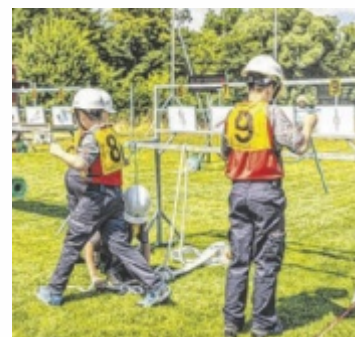
Der Feuerwehrynachwuchs bewies Teamstärke und hohe Motivation auf der Bewerbsbahn.