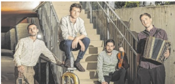
Junges Festival startet mit Top-Quartett aus Bayern in zweite Saison.