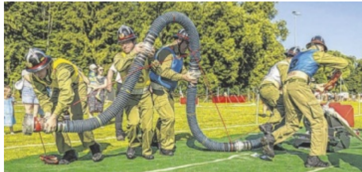
Trotz der großen Hitze zeigten die Teilnehmer vollen Einsatz beim Feuerwehrleistungsbe- wettbewerb des Bezirkes Kirchdorf.