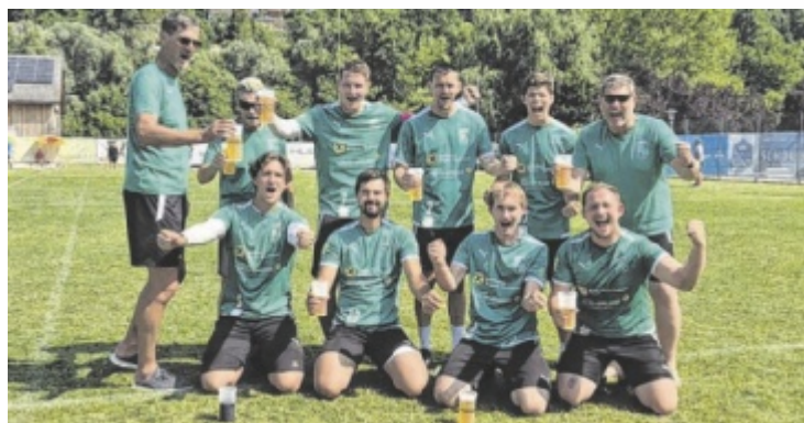
Die Grün-Weißen feiern ihr Bundesliga-Comeback.