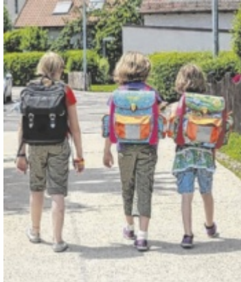
Durch den Plan wird der Schulweg sicherer.

Der Schulwegplan ist online abrufbar unter www.schulwegplan.at