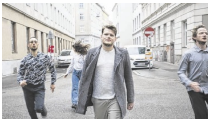
Livemusik aus dem Genre Neue Deutsche Welle mit der Wiener Band „Deine Familie“ (Bild) beim diesjährigen INOK-Sommerfest in Schlierbach

interpretation der Neuen-Deutschen-Welle für Unterhaltung, weiters die Psych-Rock-Band „Inflagranti“ aus Salzburg und Singer-Songwriter Elias S. aus dem Kremstal. Mit DJ-Klängen und Lagerfeuer geht es in eine laue Sommernacht. Findet nur bei Schönwetter statt, Eintritt frei! ■