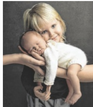
Mit diesem Geschwister-Foto holte sich Julia Kerbl den dritten Platz in der Kategorie „Natürliches Portrait“.

das in der Kategorie „Natürliches Portrait“ den dritten Platz belegte, und ein mit KI gestaltetes Stillfoto, das in der neuen Kategorie „AI Fusion“ mit dem zweiten Platz ausgezeichnet wurde. „Das Geschwisterfoto ist so besonders, weil man den Stolz der großen