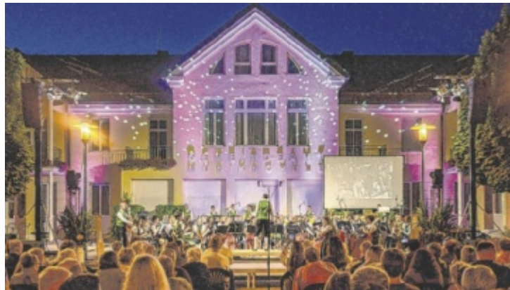
Der Dorfplatz als Konzertbühne – Musik, Emotion und ein Lichtermeer verzau- berten das Publikum.

Die Geschichte des Musikvereins beginnt im Jahr 1803 mit der Gründung durch Schulmeister Johann Langthaler. Schon zwei Jahre später war der Verein als „Prangerschützen-Fackelzug-Kapelle“ aktiv, damals mit Musik in Uniform, Fackelschein und Halstuch. Die erste einheitliche Tracht kam 1880: dunkelgrün und mit stolz getragenen Federbusch. Heute zählt der Musikverein Ried im Traunkreis zu den ältesten Blasmusikvereinen des Landes. Gleichzeitig zeigt er sich jung, engagiert und welto-