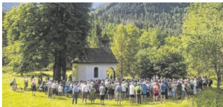
Die Rosaliakapelle aus dem Jahr 1843 ging 1878 an die Familie Lamberg.