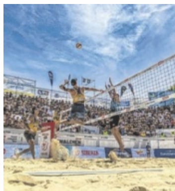
Die Beach-Elite kämpft am Attersee um den Titel.