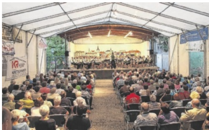
Von der Filmmusik bis zum Kaiserin-Sissi-Marsch erklingen.