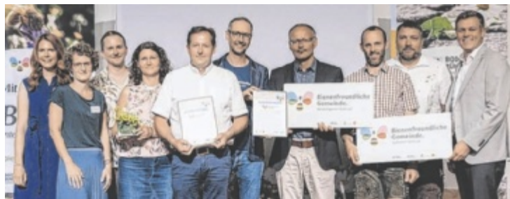
Umwelt- und Klimaratesrat Stefan Kaineder (Grüne, r.) hieß die Vertreter der beiden Gemeinden im oberösterreichweiten Netzwerk der Bienenfreundlichen Gemeinden willkommen.

Roßleithen und Windischgarsten gehören nun offiziell zu den mehr als 100 Gemeinden in Oberösterreich, die sich für bienenfreundliche Maßnahmen