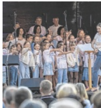
Auch der Juniorsingkreis begeisterte das Publikum.