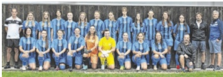
Frühjahrsmeisterinnen 2025: Die Damenmannschaft der Union Ried, erstmals im Bewerb, startet gleich mit einem Titel durch.