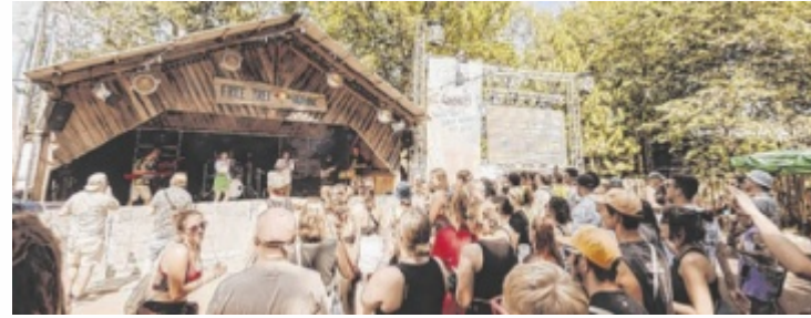
Das Free Tree Open Air ist bekannt für seine entspannte Atmosphäre.

Der Inn4tler Sommer läuft noch bis 27. September und vereint verschiedenste Kulturangebote in Braunau, Ried und Schärding – vom Konzert bis zur Ausstellung (www.inn4tler-sommer.at). Das Stift Reichersberg bietet über den Sommer hinaus Veranstaltungen von Volksmusik bis Klassik (www.stift-reichersberg.at). Der Brunnenthaler Konzertsommer bietet bis 24. August klassische Musik auf hohem Niveau in idyllischer Umgebung (www.konzertsommer-brunnenthal.at). Jazzfreunde