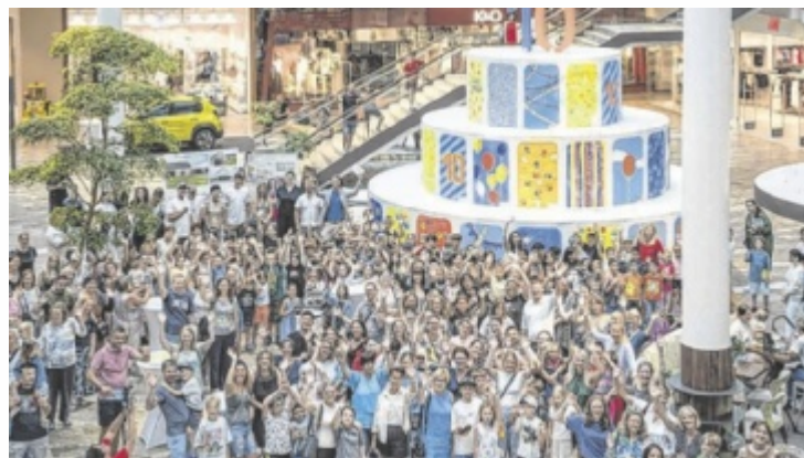
Die Jubiläumstorte wurde gemeinsam mit den Kindern am 23. Juni feierlich enthüllt.