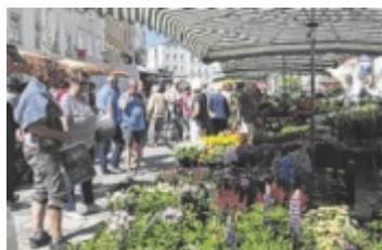
Im Rahmen des Grünmarktes wird ein Informationsstand aufgestellt.

Um dafür Bewusstsein zu schaffen und sich mit den Bürgern auszutauschen, lädt die Agenda Gruppe „Besser leben in Ried“ zu einem Informationsstand ein: Dienstag, 8. Juli, ab 9 Uhr beim