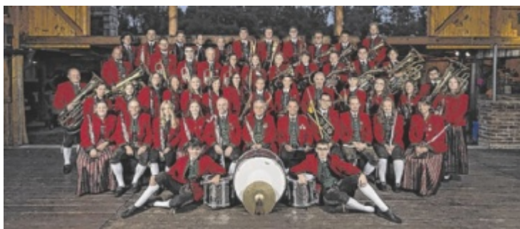
Der MV Pattigham veranstaltet einen Fröhshoppen.