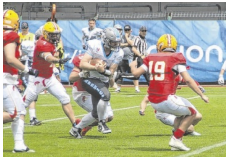
Aus Gladiators-Sicht kamen die Angreifer der Huskies viel zu oft und viel zu leicht durch die Rieder Defense.

Gegen den Tabellenführer aus Wels, der in dieser Saison alle Spiele gewann, erwischten die Rieder einen rabenschwarzen Tag, an dem ihnen praktisch gar nichts gelang. Die Huskies demonstrierten die Gastgeber gleich mit ihren ersten drei Drives, von denen jeder zu einem Touchdown führte. Insgesamt kassierten die Gladiators fünf Interceptions und lagen zwischenzeitlich so weit zurück, dass kurz vor der Halbzeit die „mercy rule“ in Kraft trat. Dabei wird die Zeit, außer bei