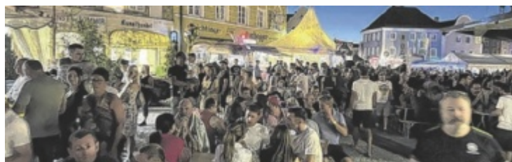
Schärdings Innenstadt wird wieder zum kulinarischen Schlaraffenland.