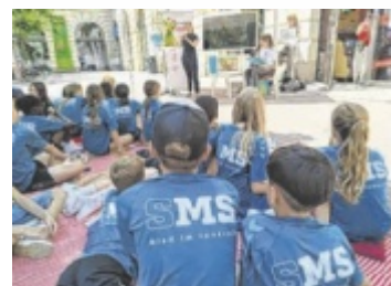
Die Schüler beim Aktionstag