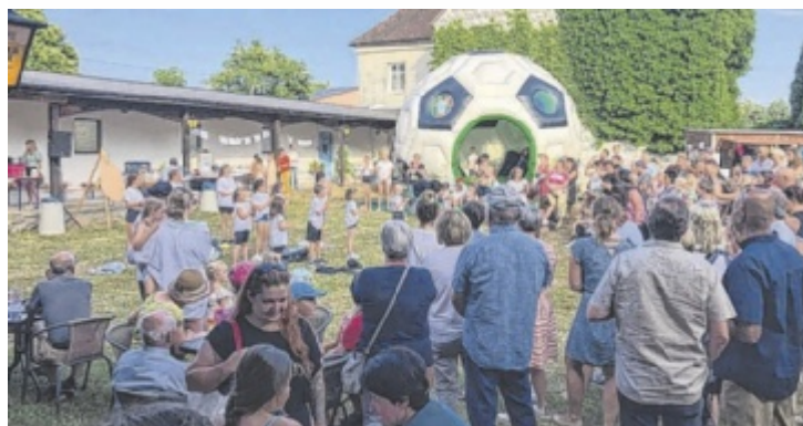
Der Pfarrhof wird wieder zum großen Spielplatz für alle.

Passauer Straße 13, 4780 Schärding Tel.: +43 50 1355 0 www.niedermayer.co.at