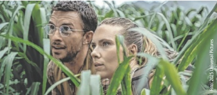
Scarlett Johansson und Jonathan Bailey auf den Spuren der Dinosaurier.