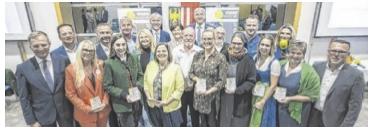
Die Gewinner des Vereinspreises 2023 samt Gratulanten