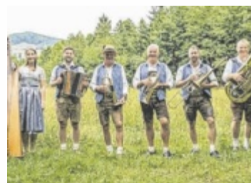
Die Irrsdorfer Tanzlmusi