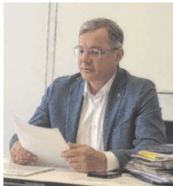
Bürgermeister Bernhard Zwielehner präsentierte den Energie-Masterplan für die Stadt Ried.

Grundlage dafür ist eine genaue Analyse der Ist-Situation. Aktuell beträgt der gesamte Heiz- und Strombedarf der 26 städtischen Einrichtungen (Freibad, Kindergärten, Schulen, Volkshaus, Bauhof, öffentliche Beleuchtung bis hin zum Friedhof) 6,1 Millionen Kilowattstunden (kWh) pro Jahr. Das entspricht ungefähr dem Energieverbrauch von 400 Einfamilienhäusern. Die Kosten teilen sich auf Geothermie (600.000 Euro), Strom (500.000 Euro) und Gas (80.000 Euro) auf, dazu kommen noch