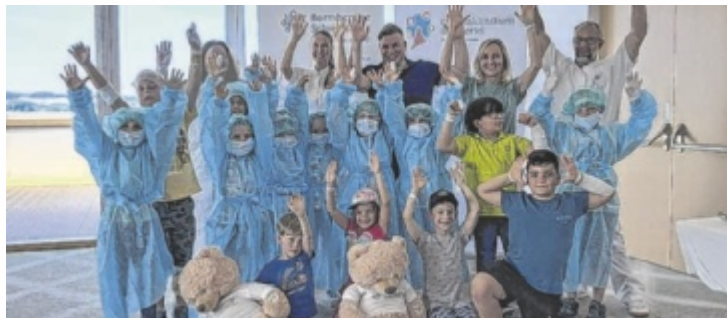
Abschlussfoto mit den Schüler und dem Personal des Krankenhauses

Sie folgten der Einladung des Barmherzigen Schwestern (BHS) Vinzi-Bären, der mit dem Fahrrad viel zu schnell unterwegs war, stürzte und ins Krankenhaus eingeliefert wurde. Gemeinsam begleiteten die Kinder