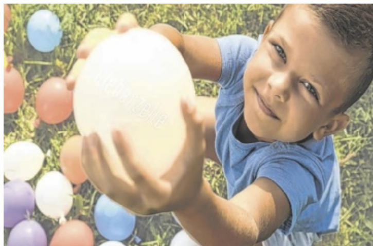
Für alle Schüler gibt es wiederverwendbare Wasserbomben.

„Unter dem Motto ‚Endlich Ferien‘ freuen wir uns auf ereignisreiche Sommermonate. Mit den wiederverwendbaren Wasserbomben bekommen alle Kids ein Geschenk fürs Badevergnügen. Mit unserer Minigolf-Anlage haben wir eine perfekte Freizeitbeschäftigung für kühle und heiße Sommertage. Und mit unserem Sommer-Sale kann man sich zum kleinen Preis noch das