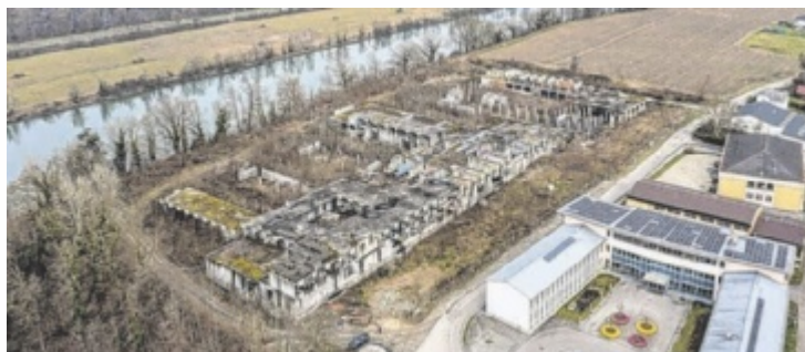
Es ist so weit: Im Sommer wird die Reha-Ruine abgerissen.

Die gemeindeeigene Fernwärme GmbH machte zu Beginn dieses Jahres von einem Wiederkaufsrecht Gebrauch, das vertraglich festgelegt wurde. „Endlich, nach den langen Jahren, in denen das