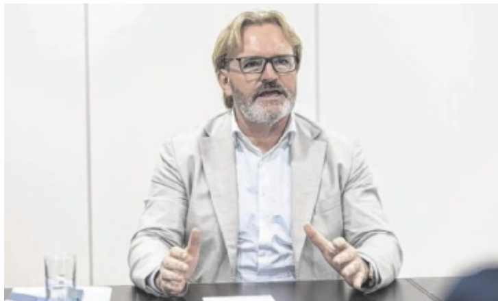
Der neue IV-OÖ-Präsident Thomas Bründl im Gespräch mit der Tips

Bründl: Wir brauchen einen mittelfristigen Plan, wie wir die Lohnstückkosten wieder nach unten bringen, eine absolute Entschlackung der Energiekosten und der überbordenden Bürokratie sowie der Gesetze, die uns überschwemmt haben.