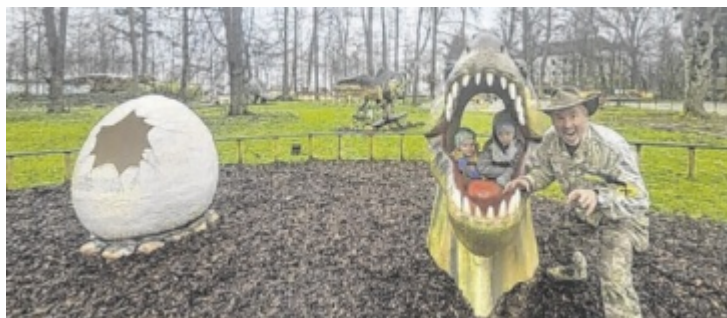
Im Dinoland beim Schloss Katzenberg gibt es viel zu erleben.

Am Unteren Inn und im Iberer Moor führen Guides wie Pietro Bellezza durch das „Naturschauspiel“ und zeigen etwa, wie man