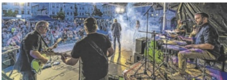
Crazy Chains mit ihrer Hommage an Pink Floyd