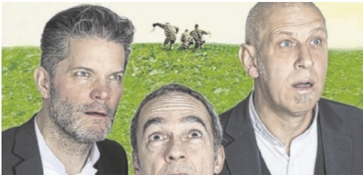
Das Trio spielt im Hof der Volksschule auf.

St. Valentin, Valentinmuseum: Ausstellung der Sengl Familie: "Malerei & mehr", Öffnungszeiten: Di u. Do von 17 - 19.00, So von 10 - 12.00 & 15 - 18.00, bis 27. Juli 2025