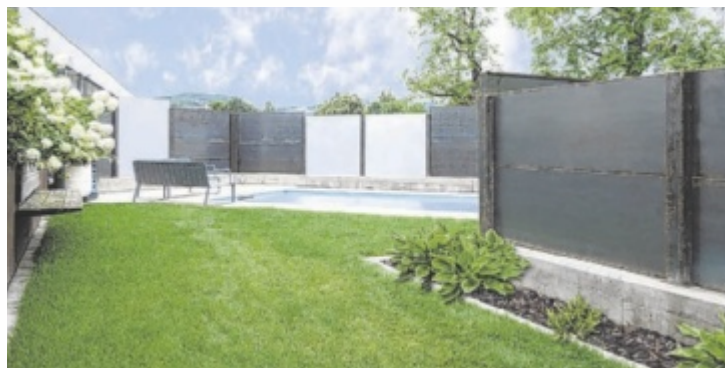
Cortenstahl und Glas als Sichtschutz von Maurhart

Letzteres wird in der Metallmanufaktur Maurhart besonders