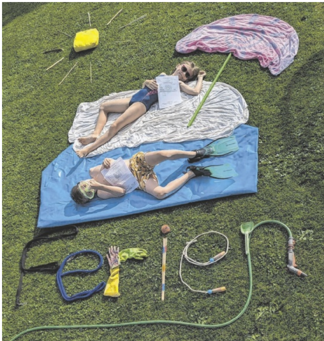
Zeigs Zeignis Beim Tips-Fotowettbewerb „Zeigs Zeignis“ spielen Noten keine Rolle. Was zählt, ist Kreativität. Gesucht werden positive Fotos von Schülern zwischen sechs und 14 Jahren mit ihrem Zeugnis. Seite 18