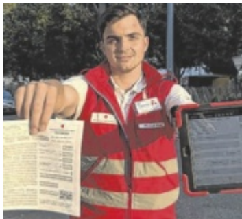
Rot-Kreuz-Mitarbeiter bei der Door-to-Door Aktion

Das Leistungsspektrum der Organisation geht längst über Rettungs- und Krankentransport hinaus: Krisenintervention, Ruffilfe, „Essen à la carte“, Pflege-mittelverleih, Katastrophenhilfe und Jugendgruppen gehören zu den täglichen Aufgaben und sind aus dem sozialen Leben vieler