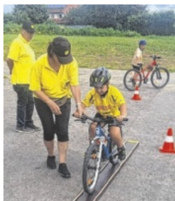
Kidical Mass 35 Kinder nahmen an der Fahrrad-Demo in St. Valentin teil und meisterten die Strecken bravourös. Seite 22/Foto: Lischka