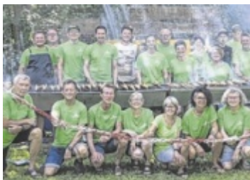
Die Naturfreunde braten Steckerlfische für die Besucher.

Die frisch renovierten Fitness-Stationen entlang des Ipfbachs laden zusätzlich zum Ausprobieren ein. ■