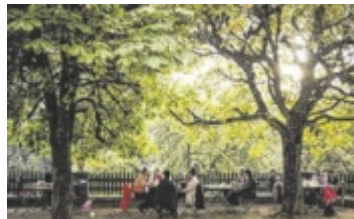
Erholung im Gastgarten

Gastgärten vermitteln eine entspannte, freundliche und familiäre Atmosphäre. Das gesellige Beisammensitzen unter Bäumen oder Sonnenschirmen sorgt für Wohlfühlmomente – perfekt für