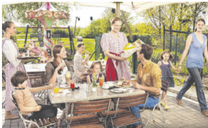
Auf der sonnigen Terrasse entspannen und die hausgemachte Eissalon-Eiscreme genießen.

Ob Frühstück, ein leichtes Mittagessen, Kaffee mit hausgemachten Mehlspeisen oder die hausgemachte Eiscreme – hier genießen Gäste die hochwertige Landzeit-Kulinarik unter freiem Himmel. Stilvolles Design und eine entspannte Atmosphäre machen die Terrasse zum Ausflugsziel für Genießer aus der Region.