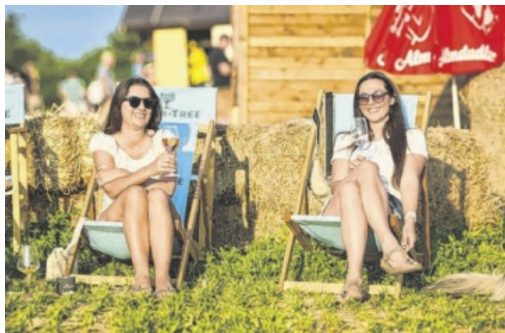
Bei Maismania kann bis 6. September gefeiert werden.