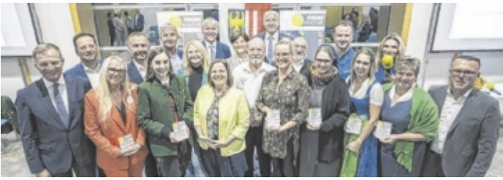
Die Gewinner des Vereinspreises 2023 samt Gratulanten