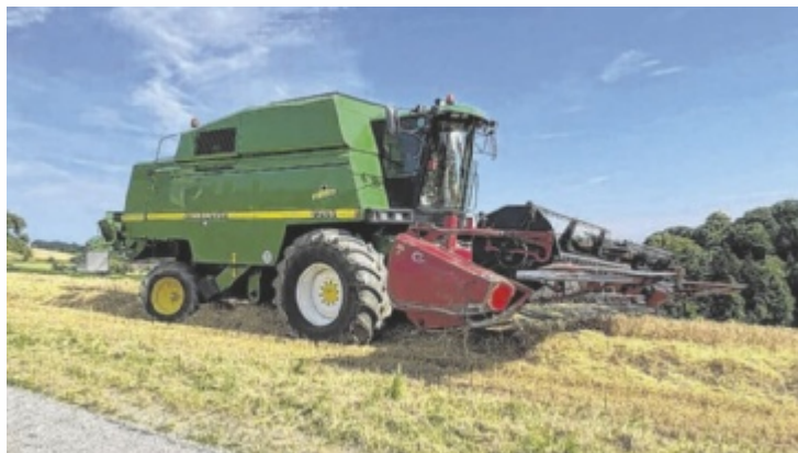
Jetzt sind viele regionale Bauern mit dem Traktor und bald auch mit den großen, breiten Mähdreschern (Foto) unterwegs.