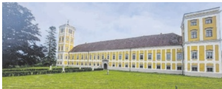
Von 10. Juli bis 17. August bieten die Tillysburger Festspiele ein abwechslungsreiches Kulturprogramm.