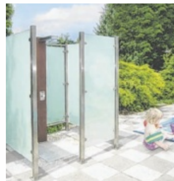
Freiluftdusche aus Edelstahl und Glas

gern mit Edelstahl kombiniert, um den Pflegeaufwand zu verringern und die Langlebigkeit maßgeblich zu erhöhen. Beides sind wesentliche Vorteile gegenüber Holz. Gerade an Orten, die auch einen Wellnessfaktor mit sich