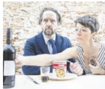
Theater in Wilhering

Umfangreich und abwechslungsreich ist auch das Angebot im Bezirk Linz-Land. Am Programm stehen unter anderem: das TheaterSPECTACEL Wilhering vom 9. Juli bis 1. August ( www.theaterspectacel.at ), die Festspiele Schloss Tillysburg vom 10. Juli bis 17. August ( www.festspiele-schloss-tillysburg.at ), das Sommertheater Traun vom 17. Juli bis 14. August ( www.kulturpark.at ), das KUYA Sommernachtskino Turm