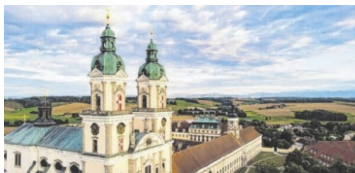
Die Konzerte finden in der Stiftsbasilika statt.