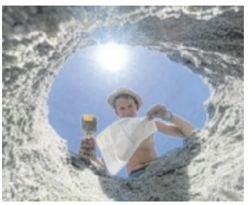
Gesucht werden kreative Fotos der Schüler samt Zeugnis.

In Kooperation mit dem Papier- und Spielwarenhandel, dem OÖ Verkehrsverbund und Radlberger sucht Tips wieder die originellsten Zeugnissfotos. Auf die besten Einsendungen, gewählt von einer Fachjury, warten pro Bezirk Gutscheine für den Fachhandel der Sparte OÖ Papier- & Spielwarenhandel im Gesamtwert von je 200 Euro. Obmann Georg Obereder: „Zeigs Zeignis hat sich über die Jahre hinweg als beliebte Initiative etabliert, die nicht nur schulische Leistungen, sondern vor allem auch Engagement und Kreativität würdigt.“ Zusätzlich dürfen sich die Bezirksieger über einen Gutschein für den Hochseilgarten Kirchschatz Ralf &