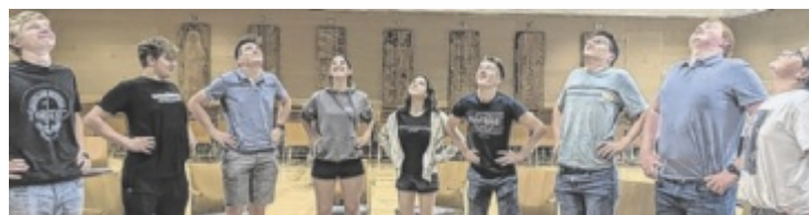
Die Schüler mit vollem Einsatz beim Workshop.

In Kleingruppen vertieften die Schülerinnen und Schüler das Gelernte mit praktischen Übungen zu Körpersprache, Spontanrede, Redeaufbau und sicherem Auftreten. ■