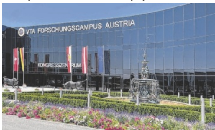
Der VTA Forschungscampus in Rottenbach