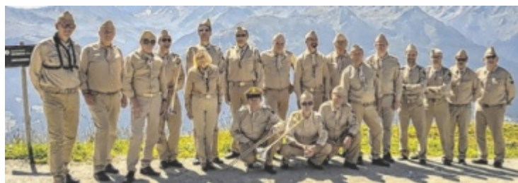
Die RAT Big Band spielt im Stil der „US Army Air Force Band“.

Anmeldungen unter der E-Mail: naturpark@attersee-traunsee.at ■