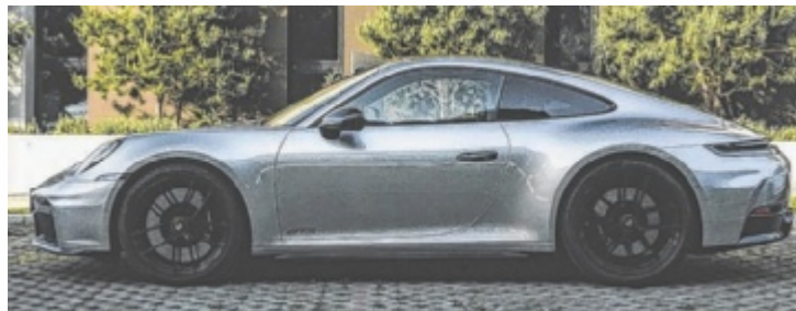
Der Porsche 911 Carrera 4 GTS T-Hybrid

Ja, okay, ist etwas dick aufgetragen, aber nur rational packt man den 911er nicht, schon gar nicht als dramatisierten GTS. Das Kürzel steht seit jeher für die noch purere Essenz des Fahrens. Im Zuge des letzten Facelifts wurde dem ein weiterer Aspekt mit dem klingenden Namen „T-Hybrid“ hinzugefügt.