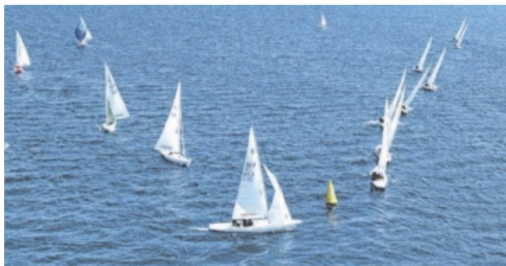
Die Bojen halten auch bei einer steifen Brise verlässlich ihre eingegebene Position und justieren sich immer wieder nach.