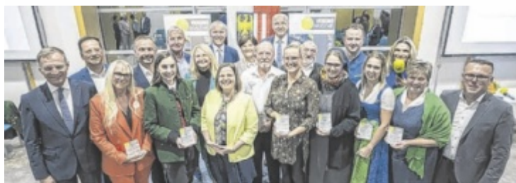
Die Gewinner des Vereinspreises 2023 samt Gratulanten