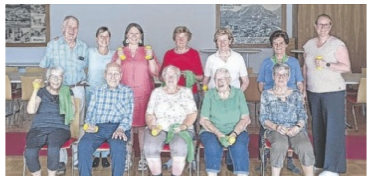
Aufgrund der Nachfrage ist im Herbst ein weiterer Kurs geplant