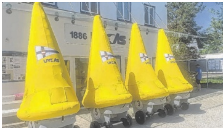
Die fortschrittlichen GPS-Bojen in Reih und Glied aufgestellt vor dem Sekretariat des Union-Yacht-Clubs Attersee