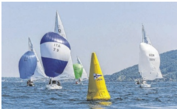
Die Regatta-Kurse können mit den neuartigen Bojen viel präziser festgelegt werden als mit den herkömmlich verankerten Bojen.