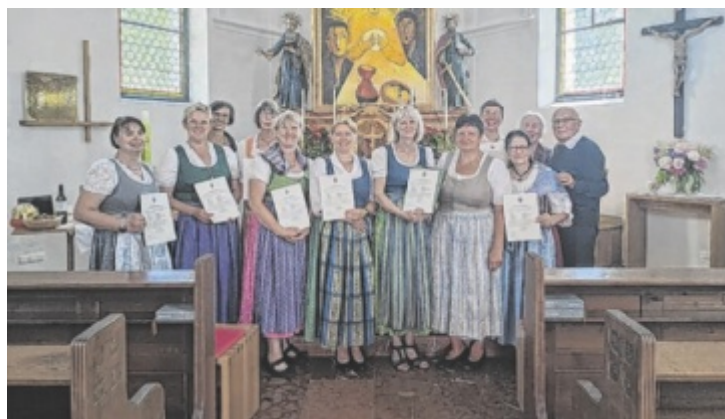
Das neues Seelsorgeteam der Pfarre Obertraun