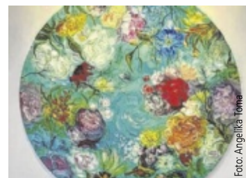
Blumenlandschaft, Öl auf Leinwand