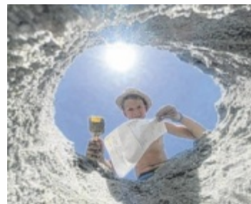
Gesucht werden kreative Fotos der Schüler samt Zeugnis.

OÖ. Beim Tips-Fotowettbewerb „Zeigs Zeignis“ spielen Noten keine Rolle. Was zählt, ist Kreativität.