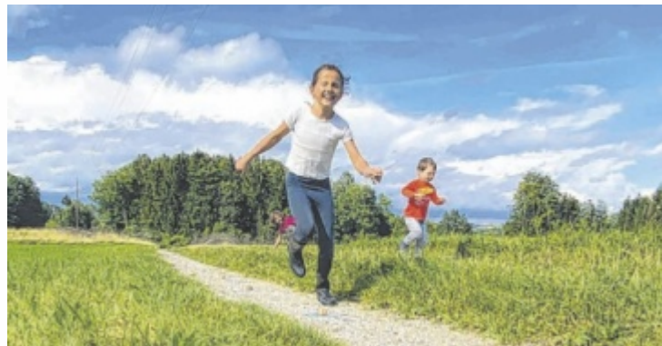
Ferienzeit im Naturpark für die ganze Familie

Die genauen Programmpunkte in den einzelnen Naturparks und Infos zu regionalen Angeboten sind unter www.naturparke-ooe.at abrufbar. Ob Naturspiele, Kräuterwanderungen oder Tierbeobachtungen – der Tag verspricht Natur zum Anfassen und Erleben. Wer am Familienerlebnistag auf den Geschmack kommt, kann mit