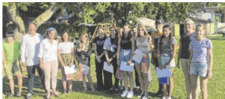
GO-ON -Projekt in Gmunden ist zurück.