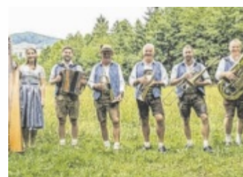
Die Irrsdorfer Tanzlmusi

Lustige G'stanzln, flotte Klänge und pointierte Kommentare sorgen für einen abwechslungsreichen Abend. Karten sind erhältlich im Stehrerhof, Tel. 07682/7033 oder info@stehrerhof.at , Beginn ist am 5. Juli um 20 Uhr. Oldtimerbesitzer kommen mit ihren blitzblank polierten Fahrzeugen zum Oldtimer-Treffen an den Stehrerhof, wo sie auch heuer sicher wieder von vielen Besuchern begeistert begrüßt werden. An diesem 6. Juli