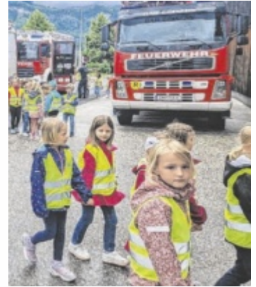
Besuch bei der Feuerwehr

gang mit Löschdecke, Feuerlöscher und Fire-Trainer zur Demonstration von Fettbränden. Ein Wettbewerb mit dem Tanklöschfahrzeug rundete den Tag ab. Wolfgang Reisinger, Sachbearbeiter des Oberösterreichischen Landesfeuerwehrverbandes für „Gemeinsam.Sicher.Feuerwehr“, dankte der FF Bad Goisern für ihr Engagement und die Zusammenarbeit zwischen Feuerwehr und Bildungsinstitutionen. ■