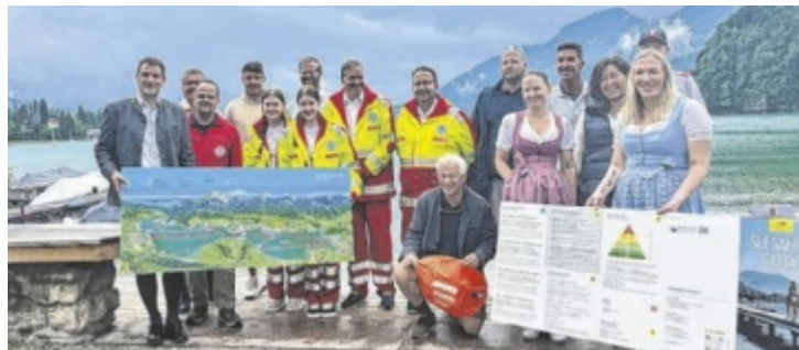
Vertreter des Tourismus am Wolfgangsee bei der Präsentation

Der Wolfgangsee zählt zu den beliebtesten Seen Österreichs – ein Naturparadies, das Erholungssuchende, Wassersportfans und Naturgenießer gleichermaßen begeistert. Damit die einzigartige Kulisse auch weiterhin sicher und respektvoll genutzt werden kann, wurde nun der See Safety Guide vorgestellt. „Diese Initiative soll das Bewusstsein für ein rücksichtsvolles Miteinander auf und rund um den See nachhaltig stärken“, heißt es seitens der Verantwortlichen bei der Präsentation. Ob Schwimmer, Stand-up-Paddler,