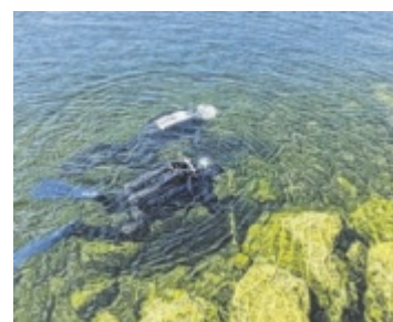
16 Taucher im Einsatz

GMUNDEN. 16 Taucher reinigten die Traun von Müll wie Einkaufswagen, Reifen und einer WC-Muschel. Unterstützt wurden sie von Bootscrews, der Feuerwehr und Zillen des Fischervereins. Die teils stark bewachsenen Funde machten den Einsatz körperlich anspruchsvoll. Stadt und Bundesforste übernahmen Entsorgung und Sponsoring. ■