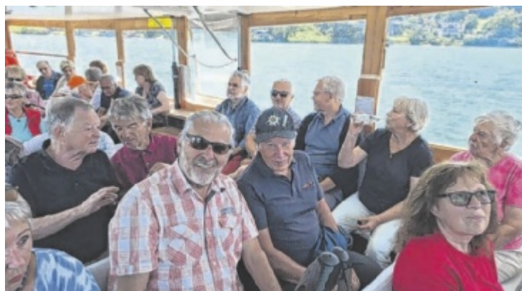
Ausflug der Pensionisten aus Gschwandt

echtes Highlight für die gut gelaunte Gruppe. Im Anschluss besuchten einige das Porschemuseum, während andere den Ort erkundeten. Ein gemütliches Mittagessen im schattigen Gastgarten rundete den gelungenen Tag ab, der bei der Heimfahrt mit einem fröhlichen Lied seinen Ausklang fand. ■