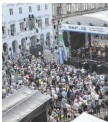
Stadtfest Drei Tage lang wird von 27. bis 29. Juni bei freiem Eintritt das 44. Steyrer Stadtfest gefeiert. Seite 4