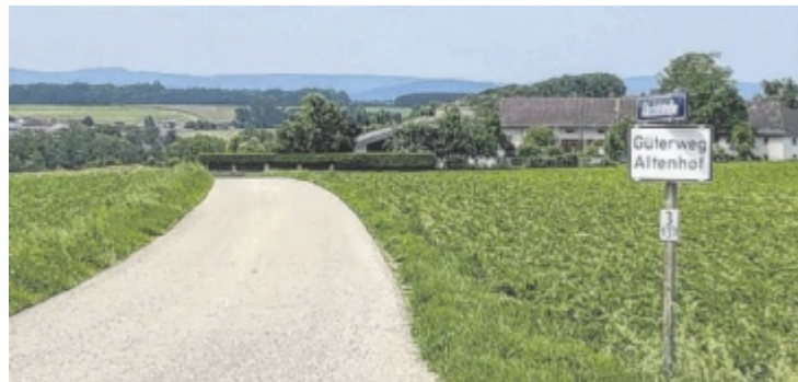
Die Deponie ist nur durch schmale Güterwege erreichbar.

Genehmigt wurde die Deponie bis zum Jahr 2034, laut Bescheid sind von Montag bis Freitag bis zu 40 Lkw-Fahrten pro Tag möglich. Auch an Samstagen kann die Firma Mitter als Betreiber im Bedarfsfall zufahren und Aushubmaterial von diversen Baustellen abladen. Sobald die 94.000 Kubikmeter fassende Deponie gefüllt ist, wird sie geschlossen. Wie lange das dauert, kann derzeit nicht abgeschätzt werden. Fix ist,