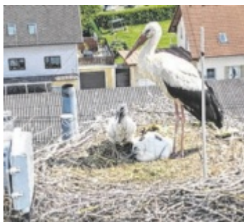
Die beiden Jungstörche am Handy-mast wachsen heran.

PFARRKIRCHEN. Mitte Juli sollten die beiden Jungstörche vom Feyregger Handymast in Pfarrkirchen bei Bad Hall bereit für ihren ersten Flug sein. Ab Mitte August werden sowohl die beiden Jungstörche als auch ihre Eltern mit andern Störchen in einer „Reisegruppe“ in den Süden nach Afrika ziehen. ■