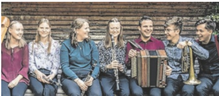
Dieses junge Ensemble bringt frischen Wind in die heimische Volksmusikszene – live zu erleben am 4. Juli auf der Burgruine Losenstein.