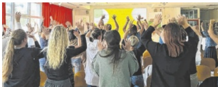
Praxisaustausch in den Räumlichkeiten der BAFEP Steyr.