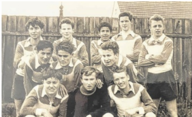
Helmut Köglberger (hintere Reihe, Mitte) war der bekannteste Spieler, den der SV Sierning hervorbrachte. Der 2018 im Alter von 72 Jahren verstorbene Stürmer spielte 28 Mal für Österreichs Nationalteam (sechs Tore).