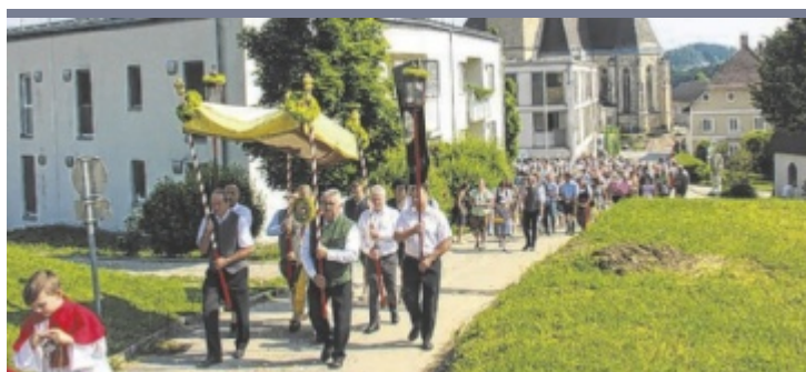
Prozessionen Zu Fronleichnam fanden in der ganzen Region Prozessionen statt, wie hier in Maria Neustift. Katholiken feiern an diesem Tag ein Fest der Dankbarkeit, bei dem Jesus Christus im Mittelpunkt steht.