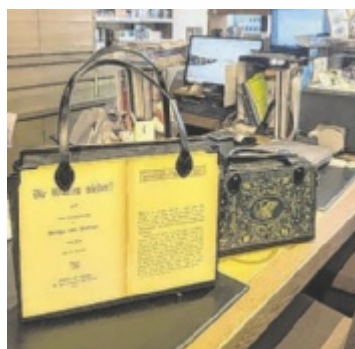
Upcycling-Produkte der Marke Bernanderl gibt es bald auch in Japan.