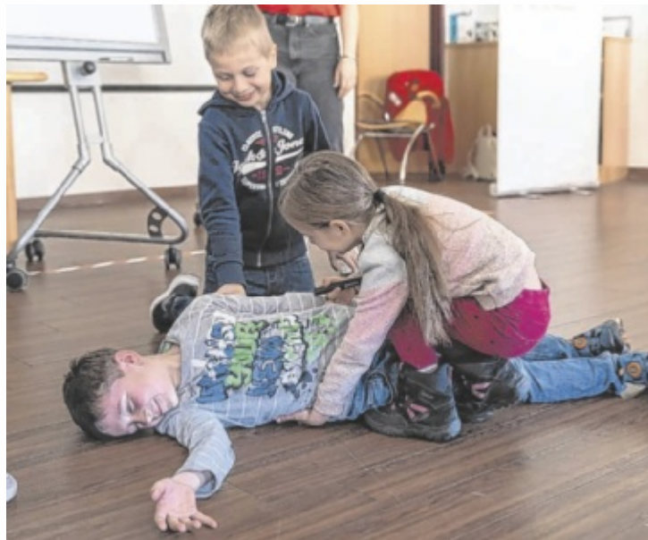
Die Kinder üben die stabile Seitenlage.

Ziel des Angebots ist es, bereits den Jüngsten lebensrettendes Grundwissen zu vermitteln – auf kindgerechte und spielerische Weise. Die Kinder lernten unter anderem, wie man richtig einen Notruf absetzt, kleinere Wunden versorgt, Pflaster korrekt klebt und jemanden in die stabile Seitenlage bringt. Begleitet wurden die praktischen Übungen von geschultem Personal mit altersgerechtem Material.