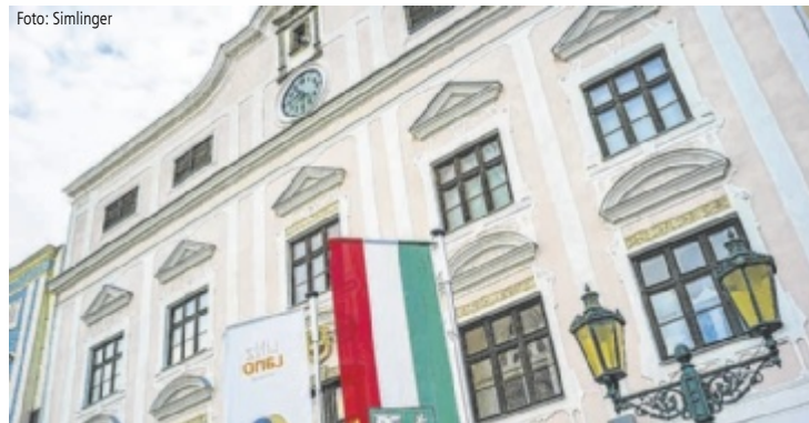
Das Museum Lauriacum und das Museum 1212 bieten kostenlose Führungen an.