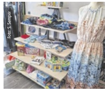
Sortiment beim Rot-Kreuz-Markt.

Aufgeführt wird das Stück an 12 Abenden im Juli. Karten können unter der Telefonnummer 0699/14470001 und per Mail unter office@theaterimhof.at bestellt werden. Nähere Infos: www.theaterimhof.at ■