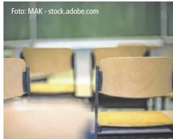
Noch wurde kein Standort gefunden.

Die Gemeinde wächst stetig: Von rund 3.400 Einwohnern im Jahr 1981 auf aktuell über 7.000. Mit dem möglichen Bau einer neuen Mittelschule soll auf den steigenden Bedarf durch den starken Bevölkerungszuwachs reagiert und langfristig mehr Platz für Kinder und Jugendliche geschaffen werden. „Die Volksschule ist bereits überfüllt, teilweise wird in Containern unterrichtet“, heißt es in der ÖVP-Aussendung. Ein Kinderhaus für die Kleinsten ist gerade im Entstehen - Tips berichtet. Laut ÖVP sollen in der neuen Mittelschule künftig rund 300 Kinder Platz finden; der Baustart sei „möglich“ zwischen 2027 und 2028. Dass eine Schule vor Ort dringend nötig ist, bezweifelt die Gemeindeführung nicht. „Wir möchten dieses Projekt – auch