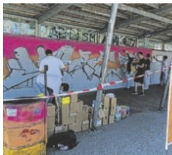
Die Jugendlichen beim Sprayen.