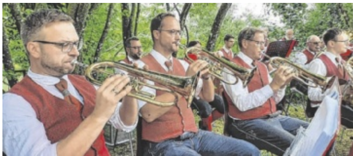
Der Musikverein Erla spielt im Pfarrhofgarten auf.