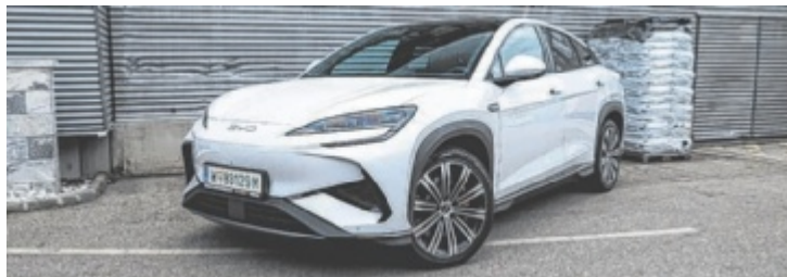
Der BYD Sealion 7 Excellence ist ab 56.490 Euro zu haben.

Schön vor Augen führt das SUV-Coupé dabei, dass sein Gesicht