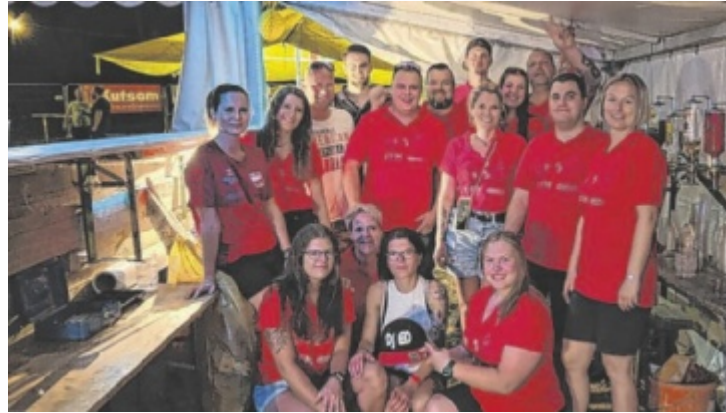
Beste Stimmung beim Team der Bar mit DJ Ed

Ab 22 Uhr steigt die Party mit „Stand-Up“ auf der Hauptbühne und ca. 22.30 Uhr legt im Disco-Zelt „DJ ED“ auf. Am Samstag gibt es ab 20 Uhr ein Ver-