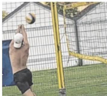
Gespielt wird zu Viert.

„Sport verbindet, hält gesund und macht Freude und bringt Freunde“, weiß Obmann Manfred Wolfinger. Neuanfänger sind im Verein herzlich willkommen. Infos gibt es unter 0676 5113177 bei Wolfinger. ■