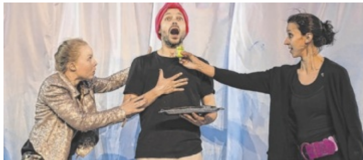
Premiere der Komödie ist am Mittwoch, 2. Juli.

In einer heiteren, musikalischen Inszenierung bringt das Theater im Hof die poetische Verwechslungskomödie auf die Bühne: Zwei Zwillingspaare sorgen im schräg-verhexten Ephesus für Verwirrung, Selbstzweifel – und schließlich für eine überraschende Familienzusammenführung. Das bewährte Ensemble mit Intendant Christian Himmelbauer präsentiert das Stück mit einem aktuellen, humorvollen Zugang, viel Musik und eindrucksvollem