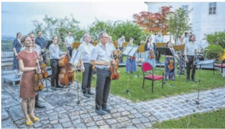
Konzert im Ambiente des Rosengartens