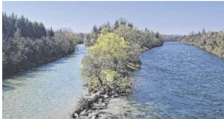
Der Almspitz – Zusammenfluss der Traun mit der Alm

Der Wanderweg lässt sich grundsätzlich in beide Richtungen begehen. Die gewählte Route verläuft von Nord nach Süd. Vom Bahnhof Lambach führt der Weg etwa drei Kilometer entlang der Traun, die gemeinsam mit der Alm einen besonders fotogenen Zusammenfluss, den sogenannten Spitz, bildet. Die Brücke überqueren, dann folgt man der Alm südwärts: zuerst Richtung Bad