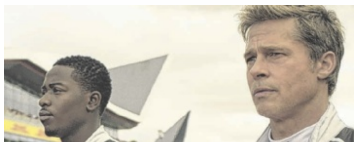
Damson Idris und Brad Pitt sind Kollegen im Team APXGP.