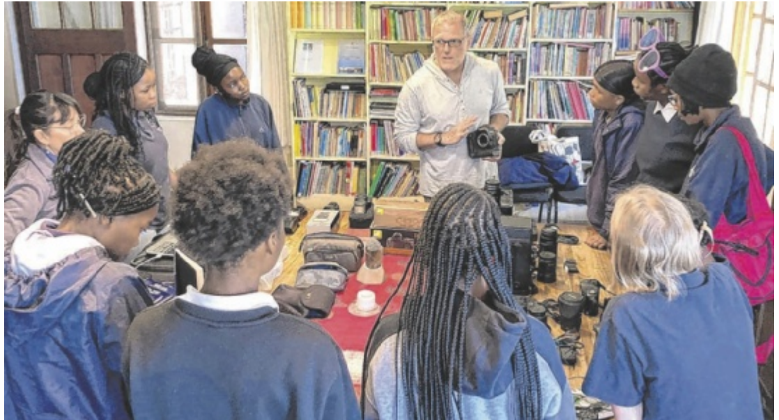
Workshop in Namibia mit gespendeten Kameras

Auch in Teilen Südamerikas ist die Situation ähnlich: Als der Enns' Foto- und Filmreporter Wolfgang Simlinger im Zuge einer Film-