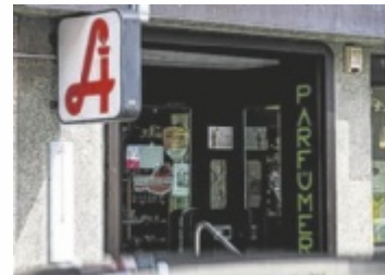
Für die Apotheke wird ein neuer Standort gesucht.

Die Apotheke wurde kurzfristig von der Bezirkshauptmannschaft geschlossen, da die Konzessionsinhaberin, die die Leitung wieder