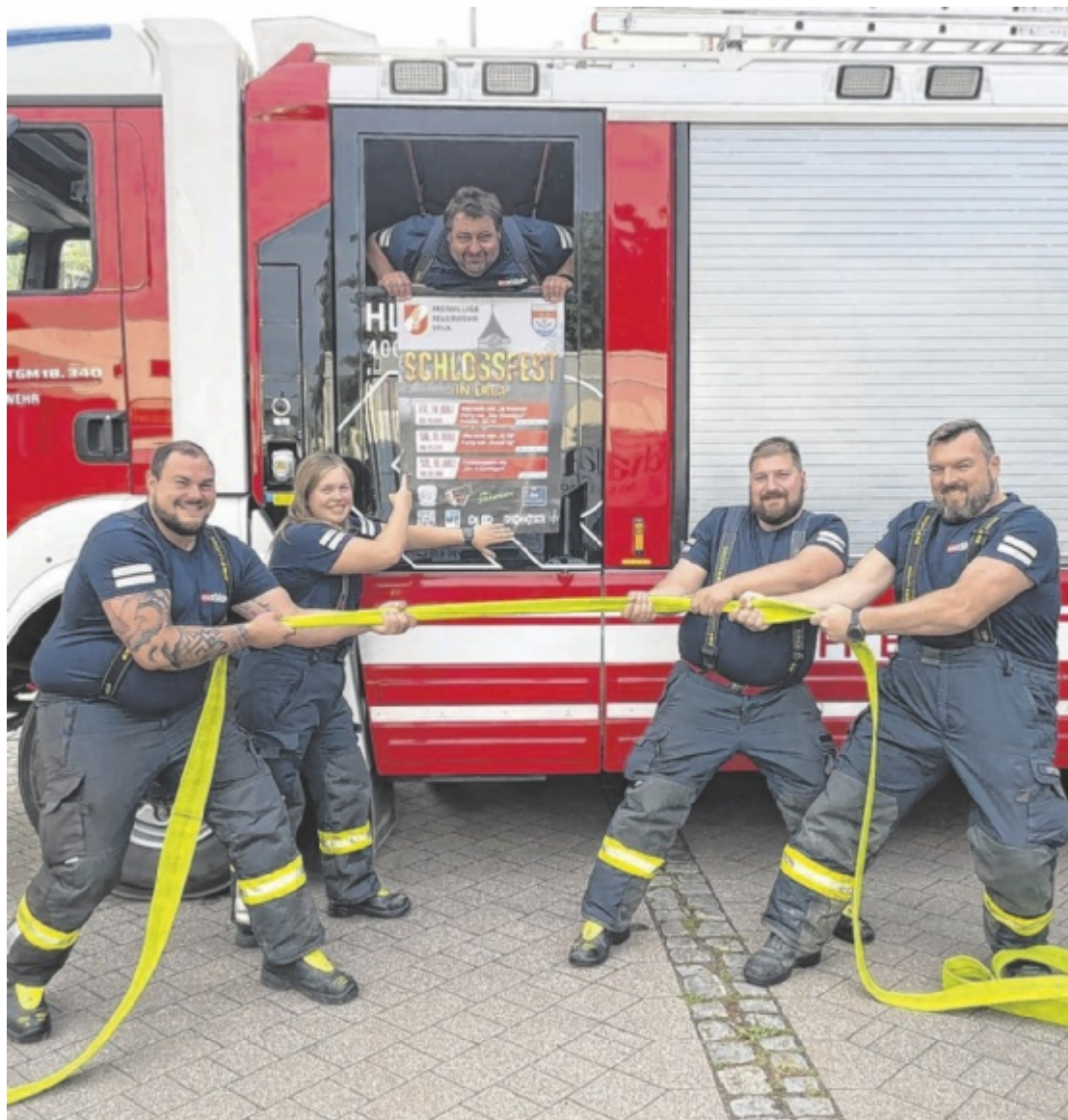
Schlossfest Die Freiwillige Feuerwehr Erla lädt von 11. bis 13. Juli zum Fest in den Schlosspark – mit Livemusik, Disco-Zelt, Vereins-Schlauchziehen, kulinarischen Highlights und mehreren Bars. Tips verlost 3x2 Eintrittskarten. Seite 21 / Foto: FF Erla