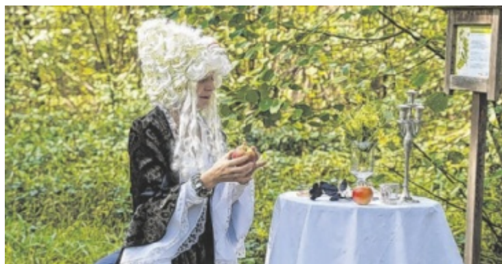
Die böse Königin von Schneewittchen