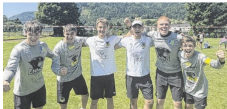
Die jungen Faustballer vom Turnverein Enns erkämpften sich den zweiten Platz auf Bundesebene.