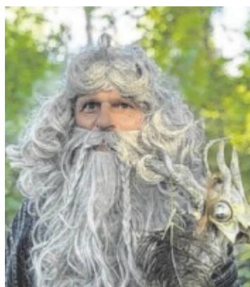
Märchenwanderung Der Winklinger Märchenwald öffnet am So., 6. Juli, seine Pforten für Besucher. Seite 20 / Foto: Kronstorfer Wunderwelt