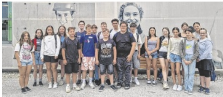
Die Schüler bekamen Tipps für ihren Berufsweg.

Am Talentetag werden im Bildungsinformationszentrum (BIZ) der Wirtschaftskammer Niederösterreich die Fähigkeiten der Jugendlichen wissenschaftlich erfasst. Logisch-analytisches Verständnis und kognitive