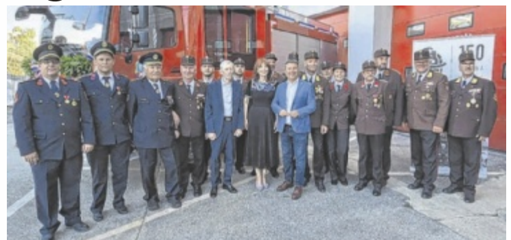
Die Feuerwehr Sveti Ivan Zelina feierte ihr 150-jähriges Bestehen.