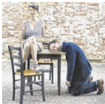
In „Mirandolina“ treffen Frauenpower und gekränkte Männeregos aufeinander.

Heuer steht die Komödie „Mirandolina“ von Carlo Goldoni auf dem Spielplan – in einer modernen Fassung von Joachim Rathke und Doris Hapfl. Die Handlung: Mirandolina, eine selbstbewusste Hotelbesitzerin in Florenz, ist überzeugter Single. Als ein abgehalfterter Adelige, ein Mafia-Boss und schließlich auch noch ein bekennender Frauenverächter versuchen, ihr Herz zu erobern, beschließt sie, ihnen eine Lektion zu erteilen. Was als Spiel beginnt, endet in einem absurden