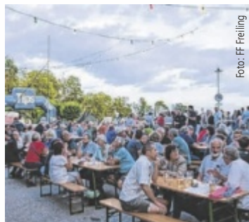
Das 100-jährige Bestehen wurde mit einem Fest gebührend gefeiert.

Zahlreiche Bewerbungsgruppen aus der Region stellten sich dem sportlich-feuerwehrtechnischen Wettkampf. Am Abend wurden die Leistungen ausgiebig gefeiert. DJ Landscape sorgte für ausgelassene Partystimmung. Der Sonntag bildete den gemütlichen Abschluss des Festwochenendes. ■