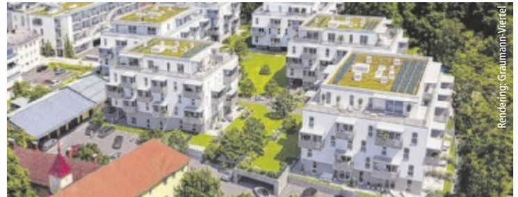
Mit 78 Eigentumswohnungen geht das Graumann-Viertel in seine finale Bauphase.

Seit Jahren entwickelt sich das Graumann-Viertel zu einem städtischen Lebensraum mit vielfältigem Angebot. Neben Wohnungen beherbergt das Viertel bereits Nahversorger, Gastronomie, Arztpraxen und Dienstleistungsbetriebe – eingebettet in ein verkehrsfreies Umfeld mit Grünflächen, Sharing-Angeboten und urbaner Infrastruktur. Die neuen Wohnungen