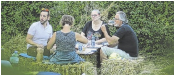
„Live im Weingarten“ besticht durch die einzigartige Atmosphäre.

Zwischen Rebstöcken und Wiesen entsteht eine Bühne mitten im Grünen. Für die musikalische Begleitung sorgt die Band Light it Up, die mit ihrem lässigen Sound für die passende Stimmung sorgt – unaufgeregt, tanzbar und nahbar. Der