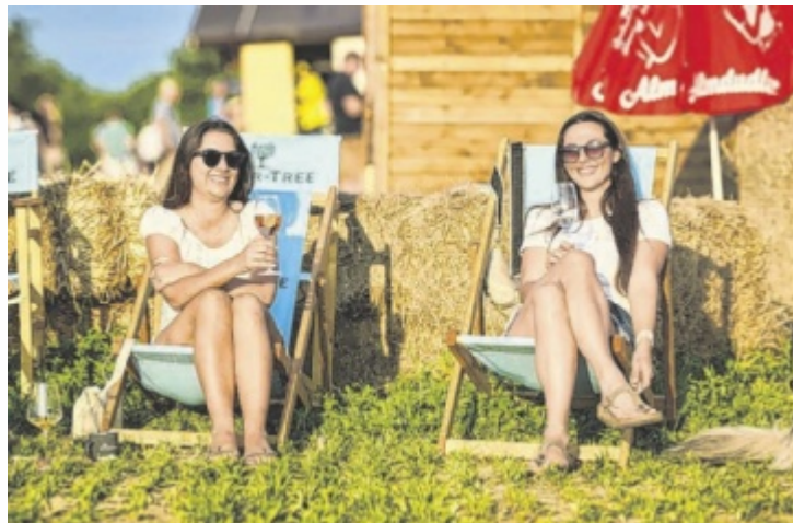
Bei Maismania kann bis 6. September gefeiert werden.