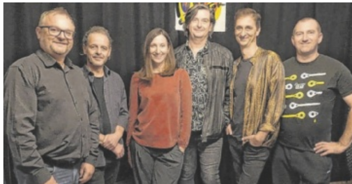
Am 18. Juli im NH10-Garten: Funk Elevator. Tips verlost Freikarten!

Am Samstag, 12. Juli, 18 Uhr, wird Jubiläum gefeiert: 15 Jahre NH10. Es wird ein launiger