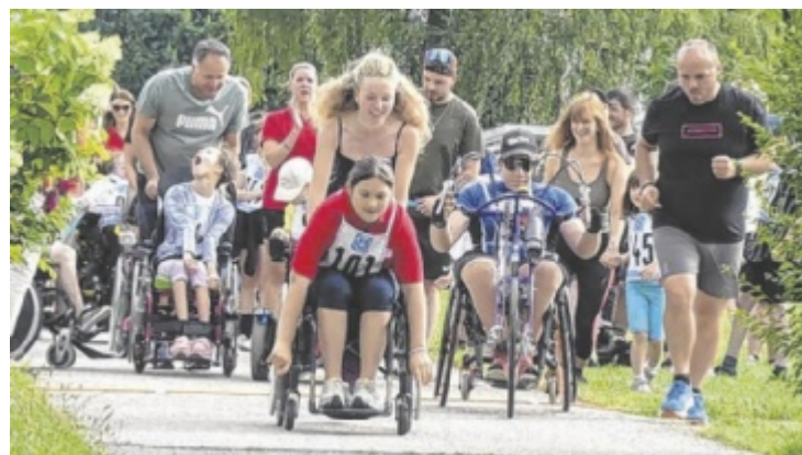
Das MOVE-Lauffest findet am 1. Juli zum bereits siebten Mal statt.

Begleitet werden die jungen Läufer:innen nicht nur von Lehrer:innen und Betreuer:innen, sondern auch von Hobbyläufern und professionellen Marathonläufern, die mit anfeuern, mitlaufen – und mitstaunen. Das MOVE-Lauffest zeigt eindrucksvoll, wie viel Freude und Motivation im gemeinsamen Tun liegen kann, wenn Barrieren nicht im Weg stehen, sondern gemeinsam überwunden werden. Anmeldungen sind unter office@move-austria.com für den speziellen Lauf möglich. ■