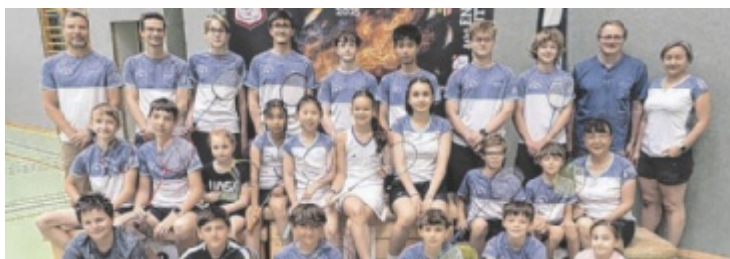
Die Neuhofner gewannen den Medaillenspiegel souverän.