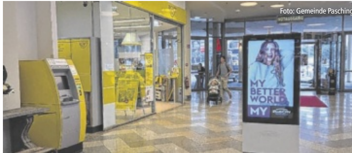
Die Postfiliale PlusCity ist nicht nur zentrale Anlaufstelle für die rund 8.000 Einwohner Paschings, sondern auch für die zahlreichen Betriebe in der PlusCity unverzichtbar.

PASCHING. Die Gemeinde stellt sich entschieden gegen die geplante Umstrukturierung der Postfiliale in der PlusCity. Nach derzeitigen Plänen soll der Standort nicht mehr in seiner bisherigen Form weitergeführt, sondern in eine Postpartnerschaft umgewandelt werden – ein Schritt, den Bürgermeister Markus Hofko und sein Team nicht einfach hinnehmen wollen.