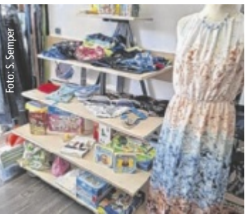
Sortiment beim Rot-Kreuz-Markt.

Alle Infos und das gesamte Angebot unter der Dachmarke OÖ Kultursommer gibt's online unter www.kultursommer-ooe.at .