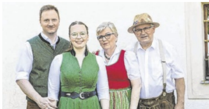
Das Team des Backhaus Offering feiert 20-jähriges Jubiläum.

Beim Frühschoppen am 29. Juni wird die Initiative erstmals öffentlich vorgestellt. Dahinter steht der Wunsch, Herkunft und Qualität regionaler Lebensmittel nicht nur zu betonen, sondern auch transparent zu machen – und die Gäste aktiv einzubinden. „Warum sollen Gäste Fragen stellen? Wie kann man gemeinsam einkaufen? Welche Hilfe brauchen Wirte?“, sind einige der Fragen, die im Rahmen der neuen