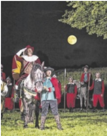
Seit 100 Jahren wird das Frankfurter Würfelspiel aufgeführt.

„Der OÖ Kultursommer stellt auch dieses Jahr wieder beeindruckend unter Beweis, dass Oberösterreich ein Land der Kultur ist – und das im wahrsten Sinn des Wortes pausenlos. Denn auch in den Sommermonaten wird ganz Oberösterreich gespielt: von Musik über Theater bis hin zu Literatur, Film und Tanz. Das Angebot des OÖ Kultursommers ist breit und vielfältig, innovativ und traditionell und in