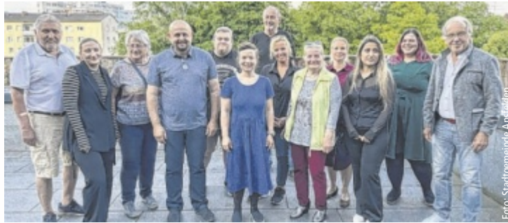
Der Ansfeldner Bürgerbeteiligungsbeirat ist erstmals zusammengetreten.

ANSFELDEN. Politik ist in Ansfelden keine Einbahnstraße mehr. Seit der Gemeinderat im Dezember 2024 einstimmig neue Beteiligungsrichtlinien verabschiedet hat, ist klar: Bürger sollen aktiv mitgestalten können, wie sich ihre Stadt entwickelt. Das geschieht auch durch neue Formate, die bewusst Mitsprache auf Augenhöhe ermöglichen.