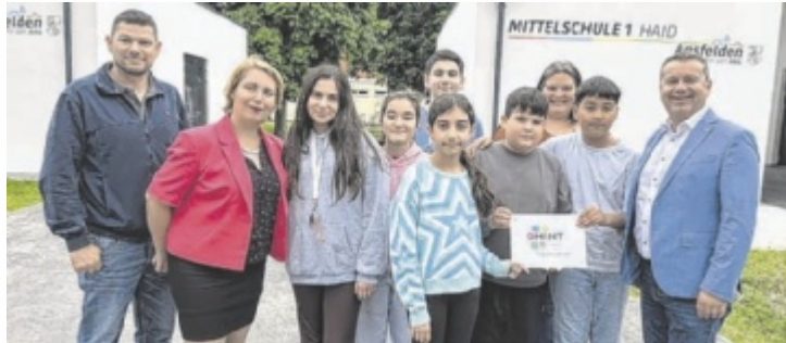
Technik trifft Teamgeist: Haider Schule holt MINT-Gütesiegel.

ANSFELDEN. Große Freude an der Mittelschule 1 Haid: Beim regionalen Bildungsevent „MINT bewegt das Traunviertel“ wurde die Schule mit dem MINT-Gütesiegel ausgezeichnet. Damit zählt sie nun offiziell zu jenen Bildungseinrichtungen, die naturwissenschaftlich-technische Inhalte besonders innovativ und praxisnah vermitteln.