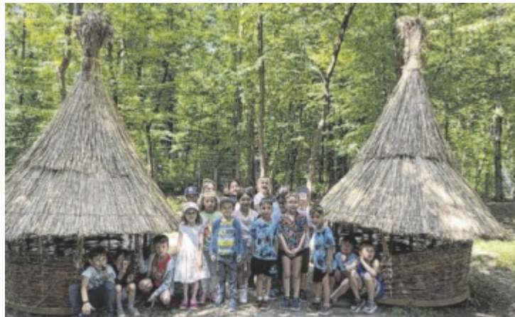
Die Volksschulkinder präsentieren stolz ihre selbst errichteten Hütten.