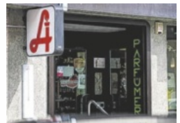
Für die Apotheke wird ein neuer Standort gesucht.

Die Apotheke wurde kurzfristig von der Bezirkshauptmannschaft geschlossen, da die Konzessionsinhaberin, die die Leitung wieder