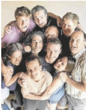
Der Kulturhof Perg feiert sein zehnjähriges Jubiläum.

Viele der teilnehmenden Festivals blicken auf eine beeindruckende Geschichte zurück. Exemplarisch dafür stehen einige runde Jubiläen: Die Internationalen Kammermusiktage in St. Marien sowie der Kulturhof Perg feiern 2025 ihr zehnjähriges Bestehen. Die Burgfestspiele