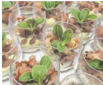
Haidinger Catering begeistert mit individuellen kulinarischen Konzepten für Hochzeiten, Firmenfeiern und besondere Anlässe

Besonderes Augenmerk gilt Hochzeiten: Für den schönsten Tag im Leben wird jedes Menü individuell zusammengestellt – vom stilvollen Buffet bis zum feinen Galadinner. Ob klassische Eleganz oder moderne Kulinarik, ob Sektempfang oder Cocktailbar – das Angebot ist so vielfältig wie flexibel. Auch