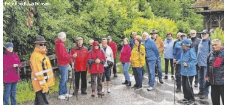
Bei der „Bankerl-Roas“ zog der Rauchclub Frohsinn quer durch Kirchberg-Thenning.

verzogen sich, und eine größere Gruppe entschloss sich, die geplante Runde doch noch fortzusetzen. Der Weg führte weiter zur jüngsten Bank des Vereins in der Kranholzstraße und schließlich zum Sitzplatz bei der Cäzilienskapelle. Bei inzwischen strahlendem Himmel wurde der Ausflug zu dem, was sich alle erhofft hatten: ein geselliger Tag in