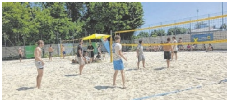
Beste Stimmung und viel sportlicher Ehrgeiz im Waldbad.