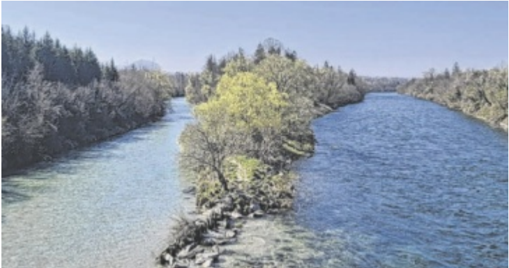
Der Almspitz – Zusammenfluss der Traun mit der Alm

Der Wanderweg lässt sich grundsätzlich in beide Richtungen begehen. Die gewählte Route verläuft von Nord nach Süd. Vom Bahnhof Lambach führt der Weg etwa drei Kilometer entlang der Traun, die gemeinsam mit der Alm einen besonders fotogenen Zusammenfluss, den sogenannten Spitz, bildet. Die Brücke überqueren, dann folgt man der Alm südwärts: zuerst Richtung Bad