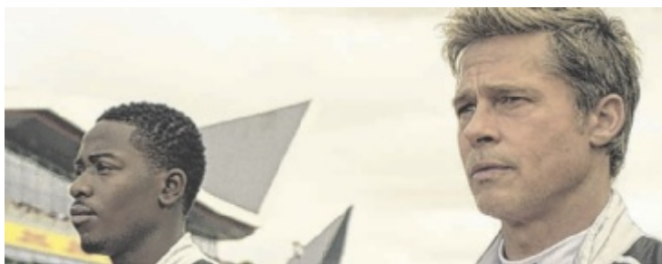
Damson Idris und Brad Pitt sind Kollegen im Team APXGP.