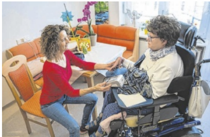
Das neue Flexi-Team sichert bei Assista die Dienstpläne und erhöht dadurch die Arbeitszufriedenheit.

Die Mitarbeiter können sich darauf verlassen, dass die Dienstpläne halten. Bei Krankenständen, Pflegeurlauben und ähnlichem wird das bestehende Personal in den Wohngruppen entlastet und erhält mehr Planungs-