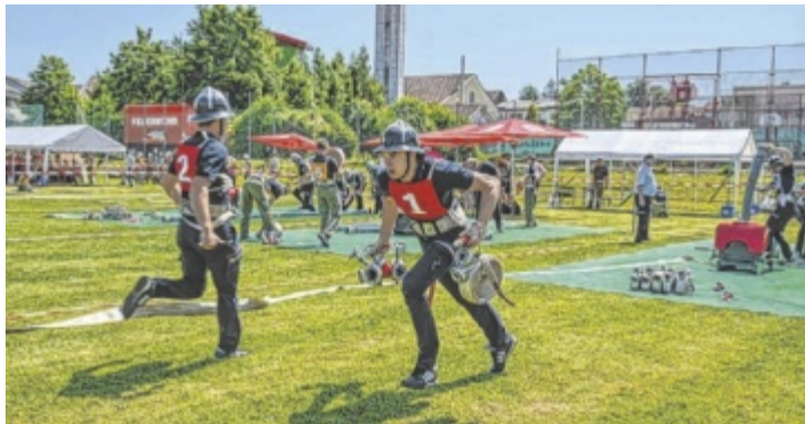
Am Sportplatz der Mittelschule in Waizenkirchen liefen die Feuerwehrler um Pokale.

Beim Bewerb machten sich wieder zahlreiche Zuschauer ein Bild von den Leistungen der Aktiv- und Jugendgruppen und feuerten diese kräftig an. Seitens der Poli-