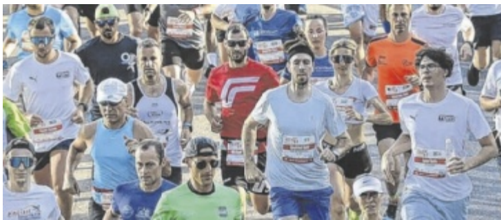
Über 3.600 Aktive waren angemeldet beim Wels Businessrun.