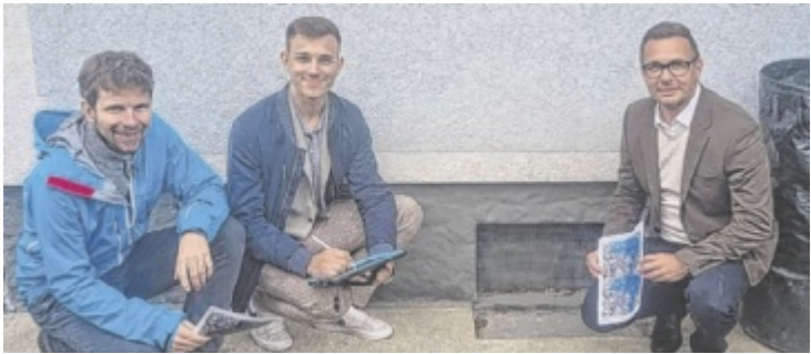
Das LEADER-Projekt „Sicher Zuhause“ soll dabei helfen, für extreme Wetterereignisse bestmöglich gerüstet zu sein.

Mit der richtigen Vorsorge können Schäden oft erheblich reduziert werden. Das gemeindeübergreifende LEADER-Projekt „Sicher Zuhause“ ermöglicht Hochwasserbeziehungsweise Hangwasserschutz-Eigenvorsorge-Beratungen für die Bevölkerung. Dazu besucht ein Experte die Bürger bei sich zu Hause, um ihr Gebäude und Grundstück auf mögliche Gefahren zu überprüfen. Anschließend erhalten sie wertvolle Tipps und individuelle Empfehlungen, wie sie