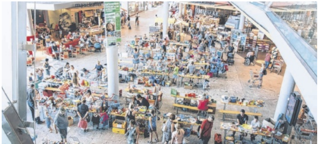
Heuer findet der jährliche Spielzeugflohmarkt am Freitag, 25. Juli statt – ein echtes Highlight im MAX.CENTER.

Ein weiteres Highlight ist der Spielzeugflohmarkt am Freitag, 25. Juli. Dieser ist ein Fixpunkt im Veranstaltungskalender des MAX.CENTER und erfreut sich immer wieder großer Beliebtheit. Alle kleinen Schnäppchenjäger haben hier die Gelegenheit, viele Schätze fürs Kinderzimmer zu entdecken und die jungen Händler dabei zu unterstützen, ihr Taschengeld aufzubessern.