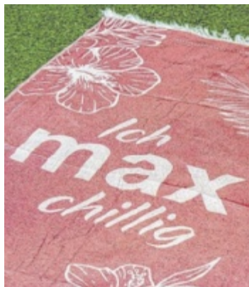
Ein Hamam-Tuch zum Zehner-Kauf

Alle Kinder bis 14 Jahre, die beim Spielzeugflohmarkt dabei sein wollen, können bis Freitag, 18. Juli, einen Tisch beim Besucher-Service oder auf maxcenter.at reservieren. Die Kleinen haben den ganzen Sommer lang auch die Möglichkeit, in der klimatisierten Mall in der Sandkiste zu buddeln, am Tischfußball eine Partie zu wuzeln oder sich an den anderen XXL-Spielen auszutoben.