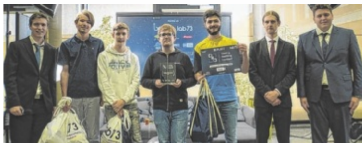
Die Organisatoren und Gewinner des Coding und Hacking Contest.