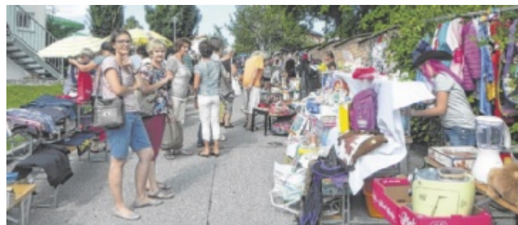
In Wendling findet heuer wieder ein Straßenflohmarkt statt.

Im Anschluss an den Straßenflohmarkt findet der Schleiferkirtag mit großem Vereinsabend beim Sparmarkt Strauß statt. Musikalisch umrahmt wird der Kirtag von DJ Toni. ■