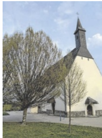
Die Magdalenenbergkirche ist ein Kleinod in Bad Schallerbach. Man kann sie näher erkunden.

„An heißen Tagen ist es drinnen angenehm kühl. Für Taufen, Hochzeiten und Maiandachten ist die Kirche auch ein beliebter Ort.