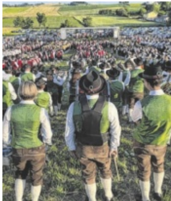
Über 1.000 Blasmusiker beim Festakt beim Bezirksmusikfest

Besonders erfolgreich marschiert sind die Marktmusikkapelle Haag am Hausruck (höchste Punktzahl der gesamten Wer-