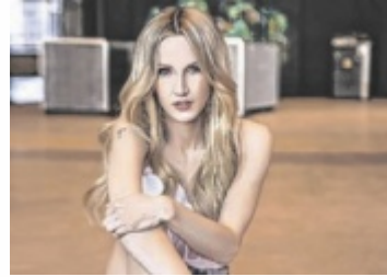
Melissa Naschenweng kommt im August nach Haibach.

Zusätzlich zum Getränkestand des Rotary Clubs Eferding findet vor Ort eine freiwillige Spendensammlung unter den Konzertbesuchern statt. Auch die „Rollenden Engel“ selbst werden anwesend sein und über ihre Arbeit informieren. Diese Aktion findet unabhängig von den auftretenden Künstlern statt. ■