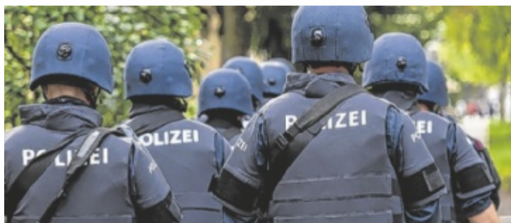
Zuletzt gab es eine ganze Reihe von falschen Bombendrohungen, aber auch Fake-Amoklauf-Ankündigungen.

Ein sehr ernstes Thema und ein ganz klarer Appell, dass das Bundesministerium für Inneres via Social Media teilt. „Wir glauben, dass einigen vielleicht nicht ganz bewusst ist, wie ernst dieses Thema tatsächlich ist. Immer wieder wird irgendwo in Österreich die Polizei alarmiert wegen