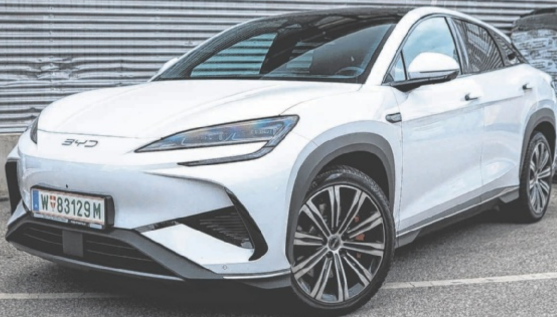
Der BYD Sealion 7 Excellence ist ab 56.490 Euro zu haben.