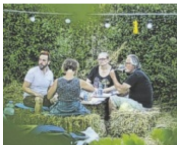
„Live im Weingarten“ besticht durch die einzigartige Atmosphäre.

Zwischen Rebstöcken und Wiesen entsteht eine Bühne mitten im Grünen. Für die musikalische Begleitung sorgt die Band Light it Up, die mit ihrem lässigen Sound für die passende Stimmung sorgt. Der Wein kommt aus der Region: Oberösterreichische Winzer prä-