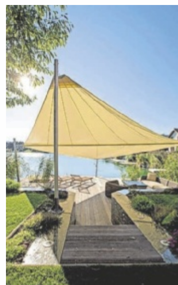
Sonnensegel für den Garten

Mit langjähriger Erfahrung, höchstem Qualitätsanspruch und maßgeschneiderten Lösungen bietet Soliday alles, was es für stilvolle Beschattung im Garten, auf der Terrasse oder im Gastgarten braucht. Ob elektrisch aufrollbares Sonnensegel, flexibles manuelles System oder großflächige Lösungen für den Objektbereich – jedes Projekt wird individuell geplant und realisiert. ■ Anzeige