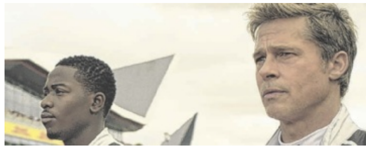
Damson Idris und Brad Pitt sind Kollegen im Team APXGP.