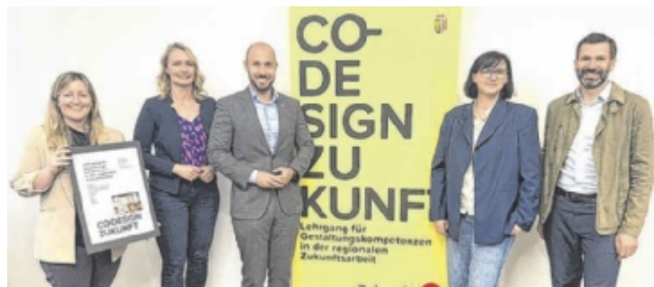
Forum Wels-Eferding bietet einen neuen innovativen Lehrgang an.

Pfarrten oder Studierende. Die Teilnehmer setzen sich in fünf Modulen mit aktuellen gesellschaftlichen Trends und Zukunftsthemen auseinander, entwickeln eigene Praxisprojekte und lernen bewährte Kreativ- und Gestaltungsmethoden kennen. Mehr Infos dazu gibt es unter www.forum-wels-eferding.at/co-design-zukunft ■