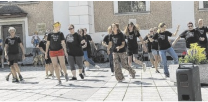
Ein Flashmob am Kirchenplatz