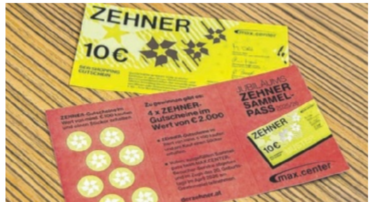
Zehner-Gutscheine kaufen, Sticker sammeln und gewinnen.

Lust auf eine Extraportion Happiness? Die interaktive Ausstellung happy.YOU, die von Montag, 4. bis Samstag, 23. August, im MAX.CENTER Wels gastiert, bietet eine Plattform dafür, das Beste an uns zu entdecken. Die Jagd nach äußerlicher Perfektion und die Be-