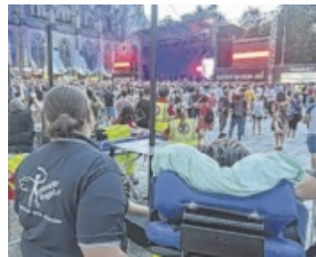
„Rollende Engel“ erfüllen Schwerkranken Herzenswünsche.