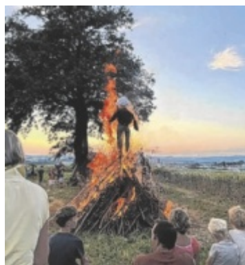
Der Waizenkirchner Alpenverein lädt zum Petersfeuer.