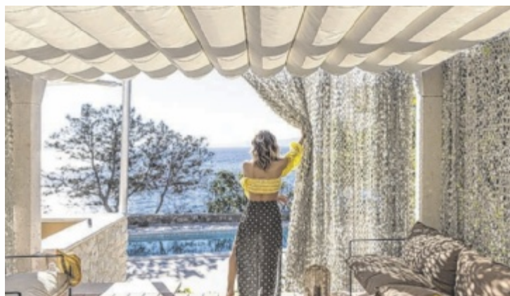
Modernes Design und hochwertige Materialien zeichnen die Soliday-Produkte aus.