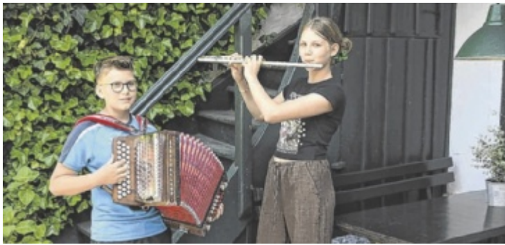
Zum Schulschluss zeigen die Schüler der Landesmusikschule was in diesem Schuljahr erlernt und erprobt wurde.