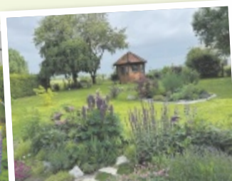
Carina aus Grieskirchen