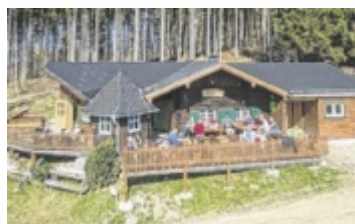
Die Födinger Alm

Tickets für das traditionelle Weyregger Waldfest sind erhältlich über oeticket.com, auf der Waldfest-Webseite www.weyregger-waldfest.at sowie über Instagram. ■