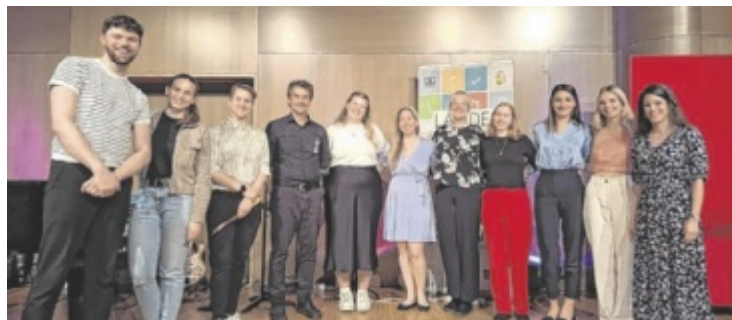
Gesangsschüler zeigten ihr Können

Ziel ist es, die Zusammenarbeit zwischen der österreichischen und der bayerischen dualen Berufsausbildung weiter zu intensivieren und den Austausch von Wissen und Fähigkeiten unter jungen Talenten zu fördern. ■