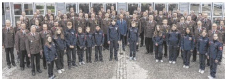
Die FF Regau feiert 160-jähriges Jubiläum.