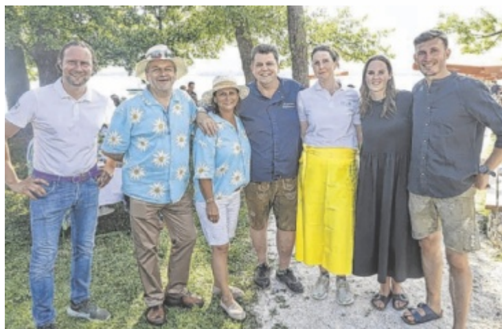
Die Kulinarium Attersee-Wirte laden zum Sommerfest.