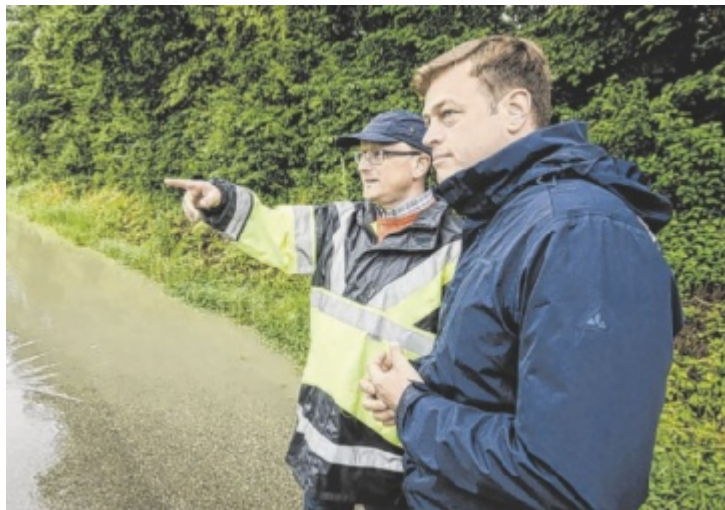
Lokalausgang in St. Georgen

Kernstück des Projekts sind drei Rückhaltebecken mit einem Ge-