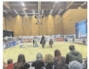
Reitvorführung in der Messehalle