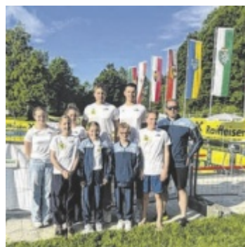
Schwimmer in St. Johann

Am Ende standen nach zwei Wochenenden und drei Bewerben 29 Gold-, 18 Silber- und 11 Bronzemedallien auf dem Konto der SVV-Schwimmer. ■