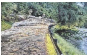
Eine Mure blockierte die Landesstraße Kienbergwand, zahlreiche Keller wurden überflutet.