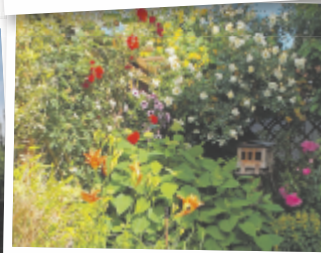
Bernd aus Linz-Land Foto: privat