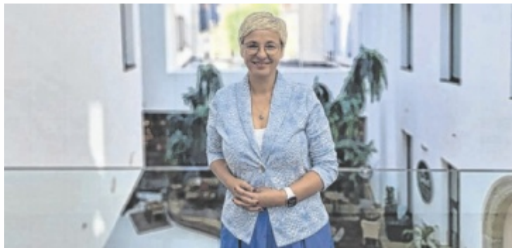
Die wiedergewählte OÖ-Wirtschaftskammerpräsidentin Doris Hummer besuchte für ein Interview die Tips-Redaktion in den Promenadengalerien.

LINZ/OÖ. Bei der konstituierenden Sitzung des oberösterreichischen Wirtschaftsparlaments wurde Doris Hummer für die Periode 2025 bis 2030 erneut zur Präsidentin der WK Oberösterreich gewählt. Im Tips-Interview spricht sie über Chancen und Notwendigkeiten, um die Wettbewerbsfähigkeit des Landes zu stärken.