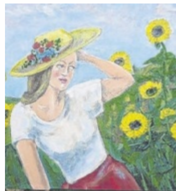
Dame mit Sonnenblumen