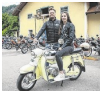
Rast bei der Sternfahrt in Steinbach