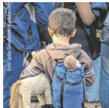
Am Weltflüchtlingstag wird an die Bundesregierung appelliert.

Seebrücke weist auf die unhaltbare Situation in Österreich geborener Babys syrischen Asylberechtigter hin. Aufgrund der Aussetzung der Bearbeitung von Asylanträgen syrischer Staatsbürger:innen erhalten die Eltern für ihre Neugeborenen keine Familienbeihilfe und kein Kinderbetreuungsgeld. Babys werden zur Armutsfalle. Gemeinsam wird bei der Mahnwache an die Bundesregierung appelliert, die offenen Verfahren von Personen aus