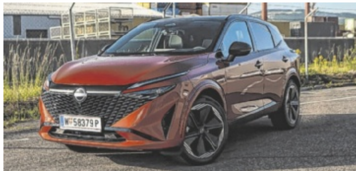
Der neue Nissan Qashqai 1.5 VC-T e-Power N-Design+

Innen zeigt sich Zurückhaltung. Sportsitze und Alu-Pedale? Fehl-