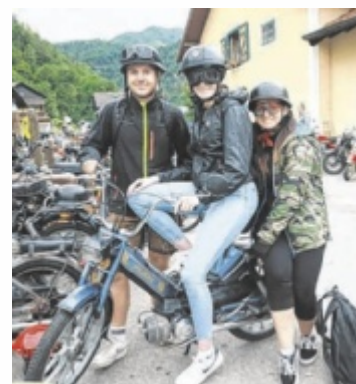
Spaß beim Mopedtreffen am Attersee

über Unterach und Nußdorf wieder zurück zum Ausgangspunkt, wo Livemusik, gute Stimmung und Benzingespräche warteten. Ein Tag voller Nostalgie, Gemeinschaft und dem typischen Knattern der Kultmarke – so präsentierte sich das Puch-Treffen 2025 als Highlight für Liebhaber klassischer Zweiräder. ■