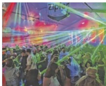
Feiern in Atzbach