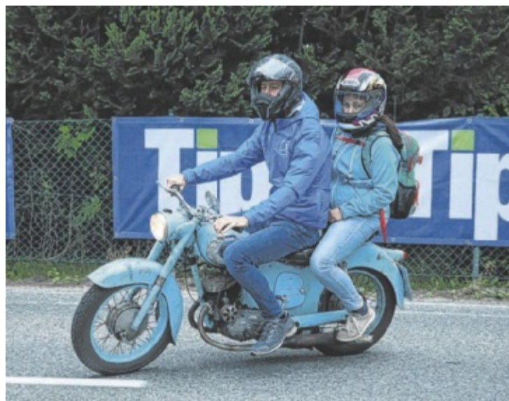
Alle Foto: Tips/H. Klein