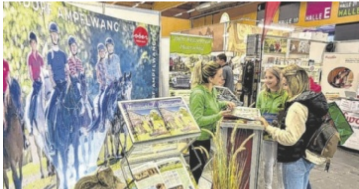
Messestand mit Besuchern

Ein Wochenende, zwei Städte, viele Eindrücke: Der Tourismusverband Hausruckwald nutzte das vergangene Wochenende, um sich gleich an zwei bedeutenden Messestandorten von seiner besten Seite zu zeigen – und das mit großem Erfolg. Während am Wiener Heldenplatz bei der „OÖ Sommerfrische“ kulturelle Highlights im Mittelpunkt standen, glänzte das Reiterdorf Ampflwang bei der Welser Pferdemesse mit sportlicher Kompetenz. In Wien präsentierte sich der Hausruckwald gemeinsam mit dem Würfelspielverein Frankenburg und dem PATRIX-Boutique Hotel. Besonders