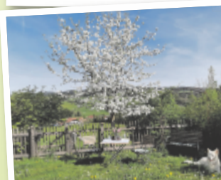
Astrid aus Vöcklabruck