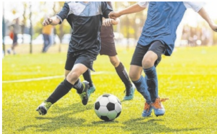
Im Juli findet ein Fußball-Hobbyturnier in Weyregg statt.

Ab 9 Uhr wird beim Hobby-Fußballturnier von videobeweis.media mit vollem Einsatz um Tore, Punkte und Pokale gekämpft – ganz im Zeichen von Teamgeist und Fairplay. Gespielt wird mit maximal zwölf Mannschaften,