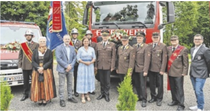
Das neue Tanklösch- und Kommandofahrzeug.