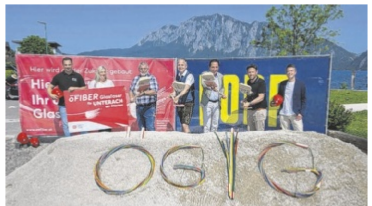
Spatenstich für die Gigabit-Zukunft in Unterach

ermöglicht eine freie Anbieterwahl aus über 20 Internetanbietern. Investiert werden rund 2,2 Millionen Euro. Die Fertigstellung ist bis Frühjahr 2026 geplant. Bei der Umsetzung wird großer Wert auf eine zügige und saubere Bauweise gelegt, um die Anrainer und den Tourismus möglichst wenig zu beeinträchtigen. Die Österreichische Glasfaser Infrastrukturgesellschaft (öGIG) verantwortet die Umsetzung des Projekts. ■