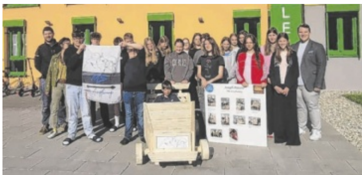
3b-Klasse der MS Ampflwang