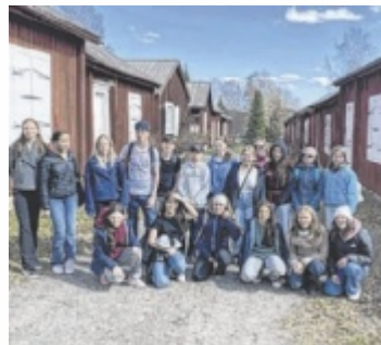
Schülergruppe in Schweden

Neun Schüler nahmen am Austausch mit der Partnerschule in Schweden teil. Die Reise begann mit einem zweitägigen Aufent-