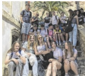
Reise nach Spanien

halt in Stockholm, wo sie das berühmte Vasa-Museum erkundeten und durch die historische Altstadt schlenderten. Anschließend verbrachten sie vier Tage in Boden, wo sie bei Gastfamilien untergebracht waren. Dort tauchten sie in den schwedischen Alltag ein, nahmen am Schulunterricht teil und unternahmen gemeinsam mit ihren Austauschpartnerinnen span-