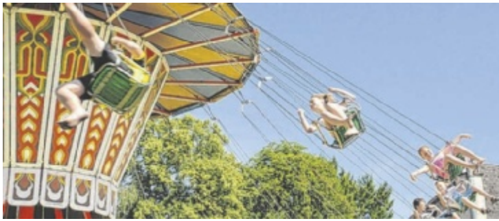
Buntes Programm für Groß und Klein