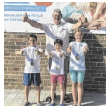
Team in Hengersberg