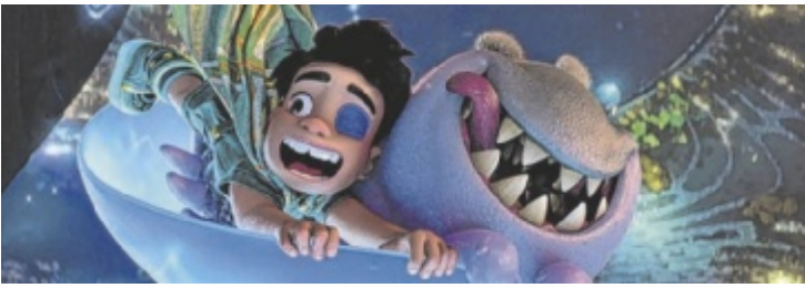
Das neue Disney und Pixar-Abenteuer ist galaktisch gut!