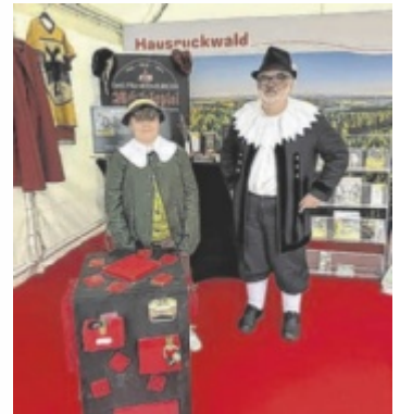
Messestand der OÖ Sommerfrische

sich die Reitbetriebe aus Ampflwang in Wels von ihrer besten Seite. Ob bei Rassepräsentationen oder im Westernturnier – das Reitkompetenzzentrum überzeugte mit Fachwissen, Vielfalt und sportlichen Erfolgen. Am Ende bleibt ein rundum gelungenes Wochenende mit viel positiver Resonanz für die gesamte Region. ■