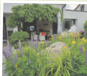
Manuela aus Eferding