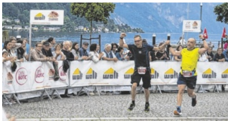
Zieleinlauf in Gmunden nach 21,0975 Kilometern.

Sportlerin springt erst seit zwei Jahren und hat bereits zahlreiche Preise gewonnen. Durch die Aufnahme in den Landeskader des Landesskiverbands Oberösterreich im Mai stehen ihr nun weitere Möglichkeiten für ihre sportliche Entwicklung offen ■