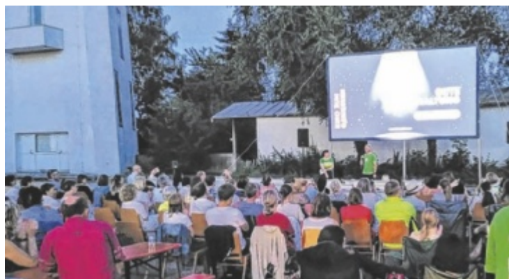
Sommerkino in Lenzing lädt ein