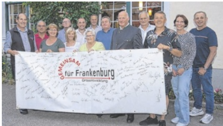
Der neue Vorstand des Vereins