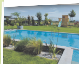
Sarah aus Wels