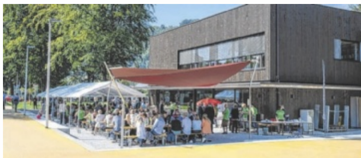
Eröffnungsfeier des neuen SOS-Kinderdorfs im September 2024