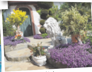
Anneliese aus Grieskirchen

Mitmachen & abstimmen auf tips.at/garten