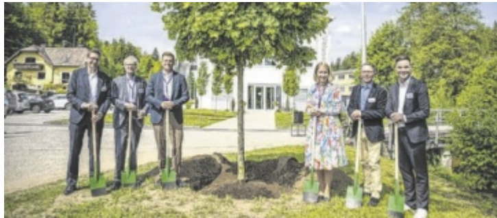
Eröffnung des emissionsfreien Standortes in Zipf

Zipf zählt zu den traditionsreichsten und bedeutendsten Standorten von GE HealthCare weltweit. Über viele Jahrzehnte hinweg hat sich der Standort zu einem international anerkannten Zentrum für Forschung, Entwicklung und Produktion im Bereich der Frauengesundheit entwickelt. Hier entstehen innovative Lösungen für pränatale Diagnostik und Gynäkologie – von tragbaren Ultraschallgeräten bis hin zu hochauflösenden 4D-Sonden und Premiumsys-