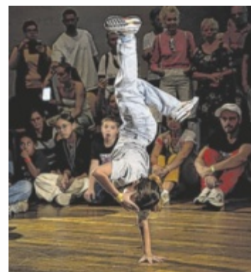
Die „Streetdance Battle Series“ kommt ins OKH Vöcklabruck.

Die „Streetdance Battle Series“ bietet eine einzigartige Plattform für Tanz-Asse der Breaking-Community aller Altersklassen, um sich auf nationaler und internationaler Ebene zu messen. 2025 umfasst die Serie sieben hochkarätige Veranstaltungen in ganz Österreich. Nächster Halt der Tour (Vol. 4) ist am Samstag, 28. Juni im OKH Vöcklabruck, ausgerichtet vom KateRock Verein Vöcklabruck. Angetreten wird in verschiedenen Alterskategorien (B-Girls and B-Boys): Kids bis 12, Jugend bis 18 und Profis ab 16 Jahren. Willkommen sind Tanzsportler, die sich