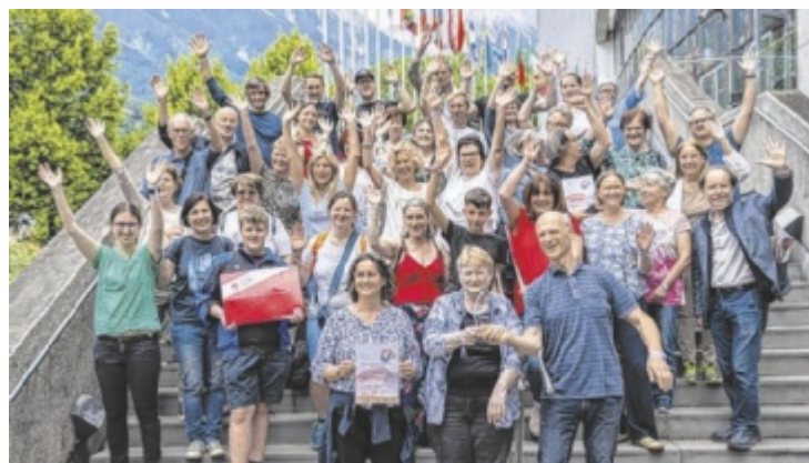
Die Musiker aus Oberösterreich feiern ihren Erfolg.