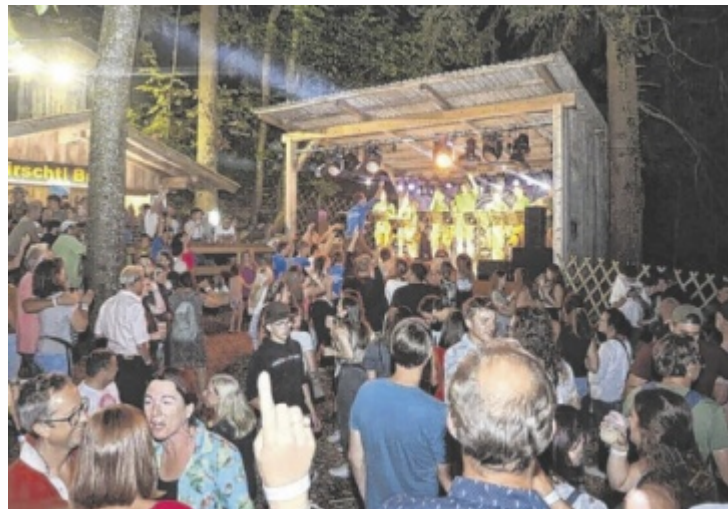
Das Weyregger Waldfest ist weit über die Gemeindegrenzen bekannt

Am Freitag startet das musikalische Programm ab 20 Uhr mit Stüingo und Tribe Time, bevor DJ Sandro Gortez, DJ Mink und das Nautilus Soundsystem für Club-Feeling unter freiem Himmel sorgen. Der Samstag beginnt be-