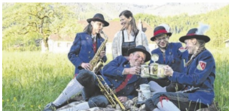
Der MV Reichraming veranstaltet ein Fest am Reichramingbach.