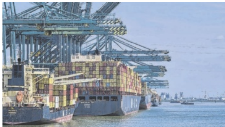
Der Hafen in Antwerpen ist für die heimische Wirtschaft wichtiger Knotenpunkt.