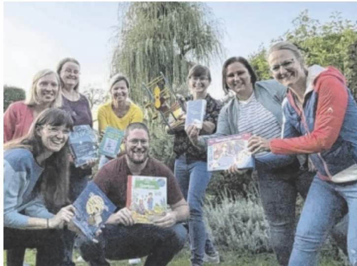
Das Team der Bibliothek Ternberg freut sich auf die Eröffnung.