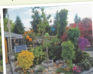
Paula aus Gmunden