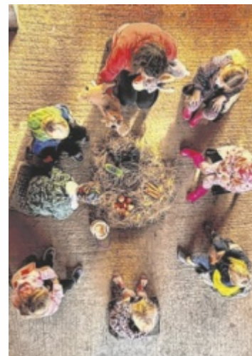
Kindergarten-Verein lädt zu Fest für die ganze Familie.

Seit fünf Jahren ist die Kinderbetreuung am Hardeggerhof (Ramingdorf 2) ein Ort, an dem Kinder frei spielen, lernen und Freundschaften schließen. Nun ist die Einrichtung von der Schließung bedroht. Es fehlen die notwendigen finanziellen Mittel, um den Betrieb weiterzuführen. Der Förderverein lädt daher zum Sonnenfest ein. Es beginnt um 15.30 Uhr. Die Besucher erwartet ein Freilicht-Zirkustheater der Wanderbühne Tarkabarka für Groß und Klein mit poetischer Clownerie und Akrobatik,