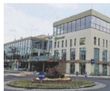
Das Hörakustik-Institut Neuroth ist neu im City Point

STEYR. Mit 1.300 Mitarbeitern an 280 Standorten in acht Ländern gehört Neuroth zu den führenden Hörakustikern in Europa. Seit vielen Jahren ist das 1907 gegründete Unternehmen auch in Steyr präsent, seit 12. Juni am neuen Standort im Einkaufszentrum City Point. Davor war das Hörakustik-Institut von Neuroth am Stadtplatz beheimatet. ■