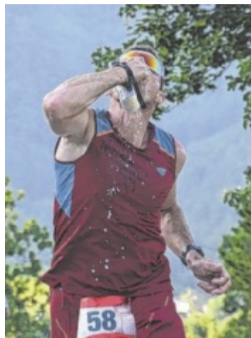
Bei sommerlichen Temperaturen war eine Abkühlung bei der ersten Labstelle willkommen.