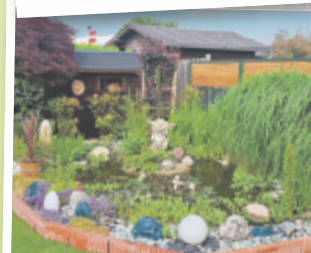
Eveline aus Wels