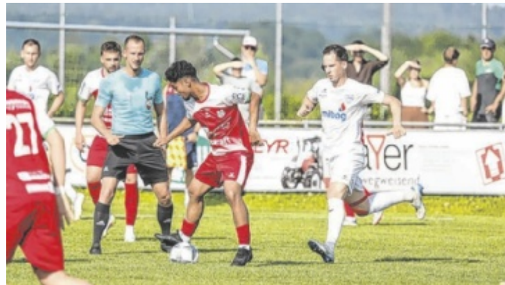
Sierning (in Weiß) gewann das letzte Saisonspiel der 1. Klasse Ost gegen die Vorwärts Juniors mit 2:0.

Zwei Teams aus der Region Steyr durften heuer über einen Meistertitel jubeln. Dietach steigt als Champion der OÖ-Liga in die Regionalliga auf, Schiedlberg kickt als Meister der 1. Klasse Ost künftig in der Bezirksliga. Abgestiegen sind in der aktuellen Spielzeit Vorwärts Steyr (von der