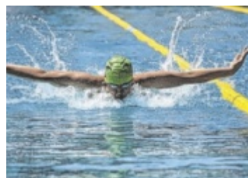
Schwimmen Beim Meeting des SC Steyr in Enns waren 650 Sportler aus 46 Vereinen und vier Nationen dabei. Seite 24

Beim Sommermarkt im Sierninger Schloss sind am 21. und 22. Juni über 80 Kunsthandwerker aus nah und fern vertreten. >> Seite 27