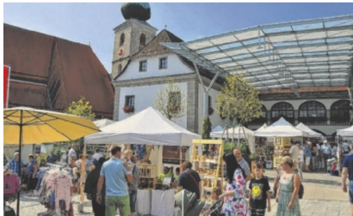
Sierning wird wieder zum Treffpunkt des Kunsthandwerks.

Ein Viertel der Aussteller ist heuer erstmals dabei. Die Besucher entdecken handgefertigten Schmuck, Skulpturen, Textilkunst, Naturprodukte und vieles mehr – gefertigt aus Materialien wie Holz, Glas, Metall, Papier, Leder und Keramik. Neue Techniken bereichern traditionsreiche Arbeiten. Zu den Highlights gehören heuer Kindermode, Bonsais aus Kupferdraht, Goldschmiede-Arbeiten im Schloss, Messer- und Glaskunstwerke im Schlosshof und vieles mehr. Der Markt verteilt sich über das