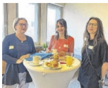
Das Gründer-Frühstück findet in der WKO Steyr statt.

ten Kundenkontakt über die Präsentation der Produkte bis hin zum sicheren Abschluss eines Verkaufsgesprächs. Viele Jugendliche zeigten dabei großes Selbstbewusstsein und echtes Verkaufsgeschick. ■