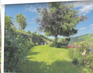
Elisabeth aus Steyr