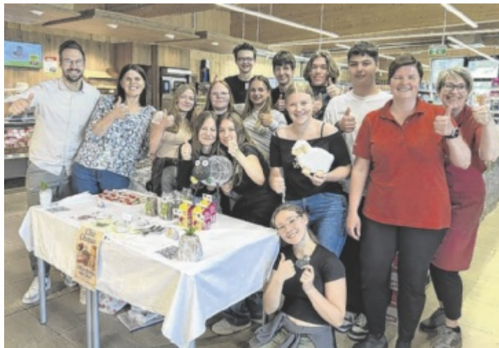
Die Poly-Schüler waren mit Einsatz dabei

Die beiden Fachgruppen Handel und Büro sowie Dienstleistung arbeiteten im Vorfeld intensiv an den Grundlagen erfolgreicher Verkaufs- und Beratungsgespräche. Ziel war es, die theoretischen Inhalte aus dem Unterricht in der Praxis anzuwenden – und genau das gelang eindrucksvoll. In Teams organisierten die Jugendlichen drei Verkaufsstände und boten dort jeweils drei unterschiedliche Produkte aus dem Sortiment von Nah&Frisch an.