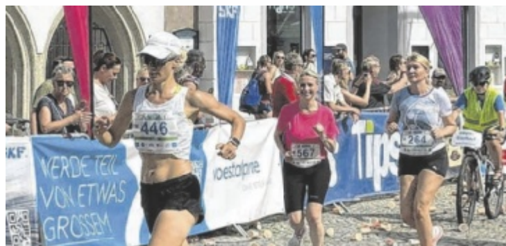
Der Steyrer Stadtlauf findet am Sonntag, 29. Juni, statt.