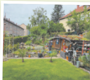
Peter aus Linz