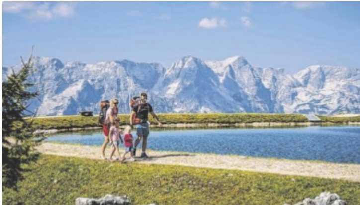
Wanderer genießen das Bergpanorama auf der Höss in Hinterstoder – neue Erlebnisangebote sollen künftig noch mehr Besucher anziehen.

Zehn Millionen Euro werden investiert. Sowohl die Wettbewerbsfähigkeit, als auch die Attraktivität der beiden Bergregionen soll gesteigert werden. Im Mittelpunkt steht die technische Erneuerung bestehender Liftanlagen, die künftig noch energieeffizienter und betriebssicherer