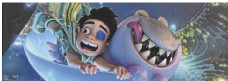
Das neue Disney und Pixar-Abenteuer ist galaktisch gut!