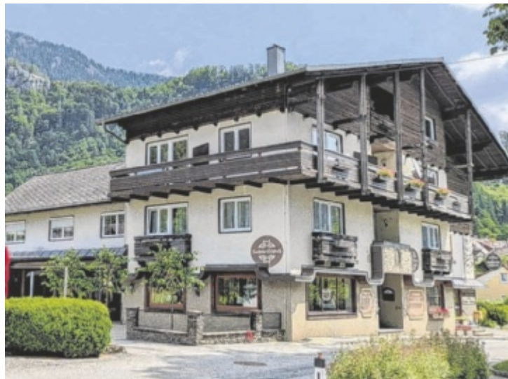
Der Dorfladen Steyrling soll in das nahe gelegene Gasthaus Kaiserin Elisabeth (am Bild) übersiedeln.