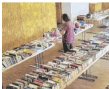
Die Besucher können in entspannter Atmosphäre stöbern.

außerdem ein Ponyreiten, ein Walderlebnisweg, Eis aus der Region sowie Kaffee, Kuchen und vieles mehr. Anmeldung zum Fest und Infos unter www.gartenfeeundwaldkobold.at ■