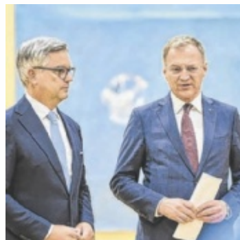
Oberösterreichs Landeshauptmann Thomas Stelzer (r.) mit EU-Kommissar Magnus Brunner

Neben der Budgetdebatte wurde im Gespräch mit EU-Kommissar Magnus Brunner auch die allgemeine Ausrichtung europäischer