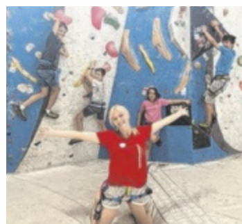
HEY! Feriencamp 2025

Das Programm lässt keine Wünsche offen: Tennis, Scooter, Biken, Klettern, Wildlife-Erlebnisse, Schwimmcamp und ein professionell betreutes Beachvolleyball-Angebot sorgen für jede Menge Action. Kreativköpfe kommen ebenfalls auf ihre Kosten – mit Street Art, Fashion Design, Video Clip Dancing und dem Mal-Atelier. Technikinteressierte können sich beim Roboter Design austoben, und im Movie-