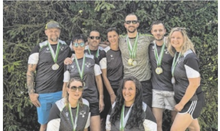
Das Steyrer Masters-Team

an – und das bei Temperaturen, die selbst hartgesottene Wassersportler ins Schwitzen brachten. Doch dank der erstklassigen Organisation durch den Schwimmclub Steyr und dem engagierten Team des Ennsrer Freibads wurde der Event nicht nur ein sportlicher, sondern auch ein logistischer Volltreffer. Der Askö SC Steyr reiste mit 52 topmotivierten Schwimmern an – und kehrte