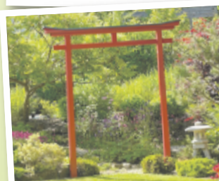
Dagmar aus Kirchdorf