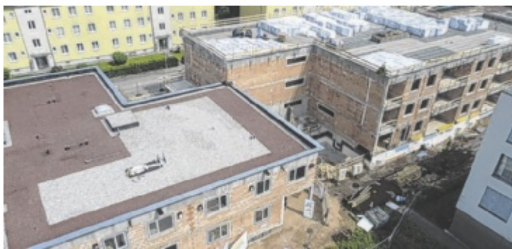
Die Baustelle im Steyrer Stadtteil Tabor von oben mit dem neuen Familienzentrum (Frauenhaus) im Vordergrund.

ten, Westernreiten und Reitpädagogik setzt der Verband auf Bewusstseinsbildung und gegenseitigen Respekt – gegenüber Natur, Tier und Mitmenschen. Ab 2026 sollen zusätzlich Ausbildungsprogramme etwa zur Reitpädagogin oder zum Wanderreitführer angeboten werden. Mit dem Verweis auf die historische Bedeutung des Reitens in der Region – bereits Erzherzog Franz Ferdinand nutzte die Wege – will der Verein auch künftig ein achtsames Miteinander von Mensch, Pferd und Landschaft fördern. ■