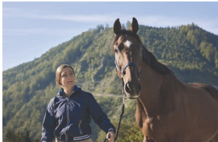
Wanderreiten im Reichraminger Hintergebirge

Die Strecken führen durch das Kremstal, Steyrtal, Ennstal und die Pyhrn-Priel-Region. Ermöglicht wird dieses Angebot durch das Engagement des Reit- und Fahrverbands Pferdland Nationalpark Kalkalpen, dem rund 200 Mitglieder angehören. Der Verein verfolgt das Ziel, ein sicheres und naturverträgliches Reiterlebnis zu schaffen. Voraussetzung für die Nutzung ist eine gültige Reitplakette, die sowohl Versicherungsschutz als auch Wegeerecht sicherstellt. Reiten ist nur auf markierten Wegen oder mit Zustimmung der Grundeigentümer erlaubt. Neben Freizeitangeboten wie geführten Wanderritten,