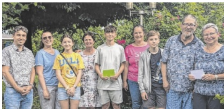
Spendenübergabe an die Lebenshilfe in Gleink.