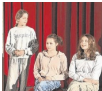
Die Impuls Schule Steyr beim Jugendtheaterfestival in Spittal/Drau.

STEYR. Die Impuls Schule Steyr legt großen Wert auf künstlerisches Arbeiten, auf Selbstbewusstsein ihrer Schüler, auf Kreativität und kritischer Auseinandersetzung. Beim 9. Kärntner Schüler- und Jugendtheaterfestival im Schloss Porcia in Spittal/Drau konnten die Jugendlichen ihr Können zeigen. Sie spielten den „Jasager“ von Berthold Brecht. Dieses Stück wird am Dienstag, 24. Juni, in Steyr noch einmal aufgeführt. Bei der Benefiz-Gala ab 17.30 Uhr in der evangelischen Gemeinde in der Bahnhofstraße 20 kann man zudem künstlerische Werke, die im Lauf des Schuljahres entstanden sind, erwerben. Der Erlös der Veranstaltung kommt Projekten des Umwelt- und Klimaschutzes zugute. ■