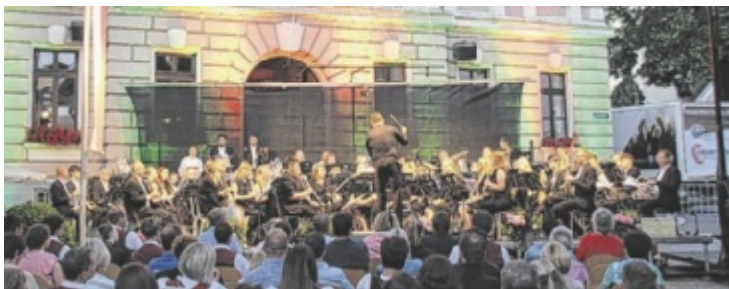
Kirchdorfs Stadtkapelle spielt anlässlich 50 Jahre Markterhebung auf.