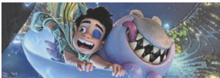
Das neue Disney und Pixar-Abenteuer ist galaktisch gut!