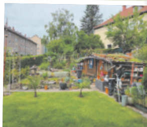
Peter aus Linz