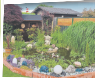
Eveline aus Wels