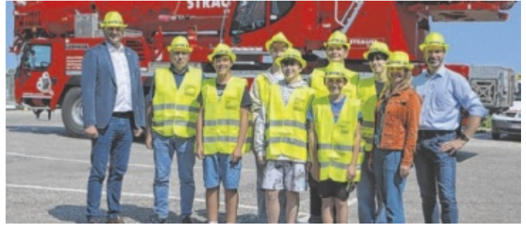
Schüler der Mittelschule Pettenbach bei der Jobrallye