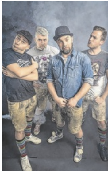
Die Gruppe Volxrock heizt am Samstag im Festzelt ein.

Der Festbetrieb beginnt am Freitag um 19.30 Uhr mit der Segnung des neuen Rüstlöschfahrzeugs und des Kommandofahrzeugs. Anschließend sorgt die Musik-Gruppe „Die Unbrassbaren“ für einen schwungvollen Start ins Jubiläumswochenende. Eintritt frei! Die größte Besuchergruppe gewinnt ein Bierfass. Am Samstagabend bringt die Südtiroler Band „Volxrock“ das Festzelt zum Beben. Einlass ist ab 19 Uhr. Karten sind im Vorverkauf und an der Abendkasse erhältlich. Am Sonntag steht die Kameradschaft in den Feuerwehren im Mittelpunkt. Beim Bezirksbewerb treten rund 600 Teil-