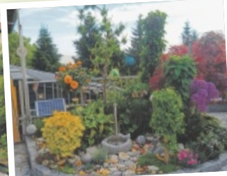
Paula aus Gmunden