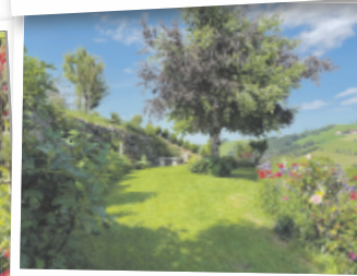
Elisabeth aus Steyr