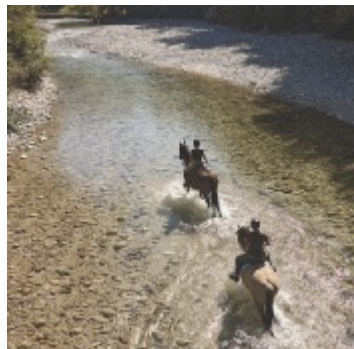
Wanderreiten im Reichraminger Hintergebirge im Nationalpark Kalkalpen

Ermöglicht wird dieses Angebot durch das Engagement des Reit- und Fahrverbands Pferdeland Nationalpark Kalkalpen, dem rund 200 Mitglieder angehören. Der