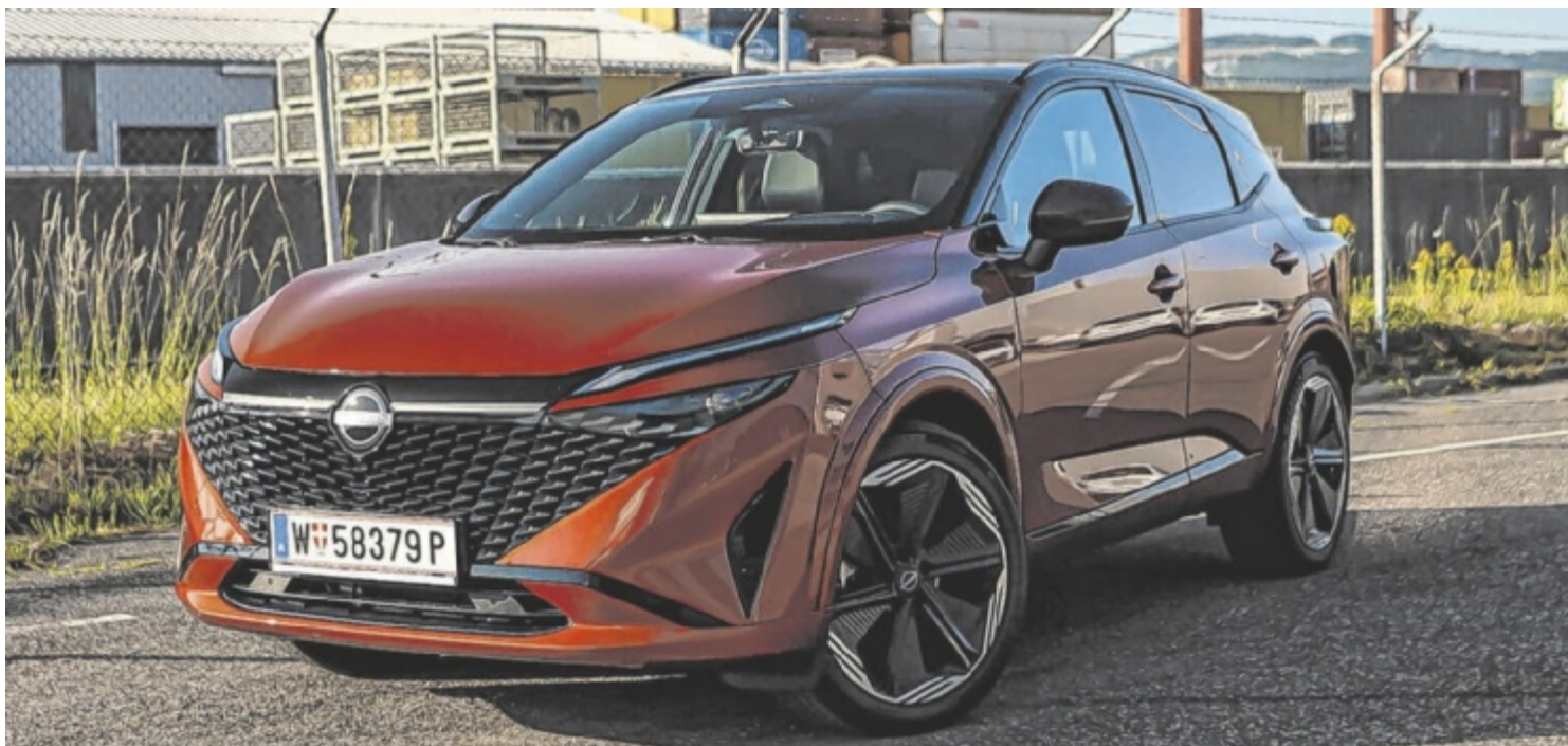
Der Nissan Qashqai 1.5 VC-T e-Power N-Design+ ist ab 48.682 Euro zu haben.