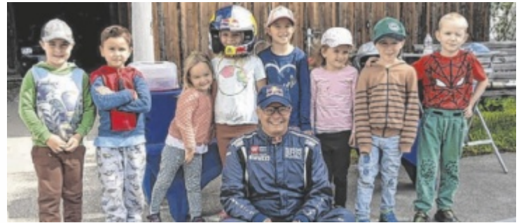
Raimund Baumschlager und die Rennfahrer von morgen

ROSENAU. Großer Tag für kleine Motorsportfans: Eine Gruppe Schulanfänger des Kindergartens Rosenau besuchte Rallye-Ass Raimund Baumschlager bei einem Testtag. Die Kinder durften im Cockpit Platz nehmen, Helme probieren und die spektakulären Drifts hautnah miterleben. Mit dabei waren auch Raimund Baumschlagers Enkelinnen Pauline und Lotta. Pauline als Teil der Schulanfänger-Gruppe, die noch jüngere Lotta durfte beim Besuch ihres Großvaters