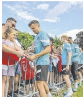
Die österreichische Herren-Nationalmannschaft absolviert heuer erneut ein Trainingslager in Windischgarsten.

Im Fußballsommer 2025 nutzen mehrere internationale Clubs und Nationalteams Oberösterreich als Trainingsstandort. Mit dabei sind unter anderem Crystal Palace aus der Premier League, Galatasaray Istanbul und das österreichische Nationalteam. Als Hotspot für Spitzenteams gilt seit mittlerweile vielen Jahren das „Dilly“ in Windischgarsten, das