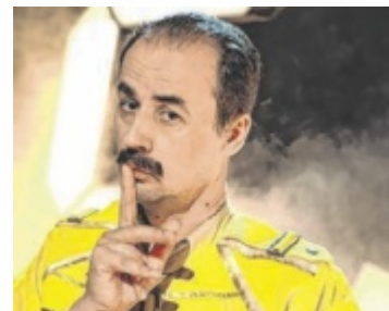
Austrofred tritt im Juli auf.

Er imitiert Rock-Legende Freddy Mercury und bezeichnet sich selbst als Champion: Mit seiner Mischung aus Rock, Austropop und durchgedrehtem Humor bringt der Austrofred die einen zum Headbangen und die anderen zum Kopfschütteln. Am Samstag, 5. Juli, tritt er in der Tischlerei am Schopperplatz auf. Vor und nach seinem Auftritt sorgt der Wiener Szene-DJ „DJ Tabak“ für Stimmung in der Tischlerei: Dieser ist bekannt aus dem Kultlokal „Schmauswaberl“