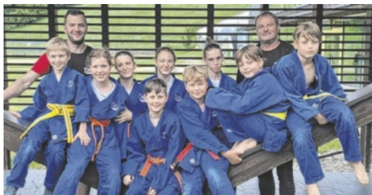
„Judo Union Dynamic One“ war beim Turnier in Straßwalchen stark vertreten.

marathon, bei dem Urbons im Gegensatz zu Erlinger solo antreten wird. Das RACA besteht aus zwei Rennen: dem RACA North-South von 17. bis 21. Juni und dem RACA East to West von 26. bis 30. August. ■