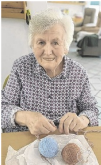
Die Senioren gehen in der Tagesbetreuung verschiedenen Beschäftigungen nach.

Seit 1997 wird das Sozialzentrum in Starhemberg vom Verein Vital geführt. Seit 1999 wird auch eine Tagesbetreuung angeboten. Es kommen Senioren, die noch zuhause leben, aber Unterstützung brauchen oder Gesellschaft suchen. Die Betreuung ist ideal für Menschen mit körperlichen oder demenziellen Einschränkungen und bietet gleichzeitig eine wichtige Entlastung für pflegende Angehörige. Die regelmäßigen Besuche bringen den Senioren Struktur, Abwechslung und soziale Kontakte. Viele Besucher würden sich hier heimelig fühlen, berichtet die