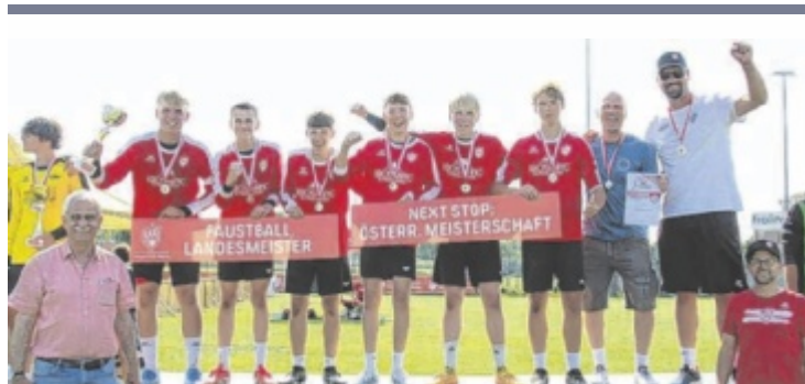
Das U16-Team holte den Landesmeistertitel.