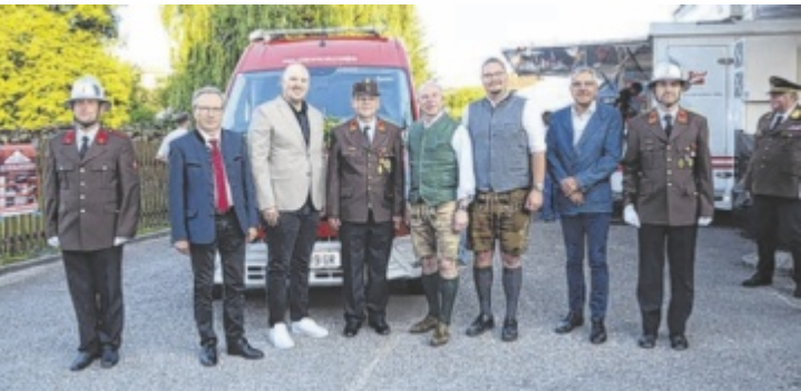
Die Freiwillige Feuerwehr Waizenkirchen feierte mit dem Festakt nicht nur ein Jubiläum, sondern auch die Segnung eines neuen Fahrzeugs.

WAIZENKIRCHEN. Die Freiwillige Feuerwehr Waizenkirchen feierte ihr 150-jähriges Bestehen mit einem Festakt samt Fahrzeugsegnung. 24 Feuerwehren aus der Region waren zu Gast und der Musikverein Waizenkirchen sorgte für die musikalische Umrahmung der Feier. Mehrere Ehrengäste, darunter Landtagspräsident Max Hiegelsberger und Bürgermeister Fabian Grüneis (beide ÖVP), lobten in ihren Ansprachen das ehrenamtliche Engagement der Feuerwehrkameraden aus der Region. ■