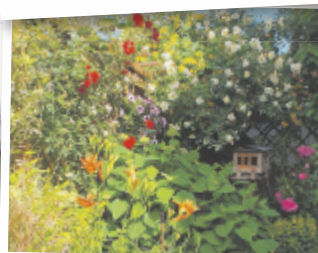
Bernd aus Linz-Land