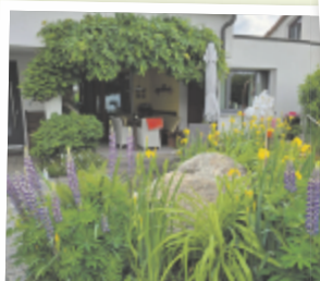
Manuela aus Eferding