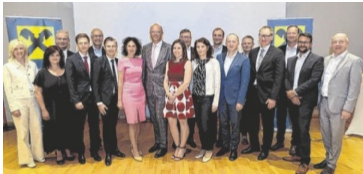
Aufsichtsrat, Funktionäre, Vorstand und Reinhard Schwendtbauer, Generaldirektor der Raiffeisenlandesbank (8v.l.), im Rahmen der Generalversammlung in Grieskirchen.

Die Fusion der Raiffeisenbank Grieskirchen mit der Raiffeisenbank Meggenhofen/Kematen ermöglicht es der Bank ihre Kräfte zu bündeln und noch effizienter zu arbeiten. „Durch die Zusammenführung der beiden Banken können wir unseren Kunden ein erweitertes Leistungsangebot und eine noch bessere Betreuung bieten“, heißt es von Seiten der Bank. Für die Bank, ist das ein Meilenstein in der Geschichte. Bei der Generalversammlung der