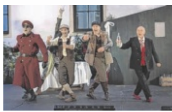
Die Premiere wurde vom Publikum mit viel Applaus gefeiert.

trieben und der öffentlichen Infrastruktur. „Die Klimakrise bringt immer öfter Starkregen und Extremwetterereignisse. Wir müssen daher konsequent vorsorgen, um Menschen, Häuser und Infrastruktur zu schützen – genau das tun wir mit diesem Projekt“, betont der zuständige Umwelt- und Klima-Landesrat Stefan Kainerer (Grüne). ■