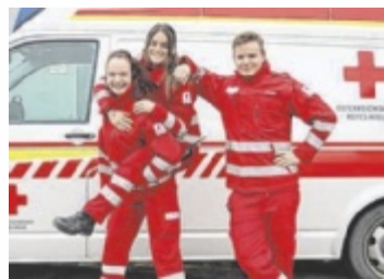
Jetzt Sanitäter werden