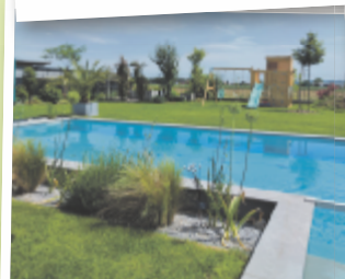
Sarah aus Wels