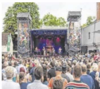
Open-Air-Bühne im Posthof

Den Jedermann als Rockstar holt Schauspielstar Philipp Hochmair mit Jedermann Reloaded 2.0 auf die Bühne, am Samstag, 21. Juni. Spaß für die ganze Familie gibt's am Freitag, 27. Juni, 15.30 Uhr, beim Familienkonzert „Lichterkind live“. Wer es lieber rockig mag, kommt am Samstag, 26. Juli, bei In Extremo auf seine Kosten, nostalgisch wirds sicher mit der britischen Pop-Ikone Bonnie Tyler am Sonntag, 27. Juli. Am Mittwoch, 30.