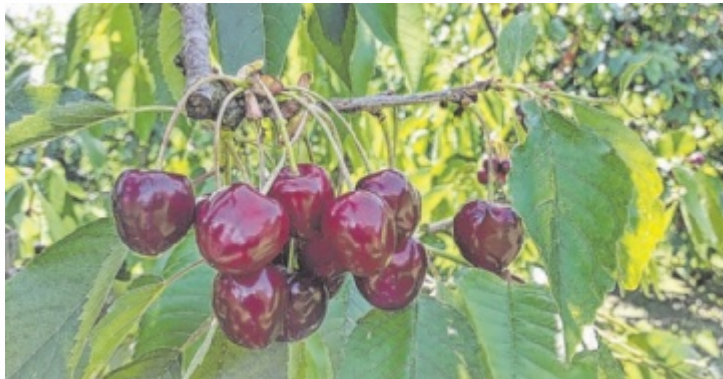
Jetzt kann man sie erntefrisch bekommen.

Die Schartner Kirschen sind mittlerweile zur Marke geworden und weit über Oberöster-