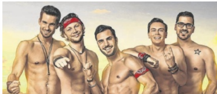
Die Mountain Crew kommt nach Samarein.

Das Feuerwehrfest in St. Marienkirchen startet am Freitag, 27. Juni, um 19 Uhr mit dem Festakt und der Segnung des neuen Kommandofahrzeugs auf dem Marktplatz. Am Samstag, 28. Juni, findet um 11 Uhr am Sportplatz der Bezirksbewerb statt. Die Siegerehrung ist um 18 Uhr beim Feuerwehrhaus. Um 20 Uhr beginnt das sogenannte Lederhosenevent mit der Mountain Crew und DJ Paradox. Die Mountain Crew aus Oberösterreich – das sind fünf Beach Boys in Lederhosen, bei denen Stimmung und Party an oberster Stelle