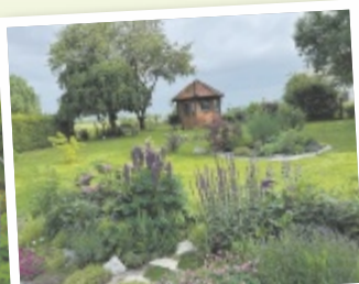
Carina aus Grieskirchen