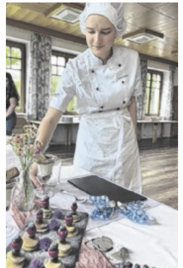
Alles perfekt organisiert.

Ein besonderer Fokus lag auf der Seminarverpflegung. Die Schülerinnen entwickelten ein abwechslungsreiches und gesundes Menü, das den Bedürfnissen der Seminarteilnehmer gerecht wurde. Sie lernten, wie man Einkäufe plant, Lebensmittel lagert und Mahlzeiten zubereitet. Die Kinderbetreuung war ein weiterer wichtiger Aspekt. Die Schülerinnen erarbeiteten ein pädagogisches Konzept, das den Kindern eine sichere und anregende Umgebung bot. Dabei zeigten