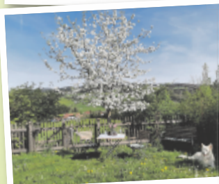
Astrid aus Vöcklabruck