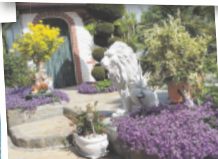
Anneliese aus Grieskirchen

Mitmachen & abstimmen auf tips.at/garten