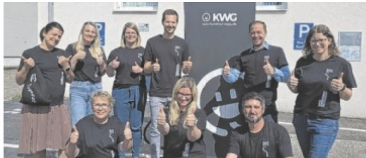
An der diesjährigen Bewegungschallenge nahmen unter anderem eine Firma, eine Schulklasse, aber auch MPS-Betroffene selbst teil.

MPS Austria ist eine gemeinnützige Organisation, die sich der Unterstützung von Familien mit der seltenen Stoffwechselerkrankung MukoPolySaccharidosen (MPS) und ähnlichen Krankheiten widmet. Ziel der Bewegungschallenge war es, Aufmerksamkeit zu schaffen und gleichzeitig Spenden für dringend benötigte Therapien zu sammeln. Dabei konnten die Teilnehmer ihre Bewegungsminuten individuell oder im Team sammeln