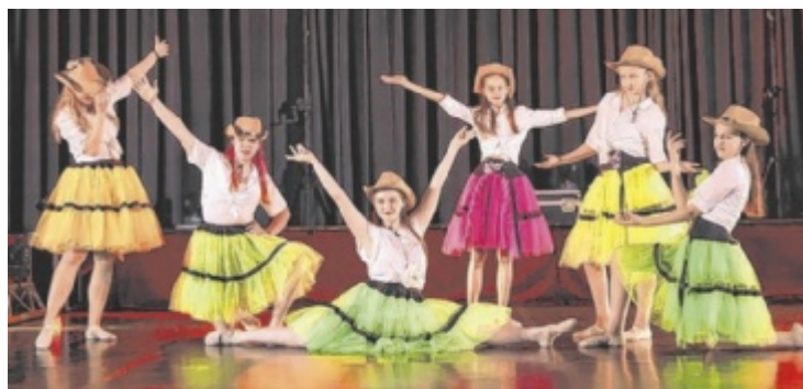
Schüler und Lehrer der Landesmusikschule laden zur Tanzshow.