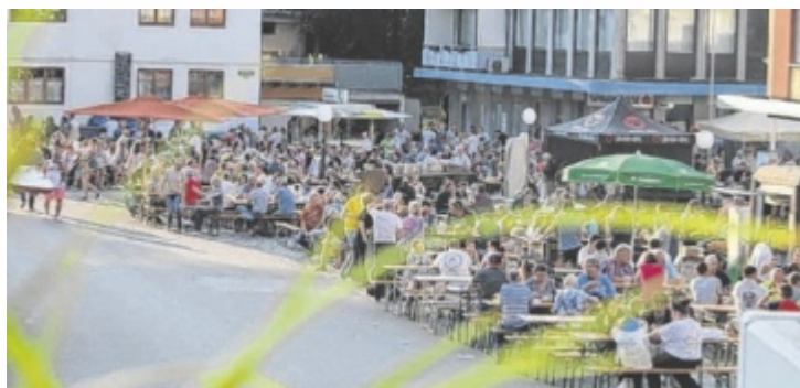
Gemütliches Beisammensein bei der Bummelnacht

man kann auf Ponys reiten, sich beim Asphaltstockschießen oder bei Geschicklichkeitsspielen versuchen oder am Glücksrad drehen. Der Eintritt ist frei. Bei Schlechtwetter entfällt die Veranstaltung (Info-Hotline: 0664 4901091). ■