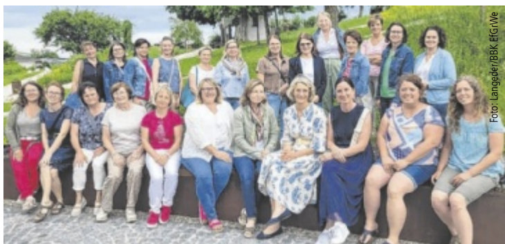
Bäuerinnen aus drei Bezirken nutzten die Gelegenheit, um sich auszutauschen.

Das Treffen bot aber nicht nur erfrischende Genüsse, sondern auch inspirierende Gespräche und neue Kontakte. Die Kombination aus sommerlichem Ambiente, herzlicher Gemeinschaft und wertvollem Austausch machte den Nachmittag zu einem besonderen Erlebnis. ■